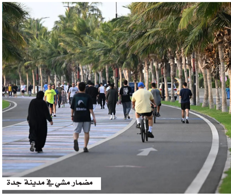
مضمار مشي في مدينة جدة

إحصاءات نسبة الأمان يشعرون بالأمان 97.2% 3 نسبة كبار السن الذين يشعرون بالأمان 94.9% 2 نسبة الإناث اللاتي يشعرون بالأمان 97.0% 1 نسبة السعوديين الذين يشعرون بالأمان ليلاً 97.0%