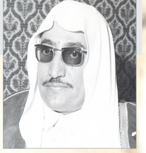
حسن آل الشيخ

تلقينا من السيد (وصل حامد) خطابا مفتوحا لمعالي وزير المعارف يشيد فيه بجهوده وهمته.. ويطلب معاليه باسم مدرسة "خيف الحزامي" إيجاد مبنى جديد للمدرسة اسوة بالمدارس الأخرى.. خاصة وان مبنى المدرسة الحالي يهدد بالانهيار والسقوط بين فينة وأخرى. المحرر .. نحب ان نطمئن السيد - وصل حامد - اننا نلتقي معه في حسن ظنه واشادته بهمة وجهود معالي وزير المعارف ونضم صوتنا معه من اجل إيجاد مبنى لائق لمدرسة خيف الحزامي - اسوة بالمدارس الأخرى.. وانفاذا للطلبة من خطر انهيار المدرسة الحالية على رؤسهم ان صح انها تهدد بالانهيار حقا.