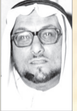
الامير يزيد بن عبدالله بن عبدالرحمن

•• غادر جدة الى الرياض سمو الامير يزيد بن عبدالله بن عبدالرحمن.