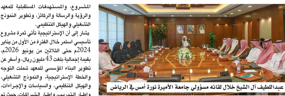
عبداللطيف آل الشيخ خلال لقائه مسؤولي جامعة الأميرة نورة أمس في الرياض

دشن وزير الشؤون الإسلامية والدعوة والإرشاد الشيخ الدكتور عبداللطيف بن عبدالعزيز آل الشيخ أمس (الاثنين)، بحضور رئيسة جامعة الأميرة نورة بنت عبدالرحمن المكلفه الدكتورة فوزية بنت سليمان العمرو، ووكلاء ومسؤولي الوزارة والجامعة، إستراتيجية معهد الأئمة والخطباء بالشراكة مع جامعة الأميرة نورة بنت عبدالرحمن، ممثلة بمعهد التنمية والخدمات الاستشارية بالجامعة، بقيمة 43 مليون ريال، والتي تستهدف في المرحلة الأولى أكثر من 15 ألف إمام وخطيب، وذلك ضمن جهود الوزارة لمواكبة البرنامج الوطني لتعزيز قيم الوسطية والتسامح. ورفع آل الشيخ الشكر والتقدير للقيادة الرشيدة -أيدها الله- على ما توليه من دعم