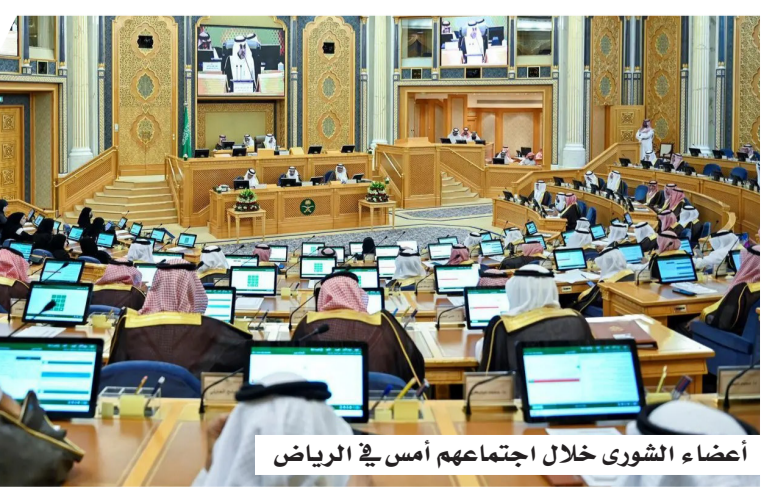
أعضاء الشورى خلال اجتماعهم أمس في الرياض

عقد مجلس الشورى أمس (الاثنين) في الرياض، جلسته العادية التاسعة والثلاثين من أعمال السنة الثانية للدورة التاسعة برئاسة نائب رئيس المجلس الدكتور مشعل بن فهم السلمي، حيث استعرض جدول أعماله واتخذ سلسلة من القرارات والتوصيات المتعلقة بعدد من التقارير السنوية للجهات الحكومية، إلى