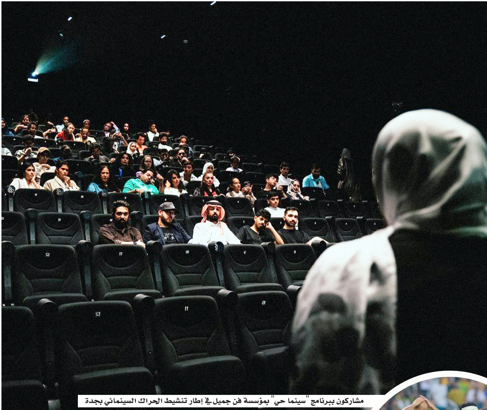
مشاركون ببرنامج "سينما حي" بمؤسسة فن جميل في إطار تنشيط الجرائك السينمائي بجدة