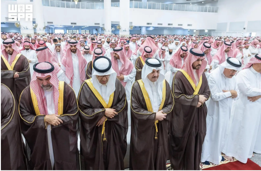
أمير الشرقية ووزير الطاقة يتقدمان المصلين

بالقرب من الجعيمة"، سائلاً الله أن يتغمدهم بواسع رحمته، وأن يلهم ذويهم وأسره الصبر والسلوان. وأكدت الشركة وقوفها إلى جانب أسر الضحايا، وتقديم الدعم والمساندة لهم في هذا المصاب الأليم. وكان مصدر مسؤول في وزارة الطاقة؛ قد أفاد بأن المروحية التابعة لأرامكو السعودية سقطت في محافظة رأس تنورة عند الساعة السادسة من صباح يوم أمس الأول الأحد، ما أدى إلى استشهاد جميع ركابها البالغ عددهم 14 شخصاً، وجميعهم من المواطنين السعوديين.