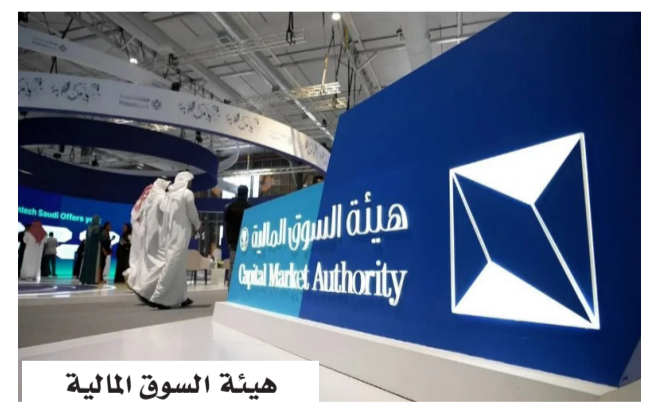
هيئة السوق المالية

المستثمرين خلال فترة المخالفة، حيث تجاوزت تعويضات بعض المستثمرين ستة ملايين ريال. وأكدت أن إنشاء صناديق التعويض يأتي ضمن جهودها لتعزيز حماية المستثمرين ورفع كفاءة آليات التعويض في السوق المالية، موضحة أن هذا الصندوق يعد الرابع من نوعه خلال أقل من 12 شهراً، في إطار تبني أفضل الممارسات العالمية وتعزيز الثقة والعدالة في السوق المالية السعودية.