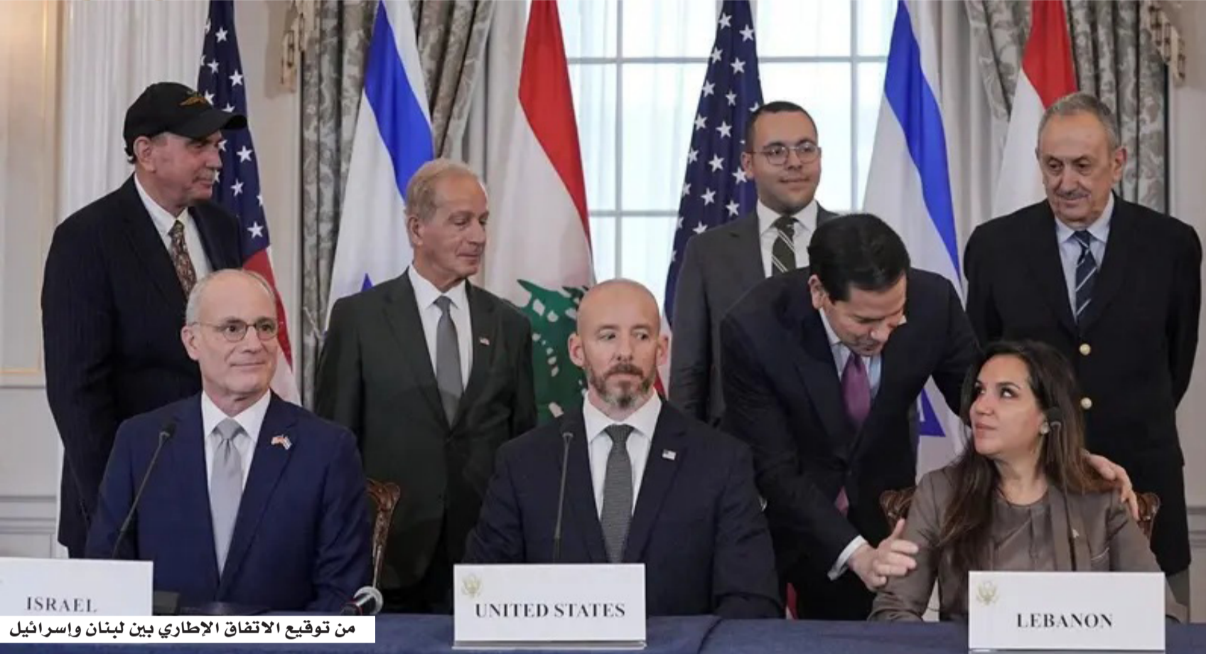
من توقيع الاتفاق الإطاري بين لبنان وإسرائيل

وفي إطار دعم مؤسسات الدولة اللبنانية، أعلن الاتحاد الأوروبي اعتماد حزمة مساعدات بقيمة 100 مليون يورو لصالح القوات المسلحة اللبنانية ضمن "مرفق السلام الأوروبي"، بهدف تعزيز قدرات الجيش ودعم جهود الحكومة