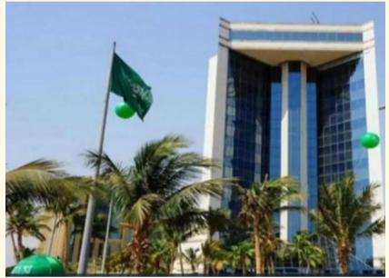
وزارة الصناعة والثروة المعدنية

وأكد المتحدث الرسمي لوزارة الصناعة والثروة المعدنية أهمية خدمة الفسح الكيميائي في تعزيز الناتج الصناعي، من خلال تطوير وتيسير آليات الحصول على فسح للمواد الكيميائية الداخلة في الإنتاج وتحسينها، وأتمنتها ضمن منصة الخدمات الرقمية للقطاع الصناعي، مما يعزز تقديم خدمات رقمية داعمة للمستثمرين الصناعيين.