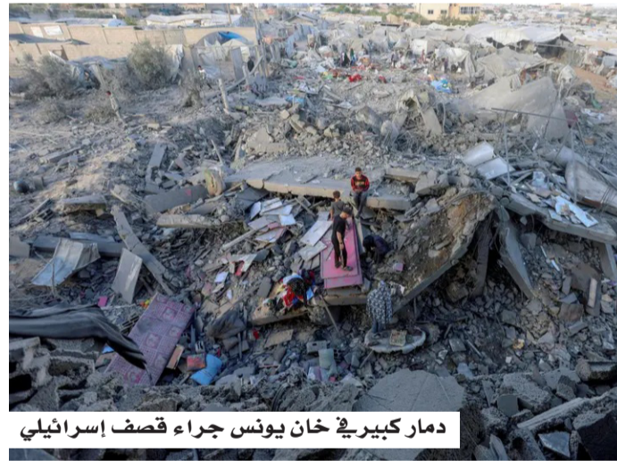
دمار كبير في خان يونس جراء قصف إسرائيلي

وأوضحت التقارير أن هذه التقديرات قدمت الأسبوع الماضي إلى رئيس أركان الجيش الإسرائيلي إبال زامير، في إطار تقييمات أمنية حذرت من تعاضد القدرات العسكرية للحركة في ظل استمرار حالة الجمود السياسي.