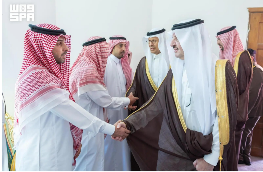
سموه يعزي ذوي الشهداء

بالقرب من الجعيمة"، سائلاً الله أن يتغمدهم بواسع رحمته، وأن يلهم ذويهم وأسره الصبر والسلوان. وأكدت الشركة وقوفها إلى جانب أسر الضحايا، وتقديم الدعم والمساندة لهم في هذا المصاب الأليم. وكان مصدر مسؤول في وزارة الطاقة؛ قد أفاد بأن المروحية التابعة لأرامكو السعودية سقطت في محافظة رأس تنورة عند الساعة السادسة من صباح يوم أمس الأول الأحد، ما أدى إلى استشهاد جميع ركابها البالغ عددهم 14 شخصاً، وجميعهم من المواطنين السعوديين.