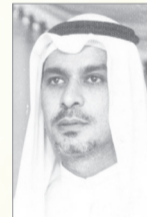
السيد مدني بن حمد

•• وصل يوم امس الى جدة قادما من الرياض السيد مدني بن حمد المفتش العام للجمارك.