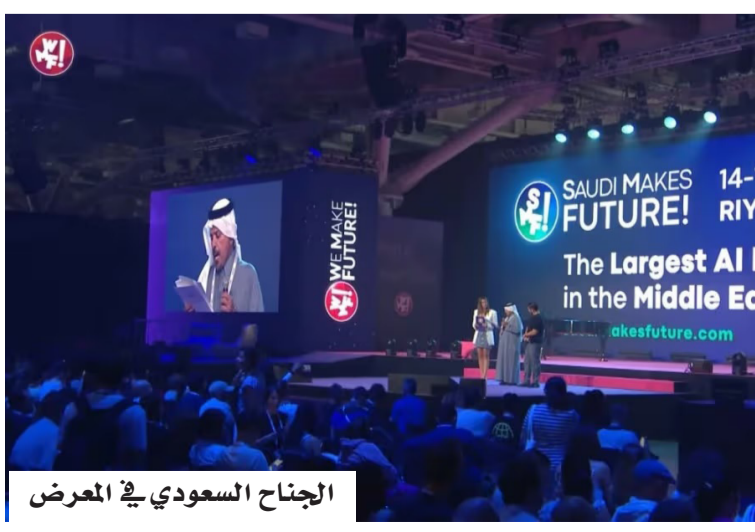
الجنحة السعودي في المعرض

استقطب وفد معرض «السعودية تصنع المستقبل» خلال مشاركته في معرض We Make Future (WMF) بإيطاليا، أكثر من 250 شركة عالمية وأوروبية للمشاركة في معرض الرياض المقرر إقامته خلال ديسمبر المقبل، بحسب بيان. وبعكس ذلك تنامي الاهتمام الدولي بالفرص الاستثمارية والتقنية التي تتيحها السعودية في قطاعات الذكاء الاصطناعي والإبتكار الرقمي والتقنيات المستقبلية. وعقد الوفد سلسلة من اللقاءات مع