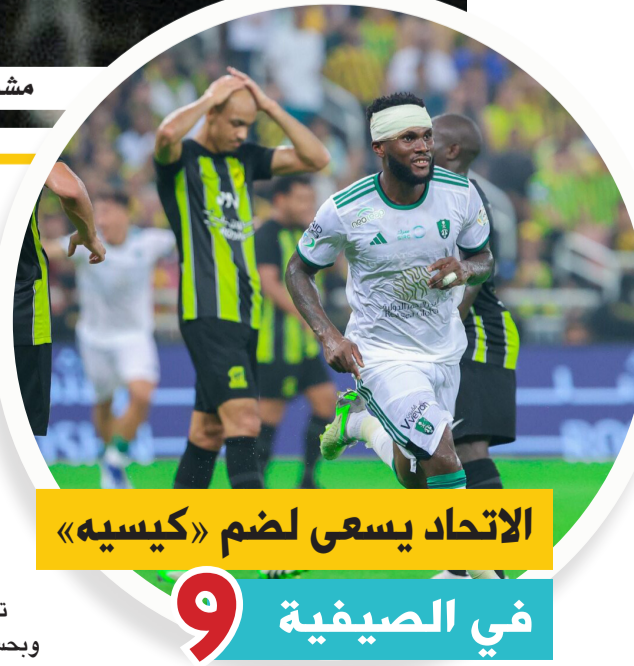
الاتحاد يسعى لضم «كيسيه»

أكدت وزارة الداخلية، أن كل من يُسهّل دخول مخالفي نظام أمن الحدود إلى المملكة العربية السعودية، أو ينقلهم داخلها، أو يوفر لهم المأوى، أو يقدم لهم أي مساعدة أو خدمة بأي شكل من الأشكال، يُعرض نفسه لعقوبات رادعة. وأوضحت الوزارة، أن العقوبات المقررة تشمل السجن مدة تصل إلى 15 عاماً، وغرامة مالية تبلغ مليون ريال، فضلاً عن مصادرة وسيلة النقل والسكن المستخدم للإيواء، والتشهير بمرتكب الجريمة. وقالت: إن هذه الجريمة تصنف ضمن الجرائم الكبيرة الموجبة للتوقيف، والمخلة بالشرف والأمانة، داعية المواطنين والمقيمين إلى الإبلاغ عن مخالفي أنظمة الإقامة والعمل وأمن الحدود، عبر الاتصال بالرقم (911) في مناطق مكة المكرمة والمدينة المنورة والرياض والمنطقة الشرقية، والرقم (999) في بقية مناطق المملكة.