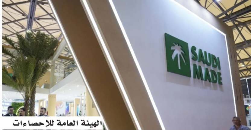
الهيئة العامة للإحصاءات

على صعيد الواردات، سجلت خدمات النقل أعلى قيمة بين واردات الخدمات خلال الربع الأول من عام 2026، بقيمة بلغت 31.8 مليار ريال، وشكل النقل البحري نحو 40.9% من إجمالي واردات النقل، يليه النقل الجوي ثم البري.