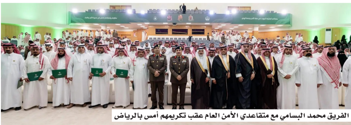
الفريق محمد البسامي مع متقاعدي الأمن العام عقب تكريمهم أمس بالرياض

تحت رعاية صاحب السمو الملكي الأمير عبدالعزيز بن سعود بن نايف بن عبدالعزيز وزير الداخلية، شهد مدير الأمن العام الفريق محمد بن عبدالله البسامي، أمس (الاثنين)، حفل تكريم المتقاعدين من منسوبي الأمن العام، وذلك في مقر المديرية بالرياض. ونقل مدير الأمن العام تحيات سمو وزير الداخلية وتقديره لمنسوبي الأمن العام؛ ممن أحبلوا إلى التقاعد، تقديراً لما بذلوه من جهود مخلصه في أداء مختلف المهام والواجبات، وإسهاماتهم في خدمة الدين، ثم الملك والوطن، وتعزيز أمنه واستقراره. وأكد الفريق البسامي أن هذا التكريم يجسد نهج الوفاء والتقدير لمنسوبي