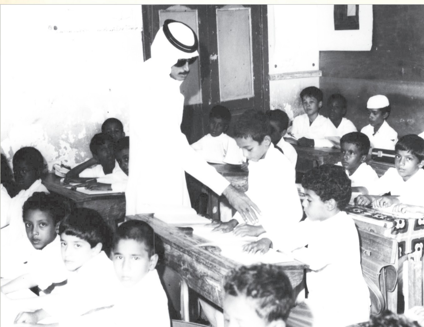
أحد فصل دراسي