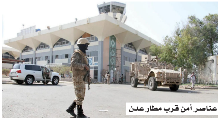
عناصر أمن قرب مطار عدن

وأوضحت شرطة عدن، في مقاطع مصورة، أن التحقيقات أظهرت تسلسلاً دقيقاً لتحركات المتهمين، بدءاً من عملية اختطاف المسؤول التنموي من منطقة إنماء، مروراً بعمليات الرصد والمراقبة، وصولاً إلى مراحل نقل الجثمان وإخفاء الألسنة، بما في ذلك تبديل الملابس واستخدام وسائل نقل مختلفة بهدف