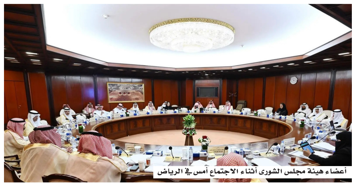
أعضاء هيئة مجلس الشورى أثناء الاجتماع أمس في الرياض

عقدت الهيئة العامة لمجلس الشورى اجتماعها العشرين من أعمال السنة الثانية للدورة التاسعة، برئاسة نائب رئيس المجلس الدكتور مشعل السلمي، بحضور مساعد رئيس المجلس الدكتور حنان الأحمدى، إلى جانب رؤساء اللجان المتخصصة في المجلس؛ وذلك للنظر في الموضوعات المدرجة على جدول أعمالها. ووافقت الهيئة العامة للمجلس على إحالة 34 موضوعاً إلى جدول أعمال جلسات المجلس خلال الفترة المقبلة، شملت العديد