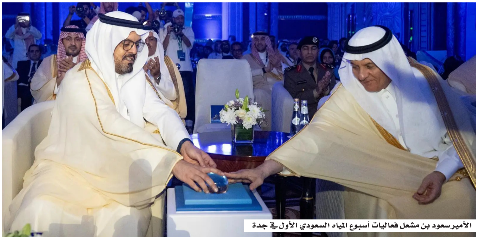
الأمير سعود بن مشعل بن سعود بن عبدالعزيز آل سعود نائب أمير مكة يدشن «أسبوع المياه السعودي» في جدة

ملمس؛ إذ انخفض استهلاك المياه الجوفية غير المتجددة من نحو 21 مليار متر مكعب عام 2016 إلى نحو 11 مليار متر مكعب عام 2025، وارتفعت القدرة الإنتاجية للمياه المحلاة إلى 16 مليون متر مكعب يوميًا، مقارنة بـ 9 ملايين سابقًا، فيما بلغت تغطية مياه الشرب 100%، منها نحو 85% عبر الشبكات، إضافة إلى ارتفاع السعة التخزينية بأكثر من 125%. كما أوضح أن قطاع المياه أصبح أكثر جاذبية للاستثمار عبر نماذج الشراكة مع القطاع الخاص، ما أسهم في استثمارات تجاوزت 60 مليار ريال، وتحسين كفاءة الإنتاج وتقليل التكاليف، مع الانتقال إلى نموذج يوازن بين العرض والطلب والأمن المائي والاستدامة. وأكد أن المملكة نجحت في الحفاظ على استقرار الإمداد رغم التحديات الجيوسياسية، بفضل تنوع مصادر المياه وتطور البنية التشغيلية