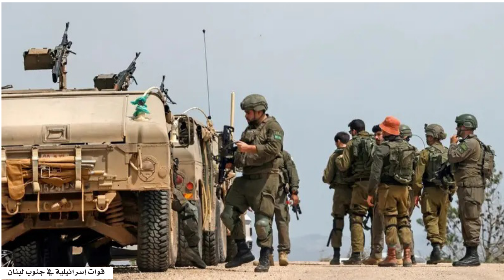
قوات إسرائيلية في جنوب لبنان

وجاءت تصريحات كاتس عقب الجولة الخامسة من المفاوضات اللبنانية الإسرائيلية التي عقدت في واشنطن، وركزت على تثبيت وقف إطلاق النار، وآليات الانسحاب الإسرائيلي