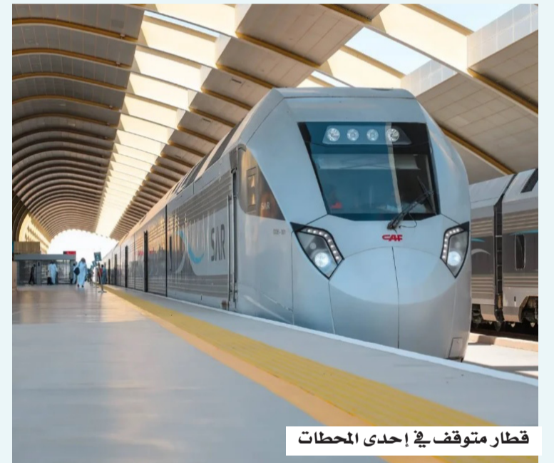
قطار متوقف في إحدى المحطات

السنة الثانية، مع التسجيل في نظام التأمينات الاجتماعية، وتأمين طبي شامل للمتدربين.