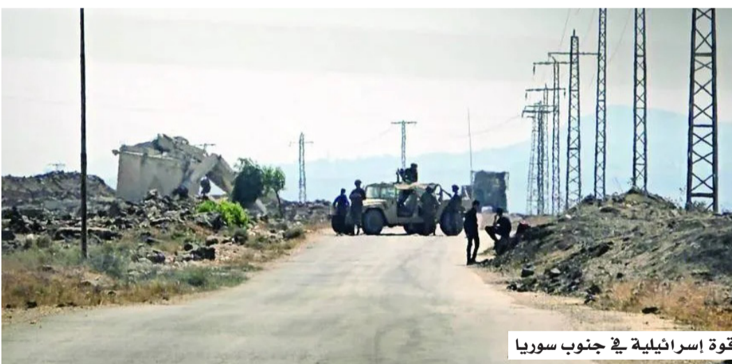
قوة إسرائيلية في جنوب سوريا

يأتي هذا التطور في ظل تصاعد النشاط العسكري الإسرائيلي داخل الجنوب السوري، حيث أفادت تقارير إعلامية؛ بأن الجيش الإسرائيلي يواصل منذ أواخر عام 2024 تنفيذ غارات واعتقالات ومداهمات، إضافة