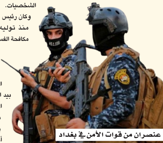
عنصران من قوات الأمن في بغداد

صعدت السلطات العراقية حملتها لمكافحة الفساد، مع توجيه اتهامات إلى 120 شخصاً، بينهم نواب ومسؤولون حكوميون وتجار ورجال أعمال وسامرة، فيما أعلنت اعتقال 47 متهماً، في خطوة تؤكد مضي الحكومة في تنفيذ تعهداتها بملاحقة المتورطين في قضايا الاعتداء على المال العام. وأكدت هيئة النزاهة الانتحائية، في أول تعليق رسمي على حملة الاعتقالات، أنها باشرت تنفيذ مذكرات القبض القضائية الصادرة بحق عدد من المتهمين بالتجاوز على المال العام، مشيرة إلى أن الإجراءات جاءت ثمرة للتنسيق والتكامل بين السلطات القضائية والتنفيذية والتشريعية، إلى جانب الجهود الرقابية التي بذلتها الهيئة على مدى فترة من المتابعة والتدقيق. وشددت الهيئة