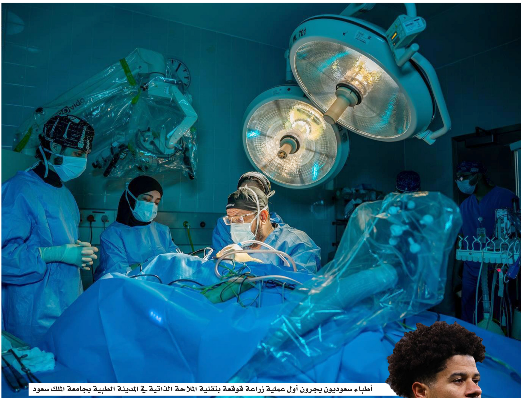
أطباء سعوديون يجرون أول عملية زراعة قوقعة بتقنية الملاحة الذاتية في المدينة الطبية بجامعة الملك سعود