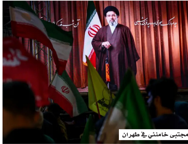
مجتبي خامنئي في طهران

وأكد خامنئي، في رسالة وجهها بمناسبة "أسبوع السلطة القضائية" في إيران، أمس (الأحد)، ضرورة ملاحقة من وصفهم بـ"المجرمين"، وإنزال العقوبات بحقهم، معتبراً أن التصريحات الصادرة عن مسؤولين أميركيين وإسرائيليين، والتي تضمنت اعترافاً أو تفاخراً بالعمليات العسكرية، تمثل إقراراً صريحاً بالمسؤولية عن تلك الهجمات. وشدد المرشد الإيراني على أهمية متابعة المسؤولين عن مقتل ضحايا الحرب الأخيرة،