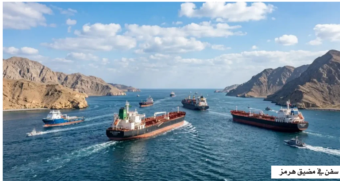
سفن في مضيق هرمز

وجاءت تصريحات عراقجي خلال زيارة أجراها إلى بغداد، حيث دعا إلى وضع إطار عمل جديد