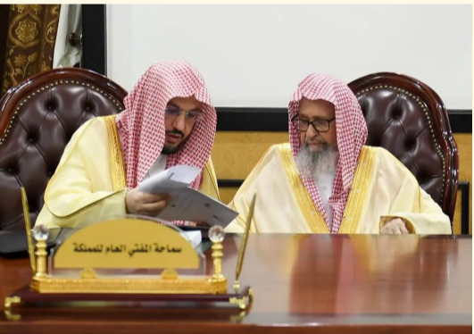
صالح الفوزان أثناء مباشرته الأعمال في الطائف

على أعمال الرئاسة العامة للبحوث العلمية والإفتاء، ورأس اجتماعات اللجنة الدائمة للفتوى، التي تواصل دراسة المسائل الشرعية والموضوعات المحالة إليها، وإصدار الفتاوى وفق المنهج الشرعي، بما يحقق رسالة الرئاسة في بيان الأحكام الشرعية وخدمة المستفتين، وتواصل الرئاسة العامة للبحوث العلمية والإفتاء خلال فترة عملها الصيفية في محافظة الطائف تقديم خدماتها الإفتائية والبحثية، وإنجاز المعاملات، بما يضمن استمرار أداء مهامها الشرعية والعلمية بكفاءة وجودة.