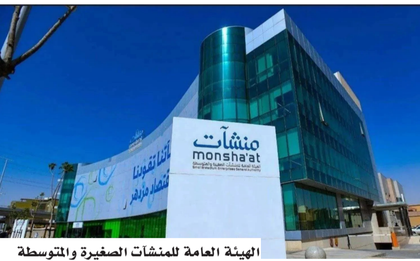
الهيئة العامة للمنشآت الصغيرة والمتوسطة

وتستمر فترة التسجيل حتى نهاية عام 2026، على أن تمتد أعمال صرف المبالغ المستحقة للمنشآت المؤهلة حتى عام 2028، وفق جدولة الدفعات والضوابط المعتمدة. وأوضحت الهيئة أن المبادرة تُمكن المنشآت الصغيرة والمتوسطة المؤهلة من استرداد عدد من الرسوم الحكومية وفق الضوابط والمعايير المعتمدة، من بينها رسوم السجل التجاري، وتراخيص الأنشطة الاقتصادية، واشتراكات الغرف التجارية، واشتراكات البريد السعودي، ورسوم تسجيل براءات الاختراع، إضافة إلى استرداد ما يصل إلى 80% من المقابل المالي للعامل الأجنبي. وتأتي مبادرة "استرداد" ضمن