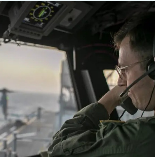
من العمليات العسكرية الأميركية في إيران

ضربات جديدة، وفي المقابل، أفادت وسائل إعلام إيرانية بوقوع انفجارات في جزيرة قشم، إلى جانب إصابة برج اتصالات في منطقة سيريك، بينما أعلن الحرس الثوري الإيراني تنفيذ هجمات استهدفت مواقع أميركية في الخليج، مؤكداً أنها جاءت رداً على الضربات الأميركية الأخيرة. كما أشارت تقارير إلى تعرض ناقلة نفط أخرى للاستهداف أثناء عبورها مضيق هرمز، في مؤشر على استمرار التوتر في أحد أهم