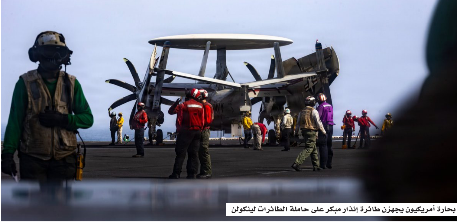
بحارة أمريكيون يجهز طائرة إنداز مبكر على حاملة الطائرات لينكولن

وتأتي هذه التطورات بعد نحو أسبوع من جولة محادثات غير مباشرة استضافتها سويسرا، شارك فيها نائب الرئيس الأميركي جيه دي فانس، ورئيس البرلمان الإيراني محمد باقر قاليباف، وأسفرت عن تخفيف جزئي للعقوبات الأميركية وفتح مسار تفاوضي لمعالجة ملفات رفع العقوبات، والأموال الإيرانية المجمدة، ومضيق هرمز، والبرنامج النووي. إلا أن استئناف الضربات العسكرية وتبادل الاتهامات بخرق منكرة التفاهم ألقى بظلاله على مستقبل تلك المفاوضات، وسط مخاوف من انهيارها واتساع رقعة المواجهة في المنطقة.