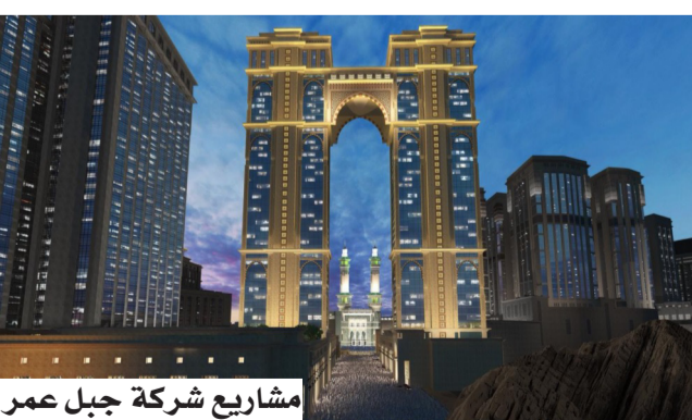
مشروع شركة جبل عمر

الحد من الاستثمارات الرأسمالية المطلوبة لتطوير المرحلة المذكورة، وتمتلك شركة جبل عمر محفظة عقارية قائمة تضم أكثر من 6500 غرفة وجناح فندقية، من المتوقع أن تصل إلى 7700 غرفة وجناح، باكتمال الأجزاء المتبقية من المرحلة الرابعة