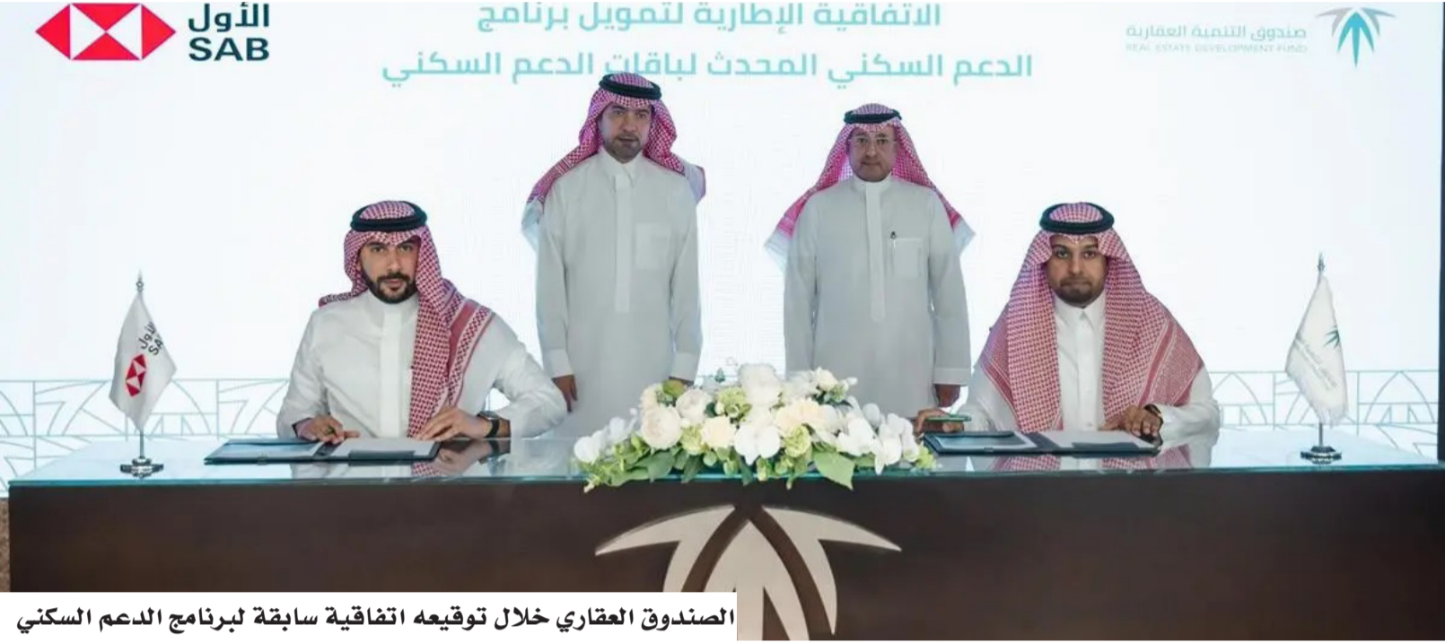
الصفحة الأولى: الصندوق العقاري خلال توقيع اتفاقية سابقة لبرنامج الدعم السكني

ويتم صندوق التنمية العقارية خدمات الدعم السكني، عبر البوابة الإلكترونية للصندوق، إضافة إلى خدمة "المستشار العقاري" التي تمكن المستفيدين من بناء مسارات دعمهم، وفق أفضل التوصيات التمويلية والسكنية. وتمكن الصندوق العقاري منذ تأسيسه عام 1974م أكثر من 1.800.000 أسرة من الحصول على مسكنهم الأول، وأسهم برفع نسبة التملك للمواطنين إلى 66,24%، ويواصل الصندوق أداء دوره الريادي في تمكين الأسر من تملك المساكن المناسبة، من خلال تطوير حلول تمويلية مبتكرة بالتعاون مع الجهات التمويلية والمطورين العقاريين؛ بما يسهم في تسهيل رحلة التملك وتوسيع نطاق الخيارات التمويلية والسكنية الملائمة لاحتياجات المستفيدين.