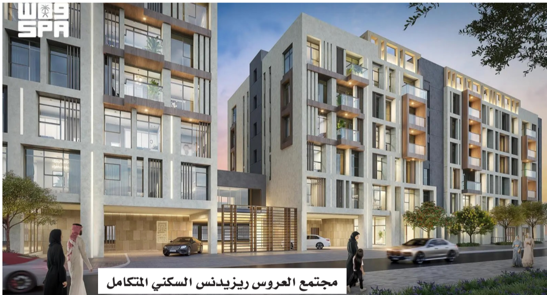
مجتمع العروس ريزيدنس السكني المتكامل

الملك عبدالله الرياضية. ويقدم الطرح الجديد من الشقق نموذجاً متطوراً للمجمعات السكنية العصرية المغلقة، التي تمنح سكانها خصوصية متكاملة وتفرداً يعكس التزام مجموعة روشن بتوفير تجارب معيشية تناسب مختلف الشرائح وتعزز جودة الحياة وتلبي تطلعات عملائها.