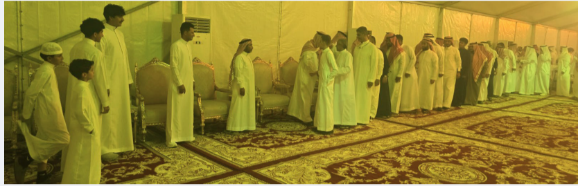
جانب من المعزين

البلاد (جدة) تلقت أسرة آل المصباحي تعازي ومواساة عدد من الأمراء والمسؤولين والوجهاء ورجال الأعمال والإعلاميين، في وفاة رجل الأعمال إبراهيم بن حسن محمد المصباحي، الذي وافته المنية إثر مرض ألم بها مؤخرًا، ووري جثمانه في مقابر