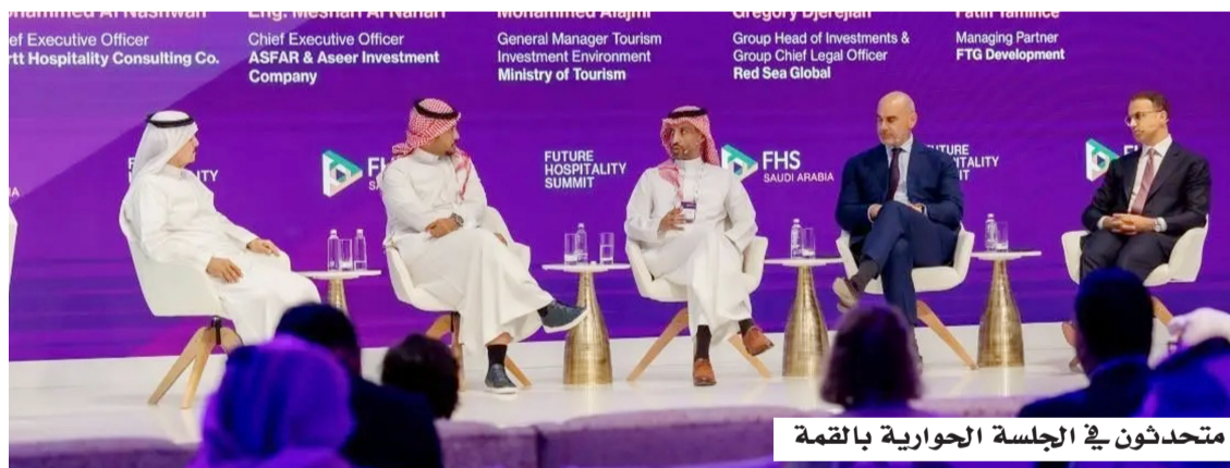
متحدثون في الجلسة الحوارية بالقمة

العالمية لحة تعريفية عن برامجها وحوافزها النوعية التي تهدف إلى تسهيل الاستثمار في القطاع السياحي، أبرزها برنامج إمكانات الاستثمار في القطاع السياحي، ومبادرة إمكانات الاستثمار في قطاع الضيافة. كما أطلقت الوزارة خلال القمة تقرير الاستثمارات العالمية في السياحة السعودية، الذي يستعرض أبرز مؤشرات النمو في القطاع، وتوسع الاستثمارات والعلامات العالمية في السوق السعودية، والعالمية لحة تعريفية عن برامجها وحوافزها النوعية التي تهدف إلى تسهيل الاستثمار في القطاع السياحي، أبرزها برنامج إمكانات الاستثمار في القطاع السياحي، ومبادرة إمكانات الاستثمار في قطاع الضيافة. كما أطلقت الوزارة خلال القمة تقرير الاستثمارات العالمية في السياحة السعودية، الذي يستعرض أبرز مؤشرات النمو في القطاع، وتوسع الاستثمارات والعلامات العالمية في السوق السعودية،