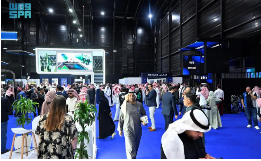
.. نسخة سابقة من المعرض