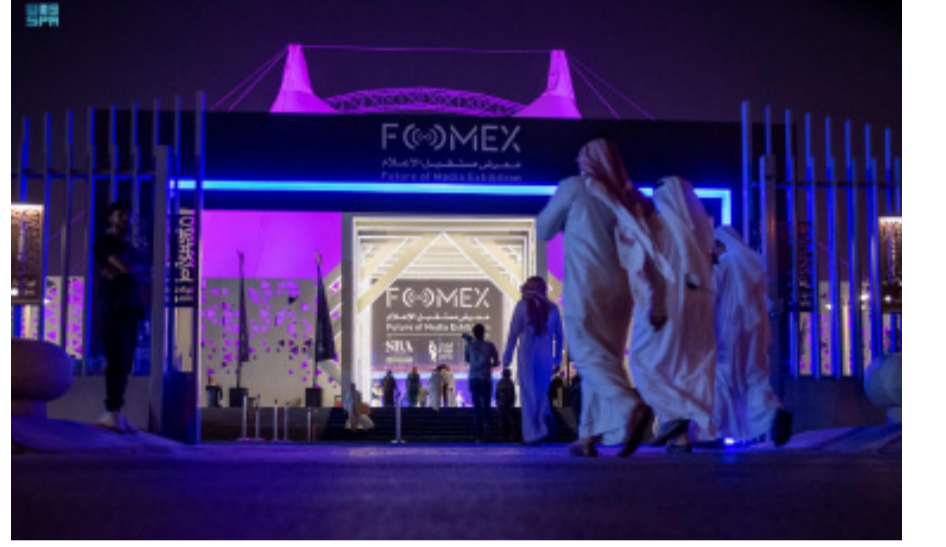
نسخة سابقة من معرض مستقبل الإعلام

ومن المتوقع أن تستقطب نسخة 2027 حضوراً واسعاً من الخبراء والمتخصصين، مع مشاركة شركات عالمية في الإعلام الرقمي والذكاء الاصطناعي وتقنيات البث والإنتاج، إلى جانب إطلاقات تقنية وشراكات جديدة تسهم في رسم ملامح مستقبل الإعلام، وترسخ موقع الرياض مركزاً إقليمياً لابنتار الإعلامي.