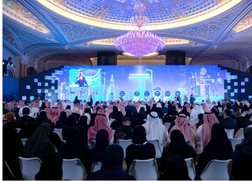
مشاركون في مؤتمر للأمن السيبراني "أرشيفية"