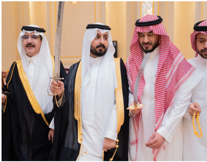
.. ويؤدي العريضة مع والد العروس والأقارب