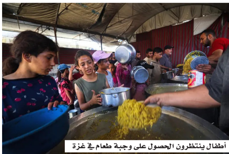
أطفال ينتظرون الحصول على وجبة طعام في غزة

وأكد التقرير أن حجم الخسائر البشرية في صفوف الأطفال يُعد من بين الأعلى في النزاعات المعاصرة، لافتاً إلى أن الأدلة والشهادات التي جمعتها اللجنة تشير إلى وقوع انتهاكات خطيرة للقانون الدولي الإنساني وقانون حقوق الإنسان. وقال رئيس اللجنة سرينيفاسان موراليدهار: