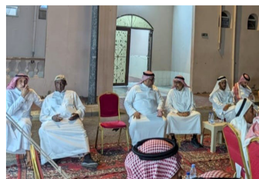
أعمام وأشقاء الفقيد في مجلس العزاء