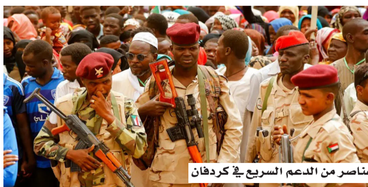
عناصر من الدعم السريع في كردفان

وعزا القيادي المنشق قراره إلى ما وصفه بغياب الهدف من الحرب وانتشار الممارسات