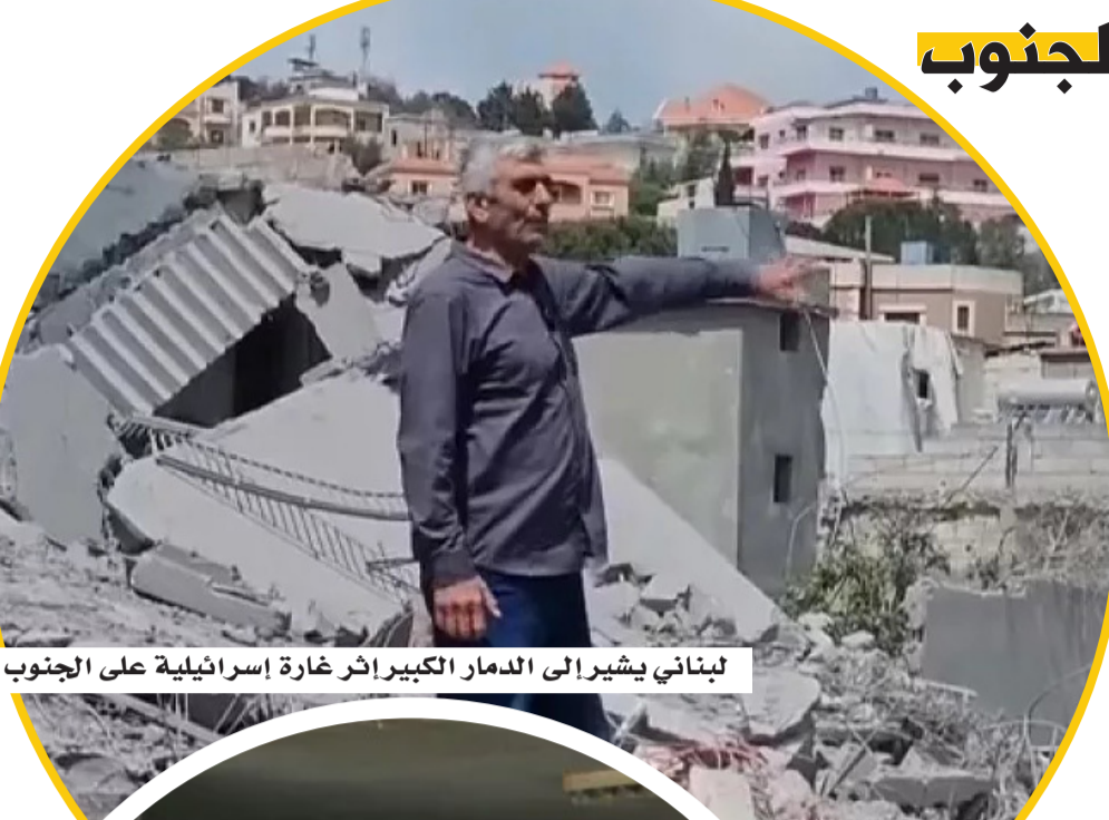
لبناني يشير إلى الدمار الكبير إثر غارة إسرائيلية على الجنوب

على الجانب اللبناني، شدد رئيس الحكومة نواف سلام على أن مسألة حصر السلاح بيد الدولة لا ترتبط بإرضاء إسرائيل، بل تأتي في إطار تعزيز سيادة الدولة اللبنانية. كما أكد تمسك بيروت بمطلب الانسحاب الإسرائيلي الكامل من الجنوب، ورفضها الإبقاء على أي نقاط أو مواقع عسكرية إسرائيلية داخل الأراضي اللبنانية، إلى جانب المطالبة بالإفراج عن الأسرى وتسوية الملفات الحدودية العالقة.