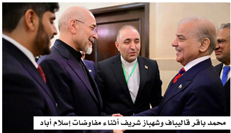
محمد باقر قاليباف وشهباز شريف أثناء مفاوضات إسلام آباد

ولمزم القرار الإدارة الأميركية بإنهاء أي مشاركة قتالية ضد إيران، استناداً إلى قانون صلاحيات الحرب الصادر عام 1973، الذي يمنح الكونغرس سلطة الرقابة على العمليات العسكرية الممتدة. إلا أن أهمية التصويت تبقى موضع جدل، في ظل تأكيد البيت الأبيض أن