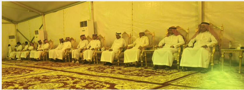
أبناء وذو الفقيد في مجلس العزاء