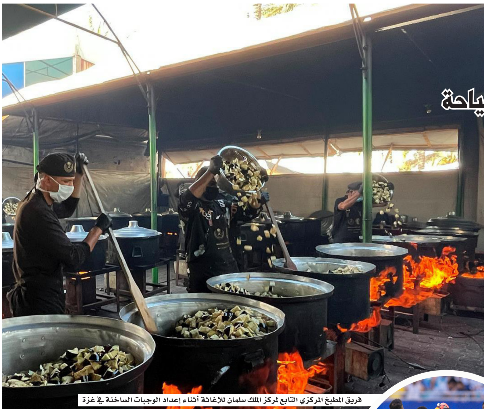
فريق المطبخ المركزي التابع لملك سلمان للأغذية أثناء إعداد الوجبات الساخنة في غزة