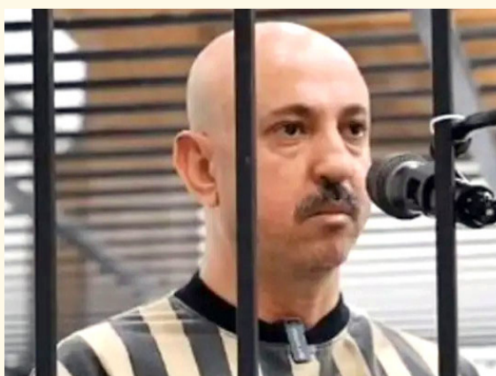
وسيم الأسد أثناء محاكمته

وفي سياق متصل، أعلنت وزارة العدل السورية أن محاكمة مفتي الجمهورية السابق أحمد حسون ستبدأ اليوم، على خلفية اتهامات تتعلق بالتحريض عبر فتاوى وخطابات خلال سنوات الأزمة السورية. وأكدت الوزارة أن الإجراءات القضائية تتم وفق الأطر القانونية، بما يضمن تحقيق العدالة ومحاسبة المسؤولين وإنصاف الضحايا. وتأتي هذه المحاكمات ضمن جهود العدالة الانتقالية التي أطلقتها السلطات السورية الجديدة عقب التغييرات السياسية، التي شهدتها البلاد منذ أواخر عام 2024.