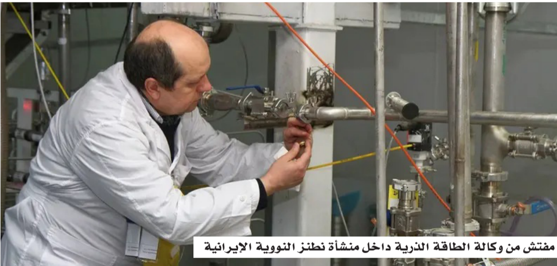
مفتش من وكالة الطاقة الذرية داخل منشأة تنظر النووية الإيرانية

وتكشف مسودة الاتفاق عن حزمة واسعة من الحوافز الاقتصادية المقدمة لإيران، تشمل السماح الفوري ببيع النفط والوقود، إلى جانب خطة تمويل وتنمية تتجاوز قيمتها 300 مليار دولار، وذلك مقابل التزامات إيرانية تتعلق بالبرنامج النووي وأمن الملاحة البحرية. وتنص المسودة على إعلان إنهاء دائم للحرب على مختلف الجبهات،