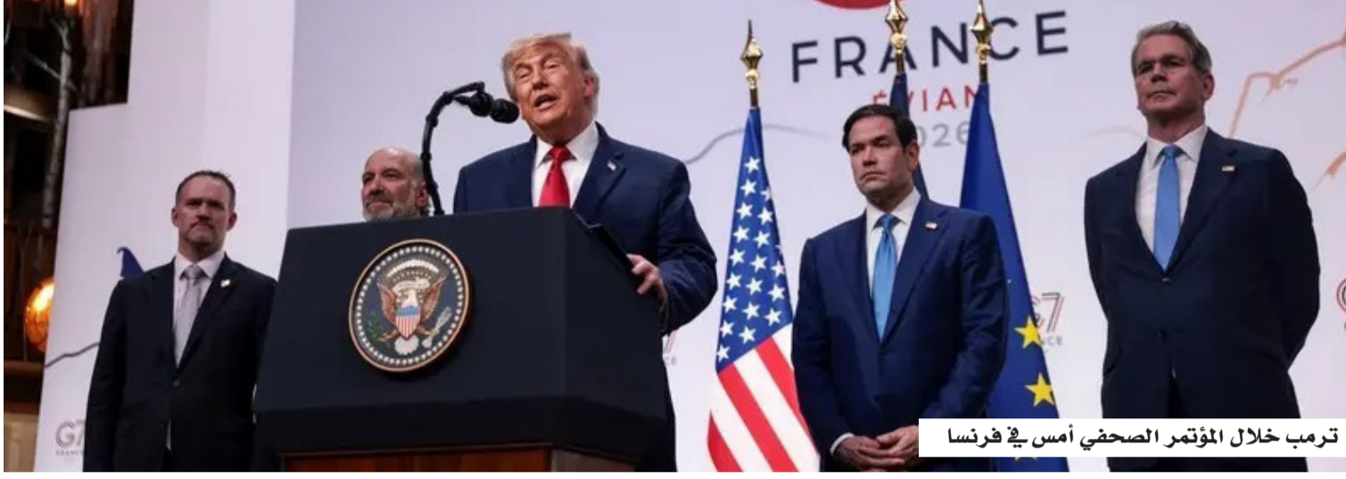
ترمب خلال المؤتمر الصحفي أمس في فرنسا

ويعكس فشل المشروع استمرار الدعم البرلماني النسبي لسلطات الرئيس في إدارة الملف الإيراني، في وقت تتجه فيه الأنظار إلى نتائج الاتفاق المرتقب ومدى قدرته على تثبيت التهدئة وفتح الباب أمام تسوية سياسية طويلة الأمد.