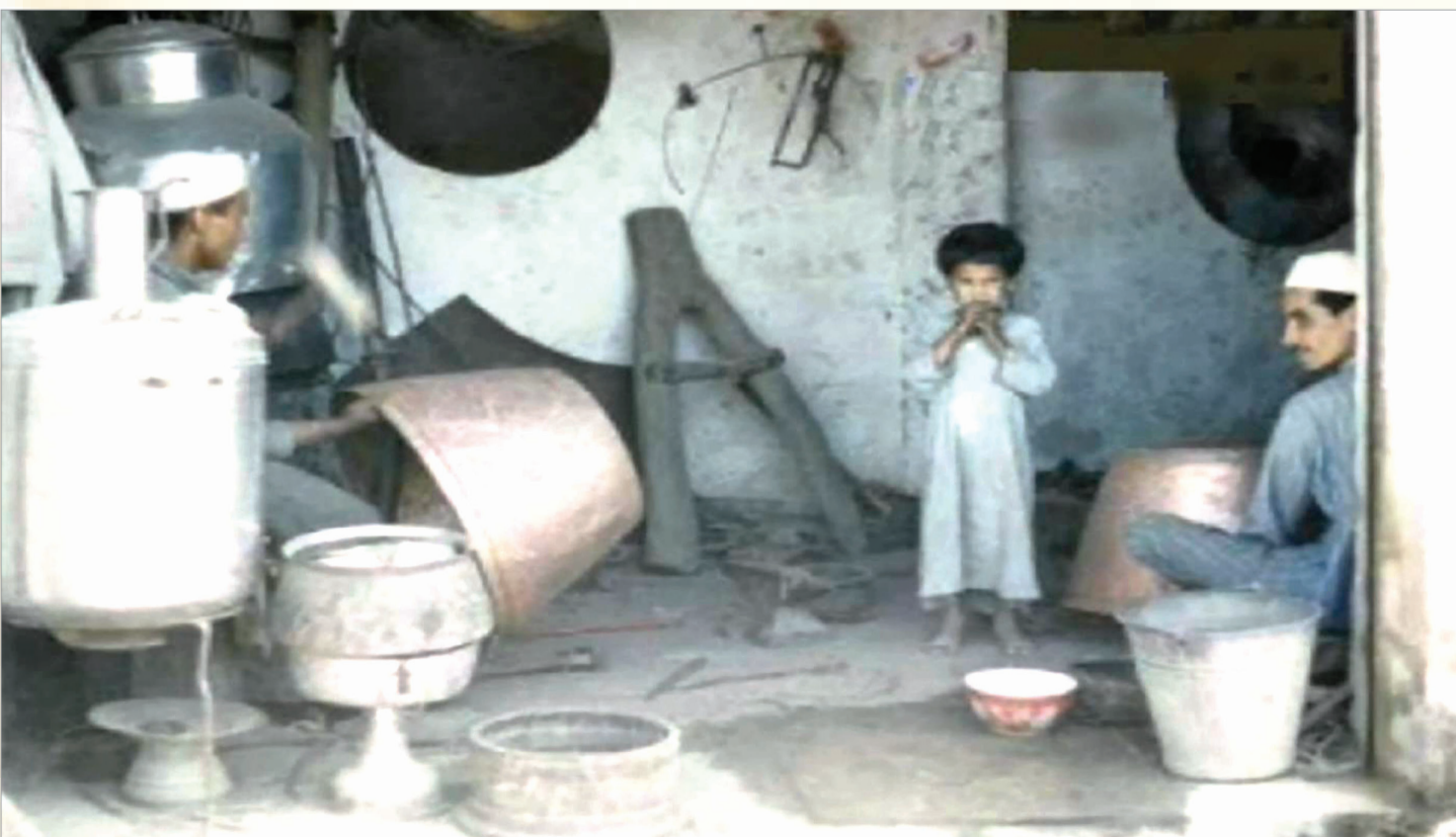
من الحرف السعودية قديماً