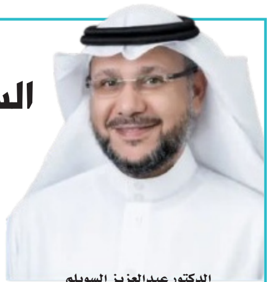
الدكتور عبدالعزيز السويلم

أكد الرئيس التنفيذي للهيئة السعودية للملكية الفكرية الدكتور عبدالعزيز بن محمد السويلم، أن مصادقة مجلس الوزراء على "معاهدة الرياض لقانون التصاميم" تجسد اهتمام المملكة بتطوير منظومة الملكية الفكرية، وتعزيز حضورها الفاعل في صياغة الأطر الدولية الداعمة لحماية التصاميم وتمكين المبدعين.