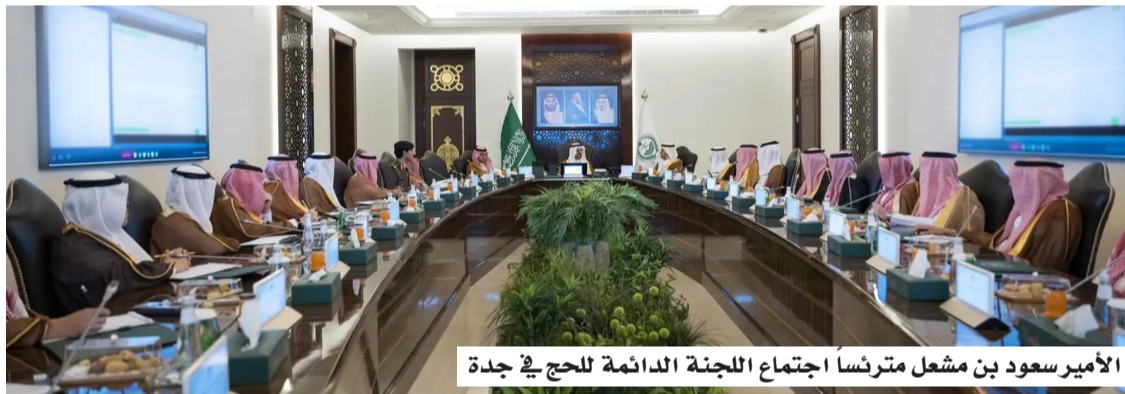
الأمير سعود بن مشعل مترئسا اجتماع اللجنة الدائمة للحج في جدة

وقدم نائب أمير منطقة مكة المكرمة شكره وتقديره للجهات أعضاء اللجنة نظير الجهود المبذولة خلال حج 1447هـ، التي أسهمت -بتوفيق الله- ثم بما وفرته القيادة الرشيدة من إمكانيات مادية وبشرية، في خدمة ضيوف الرحمن وتمكينهم من أداء مناسكهم بكل يسر وسهولة، واستعرضت اللجنة سبل تعزيز