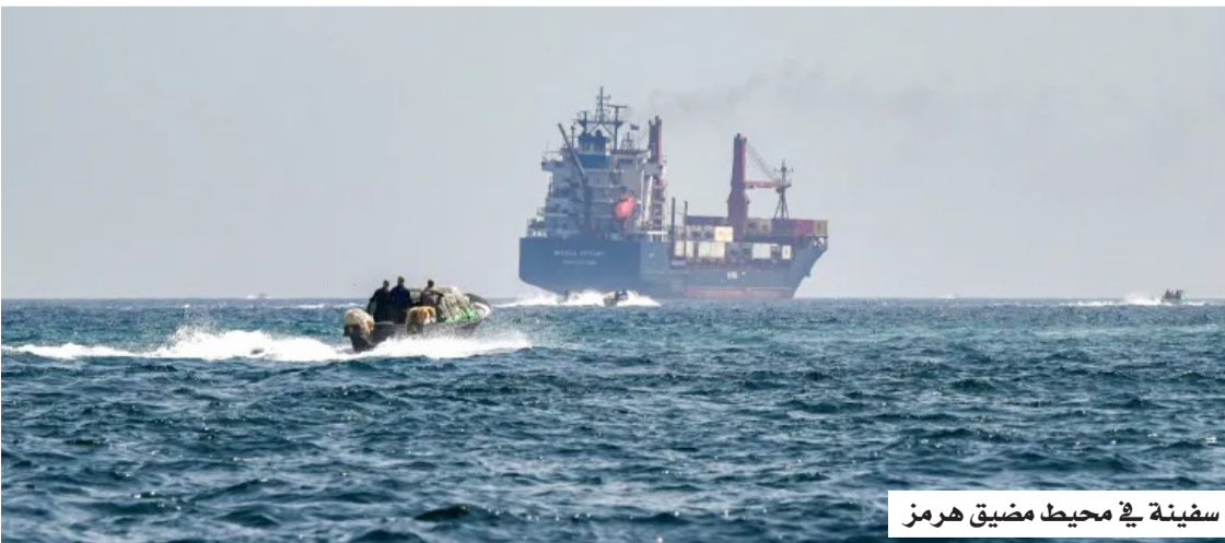
سفينة في محيط مضيق هرمز

وفي مؤشر عملي على تخفيف القيود المفروضة على الصادرات الإيرانية، عبرت عدة ناقلات نفط إيرانية منطقة الحصار البحري الأمريكي المفروض على الموانئ الإيرانية منذ نحو شهرين. وأظهرت بيانات تتبع الملاحة عبور ناقلتين عملاقتين تحمالان نحو 3.8 ملايين