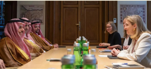
الأمير فيصل بن فرحان مستقبلاً ماينل راينزجر أمس فيينا

وزير الخارجية ونظيرته النمساوية يناقشان تطورات المنطقة