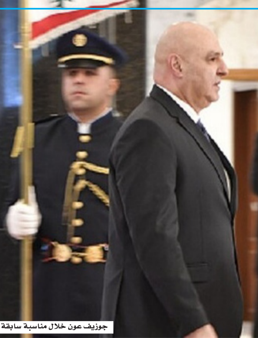
جوزيف عون خلال مناسبة سابقة

حزب الله عن تنفيذ عمليات جديدة ضد القوات الإسرائيلية منذ الثلاثاء، ما يعكس حالة من التهدئة الحذرة دون الوصول إلى وقف كامل للأعمال القتالية. وفي تطور لافت، وجّه الرئيس الأمريكي دونالد ترامب انتقادات علنية نادرة للأساليب العسكرية الإسرائيلية في لبنان، معتبراً أن استهداف عناصر حزب الله لا يبرر تدمير مبان سكنية كاملة وما يرافق ذلك من خسائر بشرية بين المدنيين. وقال ترمب إن عدد الضحايا المدنيين ارتفع بشكل كبير خلال الحرب، داعياً إسرائيل إلى التحلي بمزيد من المسؤولية في إدارة عملياتها العسكرية. كما أشار إلى أن الحرب ضد حزب الله استمرت لفترة أطول مما ينبغي، في تصريحات تعكس تزايد التباين بين واشنطن وتل أبيب بشأن إدارة المرحلة الحالية.