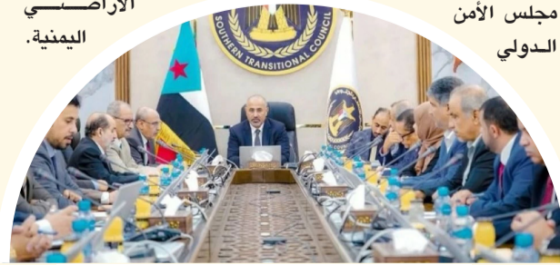
اجتماع سابق للمجلس الانتقالي الجنوبي

ويأتي القرار بعد يوم واحد من مطالبة الحكومة اليمنية مجلس الأمن الدولي