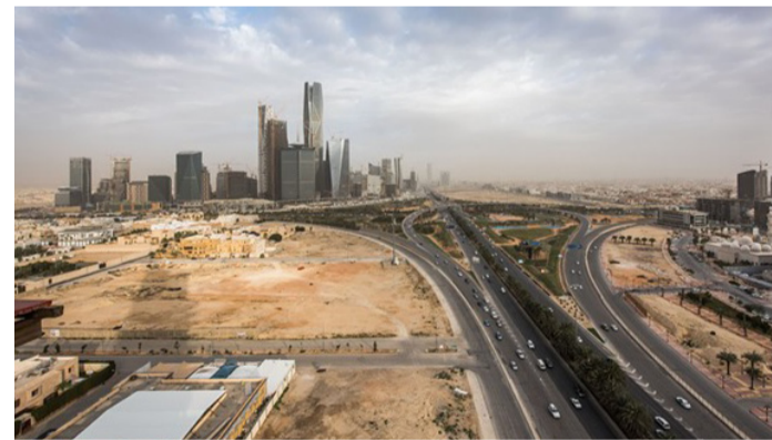
مساحات أراض دخلت حيز التطوير

كشفت وزارة البلديات والإسكان، أن إجمالي مساحات الأراضي البيضاء المشمولة بالتطوير والتداول في منطقة الرياض بلغ نحو 71 مليون متر مربع، في مؤشر يعكس أثر تطبيق نظام رسوم الأراضي البيضاء والعقارات الشاغرة في تحفيز التنمية العمرانية، ورفع كفاءة استخدام الأراضي داخل النطاقات الحضرية. وأوضحت الوزارة أن هذه المساحات تشمل 29 مليون متر مربع من الأراضي، التي اكتمل تطويرها، و20 مليون متر مربع من الأراضي البيضاء التي دخلت حيز التداول، إضافة إلى 21 مليون متر مربع لا تزال قيد التطوير، بما يدعم الاستفادة من الأراضي غير المستغلة ويعزز المعروض العمراني في المنطقة. وأكدت أن إيرادات رسوم الأراضي