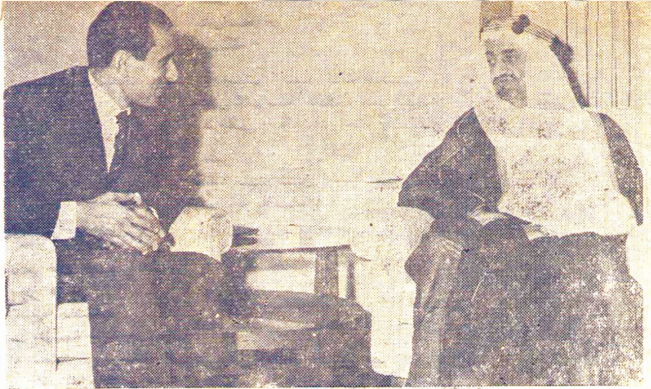
سهو الامير فيصل فيصّل يتحدث الى مندوب جريدة النهار

طول الطريق ٢٤ كيلو متراً والمعروف ان الابواء وادي يقدر طوله بـ ١٥ كيلو مترا وعرضه ٢ كيلومتر وهو غني بالمياه.