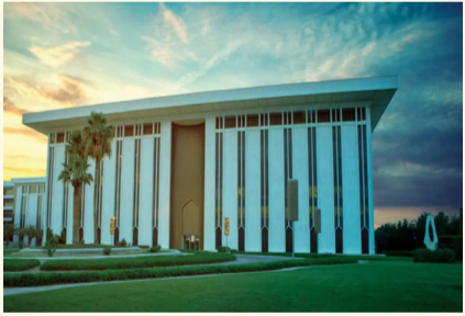
البنك المركزي السعودي

كشف البنك المركزي السعودي "ساما" أن إجمالي التمويلات الممنوحة من قبل شركات التمويل الجماعي بالدين في السعودية بلغ نحو 11 مليار ريال منذ بدء ممارسة النشاط حتى نهاية 2025. ولفت أن الجهات المرخصة لممارسة نشاط الوساطة الرقمية لجهات التمويل بلغت 10 شركات رقمية في السوق السعودية، مبيناً أن التأسيس يهدف إلى ربط العملاء بجهات التمويل حسب التزاماتهم الائتمانية وملاءتهم المالية، وعرض الخيارات التمويلية المتاحة. واستطرد المركزي السعودي أن إجمالي عدد شركات التمويل المرخصة من قبله بلغ 75 شركة تمويل وذلك حتى يونيو 2026، منها 12 شركة تمارس نشاط التمويل الجماعي بالدين. وأوضح أن التمويل الجماعي بالدين يعد أحد طرق التمويل التي تتعامل بها بعض المؤسسات، ويتمثل في منظومة رقمية تتيح للشركات الحصول على قروض مباشرة من مجموعة كبيرة من المستثمرين (الأفراد أو المؤسسات) عبر منصة إلكترونية بسيطة، مقابل التزام المقترض بسداد المبلغ الممول مضافاً إليه العائد المالي المتفق عليه، وذلك دون الحاجة للجوء إلى جهات التمويل التقليدية. يذكر أن التمويل بتلك الطريقة يوفر للمنشآت الوصول إلى مصادر تمويل تدعم نموها وتوسعها، لا سيما الصغيرة والمتوسطة، فيما يمنح المستثمرين فرصاً للمشاركة في تمويل الأنشطة الاقتصادية عبر منصات رقمية مرخصة، وبذلك يُسهم بتنوع مصادر التمويل والاستثمار، وتحفيز الابتكار في الخدمات المالية.