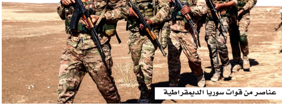
عناصر من قوات سوريا الديمقراطية

كما طرح مشروع لإنشاء مسار لنقل النفط يربط حقولاً في العراق ومصافي إقليم كردستان بخط يصل إلى مصفاة بانياس على الساحل السوري، مروراً بالمناطق الكردية في سوريا. في خطوة يُنظر إليها على أنها جزء من إعادة رسم خريطة التعاون الاقتصادي في المنطقة.