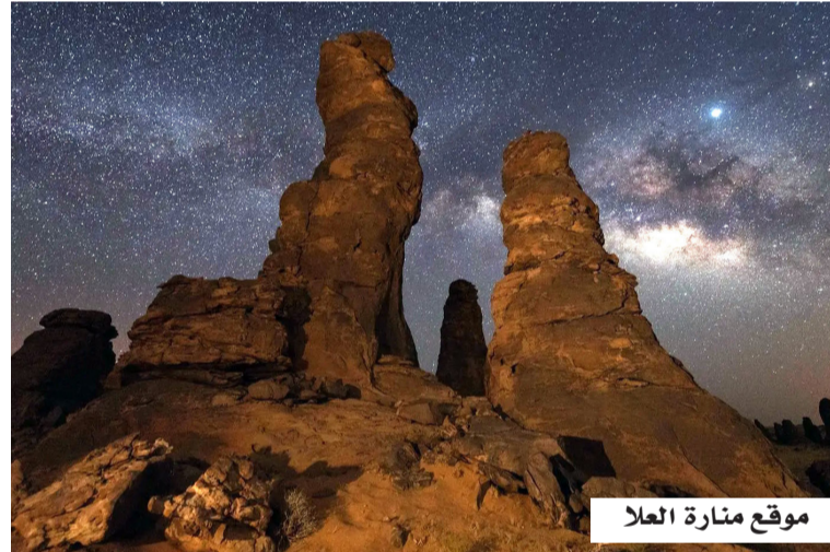
موقع منارة العلاء

وافق مجلس إدارة الهيئة الملكية لمحافظة العلاء على تصميم "منارة العلاء" المشروع المتكامل في الاكتشافات الفلكية والسياحة المستدامة، الذي يضم مرصداً فلكياً متقدماً، ومركزاً للزائرين والأبحاث، ويعد معلماً ثقافياً وعلمياً، يتيح رصد ومراقبة النجوم، لتعزيز البحث العلمي والاكتشافات الفلكية. وتتميز "منارة العلاء" بتصميم مبتكر يجسد البيئة الطبيعية والثقافية في العلاء، وإرثها التاريخي المرتبط بدراسة الفلك، وتضم المنارة مرصداً فلكياً متطوراً ومركز أبحاث علمياً، وتلسكوبات ومنصات مراقبة، ومعارض وتجارب تفاعلية. وتهدف "منارة العلاء" إلى تعزيز مكانة المملكة، ضمن المشهد العلمي العالمي، لتصبح رائدة في مجال الفلك والفضاء وذلك تحقيقاً لاستهدافات رؤية العلاء المتماشية مع رؤية المملكة 2030. وتبعد "منارة العلاء" أكثر من 70 كيلومتراً