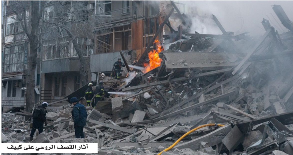
آثار القصف الروسي على كييف

وأدت الهجمات الأوكرانية إلى مقتل شخص وإصابة ستة آخرين في مقاطعة بيلغورود الحدودية، في وقت تواصل فيه كيف استهداف العمق الروسي باستخدام الطائرات المسيّرة بعيدة المدى. في المقابل، أسفر هجوم روسي على مدينة زابوريجيا جنوب شرقي أوكرانيا عن مقتل شخص وإصابة سبعة آخرين، وفق