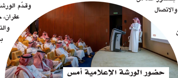
حضور الورشة الإعلامية أمس

أقامت أكاديمية هيئة الإذاعة والتلفزيون للتدريب أمس، ورشة عمل بعنوان "إدارة الأزمات الإعلامية.. من رد الفعل إلى صناعة التأثير، وذلك في مقر الهيئة بالرياض، بحضور عدد من المختصين في مجالات الإعلام والاتصال المؤسسي وإدارة السمعة. وركزت الورشة على تمكين المشاركين من التعامل مع الأزمات الإعلامية بوعي مهني واستجابة اتصالية