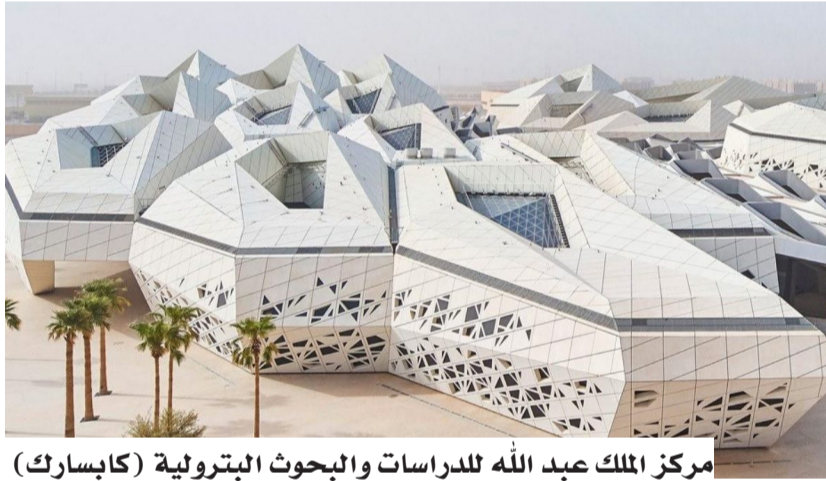
مركز الملك عبد الله للدراسات والبحوث البترولية (كابسارك)

1 الهندسة والاقتصاد والطاقة 2 الاستدامة والسياسات العامة 3 الإدارة العامة والمالية