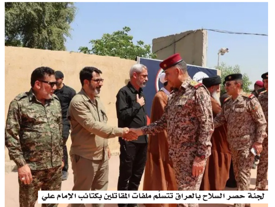
لجنة حصر السلاح بالعراق تتسلم ملفات المقاتلين بكتائب الإمام علي