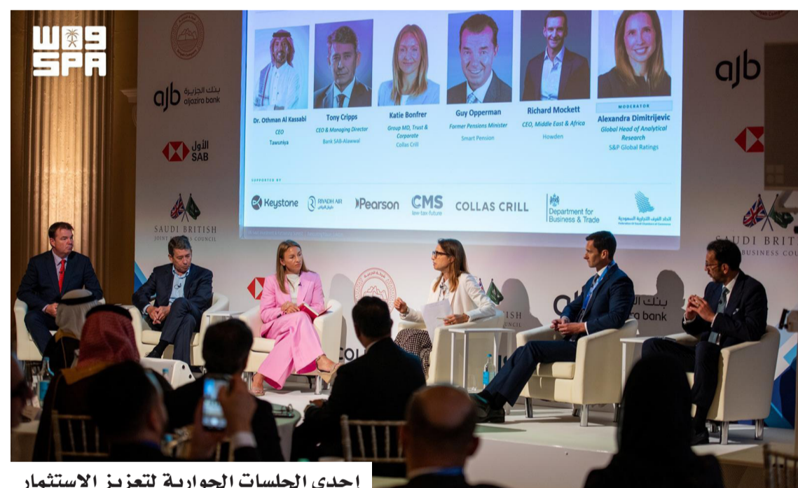
إحدى الجلسات الحوارية لتعزيز الاستثمار

إحدى أبرز المنصات الاقتصادية المشتركة بين البلدين، وأكدت مشاركة وفد الاتحاد أهمية شراكة كمشرك اقتصادي بريطاني؛ كمشرك اقتصادي إستراتيجي للمملكة، ودور القطاع الخاص في دفع مسارات التعاون الاقتصادي والاستثماري، في ظل علاقات اقتصادية متنامية بلغ معها إجمالي التجارة البينية نحو (680) مليار ريال خلال الفترة (2016 - 2025)؛ بما يعزز فرص استقطاب الاستثمارات النوعية، وتوسيع الشراكات المستدامة وزيادة التبادل التجاري بين البلدين.