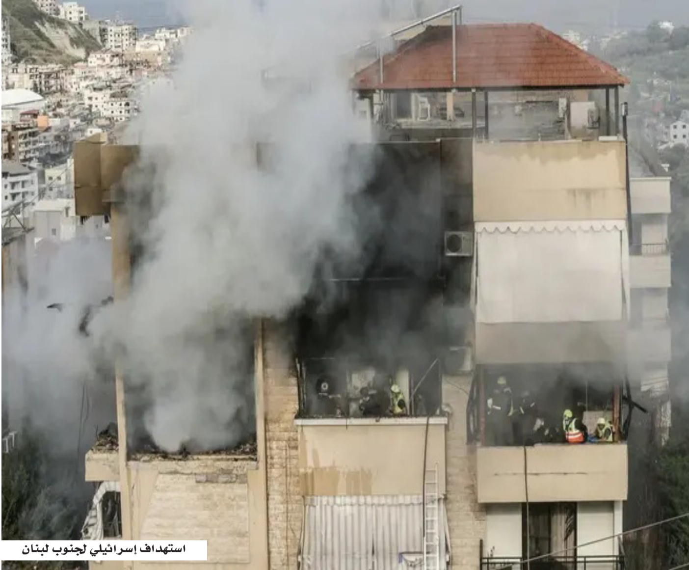
استهداف إسرائيلي لجنوب لبنان