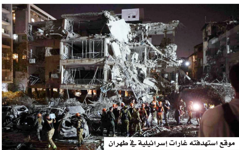
موقع استهدافه غارات إسرائيلية في طهران