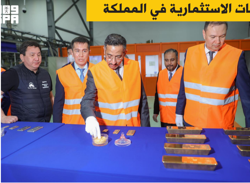
ويزور مصفاة الذهب في أستانا