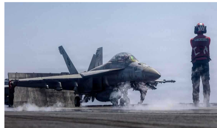
طائرة أميركية تستعد لطلعة جوية في جنوب إيران

وقالت الخارجية الإيرانية في بيان إن القوات الأميركية استهدفت مواقع في الجنوب الإيراني تحت هذا المبرر، مؤكدة في المقابل أن القوات المسلحة الإيرانية ردت بضرب قواعد ومنشآت قالت إنها كانت تُستخدم في تنفيذ هجمات ضد إيران في المنطقة. وأضاف البيان أن طهران تحتفظ بحقها الكامل في الدفاع عن نفسها، بما في ذلك استهداف القواعد والمنشآت التي تُستخدم، بحسب وصفها، في أي اعتداء على أراضيها