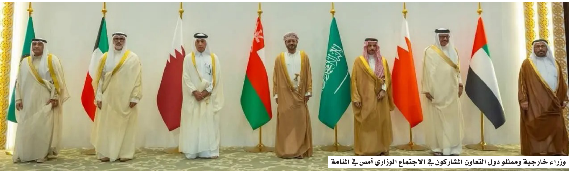
وزراء خارجية وممثلو دول التعاون المشاركون في الاجتماع الوزاري أمس في المنامة

وفي المقابل، صعد الرئيس الأمريكي دونالد ترمب موقفه تجاه إيران، مؤكداً أن طهران أضاعت فرصة التوصل إلى اتفاق كان من شأنه أن يحقق نتائج إيجابية لها، ومتوعداً بأن تأخرها في إبرام تسوية سيكلفها ثمناً باهظاً، مع استمرار الضغوط الاقتصادية والعسكرية عليها، وإشارته إلى إصدار أوامر بضربات تستهدف منشآت حيوية داخل إيران. وفي إيران، دعا الرئيس مسعود بزشكيان إلى الخروج من حالة «اللا حرب واللا سلم» مع الإقرار بأهمية المسار الدبلوماسي، بينما أكد رئيس الوزراء الإسرائيلي بنيامين نتانياهو استمرار العمليات ضد إيران وحلفائها. كما تواصلت الجهود الدبلوماسية عبر وساطة قطرية في طهران؛ لاحتواء التصعيد وتقريب وجهات النظر.