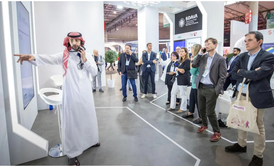
مؤتمر سابق لايتكار في الذكاء الاصطناعي

شفافية الجهات الحكومية، ويمكّن القطاع الخاص من تطوير حلول مبتكرة، إلى جانب تفعيل ملف البيانات المفتوحة على المستوى الوطني، ورفع مرتبة المملكة في المؤشرات الدولية ذات العلاقة.