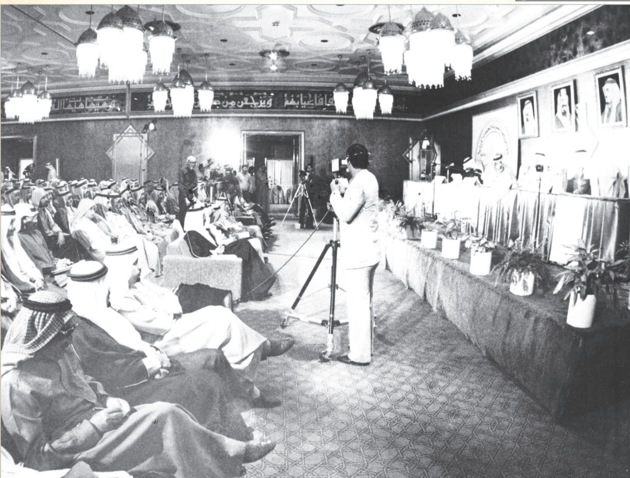
مؤتمر رؤساء البلديات والمجمعات القروية