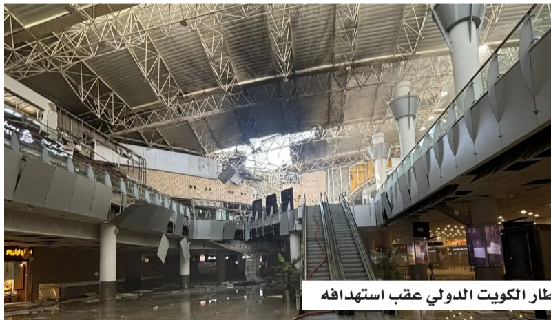
مطار الكويت الدولي عقب استهدافه

الدولي، وتدعياً على سيادة الدول العربية وأمنها الوطني؛ بما يهدد الاستقرار الإقليمي، ويزيد من حدة التوتر في المنطقة. وأكد اليماني، في بيان، تضامن البرلمان العربي الكامل مع الأردن والبحرين والكويت، ودعمه لكل ما تتخذه من إجراءات لحفظ أمنها وسيادتها واستقرارها، مشدداً على أن أمن الدول العربية لا يتجزأ، وأن المساس بأمن أي دولة عربية هو مساس بالأمن القومي العربي.