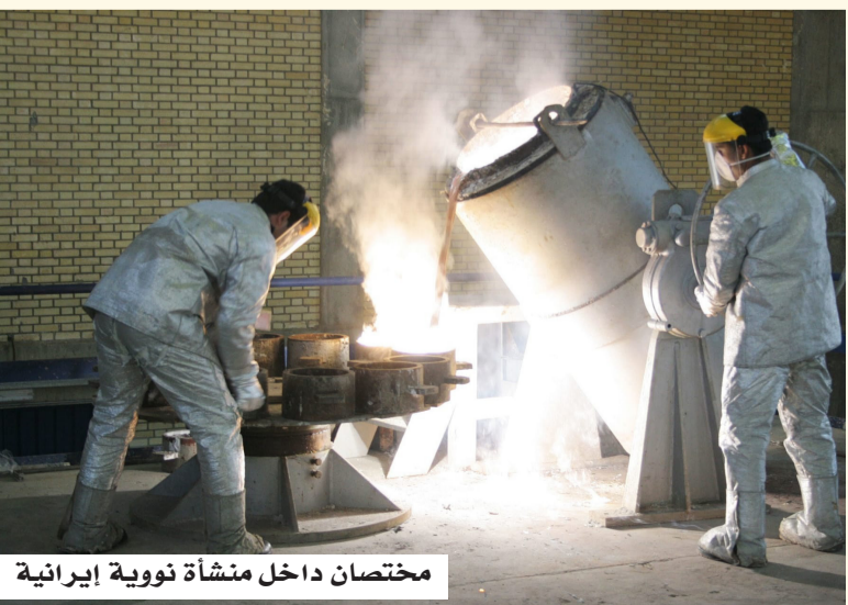
مختصان داخل منشأة نووية إيرانية

في المقابل، رفضت بعثة إيران لدى الوكالة الدولية للطاقة الذرية القرار، واعتبرته ذا طابع "سياسي" ويفتقر إلى المهنية، مؤكدة أن طهران ستدافع عن حقوقها وسترد على ما وصفته بالقرار "المعيب".