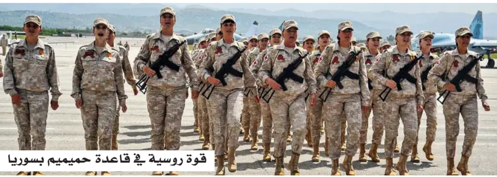
قوة روسية في قاعدة حميميم بسوريا

ونقطة الدعم الرئيسية للبحرية الروسية في المنطقة. وتؤكد موسكو أن استمرار وجودها العسكري في سوريا يتم وفق تفاهات مع الحكومة السورية، مع الحفاظ على قنوات التنسيق بين الجانبين، في وقت تشير فيه التطورات الحالية إلى توجه نحو إعادة تنظيم هذا الوجود بما يتناسب مع المرحلة المقبلة.