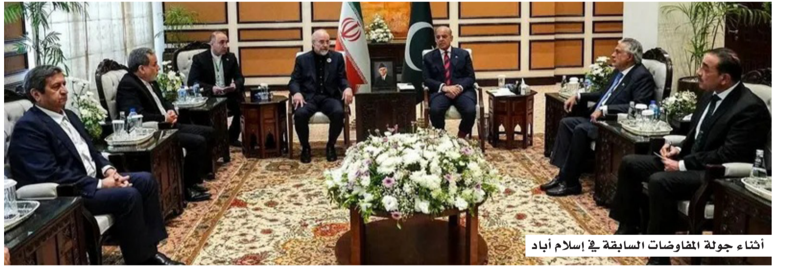
أثناء جولة المفاوضات السابقة في إسلام آباد