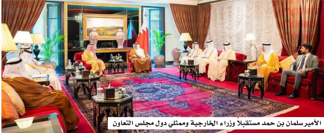
الأمير سلمان بن حمد مستقبلاً وزراء الخارجية وممثلي دول مجلس التعاون