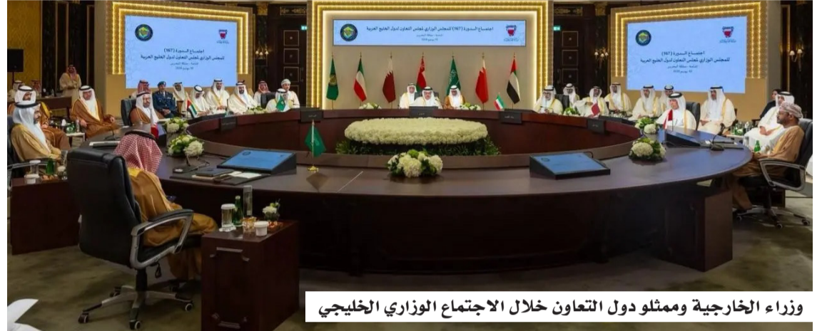
وزراء الخارجية وممثلو دول التعاون خلال الاجتماع الوزاري الخليجي

للاعتداءات الإيرانية التي استهدفت دول المنطقة، وما يترتب عليها من تداعيات تمس الأمن والاستقرار الإقليميين، مؤكداً ضرورة احترام سيادة الدول ومبادئ حسن الجوار، والالتزام بمبادئ القانون الدولي، وتغليب الحوار والحوار السلمي بما يسهم في تعزيز الأمن والاستقرار في المنطقة. وعلى هامش الاجتماع، التقى صاحب السمو الأمير فيصل بن فرحان بن عبدالله وزير الخارجية، ووزير الخارجية كندا أنيتا أندان، وذلك على هامش الاجتماع الوزاري المشترك بين مجلس التعاون الخليجي وكندا في العاصمة البحرينية المنامة. وجرى خلال اللقاء بحث العلاقات الثنائية بين البلدين الصديقين، ومناقشة آخر تطورات الأوضاع في المنطقة، والجهود المبذولة بشأنها.