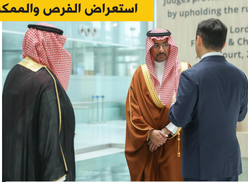
بندر الخريف خلال لقائه بمسؤولين كازاخستانيين

الخرافة، واستعراض الفرص والمكثبات الاستثمارية التي توفرها المملكة للمستثمرين الدوليين، وجلسة حوارية رفيعة المستوى حول مستقبل قطاع التعدين والمعادن، ودور التقنيات المتقدمة والذكاء الاصطناعي في تطوير سلاسل القيمة وتعزيز استدامة القطاع عالمياً. في هذا السياق، زار الوزير بندر الخريف مصفاة الذهب في العاصمة أستانا، وأطلع على تقنيات وعمليات معالجة وتكرير الذهب، وبحث فرص التعاون وتبادل الخبرات في قطاع التعدين والصناعات المعدنية. كما زار مركز أستانا المالي الدولي، وناقش فرص تعزيز التعاون والشراكات، واستعرض جهود المملكة في توفير حلول تمويلية داعمة للقطاعين الصناعي والتعديني.