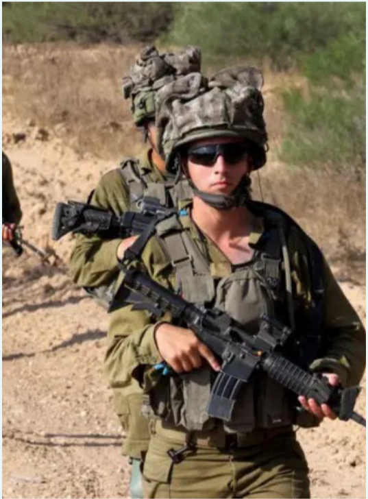
جنود من الجيش الإسرائيلي