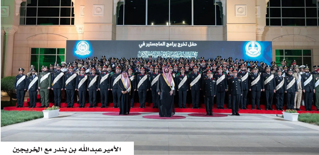
الأمير عبدالله بن بندر مع الخريجين