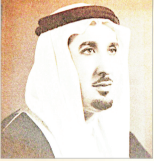
عبد الرحمن أبا الخيل

سيتم تخريج أول دفعة من معهد الخدمة الاجتماعية في عام ٨٥ - ٨٦هـ.. وزير العمل يشيد بالفوائد التي سيحققها هذا المعهد خلال الاعوام القادمة.. مصادر مطلعة في وزارة العمل والشؤون الاجتماعية.. ان اول دفعة سيتم تخريجها من معهد الخدمة الاجتماعية بمدينة الرياض.. خلال عام ٨٥ - ٨٦هـ.. كما اشار معالي وزير العمل والشؤون الاجتماعية لمنتدى "البلاد" من ان هذا المعهد سيحقق الفوائد الكثيرة من اجل خلق باحثات.. يستعان بهم في فتح المزيد من مكاتب الضمان الاجتماعي في كثير من المدن والقرى التي تحتاج الى مثل هذه المكاتب.. وقال الوزير: ان الوزارة ربما حاولت بعد نجاح التجربة الاولى في معهد الرياض.. فتح معاهد مماثلة في بعض المناطق الرئيسية في المملكة.