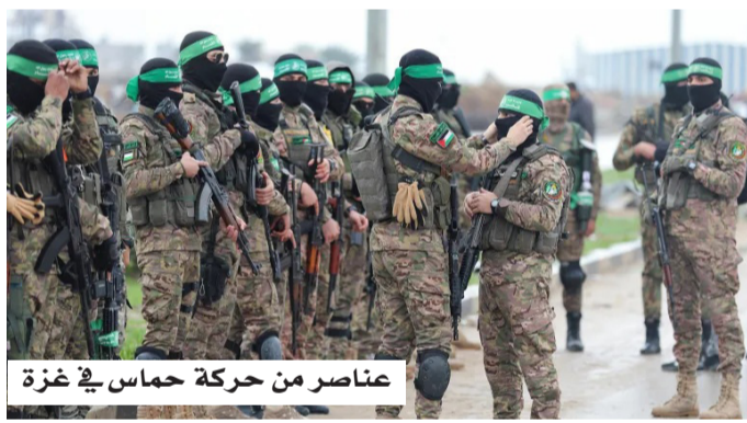
عناصر من حركة حماس في غزة

وتتزامن هذه التطورات مع استمرار المفاوضات الرامية إلى تثبيت وقف إطلاق النار والتوصل إلى اتفاق دائم، إلا أن التباينات بشأن ملف السلاح وآليات تنفيذ المرحلة المقبلة لا تزال تشكل عقبة رئيسية أمام تحقيق اختراق سياسي حاسم. ورغم سريان اتفاق وقف إطلاق النار منذ أكتوبر 2025، ما زال الوضع في غزة هشاً، مع استمرار الغارات الإسرائيلية بشكل متقطع وتواصل الخلافات حول مستقبل القطاع وترتيبات ما بعد الحرب، الأمر الذي يجعل نجاح الوساطات الحالية مرهوناً بقدرة الأطراف على تجاوز الملفات الأكثر تعقيداً خلال المرحلة المقبلة.