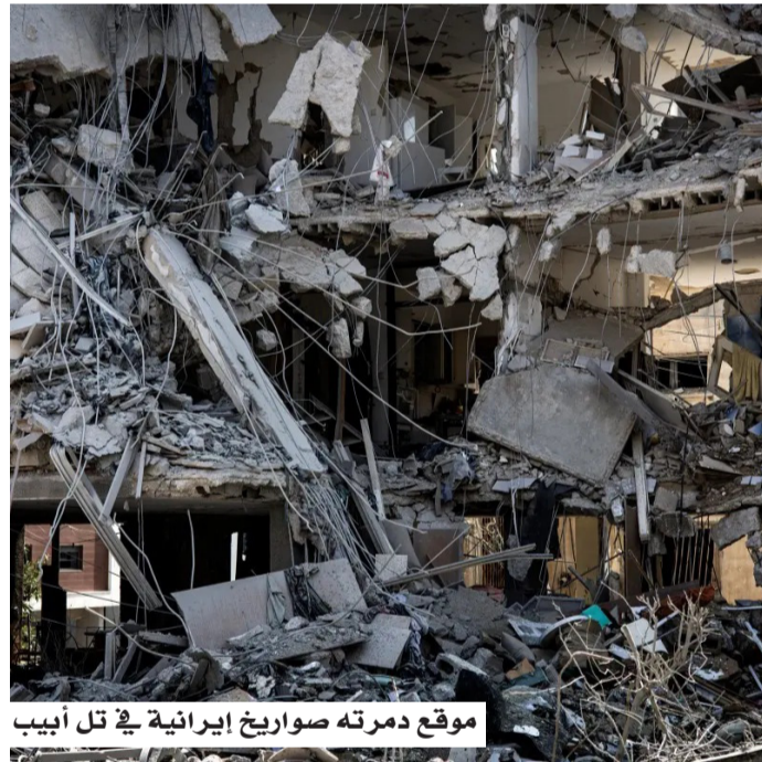
موقع دمرته صواريخ إيرانية في تل أبيب

وتأتي المواقف الإيرانية في وقت لا تزال فيه الإدارة الأميركية تبدي تفاؤلاً بإمكانية التوصل إلى اتفاق قريب. فقد أكد مسؤول أميركي أن المفاوضات لم