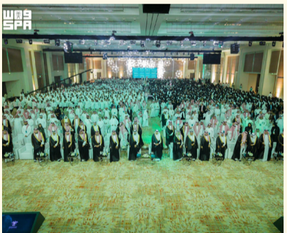
الخريجون والخريجات خلال الحفل