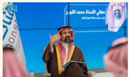
محمد القوي خلال جلسة عن التمويل

أوضح رئيس مجلس هيئة السوق المالية محمد بن عبدالله القوي، أن قنوات التمويل في المملكة شهدت خلال السنوات العشر الماضية تطوراً نوعياً في بناء منظومة تمويلية متكاملة، مشيراً إلى أن حجم التمويل من خلال السوق الموازية (نمو) بلغ نحو 8 مليارات ريال. وأضاف خلال جلسة حوارية ضمن فعاليات أسبوع التمويل، أن الصناديق التمويلية أسهمت في تنوع خيارات التمويل، ورفع كفاءة السوق، واستدامة المنشآت واستقرارها، وتمكين رواد الأعمال من اتخاذ قرارات تمويلية أكثر كفاءة، منوهاً بما يحظى به القطاع من دعم وطني متمم، يسهم في توسيع فرص التمويل؛ بما يواكب مستهدفات رؤية المملكة 2030.