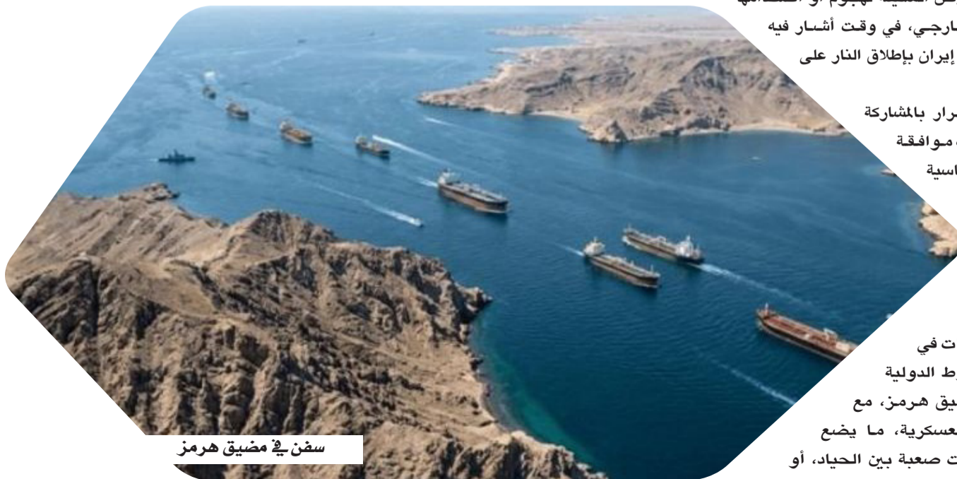
سفن في مضيق هرمز

تدرس كوريا الجنوبية الانضمام إلى العمليات، التي تقودها الولايات المتحدة في مضيق هرمز، في خطوة تعكس تصاعد القلق الدولي بشأن أمن الملاحة، وذلك عقب حادثة حريق وانفجار على متن سفينة شحن كورية جنوبية في الممر البحري الحيوي. وأعلنت سيول أنها ستجري مراجعة شاملة لموقفها، بعد دعوة الرئيس الأمريكي دونالد ترمب للانضمام إلى الجهود الرامية لتأمين عبور السفن، خصوصاً في ظل التوترات المتزايدة في المنطقة. وفي هذا السياق، عقدت الرئاسة الكورية اجتماعاً طارئاً لبحث تداعيات الحادث، فيما أكدت وزارة الدفاع مشاركة البلاد في محادثات دولية تهدف إلى ضمان المرور الآمن للسفن عبر المضيق، الذي يُعد شرياناً أساسياً للتجارة والطاقة العالمية. وبأشرت السلطات الكورية تحقيقاً في أسباب الحريق الذي اندلع على متن سفينة تشغيلها شركة إتش إم إم، بعد انفجار وقع داخل غرفة المحركات. وتمكن طاقم السفينة، المكون من 24 فرداً، من إخماد النيران بعد ساعات من العمل، على أن تُسحب السفينة إلى ميناء قريب في الإمارات العربية المتحدة لتقييم الأضرار. ولم تُحسم بعد طبيعة الحادث، إذ تدرس جهات متخصصة