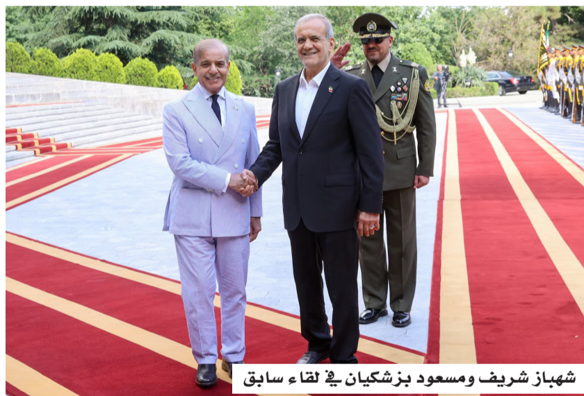
شهباز شريف ومسعود بزشكيان في لقاء سابق

تأتي هذه المواقف في وقت تتزايد فيه الدعوات الدولية للعودة إلى المسار الدبلوماسي، بعد موجة من الهجمات المتبادلة بين الولايات المتحدة وإيران في محيط مضيق هرمز، ما أدى إلى اهتزاز وقف إطلاق النار المعلن قبل نحو شهر. وأعلنت الإمارات تعرضها لهجمات صاروخية وبطائرات مسيرة، ووصفتها بأنها "تصعيد خطير"؛ حيث استهدفت إحدى