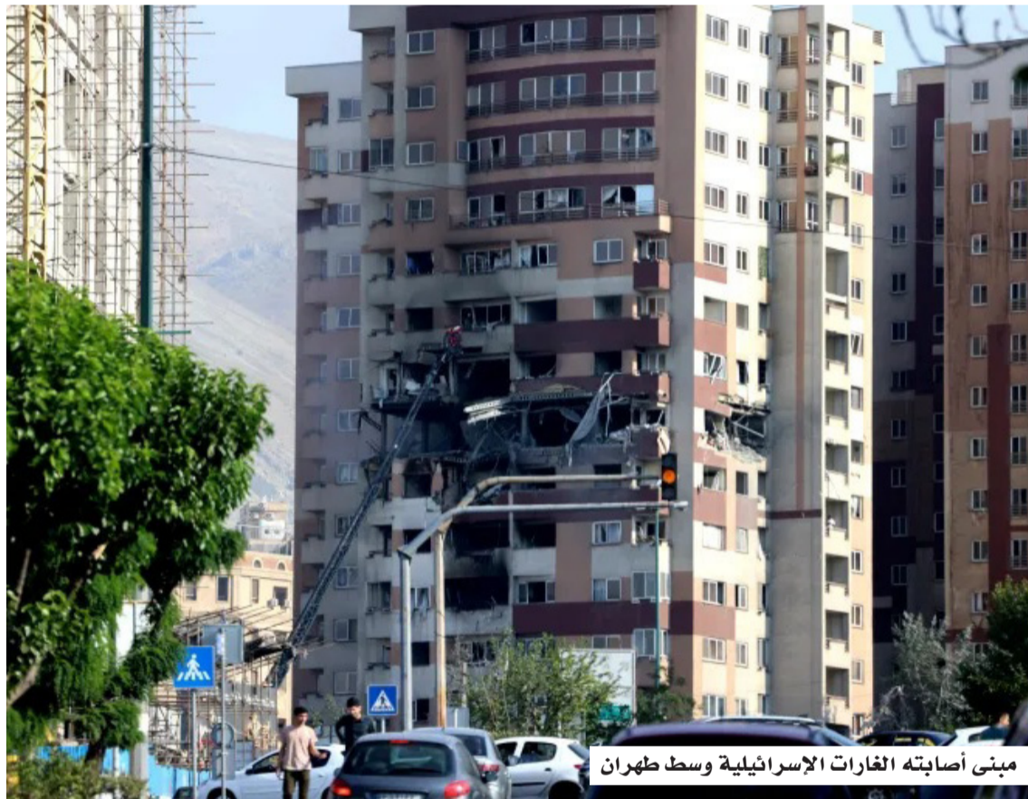
مبنى أصابته الغارات الإسرائيلية وسط طهران

لا يمكن حلها عسكرياً، محذراً من الانجرار إلى تصعيد أوسع، في حين واصل الرئيس الأمريكي دونالد ترامب الضغط لإعادة فتح مضيق هرمز، معلناً إطلاق "مشروع الحرية" لمراقبة السفن التجارية وتأمين عبورها تحت حماية عسكرية أميركية. وبينما بدأت بعض السفن فعلياً مغادرة الخليج بمرافقة أميركية، تدرس دول عدة، بينها كوريا الجنوبية، الانضمام إلى هذه