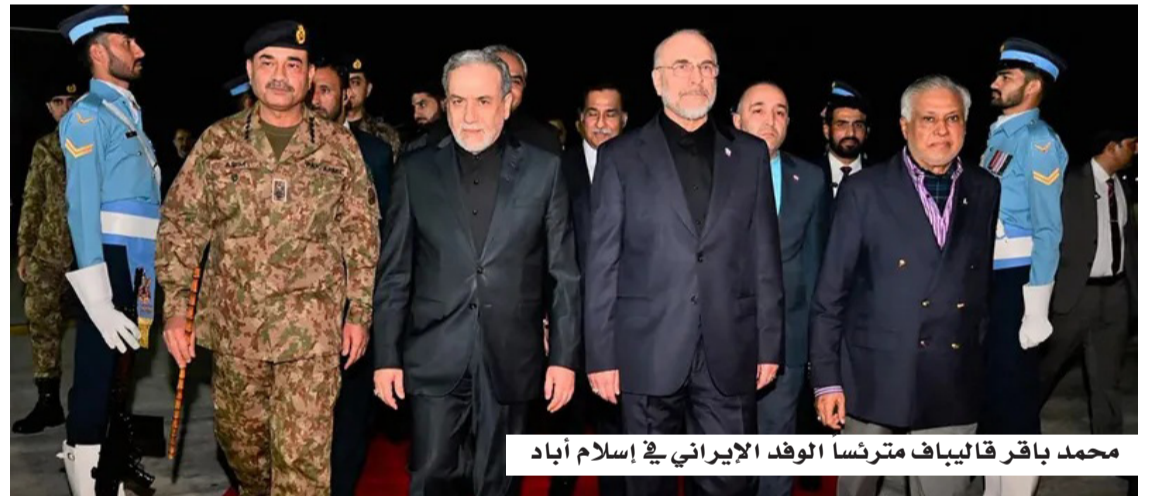
محمد باقر قاليباف مترنسا الوفد الإيراني في إسلام آباد