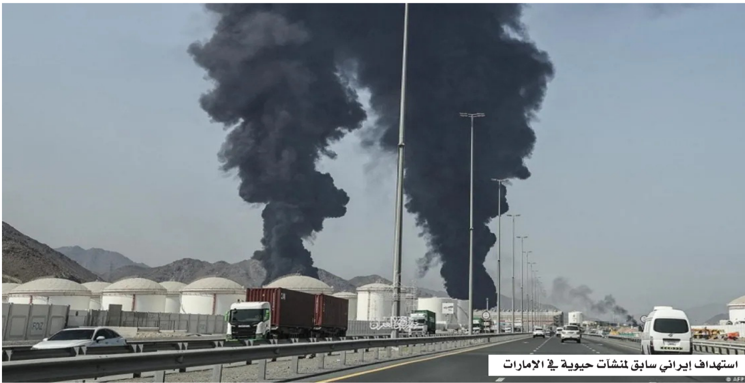
استهداف إيراني سابق لمنشآت حيوية في الإمارات

وفي السياق ذاته، أدانت رابطة العالم الإسلامي الاستهداف الإيراني للمنشآت المدنية والاقتصادية، حيث أكد أمينها العام محمد بن عبد الكريم العيسى، أن هذه الاعتداءات تنتهك القيم الدينية والقوانين الدولية، مجدداً الدعم الكامل للإمارات في حماية أمنها وسيادتها وسلامة مواطنيها والمقيمين على أراضيها.