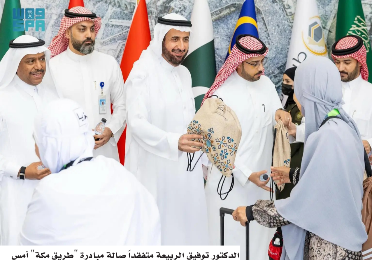
الدكتور توفيق الربيعة متفقداً صالة مبادرة «طريق مكة» أمس

إجراءات الجوازات في مطار بلد المغادرة، بعد التحقق من توافر الاشتراطات الصحية، وترميز وفرز الأمتعة وفق ترتيبات النقل والسكن في المملكة، والانتقال مباشرة إلى الحافلات لإيصالهم إلى مقر إقامتهم في منطقتي مكة المكرمة والمدينة المنورة، بمسارات مخصصة، في حين تتولى الجهات الشريكة إيصال أمتعتهم إليها. يذكر أن وزارة الداخلية تنفذ المبادرة في عاها الثامن بالتعاون مع وزارات الخارجية، والصحة، والحج والعمرة، والإعلام، والهيئة العامة للطيران المدني، وهيئة الزكاة والضريبة والجمارك، والهيئة السعودية للبيانات والذكاء الاصطناعي (سدايا)، والهيئة العامة للأوقاف، وبرنامج خدمة ضيوف الرحمن، والمديرية العامة للجوازات، وبالتكامل مع الشريك التقني مجموعة (SIC)، حيث شهدت المبادرة منذ إنطلاقها عام 1438هـ/ 2017م خدمة حاجاً (1.254,994).