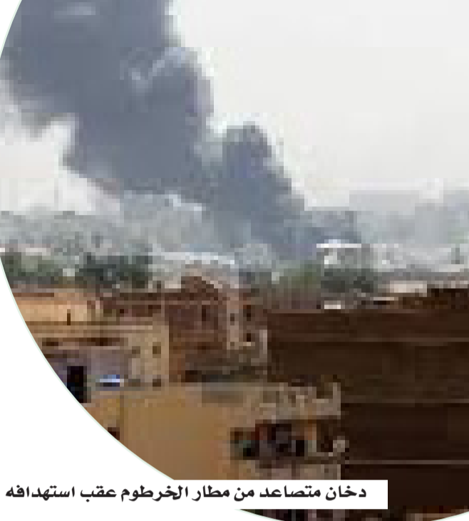
دخان متصاعد من مطار الخرطوم عقب استهدافه

وأكدت وزارة الخارجية الأمريكية أنها غير قادرة على تقديم دعم قنصلي داخل البلاد، نظراً لتعليق عمل سفارتها منذ أبريل 2023، ما يعكس هشاشة الوضع الأمني. وتشير هذه التطورات إلى مرحلة حساسة في السودان، حيث يتقاطع التصعيد الأمني مع توترات إقليمية متزايدة، ما يثير مخاوف من اتساع رقعة الأزمة، وانعكاساتها على الاستقرار في المنطقة.