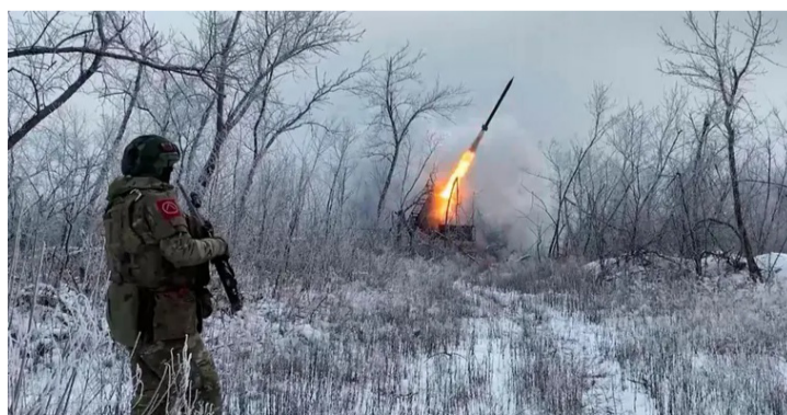
جندي يراقب إطلاق صاروخ في جبهات القتال الروسية - الأوكرانية

واتهم الرئيس الأوكراني فولوديمير زيلينسكي روسيا بإبداء "استخفاف تام" من خلال الدعوة إلى وقف إطلاق النار، ثم تنفيذ هجمات بالصواريخ والطائرات المسيّرة خلال الليل، مؤكداً أن تلك الضربات أسفرت عن مقتل خمسة أشخاص وإصابة العشرات، واستهدفت بشكل رئيسي منشآت البنية التحتية للطاقة. وشدد زيلينسكي على أن موسكو قادرة على إنهاء الحرب "في أي لحظة" عبر وقف القتال، مشيراً إلى أن بلاده ستواصل الرد على الهجمات، مع تأكيده الحاجة إلى خطوات عملية لتحقيق السلام.