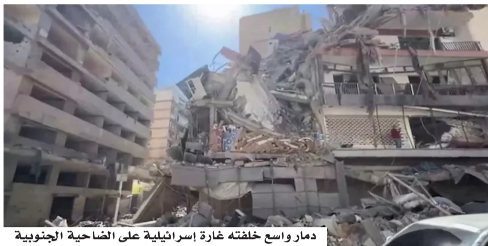
دمار واسع خلضته غارة إسرائيلية على الضاحية الجنوبية

وشدد الرئيس اللبناني على أهمية تمسك الجبهة الداخلية ووحدة القرار الوطني لمواجهة التحديات الراهنة، نافياً وجود مؤشرات حقيقية على اضطرابات داخلية، في وقت تتزايد فيه الضغوط السياسية والأمنية. وفي ما يتعلق بالتحركات الدولية، اعتبر عون أن اللقاءات الجارية في واشنطن برعاية أمريكية تمثل فرصة مهمة للبنان، خاصة مع الاهتمام المباشر من قبل الرئيس الأمريكي دونالد ترامب، ما قد يسهم في دفع مسار التهدئة. وأكد أن أي مفاوضات مقبلة يجب