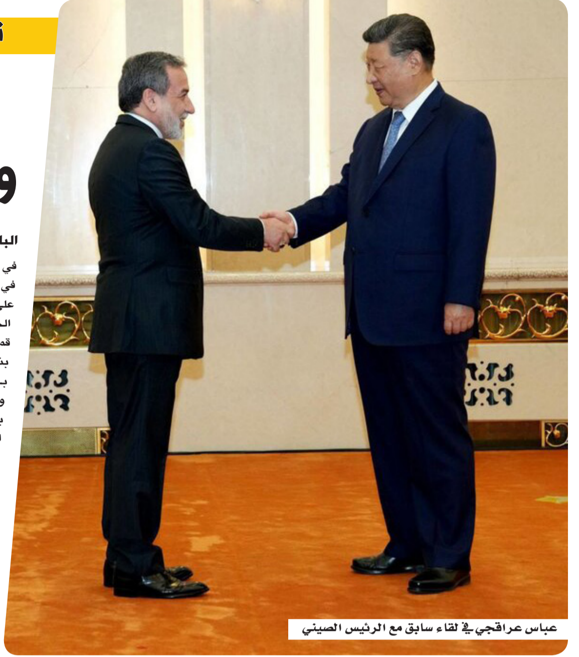
عباس عراقجي في لقاء سابق مع الرئيس الصيني

في ظل تصاعد التوترات الإقليمية، وتعدّيات المشهد في مضيق هرمز، تتكثف التحركات الدبلوماسية على خط طهران-بكين-واشنطن، مع توجه وزير الخارجية الإيراني عباس عراقجي إلى الصين، قبيل قمة مرتقبة تجمع الرئيس الأمريكي دونالد ترمب بنظيره الصيني شي جين بينغ في اجتماع يوصف بـ"النادر" منتصف مايو الجاري. وأعلنت الخارجية الإيرانية، أن زيارة عراقجي إلى بكين ستتركز على بحث العلاقات الثنائية والتطورات الإقليمية والدولية، في توقيت حساس يأتي قبل أيام من القمة الأميركية-الصينية المرتقبة يومي 14 و15 مايو، والتي اكتسبت أهمية مضاعفة على خلفية الأزمة المتصاعدة في الشرق الأوسط. في المقابل، كثفت واشنطن ضغوطها على بكين للعب دور أكثر فاعلية في احتواء الأزمة، حيث دعا وزير الخزانة الأمريكي سكوت بسنت الصين إلى تكثيف جهودها الدبلوماسية لإقناع إيران بإعادة فتح مضيق هرمز أمام الملاحة الدولية، معتبراً أن هذه القضية ستكون محورياً رئيسياً في مباحثات القمة المرتقبة.