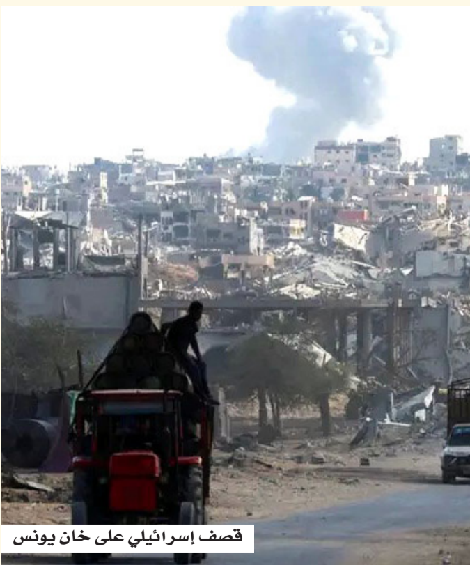
قصف إسرائيلي على خان يونس

بالتوازي، شهدت الضفة الغربية عمليات هدم وتجريف طالت منازل ومباني، خاصة في محيط رام الله، إضافة إلى حملات اعتقال ودهم في عدة مدن، بينها نابلس والخليل، ما يعكس اتساع رقعة التصعيد على الأرض. وسياسياً، أكدت جامعة الدول العربية أن تحقيق الأمن والاستقرار في المنطقة يرتبط بإنهاء الاحتلال وتمكين الشعب الفلسطيني من إقامة دولته المستقلة، داعية إلى تكثيف الجهود الدولية لوقف الانتهاكات ودعم المسار السياسي. وتعكس هذه التطورات مشهداً متوتراً يتجاوز حدود غزة ليشمل القدس والضفة الغربية، في وقت تبدو فيه التهدئة هشة، مع استمرار العمليات العسكرية وتزايد المخاوف من انزلاق الأوضاع الإنسانية متدهورة. وفي القدس، اقتحم عشرات المستوطنين باحات المسجد الأقصى