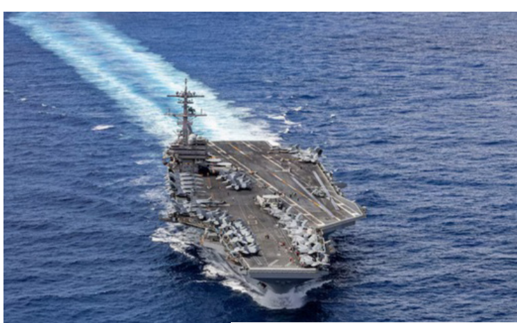
حاملة الطائرات الأمريكية جورج بوش

امتلاك بلاده قدرات عسكرية متفوقة مقارنة بالمراحل السابقة، وأكد ترمب أن طهران تقف أمام خيارين؛ إما الدخول في اتفاق "بحسن نية"، أو مواجهة استئناف العمليات العسكرية، في إشارة واضحة إلى استعداد واشنطن لتوسيع نطاق المواجهة إذا استمرت التوترات. كما أطلق تحذيراً شديد اللهجة، متوقداً برد قاس في حال تعرضت السفن الأميركية لأي هجوم أثناء عبورها مضيق هرمز، ما يعكس مستوى غير مسبوق من التصعيد في الخطاب السياسي والعسكري. وتشير هذه التحركات إلى أن منطقة الخليج تدخل مرحلة جديدة من التوتر، حيث تتقاطع الضغوط العسكرية مع رهانات سياسية معقدة، في وقت تتزايد فيه المخاوف الدولية من انزلاق الأوضاع نحو مواجهة مفتوحة، قد تهدد أمن الملاحة واستقرار الأسواق العالمية.