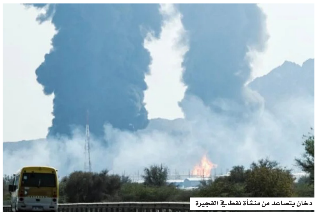
دخان يتصاعد من منشأة نفط في الفجيرة

وأكدت وزارة الخارجية الهندية، أن استهداف البنية التحتية المدنية والمدنيين أمر مرفوض، داعية إلى وقف فوري للأعمال القتالية، وذلك في أعقاب هجوم بطائرة مسيرة على منطقة الفجيرة للصناعة البترولية، والذي أعلنت أبوظبي أن إيران تفك وراءه. وشددت نيولبي على أهمية ضمان حرية الملاحة والتجارة عبر مضيق هرمز دون عوائق، وفقاً للقانون الدولي، مؤكدة استعدادها لدعم الجهود الرامية إلى تسوية سلمية