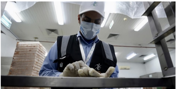
مفتش في الغذاء خلال قيامه بمهام عمله

أوضحت الهيئة العامة للغذاء والدواء الضوابط والإجراءات المعتمدة؛ للحصول على إذن الفسخ الشخصي للأدوية المقيدة مع الحجاج والمعتمرين؛ بغرض الاستخدام الشخصي، وذلك ضمن جهودها في خدمة ضيوف الرحمن، وتيسير أداء مناسكهم؛ بما يضمن راحة وسلامة قاصدي المشاعر المقدسة. وأشارت الهيئة إلى وجود عدة متطلبات تسبق عملية الحصول على إذن الفسخ، تشمل صورة جواز مقدم الطلب، وصورة من الوصفة، أو التقرير الطبي ساري الصلاحية بما لا يتجاوز 6 أشهر من تاريخ الإصدار، وصورة لعبوة الدواء وتغليفه الخارجي، إلى جانب الموافقة على الإقرار الإلكتروني المسجل ضمن الطلب قبل إرساله. كما اشترطت الالتزام بحيازة وتسجيل الكمية المسموح بها نظاماً،