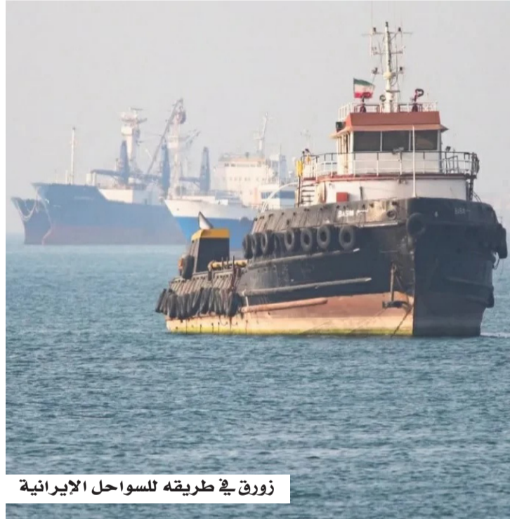
زورق في طريقه للسواحل الإيرانية

تستمر حدة التوتر في مضيق هرمز مع تبادل الاتهامات بين إيران والولايات المتحدة، على خلفية حوادث بحرية متصاعدة تهدد أمن الملاحة في أحد أهم الممرات الحيوية عالمياً. وأفادت وسائل إعلام إيرانية، نقلاً عن مصدر عسكري، بمقتل خمسة مدنيين جراء استهداف زورقين مدنيين كانوا يحملان بضائع في طريقهما إلى السواحل الإيرانية، مشيرة إلى أن الزورقين انطلقا من ميناء خصب في سلطنة عمان، ولا يتبعان لأي جهة عسكرية. في المقابل، صعد الرئيس الأمريكي دونالد ترمب من لهجته، مؤكداً أن بلاده لن تسمح لإيران بامتلاك سلاح نووي، ومعلناً أن القوات الأمريكية أغرقت سبعة زوارق إيرانية بعد محاولتها استهداف سفن جديدة للاشتباك تتيح التعامل الحاسم مع أي تهديد بحري. وأعلن الجيش الأمريكي استخدام مروحيات هجومية من طراز "أباتشي" و"سي-هوك" لتدمير زوارق إيرانية قال: إنها كانت تهدد الملاحة التجارية، مؤكداً استمرار