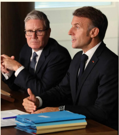
إيمانويل ماكرون وكير ستارمر في لقاء سابق