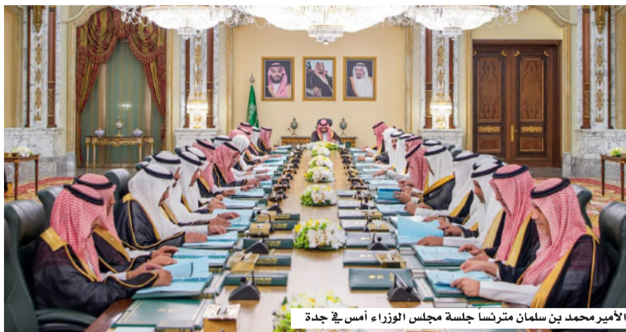
الأمير محمد بن سلمان مترشحاً لجلسة مجلس الوزراء أمس في جدة

- الموافقة على اتفاقية بين حكومة المملكة العربية السعودية، وحكومة جمهورية الهند بشأن الإعفاء المتبادل من متطلبات تأشيرة الإقامة القصيرة لحاملي جوازات السفر الدبلوماسية والخاصة والرسمية. - الموافقة على اتفاقية بين حكومة المملكة العربية السعودية، وحكومة الجمهورية التونسية حول التعاون والمساعدة المتبادلة في المسائل الجمركية. - تفويض صاحب السمو وزير الثقافة رئيس مجلس أمناء مجمع الملك سلمان العالمي للغة العربية - أو من ينوبه - بالتباحث مع الجانبين الأردني والمغربي في شأن مشروع مذكرتي تفاهم بين المجمع، وكل من مجمع اللغة العربية الأردني، وأكاديمية المملكة المغربية، في مجال خدمة اللغة العربية، والتوقيع عليهما. - الموافقة على مذكرة تفاهم للتعاون بين وزارة العدل في المملكة العربية السعودية، ووزارة القانون والعدل في جمهورية باكستان الإسلامية. - الموافقة على مذكرة تفاهم بين وزارة الصناعة والثروة المعدنية في المملكة العربية السعودية، ووزارة المنجم والطاقة في جمهورية البرازيل الاتحادية للتعاون في مجال الثروة المعدنية. - الموافقة على مذكرة تفاهم للتعاون في القطاع البريدي بين وزارة النقل والخدمات اللوجستية في المملكة العربية السعودية، ووزارة تكنولوجيا الاتصال في الجمهورية التونسية. - الموافقة على مذكرة تفاهم بين الهيئة العليا للأمن الصناعي، وجامعة نايف العربية للعلوم الأمنية، في مجال الأمن الصناعي.