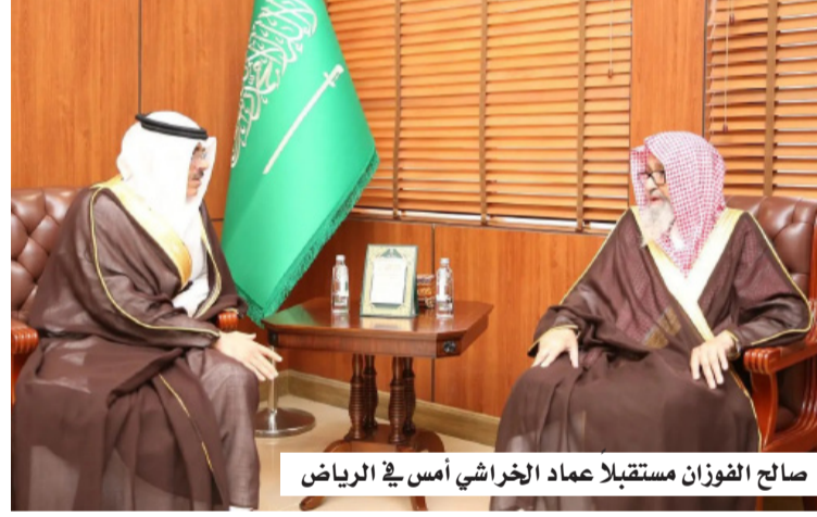
صالح الفوزان مستقبلاً عماد الخراشي أمس في الرياض

سماحتها أهمية العناية بالأوقاف وتطوير أليات إدارتها واستثمارها، بما يحقق الاستفادة ويعود بالنفع على المجتمع، منوهاً بالجهود التي تبذلها الهيئة العامة للأوقاف في تنظيم القطاع وتعزيز حوكمته. من جانبه، أعرب محافظ الهيئة العامة للأوقاف عن شكره وتقديره لسماحته على توجيهاته السديدة، مؤكداً حرص الهيئة على الاستفادة من الرأي الشرعي في تطوير أعمالها، وتحقيق رسالتها في تنمية الأوقاف وخدمة المجتمع. حضر الاستقبال الأمين العام لهيئة كبار العلماء والأمين العام للجنة الدائمة للفتوى والمشرّف العام على مكتب سماحة المفتي العام الشيخ الدكتور فهد بن سعد الماجد.