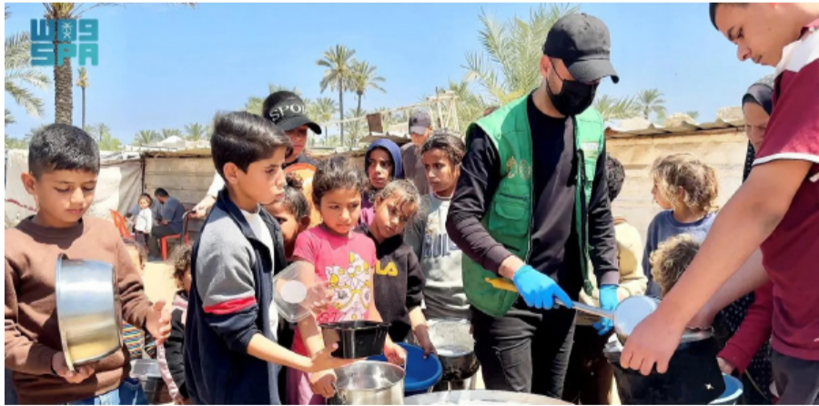
أثناء توزيع الوجبات الساخنة على الأطفال في غزة

في محافظة اللاذقية، استفادت منها 1.521 أسرة، في إطار دعم الشعب السوري والتخفيف من معاناته. وفي أفغانستان، تم توزيع 522 سلة غذائية في ولاية قندهار، استفاد منها 3.132 فرداً من العائدين والنازحين والإيتام، ضمن مشروع الأمن الغذائي لعام 2026. كما امتدت الجهود إلى جمهورية مالي، حيث وُزعت 425 سلة غذائية في إقليم موبتي استفاد منها 2.550 فرداً، و500 سلة في إقليم سيكو استفاد منها 3.000 فرد، ضمن مشروع المساعدات الغذائية. وفي السودان، وُزعت المركز 1.500 كرتون تمر في ولاية الخرطوم، استفاد منها 11.647 فرداً، ضمن مبادرة "مدد" لدعم المتضررين من الأزمة الإنسانية. وتعكس هذه المبادرات استمرار الدور الإنساني للمملكة العربية السعودية عبر مركز الملك سلمان للإغاثة، في تقديم الدعم الغذائي والإغاثي للمحتاجين والمتضررين في مختلف مناطق العالم، تأكيداً على نهجها الثابت في العمل الإنساني الدولي.