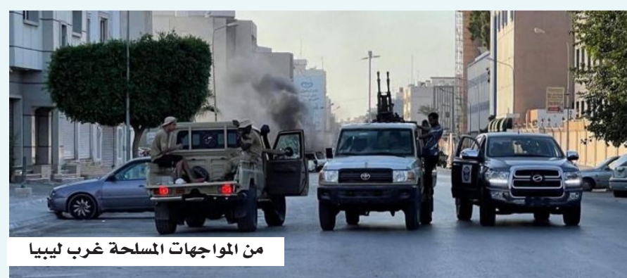
من المواجهات المسلحة غرب ليبيا

وتأتي هذه التطورات في سياق حالة عدم الاستقرار