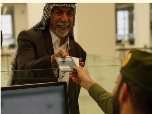
حاج عراقي لحظة وصوله جوازات منفذ جديدة عرعر

وصول أولى طلائع حجاج العراق عبر جديدة عرعر