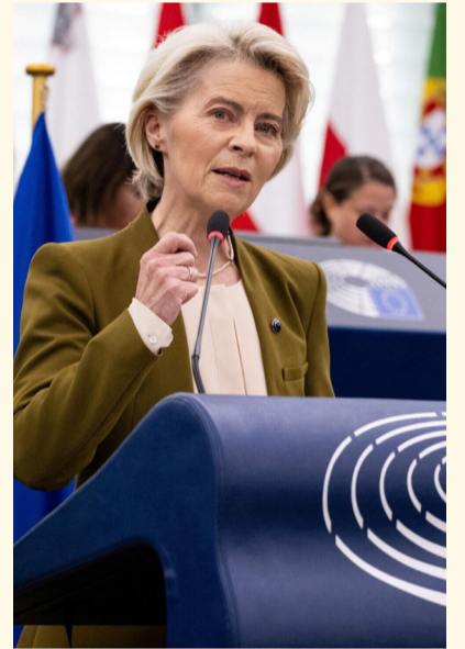
رئيسة المفوضية الأوروبية أورسولا فون دير لاين