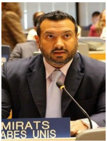
مندوب الإمارات الدائم بالأمم المتحدة جمال المشرخ

تأتي هذه التصريحات في وقت تشهد فيه العلاقات بين الغرب وإيران حالة من الجمود السياسي، وسط استمرار العقوبات الغربية وارتباطها بملفات حقوق الإنسان والبرنامج النووي الإيراني، إضافة إلى تأثيرات التوترات الإقليمية على أسواق الطاقة والاستقرار الدولي.