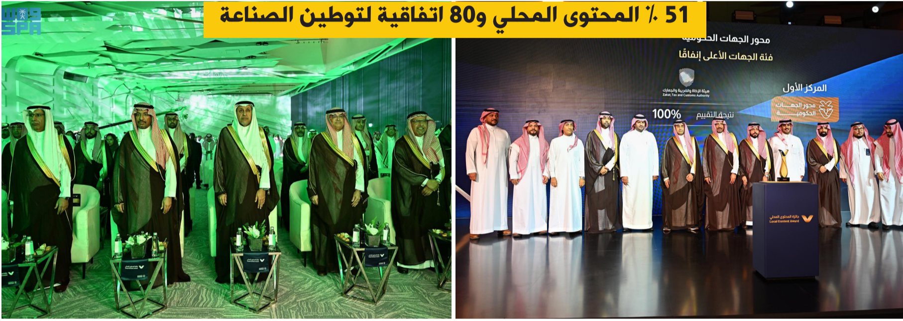
بندر الخريف خلال رعايته جائزة المحتوى المحلي

51% المحتوى المحلي و80 اتفاقية لتوطين الصناعة