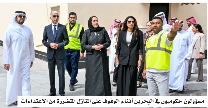
مسؤولون حكوميون في البحرين أثناء الوقوف على المنازل المتضررة من الاعتداءات

وأشار البيان إلى أن بعض الحالات شملت تمجيد، أو دعم أنشطة تصنفها السلطات ضمن تهديدات أمنية، إلى جانب مخالفات مرتبطة بالتواصل، أو التعاون مع أطراف خارجية. وتؤكد السلطات البحرينية أن هذه الإجراءات تندرج ضمن سياسة أوسع، تهدف إلى حماية الاستقرار الداخلي والتصدي لأي أنشطة يُنظر إليها؛ باعتبارها تهديداً للأمن الوطني، في ظل التوترات الإقليمية المتصاعدة. ويأتي هذا القرار في وقت تشهد فيه المنطقة توتراً سياسياً وأمنياً متزايداً، مع استمرار الخلافات بين عدد من دول الخليج وإيران، وتنامي المخاوف من تأثير هذه التوترات على الأمن الداخلي للدول.