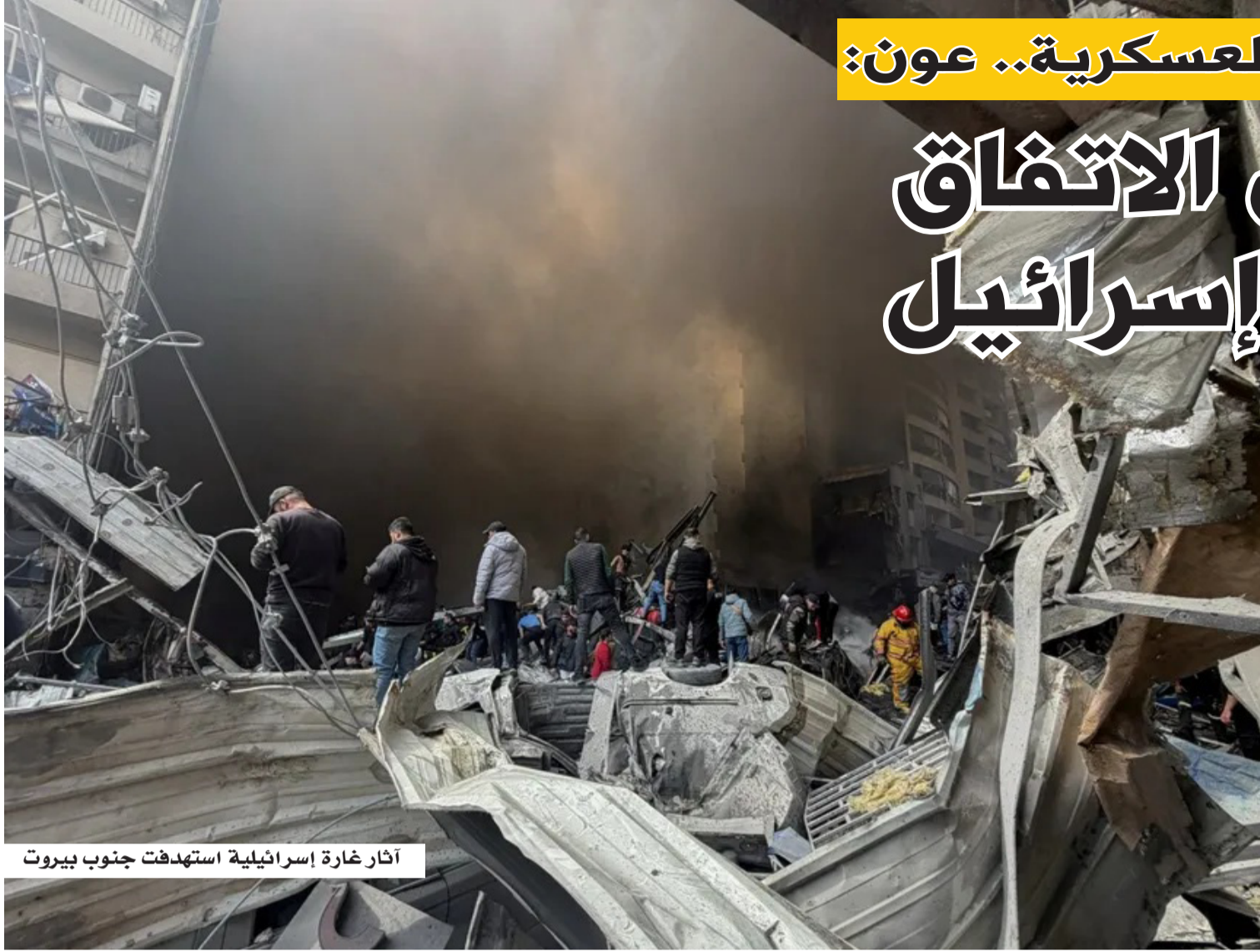
آثار غارة إسرائيلية استهدفت جنوب بيروت

وفي رد غير مباشر على انتقادات الحزب، اعتبر عون أن "الخبانة" لا تكمن في التفاوض، بل في جر البلاد إلى الحرب دون توافق وطني، في إشارة ضمنية إلى دور الحزب في التصعيد العسكري الأخير. وأضاف أن القرار بالتوجه إلى المفاوضات،