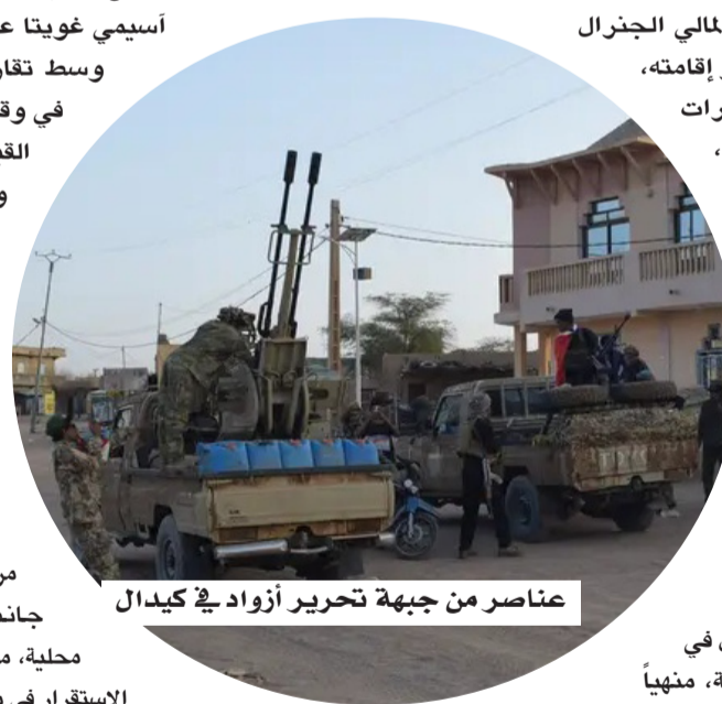
عناصر من جبهة تحرير أزواد في كيدال

وكان الجيش المالي قد استعاد كيدال في نوفمبر 2023 بدعم من قوات روسية، منهياً