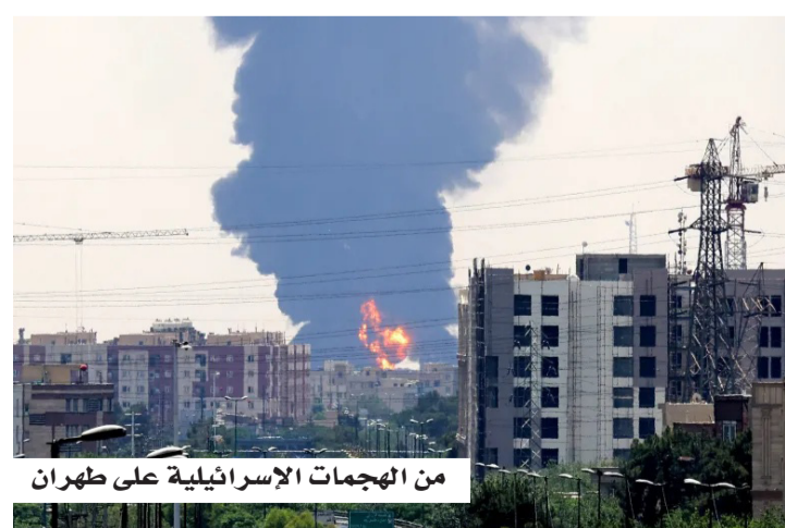
من الهجمات الإسرائيلية على طهران

وكانت السلطات الباكستانية قد نشرت آلاف العناصر الأمنية، من الجيش وقوات الشرطة والأجهزة الاستخباراتية، لتأمين المفاوضات التي استضافتها العاصمة في وقت سابق من الشهر، والتي لم تُفض إلى نتائج حاسمة