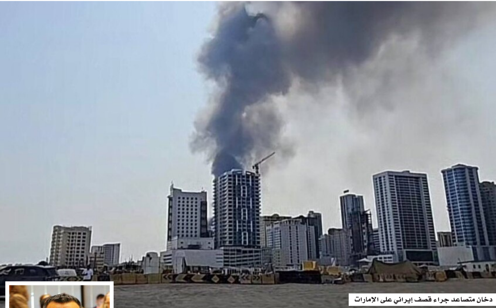
دخان متصاعد جراء قصف إيراني على الإمارات

المفوضية الأوروبية تشدد موقفها وتؤكد: رفع عقوبات إيران مشروط بتغيير جذري