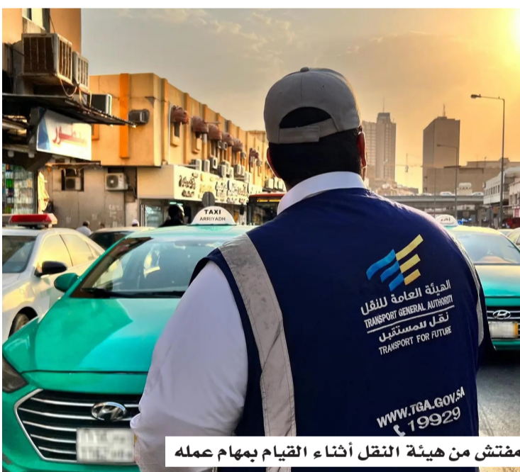
مفتش من هيئة النقل أثناء القيام بهام عمله

من شهر ذي الحجة 1447هـ، وتصل العقوبات إلى المطالبة بمصادرة وسيلة النقل البري التي يثبت استخدامها في ذلك، وكانت مملوكة للناقل أو المسافر أو المتواطئ معه، وذلك بعد الطلب من المحكمة المختصة للحكم في ذلك. وأكدت الهيئة على جميع الناقلين المرخصين أهمية استيفاء المتطلبات النظامية، بما في ذلك الحصول على التراخيص وبيانات التشغيل للمركبات والسائقين، والالتزام بالمسارات المحددة، وعدم دخول المناطق الخاضعة لتنظيمات الحج دون تصريح مسبق، مع التعاون الكامل مع الجهات الأمنية والرقابية في نقاط الفرز والمراقبة. وشددت الهيئة على أن هذا الإجراء يُعد أحد مكونات خطتها التشغيلية لموسم الحج؛ بهدف دعم مستويات الامتثال والسلامة، وضمان انسيابية نقل الحجاج المصرح لهم، بما يعكس جودة وكفاءة خدمات النقل المقدمة خلال الموسم، مؤكدة أن مخالفة هذه التعليمات تعرض مرتكبيها للعقوبات.