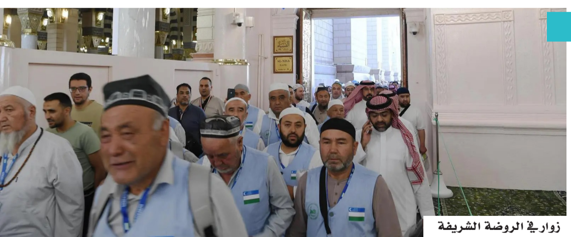
زوار في الروضة الشريفة