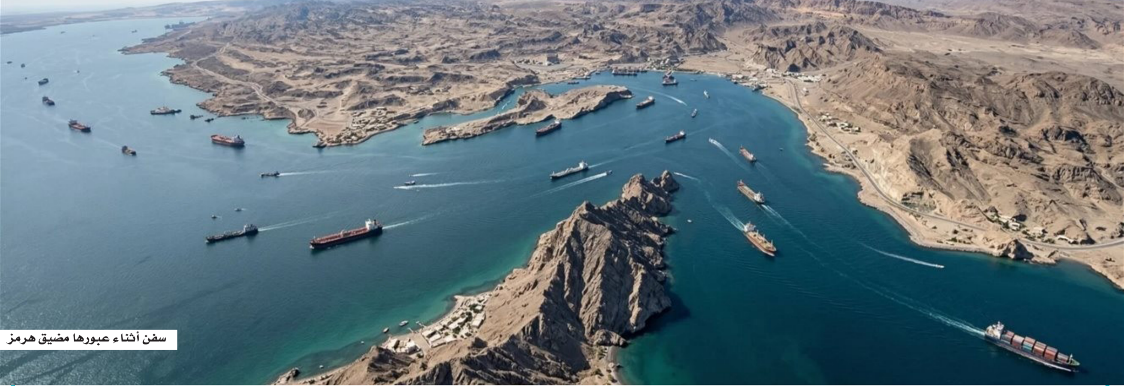
سفن أثناء عبورها مضيق هرمز