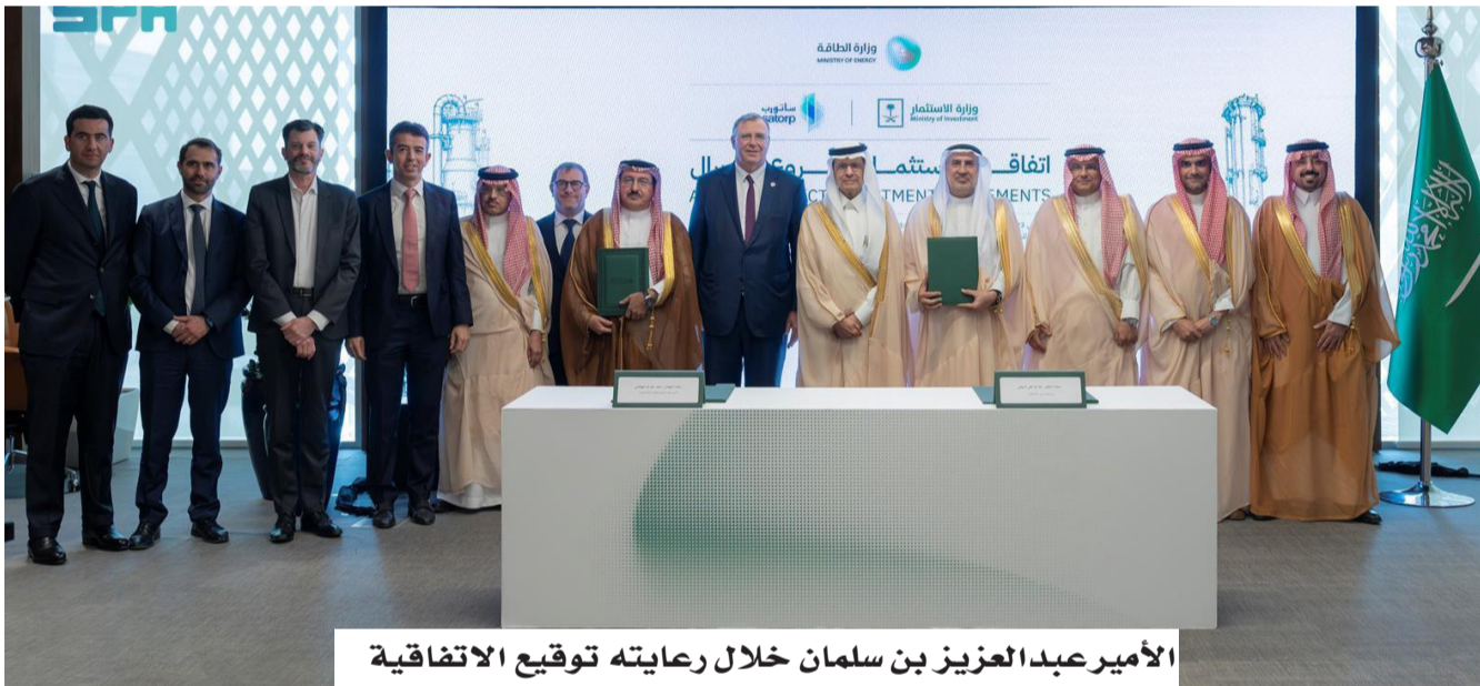
الأمير عبدالعزيز بن سلمان خلال رعايته توقيع الاتفاقية

برعاية وحضور صاحب السمو الملكي الأمير عبدالعزيز بن سلمان وزير الطاقة، وقعت وزارة الاستثمار اتفاقية استثمارية مع شركة ساتورب لتطوير مشروع أميرال، المشترك بين (أرامكو السعودية) و(توتال)، لدعم توطين سلاسل القيمة في قطاع البتروكيماويات، وتعزيز نمو الصناعات التحويلية في المملكة. يستهدف المشروع تطوير وإنتاج مواد بتروكيماوية متقدمة تساهم في تمكين قطاعات صناعية حيوية، من بينها صناعة السيارات والإنشاءات، بما يعزز القيمة المضافة للموارد الطبيعية، ويدعم تنمية الصادرات غير النفطية ورفع مستوى توطين الصناعات المحلية.