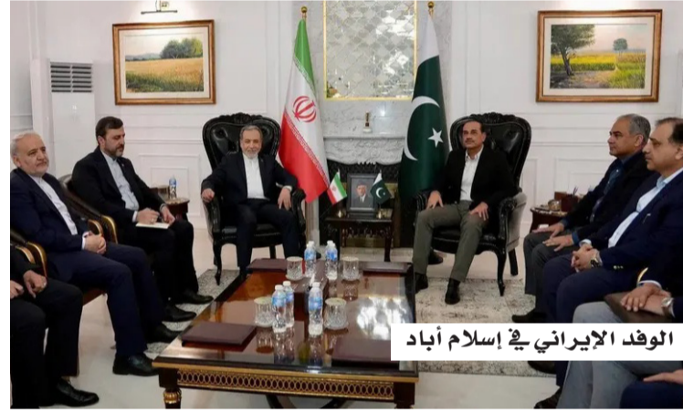
الوفد الإيراني في إسلام آباد

وكشفت الخارجية الإيرانية، أمس (السبت)، أن الوزير عباس عراقجي شرح خلال لقاءه رئيس وزراء باكستان شهباز شريف في إسلام