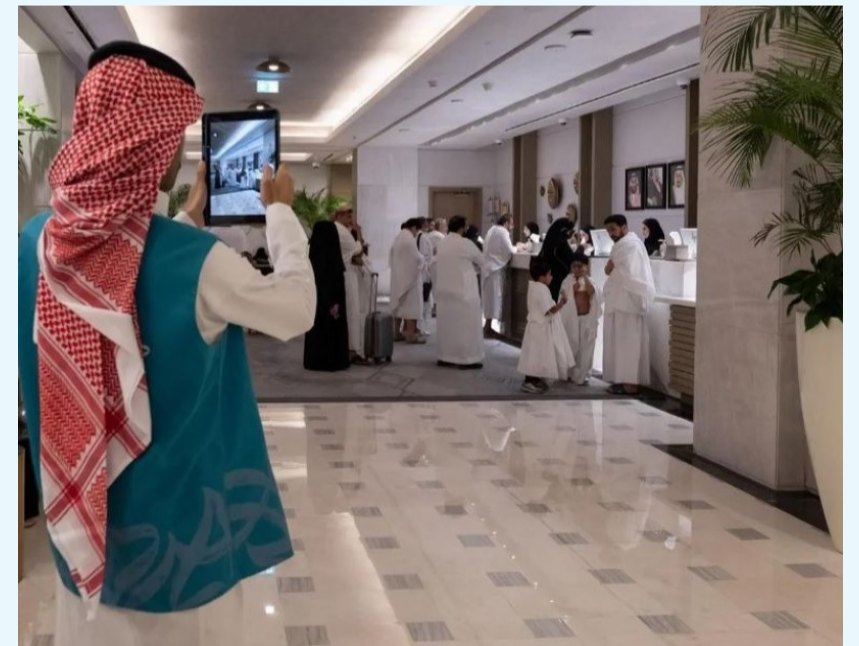
موقع لاياؤ ضيوف الرحمن

كشفت وزارة السياحة رقابتها الميدانية استعداداً لموسم الحج 1447هـ، حيث نشر حساب وزارة السياحة على منصة إكس تنفيذ أكثر من 19 ألف زيارة رقابية على مرافق الضيافة السياحية، والنزل المؤقتة في مكة المكرمة والمدينة المنورة؛ لضمان جاهزية القطاع لاستقبال ضيوف الرحمن، وفق أعلى معايير الجودة والخدمة. وشملت الجولات أكثر من 11 ألف زيارة في مكة المكرمة، ونحو 5 آلاف زيارة في المدينة المنورة، ركزت على التحقق من التزام المنشآت بالاشتراطات النظامية، ومستويات الخدمة المقدمة للحجاج. كما نفذت الفرق الرقابية أكثر من 3 آلاف زيارة مخصصة للنزل المؤقتة في مكة، للتأكد من جاهزيتها وجودة خدماتها قبل بدء الموسم.