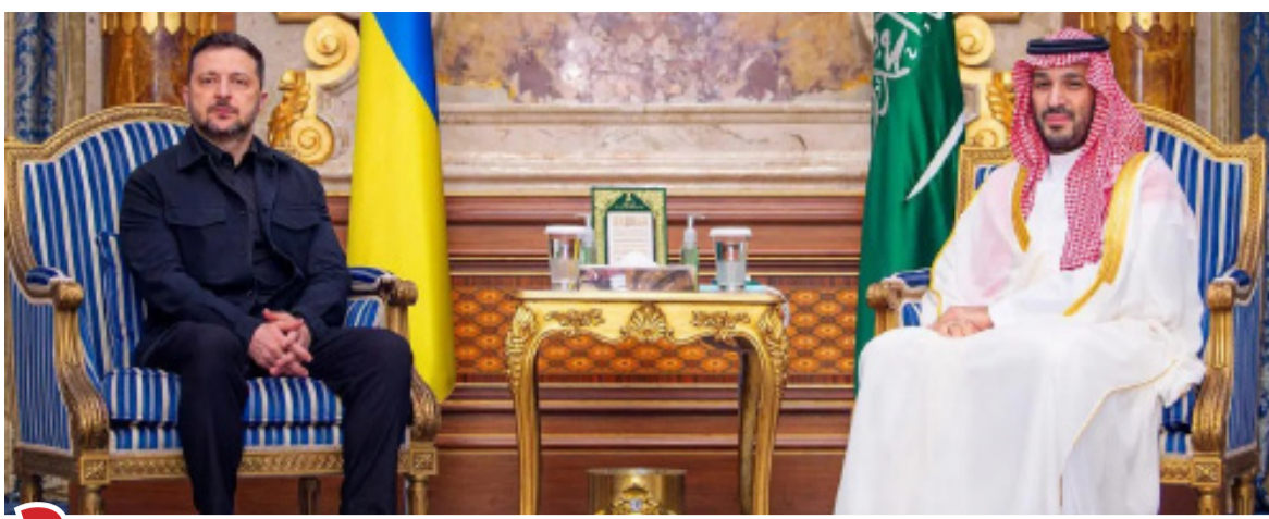
3 ولي العهد والرئيس الأوكراني يبحثان التطورات الإقليمية والدولية