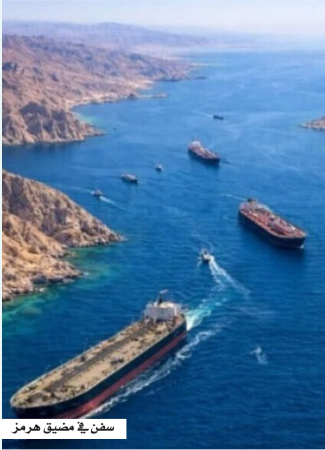
سفن في مضيق هرمز

وترتبط إيران عودتها إلى طاولة المفاوضات برفع الحصار البحري الذي فرضته الولايات المتحدة على موانئها منذ 13 أبريل، عقب تعثر الجولة السابقة من المحادثات. في المقابل، تتمسك واشنطن باستمرار الحصار، مشترطة تحقيق تقدم ملموس وتلبية مطالبها قبل أي تخفيف للإجراءات.