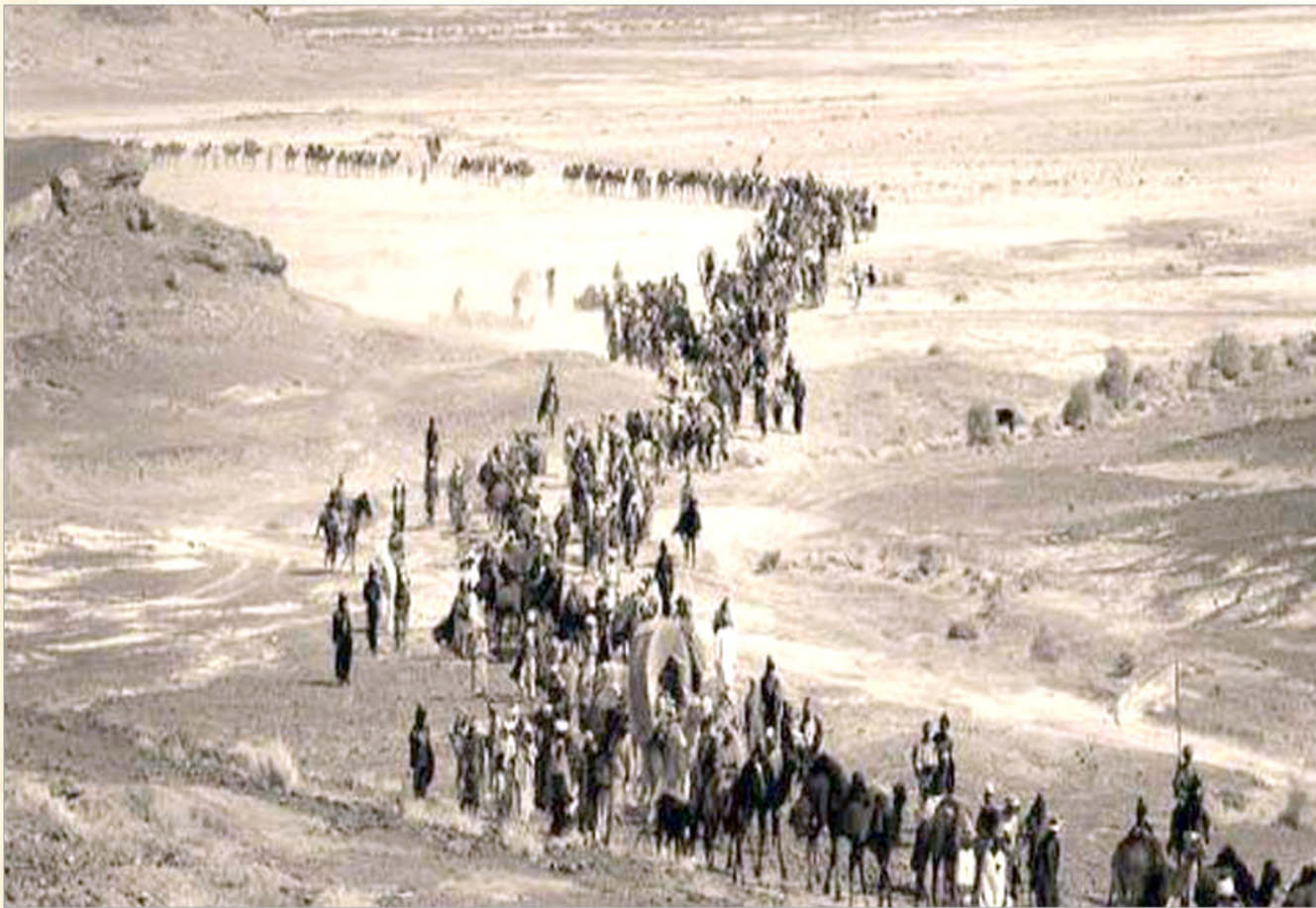
قوافل الحجيج متجهة إلى مكة لأداء فريضة الحج