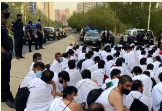
حجاج مخالضون تم ضبطهم في وقت سابق

100 غرامة لمخالفة ألف ريال «تأشيرات الحج»