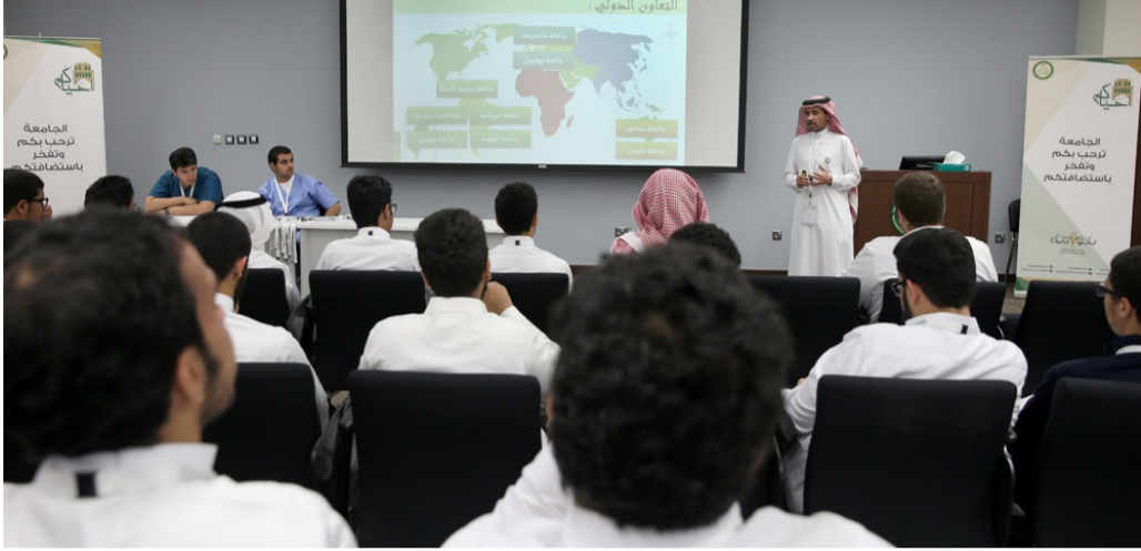
طلاب موهبة أثناء زيارة لهم لجامعة المؤسس

ويملك المؤشر بعداً اقتصادياً مباشراً، إذ تشير تقديرات البنك الدولي إلى أن كل انحراف معياري واحد في قيمة المؤشر يرتبط بزيادة تقارب 1% في نصيب الفرد من الناتج المحلي الإجمالي على المدى الطويل. وتعكس هذه النتائج جهود المملكة في تطوير التعليم وتعزيز جودة البيانات الدولية، من خلال العمل المشترك بين وزارة التعليم ووزارة الاقتصاد والتخطيط وهيئة الحكومة الرقمية والهيئة العامة للإحصاء.