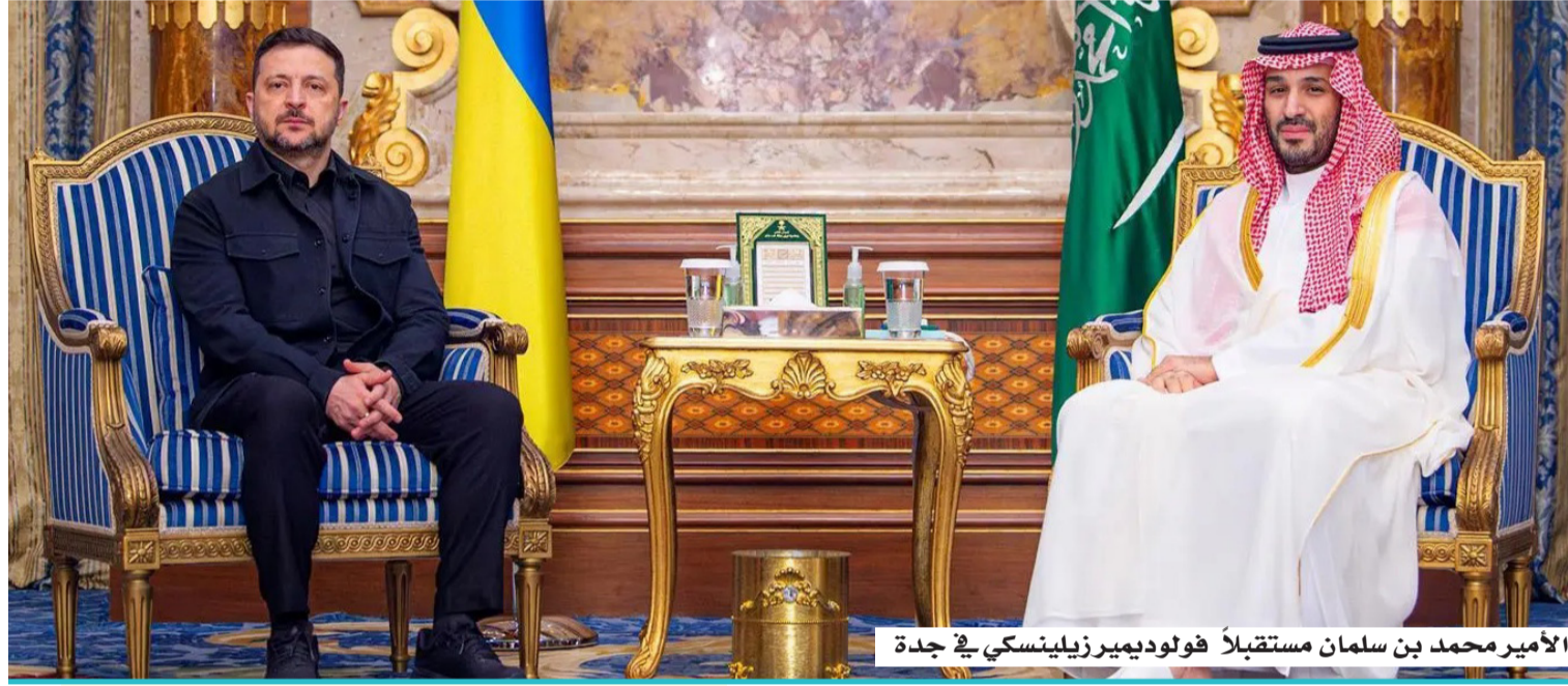
الأمير محمد بن سلمان مستقبلاً فولوديمير زيلينسكي في جدة