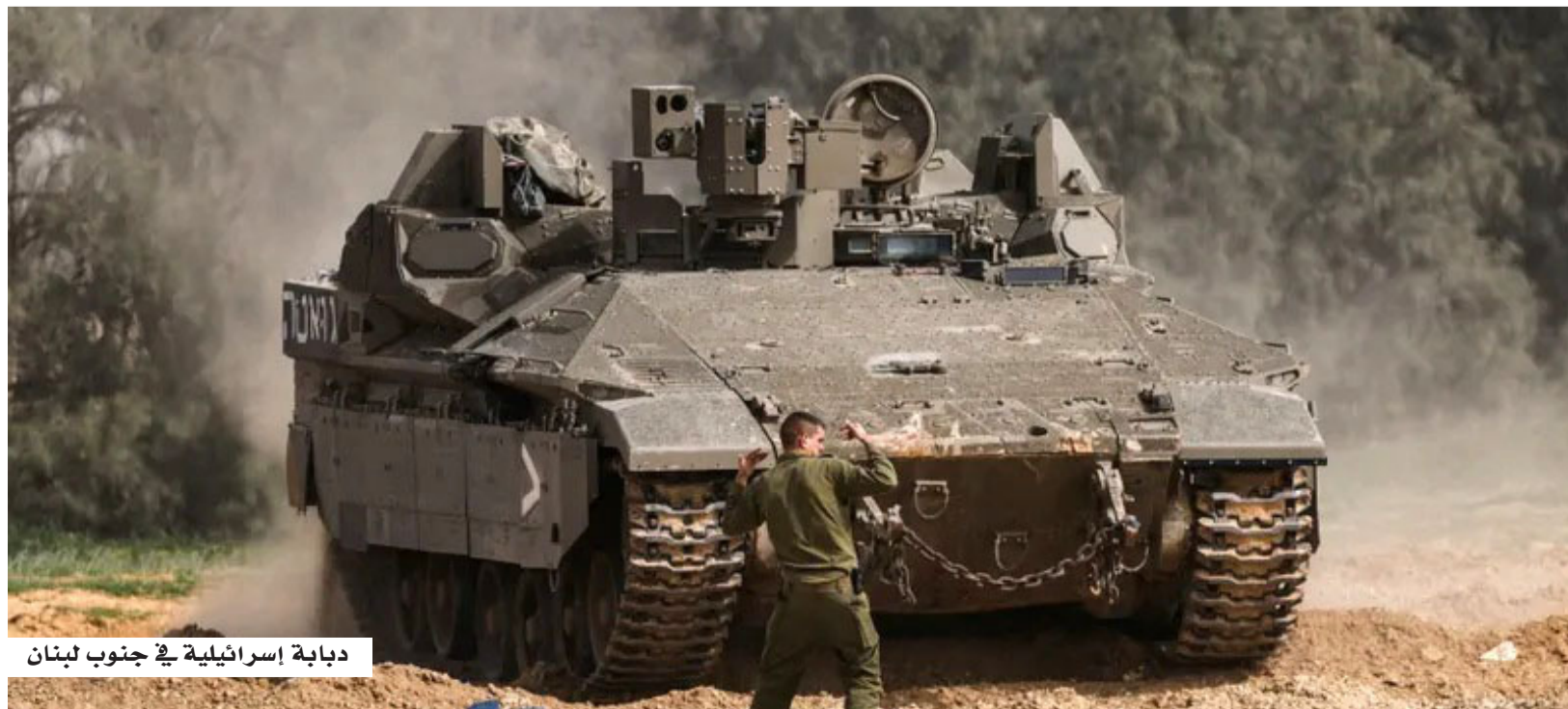
دبابة إسرائيلية في جنوب لبنان

وشملت التحذيرات بلدات عدة، من بينها الناقورة