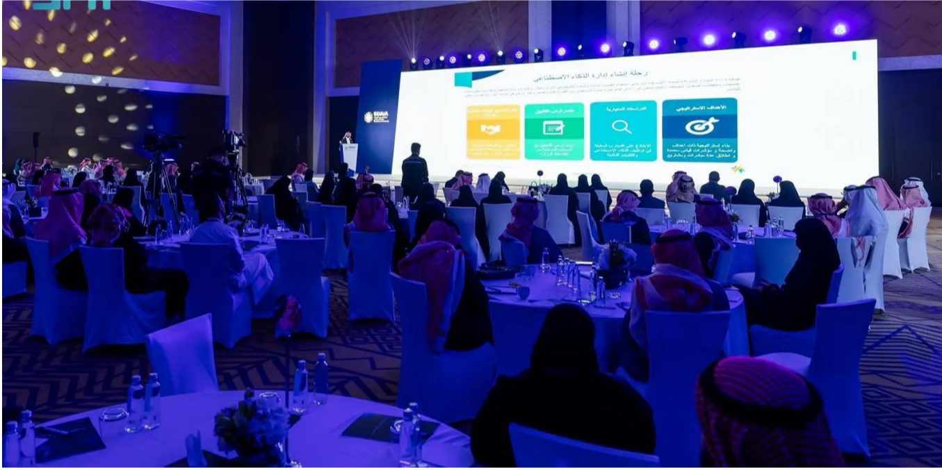
مؤتمر سابق لسدايا عن البيانات والذكاء الاصطناعي

على البيانات والذكاء الاصطناعي. تأتي هذه المشاركة، التي تتزامن مع عام 2026 للذكاء الاصطناعي، امتداداً لجهود "سدايا" في تمثيل المملكة في المحافل الدولية ذات الصلة وتعزيز الدور الفاعل في المبادرات العالمية المعنية بحوكمة الذكاء الاصطناعي، ما يساهم في تبني أفضل الممارسات الدولية وترسيخ مبادئ الاستخدام المسؤول للتقنيات المتقدمة، ويعزز من مكانة المملكة؛ كشريك دولي مؤثر في رسم مستقبل الذكاء الاصطناعي.