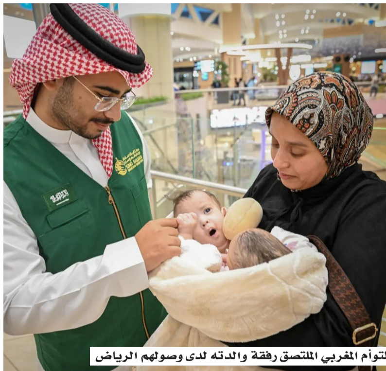
التوأّم المغربي الملتصق رفقة والدته لدى وصولهم الرياض