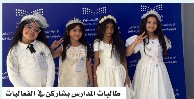
طالبات المدارس يشاركن في الفعاليات

شارك فرع وزارة البيئة والمياه والزراعة بمنطقة مكة المكرمة في فعاليات اليوم العالمي للمسؤولية الاجتماعية بمحافظة جدة.