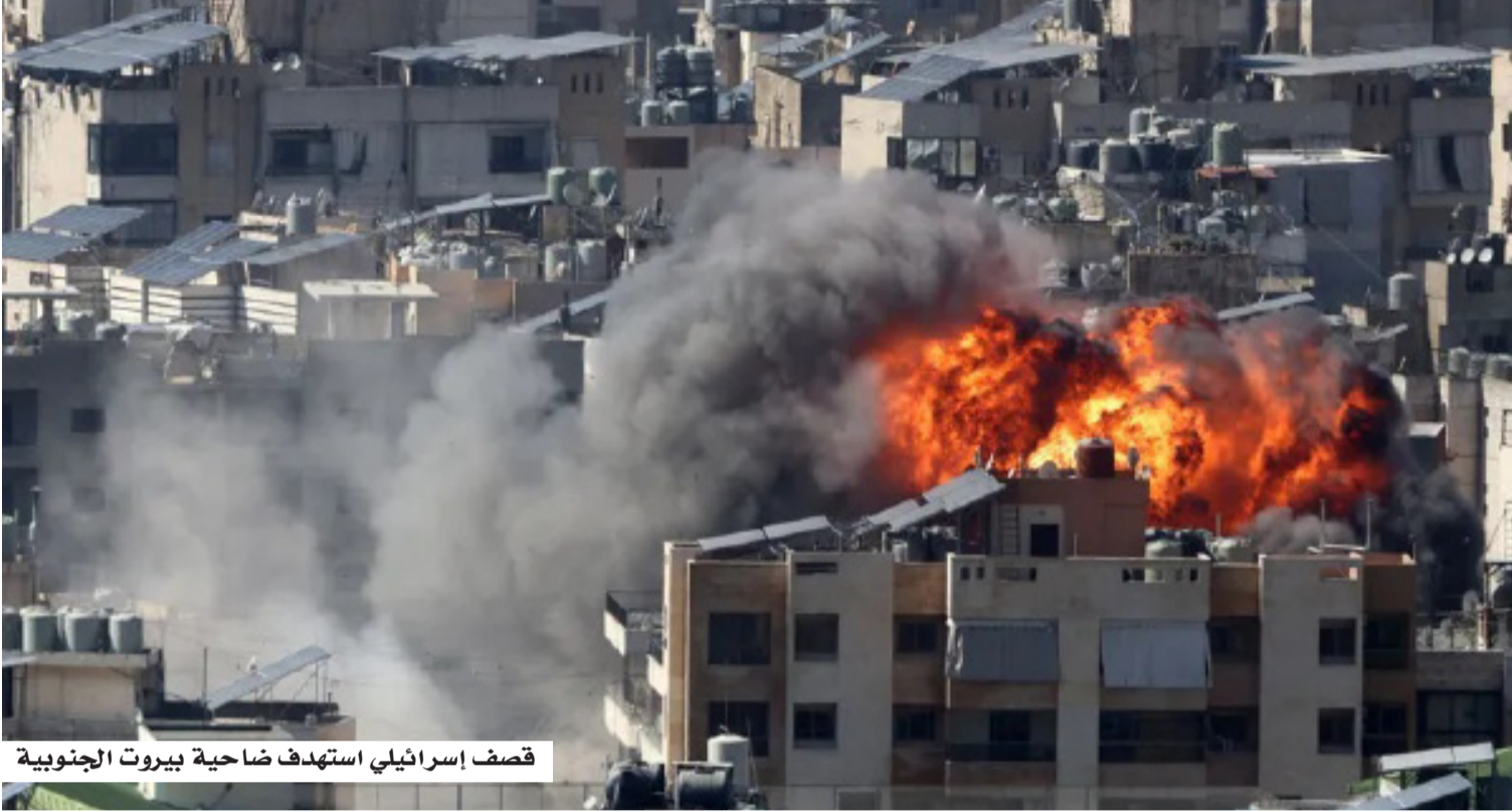
قصف إسرائيلي استهدف ضاحية بيروت الجنوبية