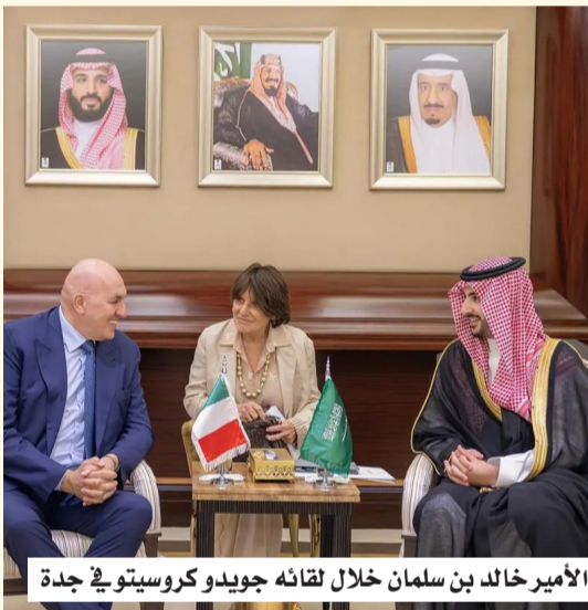
الأمير خالد بن سلمان خلال لقائه جويدو كروستيتو في جدة