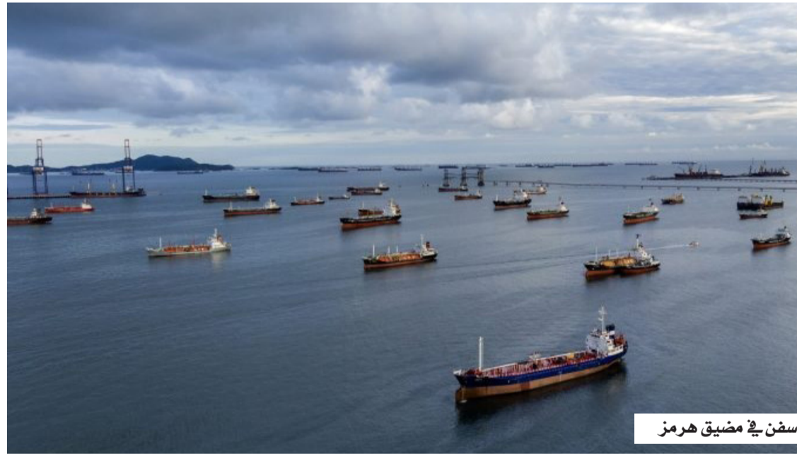
سفن في مضيق هرمز

أعربت الأمانة العامة لمنظمة التعاون الإسلامي عن إدانتها واستنكارها الشديدتين للمخطط الإرهابي، الذي كان يستهدف المساس بأمن واستقرار، ووحدته دولة الإمارات العربية المتحدة، والذي تمكنت الأجهزة الأمنية الإماراتية من إحباطه؛ بفضل يقظتها وكفاءتها العالية في التعامل مع التهديدات الأمنية. وأكدت الأمانة العامة أن هذا المخطط يعكس خطورة محاولات استهداف الدول الأعضاء في المنظمة عبر أعمال العنف والتطرف، مشيدة في الوقت ذاته بجهود الأجهزة الأمنية الإماراتية في حماية أمن البلاد، والحفاظ على استقرارها وسلامة مواطنيها والمقيمين على أراضيها. وجددت منظمة التعاون الإسلامي موقفها الثابت والرافض لجميع أشكال