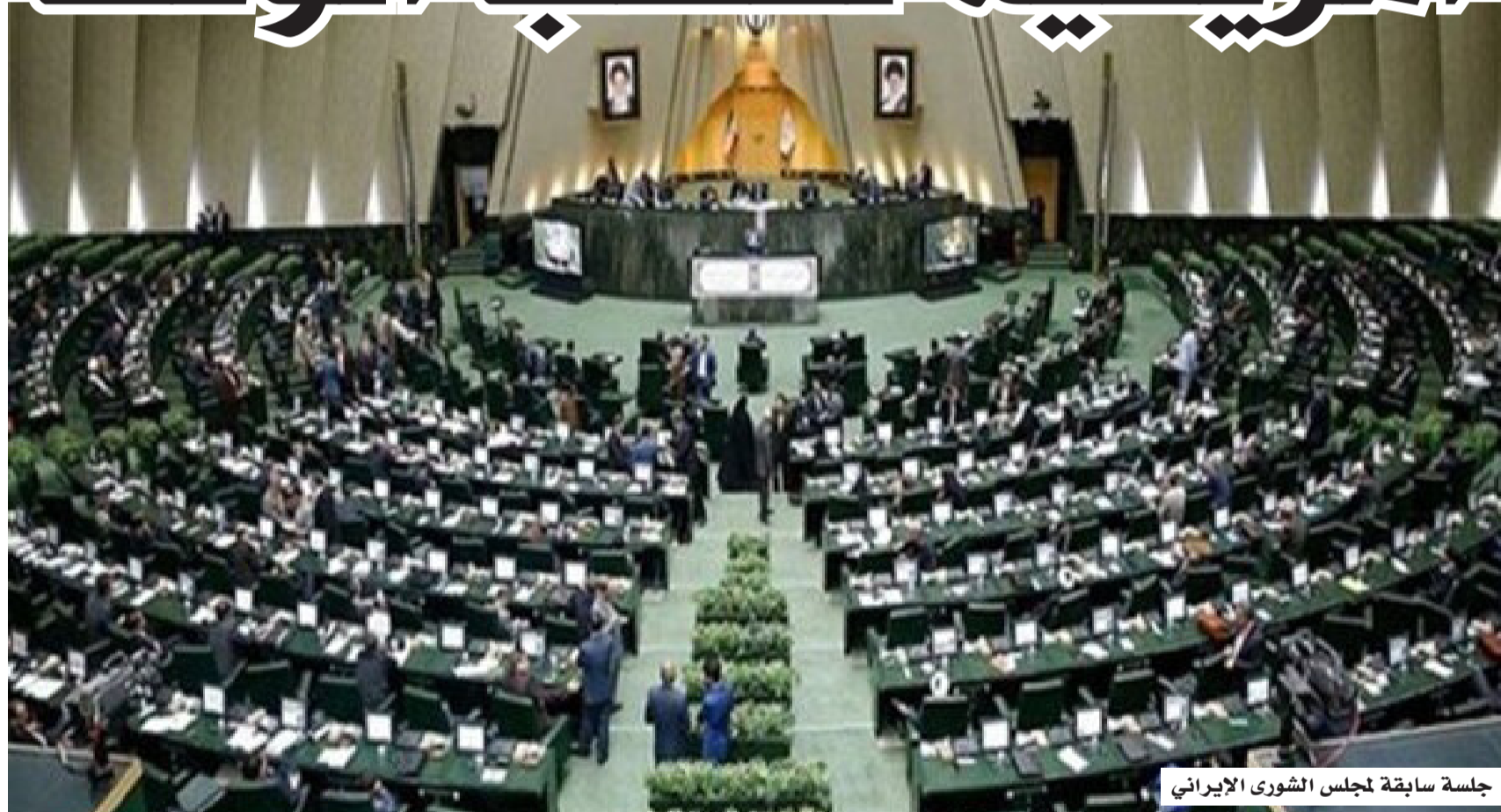
جلسة سابقة لمجلس الشورى الإيراني