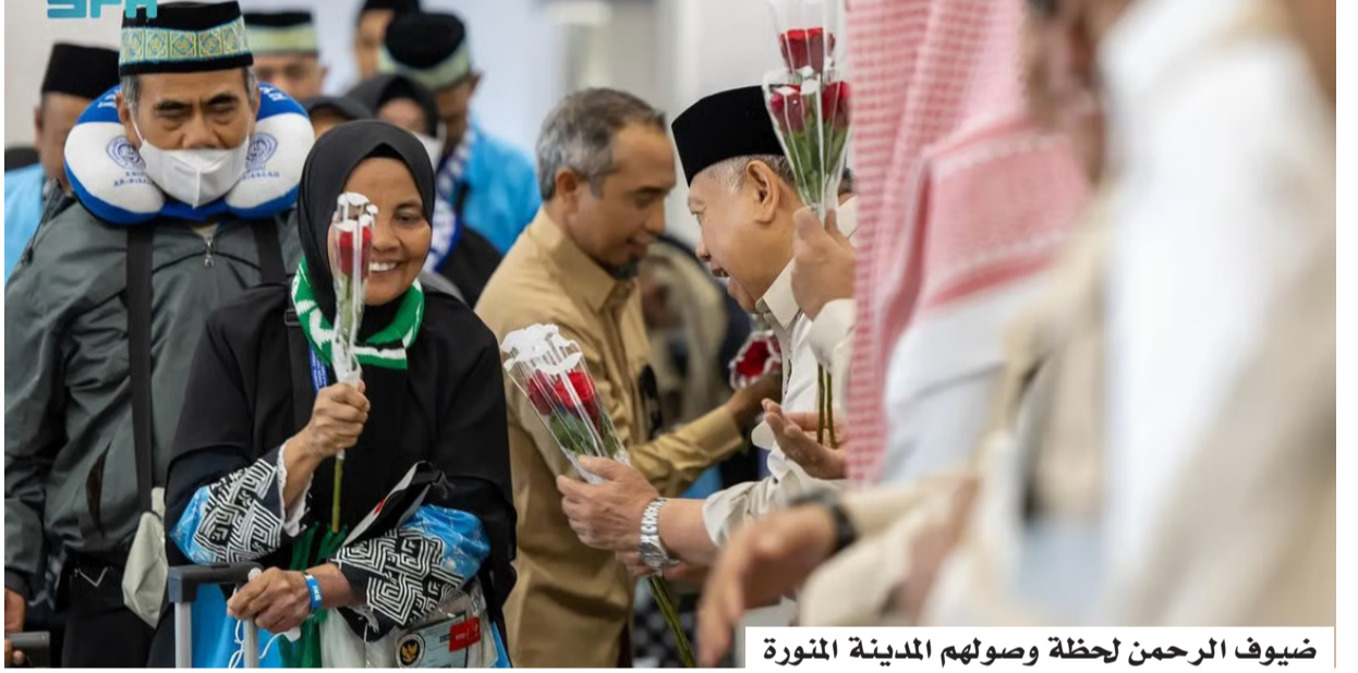
ضيوف الرحمن لحظة وصولهم المدينة المنورة

بالتعاون مع وزارات الخارجية، والصحة، والحج والعمرة، والإعلام، والهيئة العامة للطيران المدني، وهيئة الزكاة والضريبة والجمارك، والهيئة السعودية للبيانات والذكاء الاصطناعي (سدايا)، والهيئة العامة للأوقاف، وبرنامج خدمة ضيوف الرحمن، والمديرية العامة للجوازات، بالتكامل مع الشريك الرقمي (مجموعة STC). ومن الجدير بالذكر أن المبادرة شهدت منذ إنطلاقها عام (1438 هـ / 2017 م) خدمة (1,254,994) حاجاً.