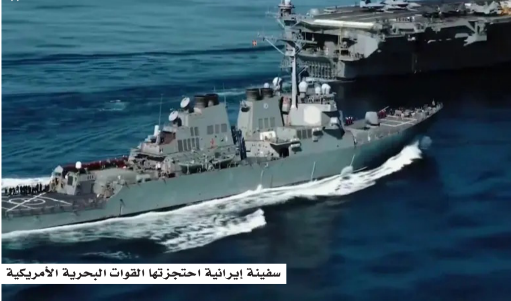
سفينة إيرانية احتجزتها القوات البحرية الأمريكية

لها هامشاً أوسع للمناورة في مواجهة القيود المفروضة على حركة التجارة البحرية. وكانت الولايات المتحدة قد فرضت حصاراً بحرياً على إيران في 13 أبريل، بعد أيام من إعلان وقف إطلاق النار بين الطرفين، في خطوة اعتبرتها طهران انتهاكاً مباشراً للتهنية، وتصعيداً اقتصادياً موازياً للضغوط العسكرية.