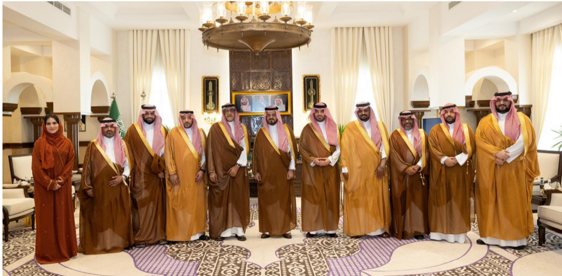
الأمير سعود بن مشعل خلال استقباله رئيس وأعضاء مجلس غرفة جدة