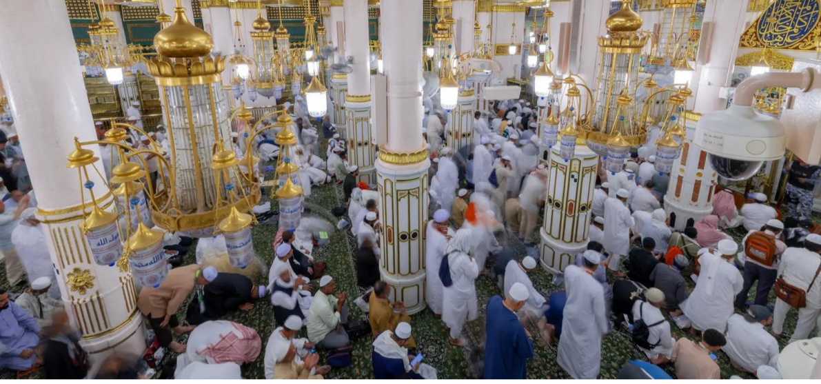
ضيوف الرحمن في المسجد النبوي الشريف

شاملة، وتهيئة مسارات لكبار السن والأشخاص ذوي الإعاقة، وتفعيل شاشات الإرشاد الإلكترونية لتوعية الحجاج في مجال تسهيل الحركة وإرشادات الزيارة بعدة لغات، إضافة إلى الخدمات الدينية، والبرامج النوعية، وترجمة الخطب، ومراكز ضيافة الأطفال، وتنظيم مواعيد الزيارة في الروضة الشريفة للرجال والنساء. ووثقت اليوم مشاهد لضيوف الرحمن في أرجاء المسجد النبوي وساحاته، وهم يقضون أوقاتهم في رحابه بين صلاة، وذكر، ودعاء، وتلاوة في أجواء إيمانية خاشعة، تجسد جانباً من أوجه العناية والرعاية بضيوف الرحمن، ليؤدوا مناسك الحج في أمن وسكينة واطمئنان.