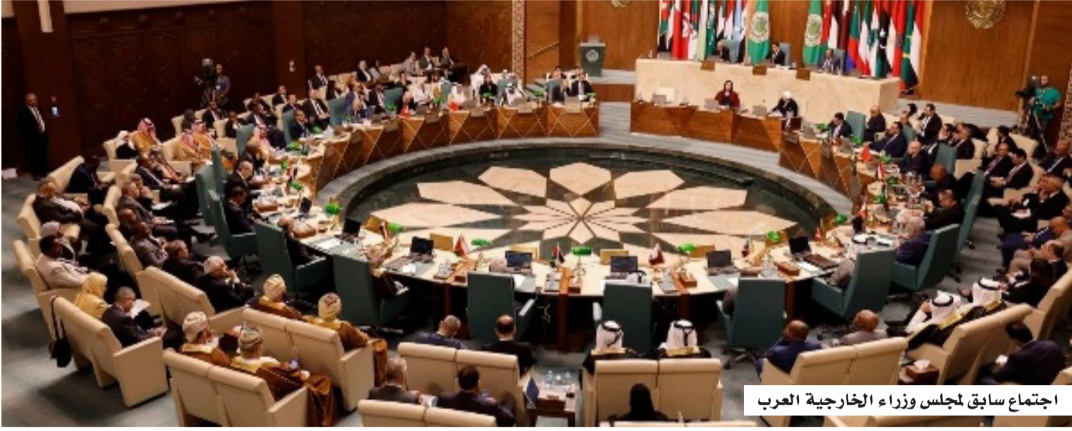
اجتماع سابق لمجلس وزراء الخارجية العرب

وأكد القرار أيضاً حق الدول العربية في الدفاع عن النفس فردياً أو جماعياً وفق المادة 51 من ميثاق الأمم المتحدة، واتخاذ ما يلزم من إجراءات لحماية سيادتها وأمنها. وكلف المجلس البعثات العربية والمنظمات الدولية بنقل مضمون القرار إلى الجهات المعنية، فيما طلب من الأمين العام لجامعة الدول العربية متابعة تنفيذ القرار، ورفع تقرير بشأنه في الدورة المقبلة.