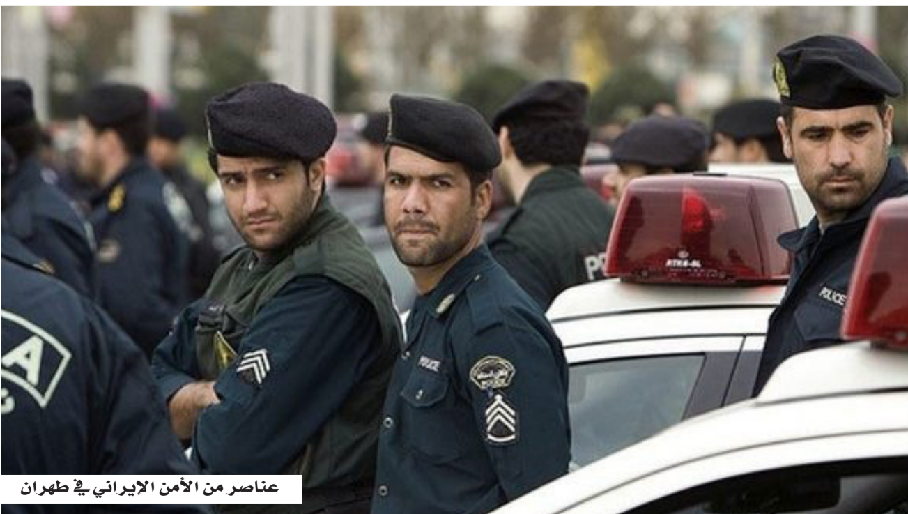
عناصر من الأمن الإيراني في طهران

وبحسب الرواية الرسمية، فإن المدان كان على صلة بجهاز الموساد، حيث أُنهم بتزويده بمعلومات حساسة تتعلق بالبنية التحتية الحيوية، إضافة إلى تنفيذ أنشطة تقنية وُصفت بأنها «تخريبية»، من بينها ربط خوادم مؤسسة حساسة بملفات ملوثة بتوجيه مباشر من