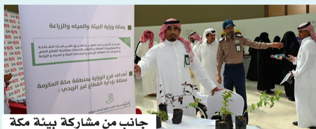
جانب من مشاركة بيئية مكة