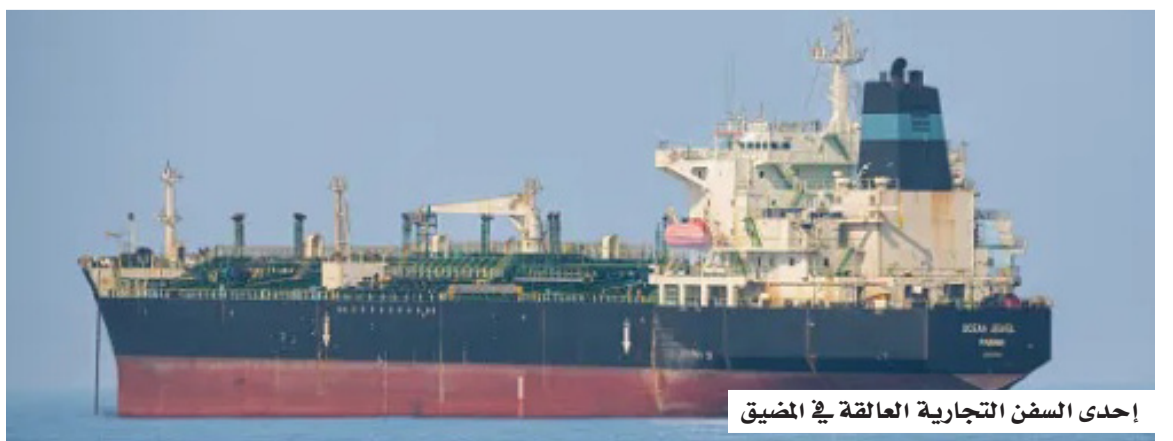
إحدى السفن التجارية العالقة في المضيق

حذر المدير التنفيذي لمكتب الأمم المتحدة لخدمات المشاريع جورج موريرا دا سيلفا من حدوث أزمة إنسانية واسعة؛ إذا لم يتم التوصل إلى حل فوري، يتيح مرور الأسمدة والمواد الخام المرتبطة بها عبر مضيق هرمز في الوقت المناسب لموسم الزراعة الذي بدأ بالفعل. وأوضح دا سيلفا، الذي يرأس فريق عمل الأمم المتحدة المعني بمضيق هرمز، أن اضطراب الملاحة عبر المضيق بدأ يؤثر على سلسلة إمداد الأسمدة على مستوى العالم؛ إذ إن نحو ثلث تجارة الأسمدة العالمية يمر عبر المضيق، مبيناً أن تعطل تدفق المواد الخام المرتبطة بها، مثل اليوريا والأمونيا والكبريت، ينعكس