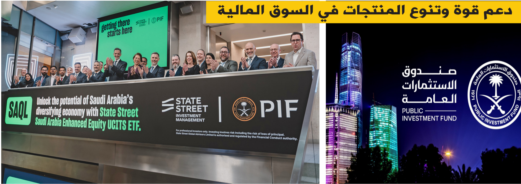
مسؤولو السيادي السعودي و ستيت ستريت لدى إطلاق الصندوق

والنرويج وإسبانيا والسويد والمملكة المتحدة.