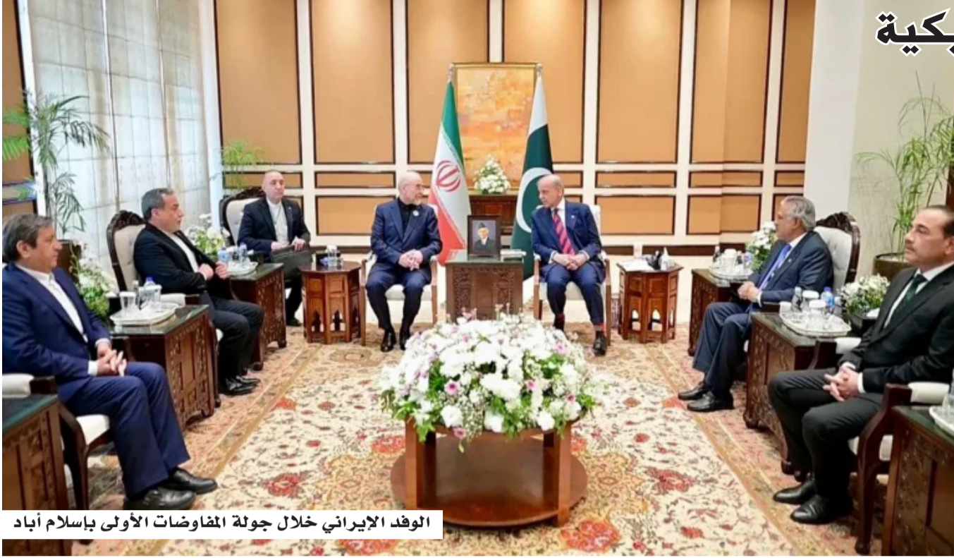
الوفد الإيراني خلال جولة المفاوضات الأولى بإسلام آباد