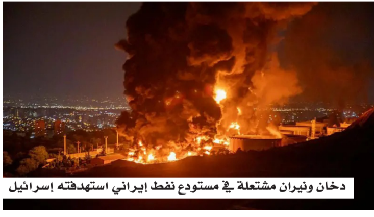
دخان وتيران مشتعلة في مستودع نفط إيراني استهدفته إسرائيل

نأتي هذه التصريحات بعد ساعات من إعلان الرئيس الأميركي دونالد ترامب تمديد وقف إطلاق النار؛ لإسحاح المجال أمام مزيد من المحادثات، في خطوة وُصفت بأنها أحادية الجانب، خاصة مع غياب موقف إيراني رسمي واضح حتى الآن. ورغم إعلان واشنطن تعليق عملياتها العسكرية استجابة لوساطة باكستانية، فإنها أكدت في الوقت ذاته استمرار الحصار البحري على إيران، وهو ما تعتبره طهران عملاً حربياً، ما يزيد من تعقيد فرص التهنية.