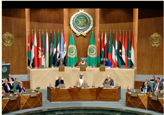
مسؤولو منظمة التعاون الإسلامي خلال مناسبة سابقة

التحكم في "هرمز" لأنها لا تملكه، وكل ما يفرضه من إجراءات لتقييد حرية الملاحة، أو فرض قواعد تمييزية للمرور ليس له سند في القانون أو العرف المستقر. وقال أبو الغيط: "إن الجامعة العربية تعد الاعتداء على أي دولة عربية، أو ممارسة التهديد اعتداءً على الدول العربية جميعاً، وجميعنا يقف صفاً واحداً في التضامن مع الدول التي تعرضت للهجمات الآثمة، وفي تقديم التقدير والتحية