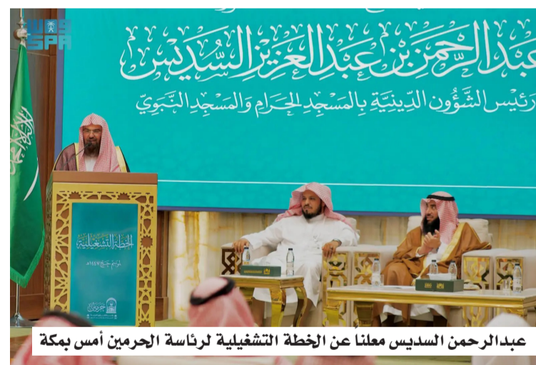
عبدالرحمن السديس يعلن عن الخطة التشغيلية لرئاسة الحرمين أمس بمكة

مقدمة وتقيات حديثة تسهم في خدمة ضيوف الرحمن، وإيصال الرسالة الوسطية للرحمن الشريفين إلى مختلف أنحاء العالم. وأكد أن الخطة التشغيلية لحج 1447هـ، تتنقل