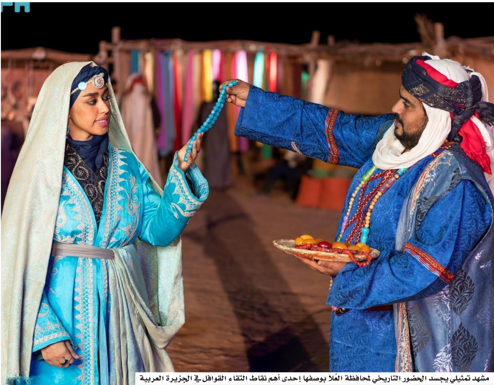
مشهد تمثيلي يجسد الحضور التاريخي لمحافظة العُلا بوصفها إحدى أهم نقاط التقاء القوافل في الجزيرة العربية

أكدت الهيئة العامة للغذاء والدواء، أن على جميع المصانع والمستودعات الغذائية ضرورة الالتزام بأحكام نظام الغذاء ولائحته التنفيذية، وعدم مزاوله نشاط تصنيع أو تخزين المواد الغذائية، دون الحصول على التراخيص النظامية اللازمة، مشيرة إلى أن سلامة غذاء ودواء الحجاج أولوية قصوى، ولن يتم التهاون مع كل من يخالف أنظمتها ولو أضعافاً مضاعفة. وشددت الهيئة على أهمية عدم تخزين المنتجات خارج حدود المنشأة المرخصة، وعدم إعادة فتح المنشآت بعد إغلاقها إلا بعد استيفاء جميع المتطلبات النظامية والحصول على موافقتها، وعدم تداول منتجات مخالفة للوائح والاشتراطات المعتمدة، مؤكدة أن ذلك يأتي في إطار تعزيز سلامة الغذاء، وحماية صحة المستهلك، خصوصاً خلال موسم الحج، الذي تشارك فيه الهيئة ضمن العديد من القطاعات الحكومية لخدمة ضيوف الرحمن، امتثالاً لتوجيهات القيادة الرشيدة -أيدها الله- التي تحرص على تقديم أفضل وأرقى الخدمات لِقاصدي الحرمين الشريفين، وتسخير جميع الإمكانيات والطاقات البشرية والتقنية لخدمتهم. وبيّنت أن المخالفات قد تُعرض مرتكبها للعقوبات المقررة بالنظام، وتشمل غرامات مالية تصل إلى 10 ملايين ريال، والسجن لمدة تصل إلى 10 سنوات، ومنع المخالف من ممارسة أي نشاط غذائي لمدة تصل إلى 180 يوماً، وإلغاء الترخيص، أو تعليقه لمدة لا تتجاوز عاماً.