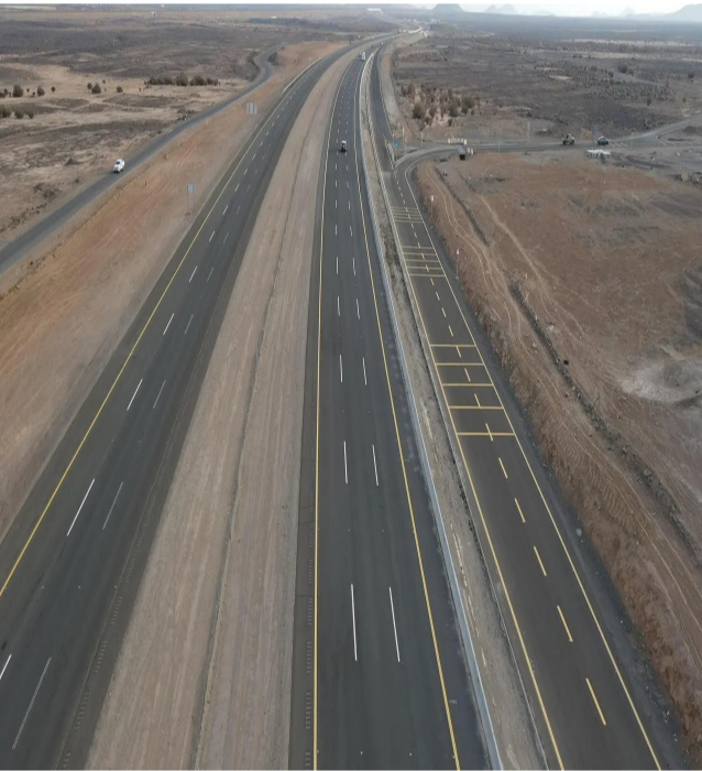
طريق المدينة المنورة مكة السريع كما بدأ مؤخراً

لحظي، مع إصدار تحذيرات فورية باستخدام الكاميرات، وأنظمة كشف الأحدث المرورية مثل الإنذارات والحوادث، وأجهزة التعداد المروري، واللوحات الإلكترونية متغيرة الرسائل، ويدمج المركز كافة هذه الأنظمة، ضمن منصة ذكية تخدم ضيوف الرحمن.