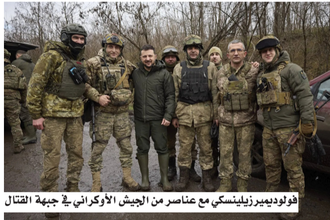
فولوديمير زيلينسكي مع عناصر من الجيش الأوكراني في جبهة القتال