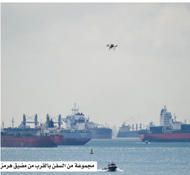
مجموعة من السفن بالقرب من مضيق هرمز

وأضاف أن بكين تواصل متابعة التطورات عن كثب، وستستمر في أداء دور «بناء» يهدف إلى دعم الاستقرار الإقليمي، وتشجيع الحلول السياسية بدلاً من المواجهات العسكرية. وجاء الموقف الصيني بعد إعلان