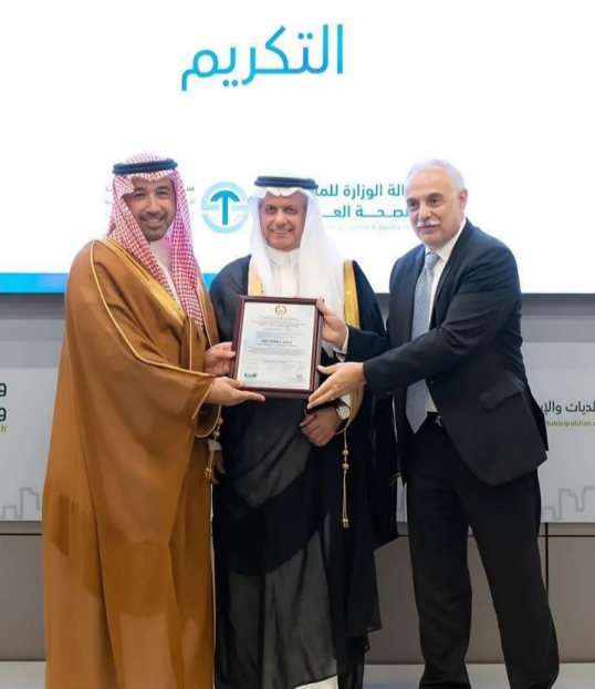
لحظة استلام شهادتي ISO

ويرفع كفاءة التخطيط وجودة المخرجات. وبين أن أعمال المسح الجيومكاني شملت أكثر من 166 ألف كيلومتر من الشبكة المستهدفة، فيما تجاوزت نسبة إنجاز البيانات الجيومكانية 67%. منتهية 2030