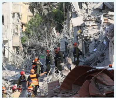
مبنى إسرائيلي استهدفته إيران في تل أبيب