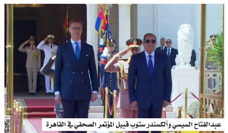
عبد الفتاح السيسي وألكسندر ستوب قبيل المؤتمر الصحفي في القاهرة

رحّب الرئيس المصري عبد الفتاح السيسي، أمس (الثلاثاء)، بالهدنة الجارية في المنطقة لاحتواء التصعيد العسكري، معتبراً إيها خطوة إيجابية على طريق التهدئة وخفض التوترات، بما يفتح المجال أمام جهود سياسية أكثر فاعلية خلال المرحلة المقبلة. وشدد السيسي خلال مؤتمر صحفي مشترك عقده في القاهرة مع رئيس فنلندا ألكسندر ستوب، على أهمية استثمار هذه الهدنة في تعزيز المسار الدبلوماسي، بما يسهم في دعم فرص التوصل إلى حلول سلمية للأزمات القائمة، والحد من