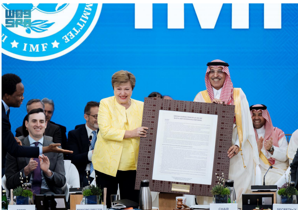
محمد الجدعان وكريستالينا جورجييفا يعلنان تبني (مبادئ الدرعية)

وخلال اجتماع وزراء ومحافظي منطقة الشرق الأوسط وشمال أفريقيا وأفغانستان وباكستان مع مدير عام صندوق النقد الدولي كريستالينا جورجييفا، أكد الجدعان أن المملكة أظهرت مرونة اقتصادية