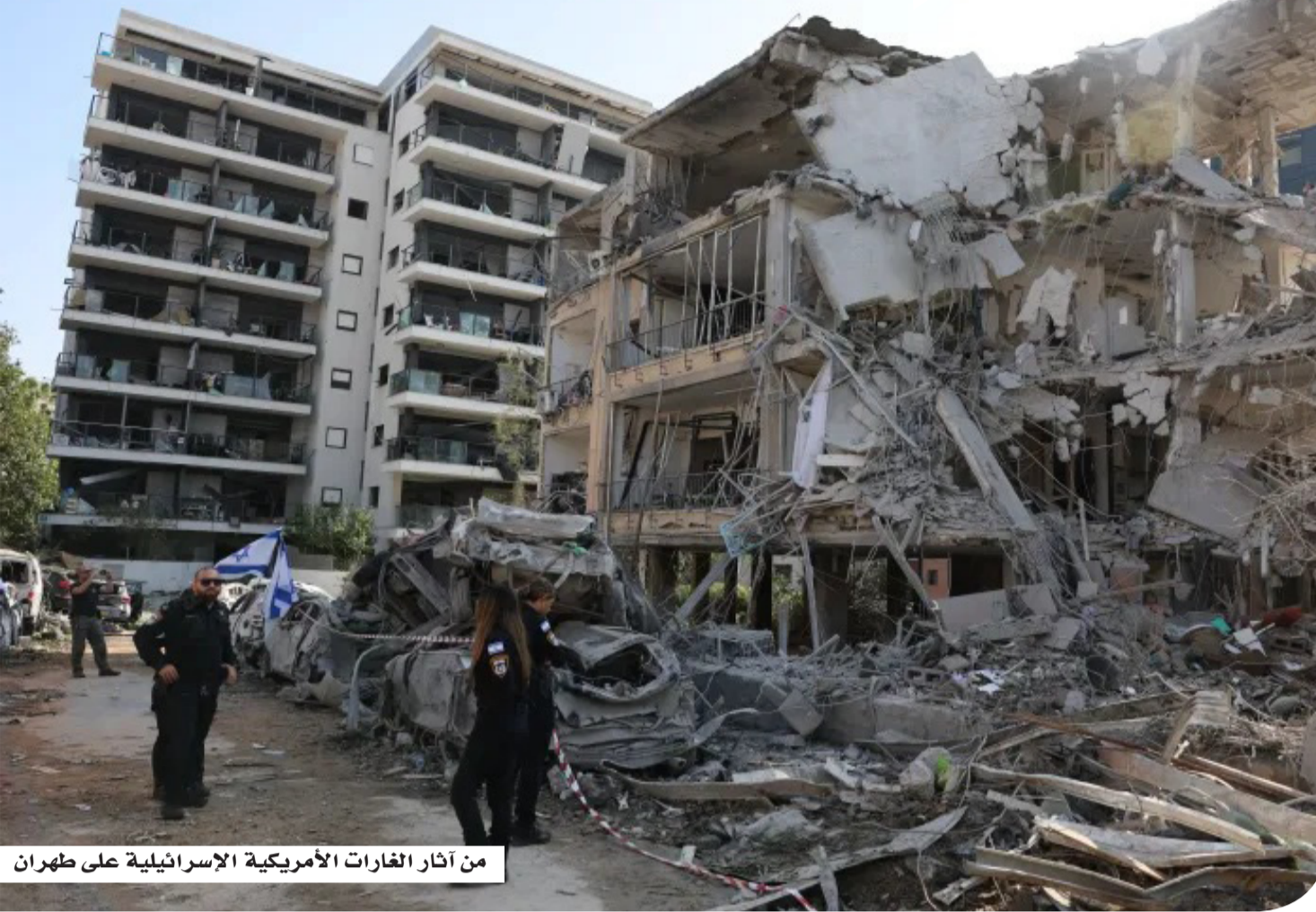
من آثار الغارات الأمريكية الإسرائيلية على طهران