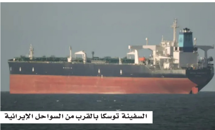
السفينة توسكا بالقرب من السواحل الإيرانية

وفي سياق متصل، أعربت الصين عن قلقها إزاء الحادث، داعية جميع الأطراف إلى الالتزام باتفاق وقف إطلاق النار والتصرف بمسؤولية لتجنب مزيد من التصعيد. وتأتي هذه التطورات في وقت تشهد فيه المنطقة توتراً متصاعداً، مع استمرار الحصار البحري الأمريكي وتوسيع نطاقه ليشمل السفن المشتبه في نقلها مواد محظورة إلى إيران، في حين تتواصل الجهود الدبلوماسية للتوصل إلى اتفاق، يضمن استدامة الهدنة بين الطرفين.