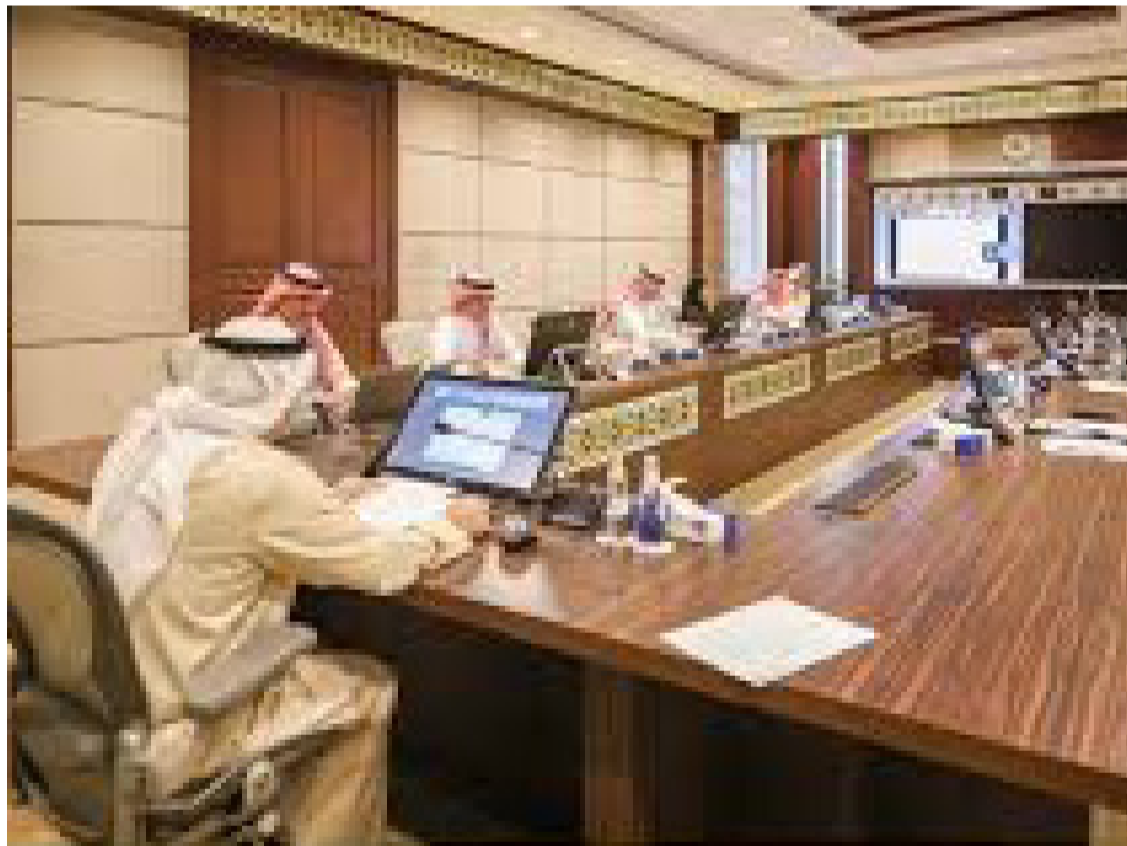
بظلالها على المشهد الاقتصادي الإقليمي والدولي؛ ما يبرز بصورة متزايدة أهمية تعزيز التنسيق والتكامل الاقتصادي بين دول المجلس، والارتقاء به إلى مستويات أكثر تكاملاً، حيث يُعد هذا التكامل الركيزة الأساسية لترسيخ الاستقرار، وصورن الحد من تداعيات الأزمات.

وأشار البديوي إلى أن التطورات الجيوسياسية، التي تشهدها المنطقة أقلت