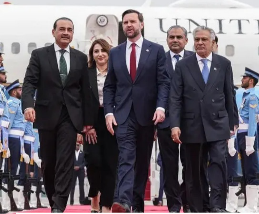
نائب الرئيس الأمريكي جاي دي فانس قبيل الجولة الأولى من المفاوضات بإسلام آباد

توافق خلال المشاورات الجارية، مشيرة إلى أن إسلام آباد تقدمت بطلب رسمي لتمديد وقف النار لأسبوعين إضافيين. تأتي هذه التحركات الدبلوماسية في ظل استعدادات أمنية مشددة في العاصمة الباكستانية، التي تستضيف الجولة الثانية من المفاوضات الأمريكية - الإيرانية، وسط اهتمام إقليمي ودولي متزايد بمسار هذه المحادثات. وبحسب ما نقلته شبكة "سي إن إن"، فإن الجولة الثانية من المفاوضات ستعقد صباح الأربعاء 22 أبريل في إسلام آباد، على أن يترأس الوفد الأمريكي نائب الرئيس جاي دي فانس، فيما يقود الوفد الإيراني رئيس البرلمان محمد باقر قاليباف. وكانت الجولة الأولى من المفاوضات بين الجانبين؛ قد عُقدت في 11 أبريل في العاصمة الباكستانية أيضاً، لكنها انتهت دون التوصل إلى اتفاق نهائي بشأن تسوية طويلة الأمد؛ بسبب استمرار الخلافات حول عدد من القضايا الجوهرية. وتأمل باكستان - وفق مراقبين - أن يسهم تمديد وقف إطلاق النار في خلق بيئة أكثر استقراراً، تسمح بإحياء مسار التفاوض بين واشنطن وطهران، وتقادي أي تصعيد جديد في المنطقة.