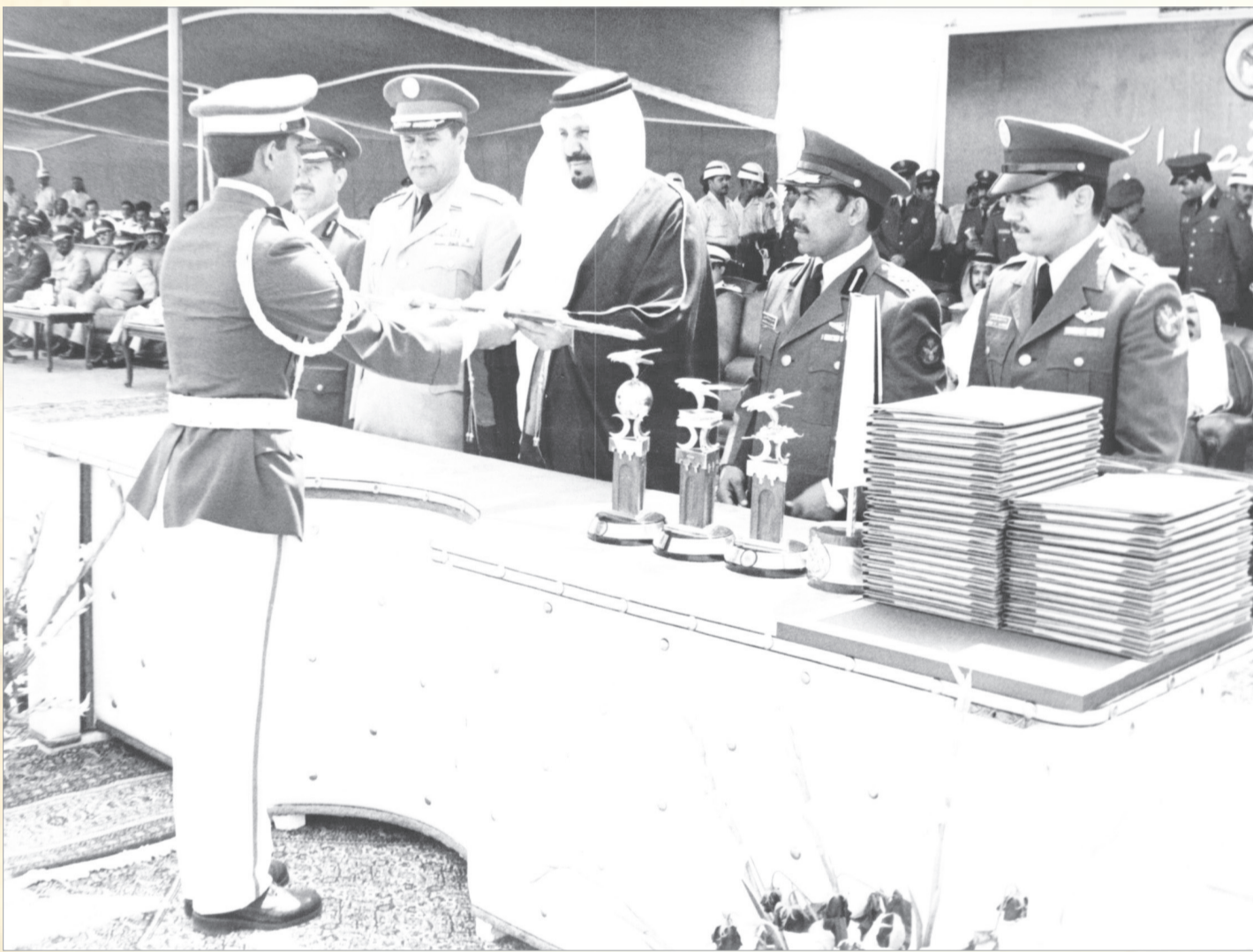
الامير عبدالرحمن بن عبدالعزيز نائب وزير الدفاع والطيوان يرحمه الله في احدى مناسبات التخريةج