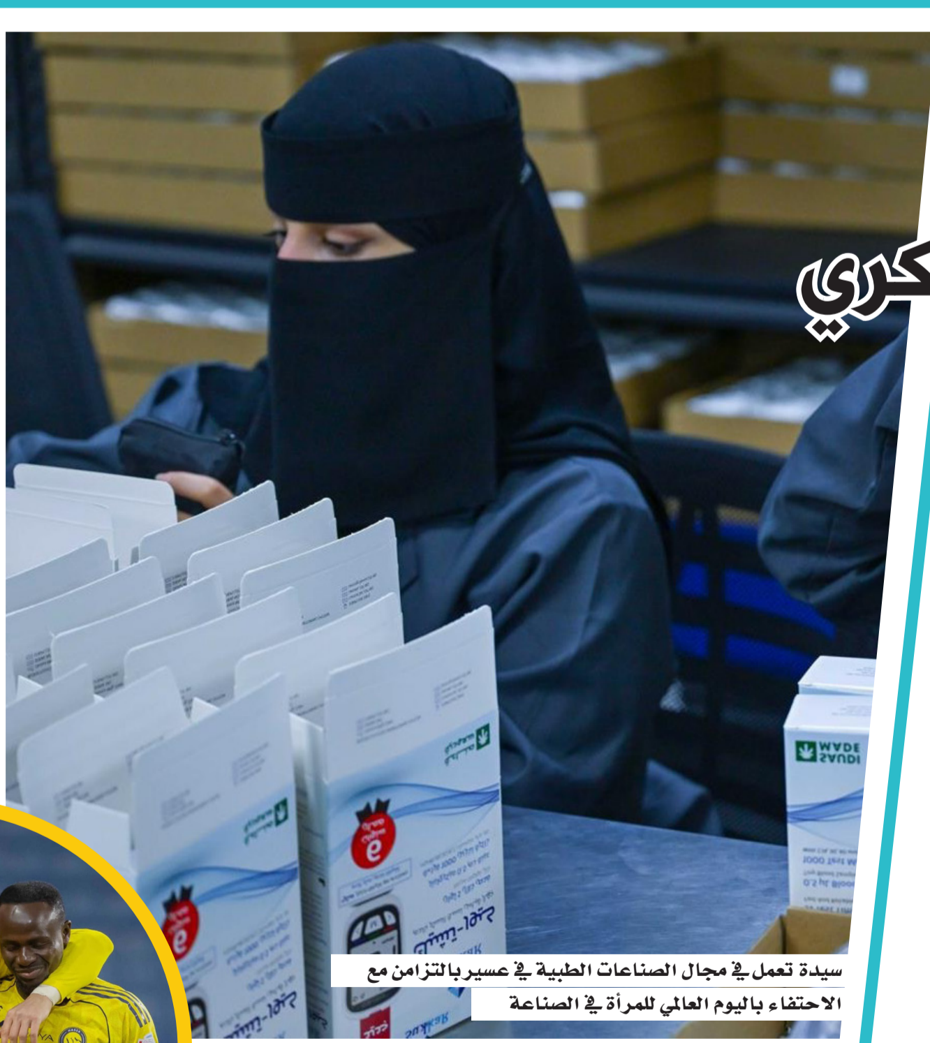
سيدة تعمل في مجال الصناعات الطبية في عسير بالتزامن مع الاحتفاء باليوم العالمي للمرأة في الصناعة

بمعدلات قياسية، ارتفع رصيد الاستثمار الأجنبي المباشر داخل الاقتصاد السعودي إلى نحو 1099.7 مليار ريال بنهاية عام 2025، بنسبة بلغت 13% مقارنة بعام 2024، ما يعكس مكانة المملكة؛ كوجهة موثوقة وواعدة بفرص الاستثمار. وبحسب البيانات الصادرة عن (ساما)، يمثل رصيد الاستثمار المباشر نحو 33% من إجمالي الاستثمار الأجنبي داخل الاقتصاد السعودي بنهاية 2025، إلى 3323.3 مليار ريال، بزيادة 19%؛ ما يضع المملكة ضمن أكبر 10 دول في أرصدة الاستثمار العالمي. ويتم توجيه الاستثمارات نحو القطاعات الأعلى أثراً اقتصادياً؛ كالنكاه الاصطناعي والصناعات المتقدمة، وتوطين المعرفة، ضمن مستهدفات رؤية المملكة 2030؛ لتعزيز مكانتها في خارطة التقدم العالمي واقتصاد المستقبل.