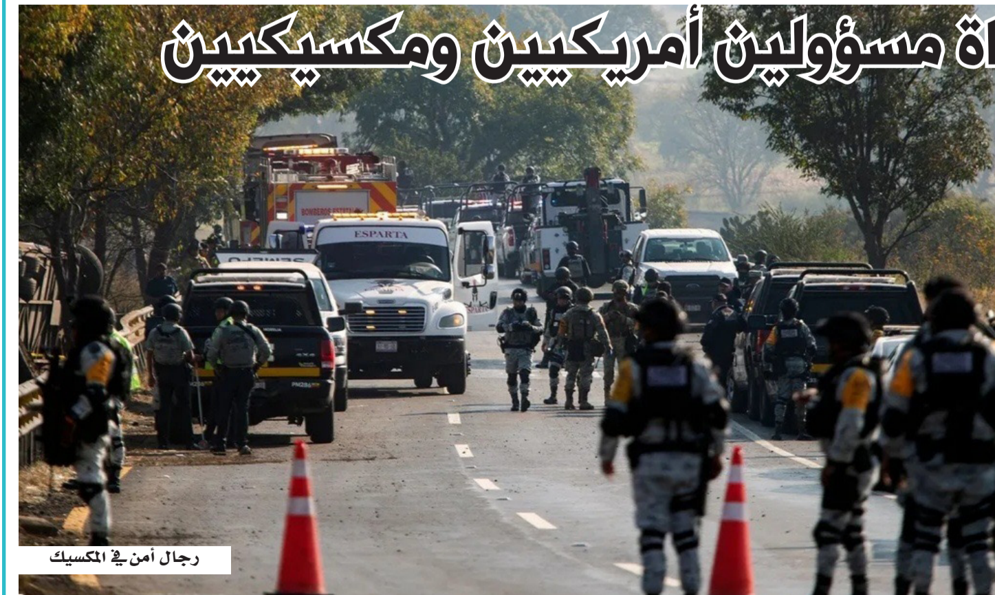
رجال أمن في المكسيك

إنتاج المخدرات في منطقة نائية. وبحسب السلطات المكسيكية، فقد انحرفت المركبة عن الطريق وسقطت في وادٍ قبل أن تنفجر، ما أدى إلى مقتل جميع من كانوا على متنها، بينهم مسؤولان مكسيكيان. وفي أعقاب الحادث، أعلنت الرئيسة المكسيكية كلوديا شينباوم فتح تحقيق رسمي، يهدف إلى الكشف عن ملابسات الواقعة، وما إذا كانت العملية قد شهدت أي خرق لقوانين الأمن القومي، خصوصاً في ظل حساسية التعاون الأمني مع الولايات المتحدة. من جانبه، أوضح المدعي العام لولاية تشيواوا، سيزار خاوريغي مورينو، أن الأمريكيين لم يشاركوا بشكل مباشر في المداهمة، التي وصفها بأنها من بين أكبر عمليات ضبط مختبرات المخدرات في المنطقة، مشيراً إلى أن دورهم اقتصر على مهام تدريبية، واجتماعات تنسيقية مع السلطات المحلية. البلاد (مكسيكو) لقي أربعة أشخاص، بينهم مسؤولان أمريكيان، مصرعهم في حادث مأساوي شمال المكسيك، عقب مشاركتهم في مهمة مرتبطة بمكافحة المخدرات، في واقعة فتحت باب التساؤلات مجدداً حول طبيعة وحجم الدور الأمريكي المتنامي في هذا الملف داخل الأراضي المكسيكية. ووفق معلومات متطابقة من مصادر مطلعة، فإن المسؤولين الأمريكيين كانوا يعملون ضمن مهام مرتبطة بوكالة الاستخبارات المركزية، في إطار توسع دورها لدعم الجهود الإقليمية في مواجهة شبكات تهريب المخدرات، وهو ما يسلط الضوء على تحول نوعي في الإستراتيجية الأمريكية تجاه هذه الحرب. وقع الحادث في ولاية تشيواوا، حيث كانت السيارة التي تقل الضحايا عائدة من موقع عملية أمنية استهدفت تفكيك مختبر ضخم