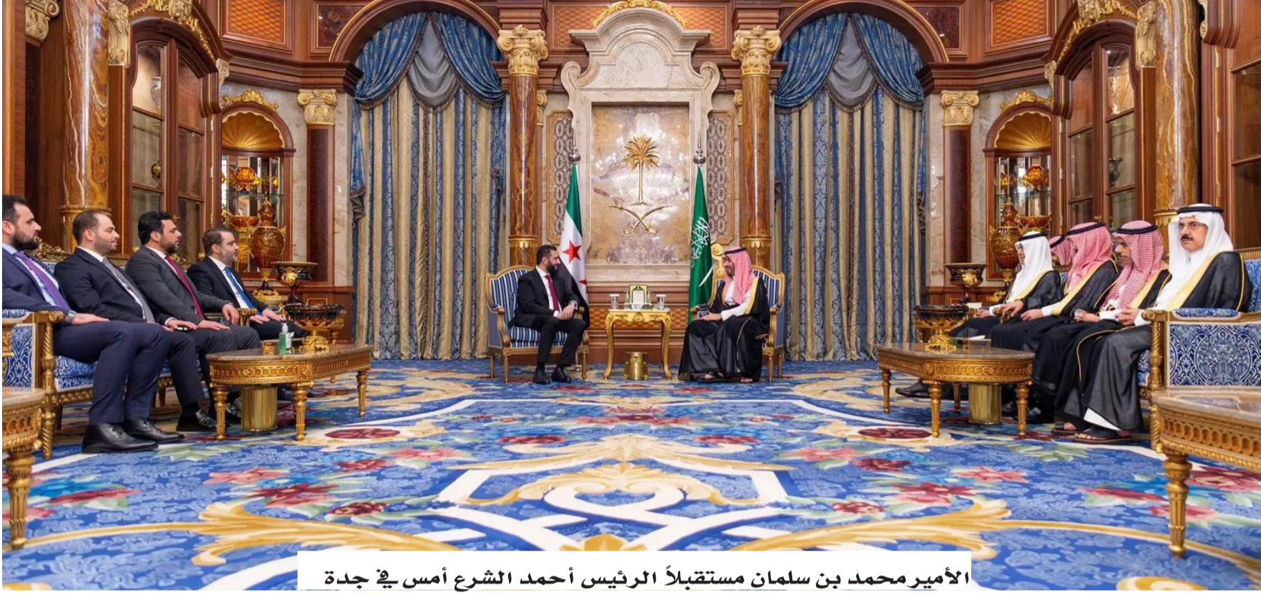
الأمير محمد بن سلمان مستقبلاً الرئيس أحمد الشرع أمس في جدة