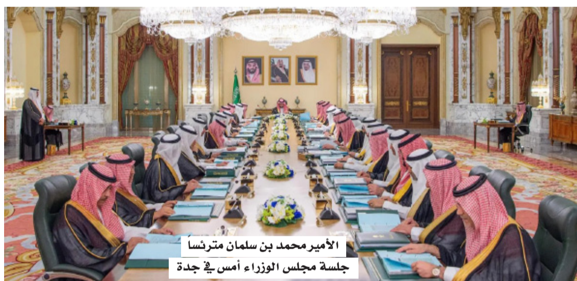
الأمير محمد بن سلمان مترئساً لجلسة مجلس الوزراء أمس في جدة

- التوجيه بما يلزم بشأن عدد من الموضوعات المدرجة على جدول أعمال مجلس الوزراء؛ من بينها تقريران سنويان للهيئة الملكية لمكة المكرمة والمشاعر المقدسة، ومكتبية الملك فهد الوطنية.