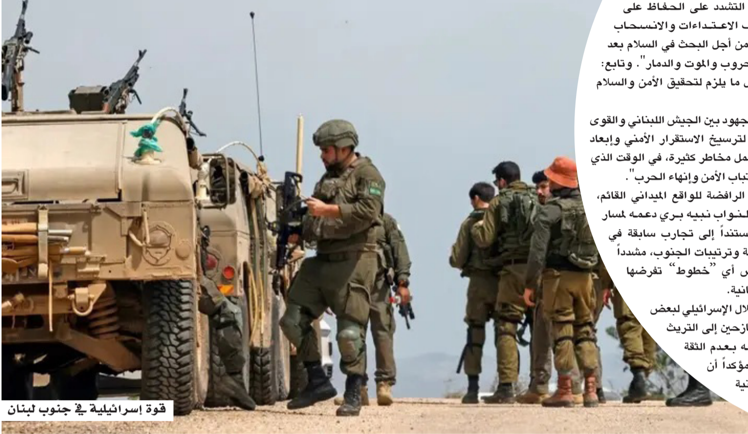
قوة إسرائيلية في جنوب لبنان