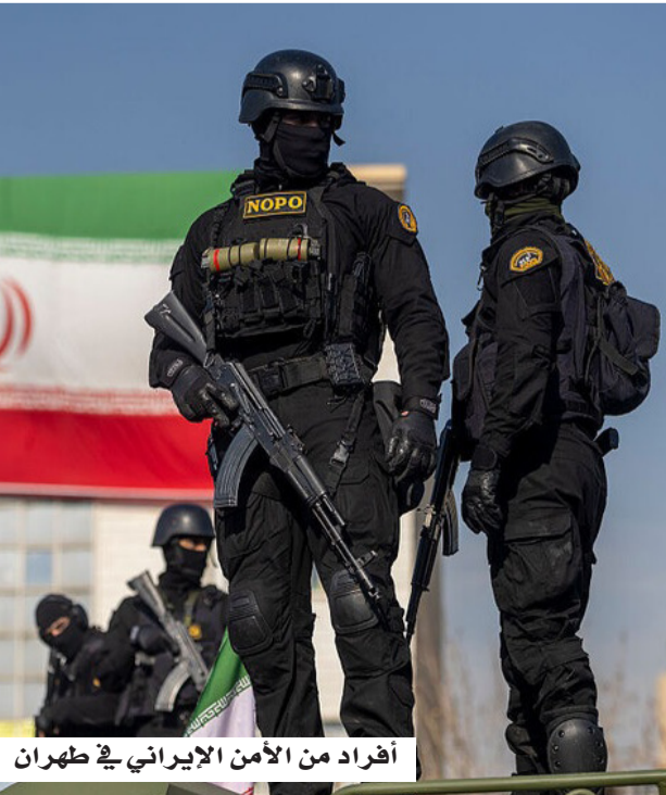
أفراد من الأمن الإيراني في طهران