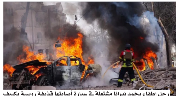
رجل إطفاء يخمد نيراناً مشتعلة في سيارة أصابها قذيفة روسية بكييف