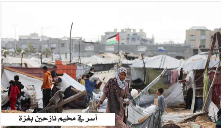
أسرى مخيم نازحين بغزة

وتق المرصد الإعلامي لمنظمة التعاون الإسلامي في تقريره الـ 125 استمرار التصعيد الإسرائيلي في الأراضي الفلسطينية، مسجلاً ارتفاعاً ملحوظاً في النشاط الاستيطاني والاعتداءات الميدانية خلال الفترة من 14 إلى 20 أبريل 2026، في ظل تدهور إنساني متسارع في قطاع غزة وتزايد الانتهاكات بحق المدنيين والبنية التحتية. ووفق التقرير، بلغ عدد الأنشطة الاستيطانية 22 نشاطاً ضمن إجمالي 145 تحركاً استيطانياً شمل توسعاً واعتداءات للمستوطنين في الضفة الغربية، بالتزامن مع تصاعد لافت في الهجمات التي نفذها المستوطنون والتي وصلت إلى 123 اعتداءً خلال أسبوع واحد فقط. وسجلت الضفة الغربية خلال الفترة ذاتها 381 اقتحاماً من قوات الاحتلال للمدن والقرى، أسفرت عن مقتل فلسطينيين اثنين، وإصابة 28 آخرين، واعتقال 191 شخصاً، إضافة إلى هدم 18 منزلاً و6 منشآت تجارية، في سياق عمليات وصفته بأنها تصعيدية ومنهجية. كما وثق التقرير استمرار الانتهاكات بحق الأطفال، حيث قُتل طفل واعتقل 4 آخرون، فيما تعرّض طفل لاعتداء من مستوطنين