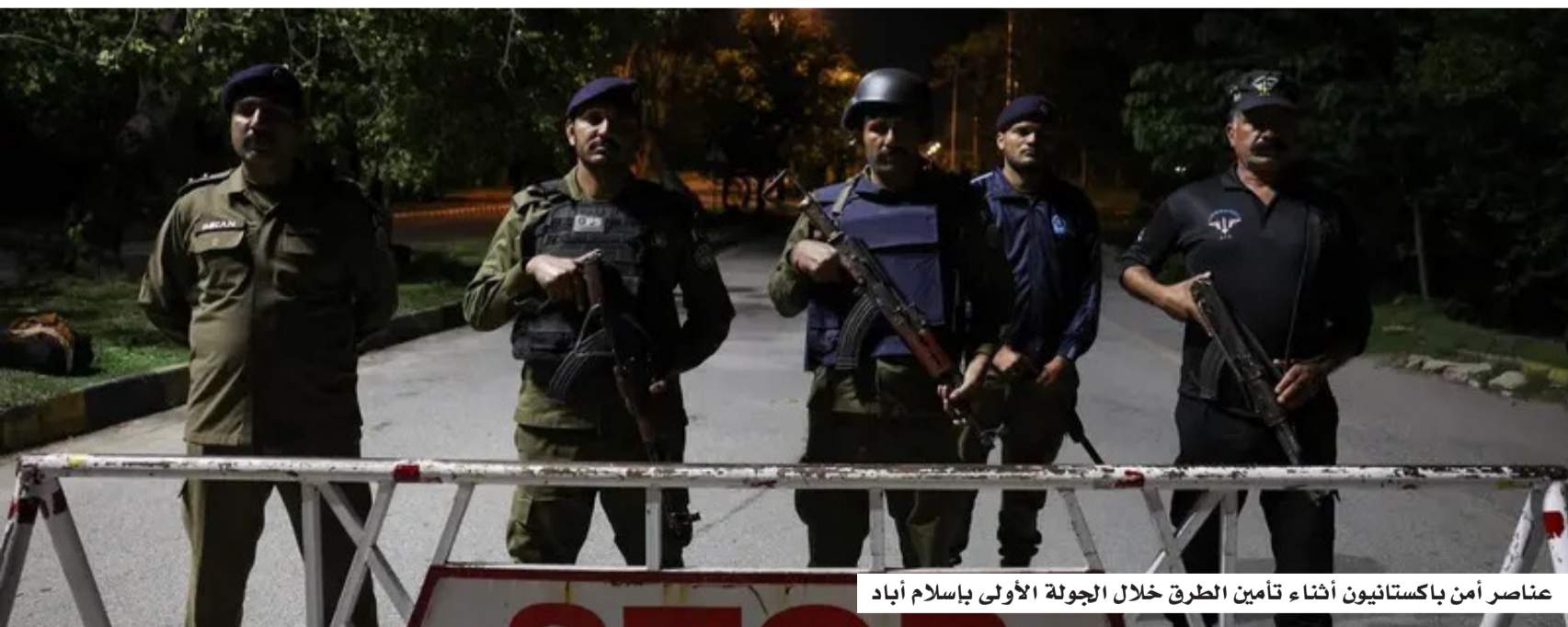
عناصر أمن باكستانيون أثناء تأمين الطرق خلال الجولة الأولى بإسلام آباد

تأتي هذه التطورات وسط تضارب في المواقف حول المشاركة؛ إذ نفت وسائل إعلام رسمية إيرانية إرسال أي وفد إلى باكستان، فيما أكد مصدر رسمي باكستاني، أن الجولة ستعقد في موعدها، مشيراً إلى وصول الوفدين الأمريكي والإيراني بشكل متزامن إلى العاصمة. كما أفادت مصادر إعلامية بوجود وفود تحضيرية في إسلام آباد منذ يوم أمس؛ لتسهيل ترتيبات المفاوضات. وتجرى هذه الاستعدادات في ظل ترقب إقليمي ودولي لخرجات الجولة الثانية، وسط تساؤلات حول إمكانية تمديد التقييدات الأمنية، أو التوصل إلى تفاهات جديدة بين الجانبين.