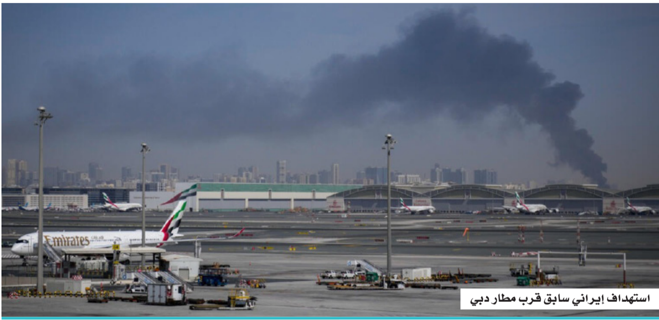
استهداف إيراني سابق قرب مطار دبي

والإرهاب بكافة أشكاله ونرائعه، معرباً عن التضامن الكامل مع دولة الإمارات العربية المتحدة في مواجهة كل ما يهدد أمنها واستقرارها ووحدتها الوطنية. كما أعرب الأمين العام لمجلس التعاون لدول الخليج العربية جاسم محمد البديوي، عن إدانته واستنكاره بأشد العبارات لأي أعمال، أو مخططات أئمة، تستهدف أمن واستقرار دولة الإمارات العربية المتحدة. وأشاد البديوي باليقظة العالية والكفاءة الاحترافية التي أظهرتها الأجهزة الأمنية في دولة الإمارات العربية المتحدة، التي تمكنت بكل اقتدار من إحباط هذه المخططات الإرهابية والكشف عنها وضبط عناصرها، مجسدة بذلك نموذجاً متقدماً في حماية الأمن الوطني، وصورن مقدرات الدولة. وأكد الأمين العام، تضامناً مع مجلس التعاون الكامل والراسخ مع دولة الإمارات العربية المتحدة، ودعمه المطلق للإجراءات كافة التي تتخذها للحفاظ على أمنها واستقرارها، وحماية أراضيها من أي تهديدات. كما جدد رفض مجلس التعاون لأشكال العنف والتطرف والإرهاب كافة، أو التحريض عليها؛ أيًا كانت دوافعها ومبرراتها.