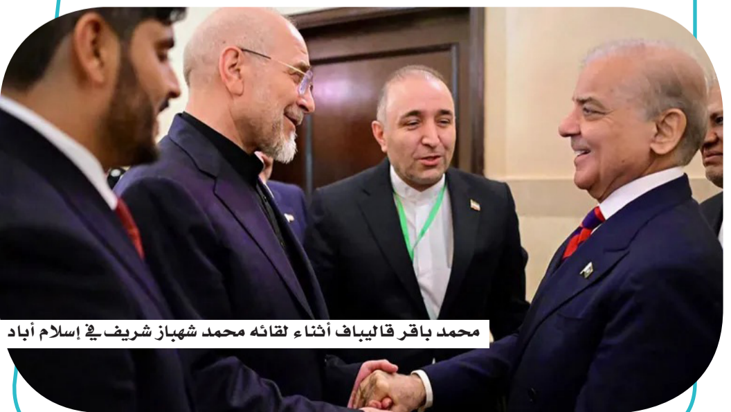
محمد باقر قاليباف أثناء لقائه محمد شهباز شريف في إسلام آباد

تأتي هذه التطورات في سياق أزمة أوسع تعود جذورها إلى انسحاب الولايات المتحدة عام 2018 من الاتفاق النووي البرم عام 2015، ما أدى إلى تصاعد التوترات وإعادة فرض العقوبات، قبل أن تتفاهم الأزمة مؤخراً مع اندلاع مواجهات عسكرية مباشرة بين الطرفين.