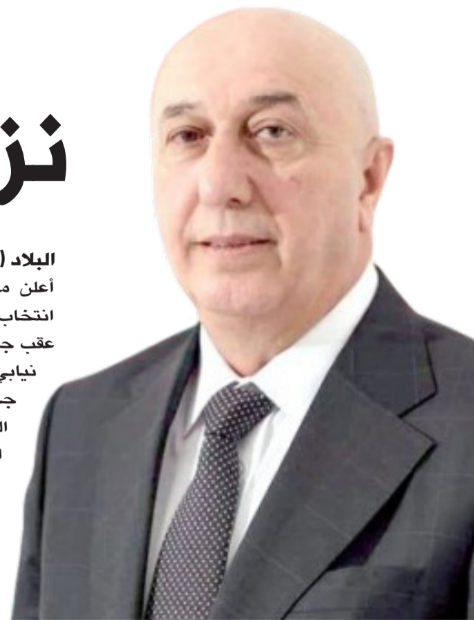
الرئيس العراقي نزار أميدي

أعلن مجلس النواب العراقي، أمس (السبت)، انتخاب نزار أميدي رئيساً لجمهورية العراق، عقب جولة تصويت برلمانية جرت وسط حضور نيابي مكثف، وإجراءات عدّ وفرز للأصوات. جاء الإعلان بعد انتهاء الجولة الثانية من التصويت داخل البرلمان، حيث أكدت الدائرة الإعلامية لمجلس النواب، أن عدد المشاركين في العملية الانتخابية بلغ 249 نائباً، قبل أن تُعلن النتائج النهائية، التي أسفرت عن فوز أميدي بمنصب رئاسة الجمهورية. وبحسب الإجراءات الدستورية، توجه الرئيس المنتخب إلى قبة البرلمان لأداء اليمين الدستورية، إيذاناً ببدء مهامه