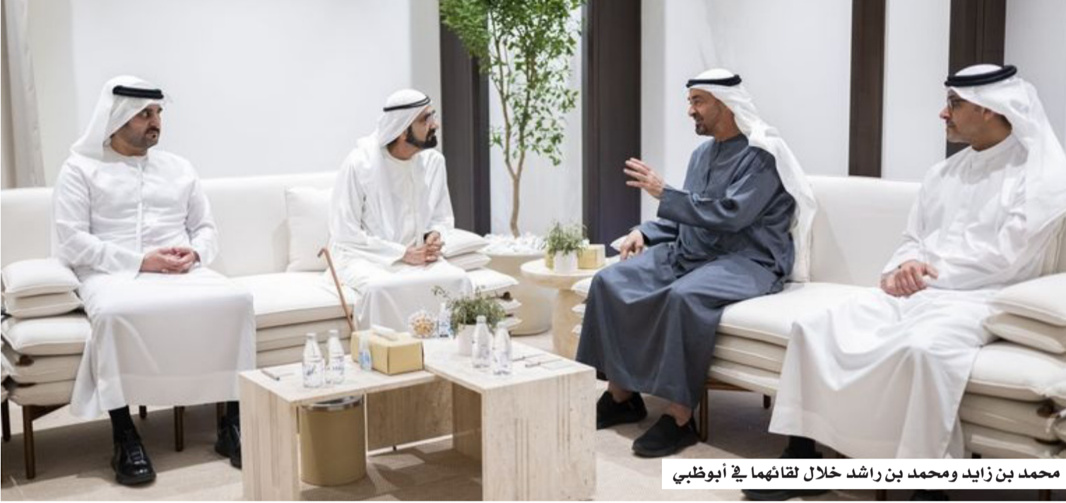
محمد بن زايد ومحمد بن راشد خلال لقاءهما في أبوظبي