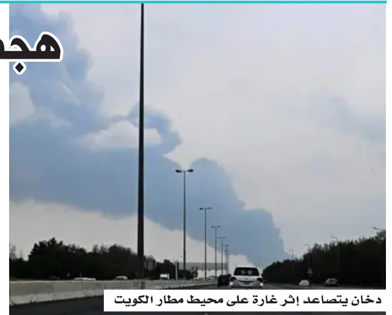
دخان يتصاعد إثر غارة على محيط مطار الكويت

عدة دول في المنطقة، بينما تمكنت أنظمة الدفاع الجوي من اعتراض جزء كبير منها، في ظل استمرار محاولات الاستهداف المتقطعة لمواقع عسكرية ومنشآت حيوية. وفي سياق متصل، كانت الكويت قد أبلغت الجانب العراقي رسمياً باحتجاجات دبلوماسية، واستدعت سفير بغداد لديها في أكثر من مناسبة، على خلفية تكرار الهجمات، التي يُعتقد أنها انطلقت من داخل الأراضي العراقية. كما تشير تقارير إلى أن بعض الفصائل المسلحة الناشطة في العراق، والمرتبطة بطهران، كانت قد دخلت على خط التصعيد منذ بداية الحرب، عبر استهداف مصالح ومواقع أميركية داخل العراق وخارجه، ما زاد من تعقيد المشهد الأمني في المنطقة.