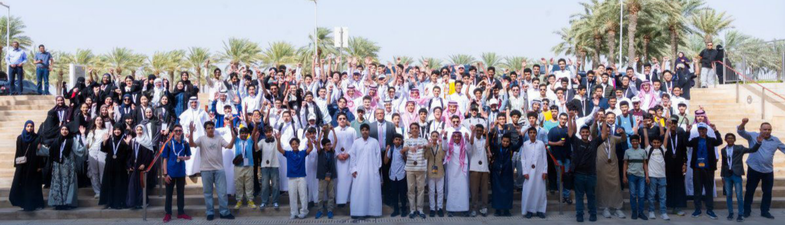
الطلاب المشاركون في المسابقة

البلاد (الدمام) سجلت الإدارة العامة للتعليم بالمنطقة الشرقية إنجازاً علمياً مميزاً، بحصدها 31 جائزة متنوعة (في سباقه كاوست للرياضيات 2026)، لتتربع على منصات التتويج الوطنية. وأكدت الإدارة أن هذا المكتسب الوطني النوعي، يترجم نجاح إستراتيجياتها في صقل المواهب، ويعكس تميز الناشئين والشباب في المنافسة العلمية.