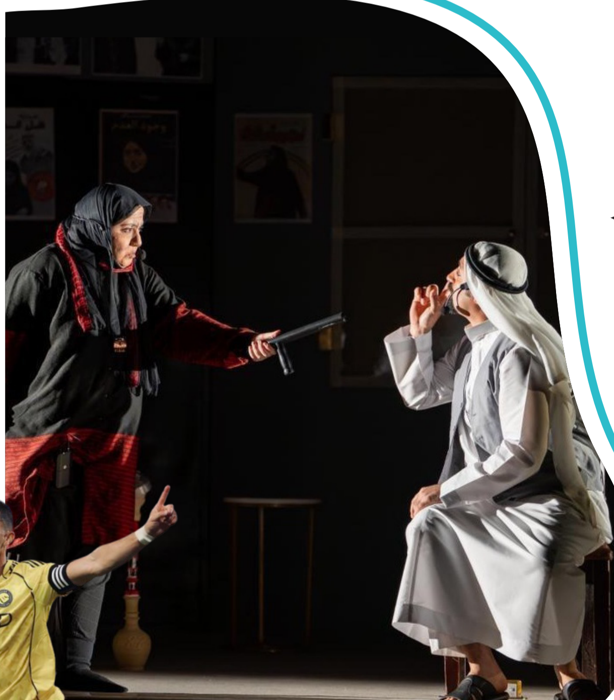
مشهد من مسرحية حارسه المسرح ضمن المحطة الختامية لبرنامج الجولة المحلية في جازان