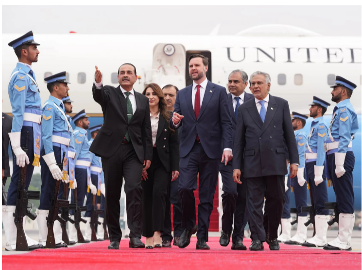
نائب الرئيس الأمريكي لدى وصوله أمس باكستان لبدء المفاوضات مع إيران

بين حرية الملاحة، التي تتمسك بها واشنطن، ومساعي إيران لفرض سيطرة ورسوم عبور. وفي الملف النووي، تصر إيران على حقها في التخصيب، مقابل رفض أمريكي، بينما ترفض طهران إدراج برنامجها الصاروخي ضمن التفاوض، وتطالب بانسحاب القوات الأمريكية، في حين يتمسك ترمب ببقاء الوجود العسكري حتى التوصل لاتفاق شامل، مع تحذيرات من تصعيد محتمل. وترافقت المحادثات مع تطورات ميدانية؛ بينها إعلان واشنطن عبور سفنها مضيق هرمز؛ تأكيداً لحرية الملاحة، وهو ما نفتحه طهران، في ظل تضارب الروايات. كما برز خلاف حول الأصول الإيرانية المعقدة بين تأكيد إيراني بموافقة مبدئية على الإفراج عنها، ونفي أمريكي. وفي سياق مواز، تصاعد الغموض بشأن الحالة الصحية للمرشد الإيراني مجتبي خامنئي بعد تقارير عن إصابات خطيرة تعرض لها، ما يضيف بعداً إضافياً من عدم اليقين إلى المشهد السياسي.