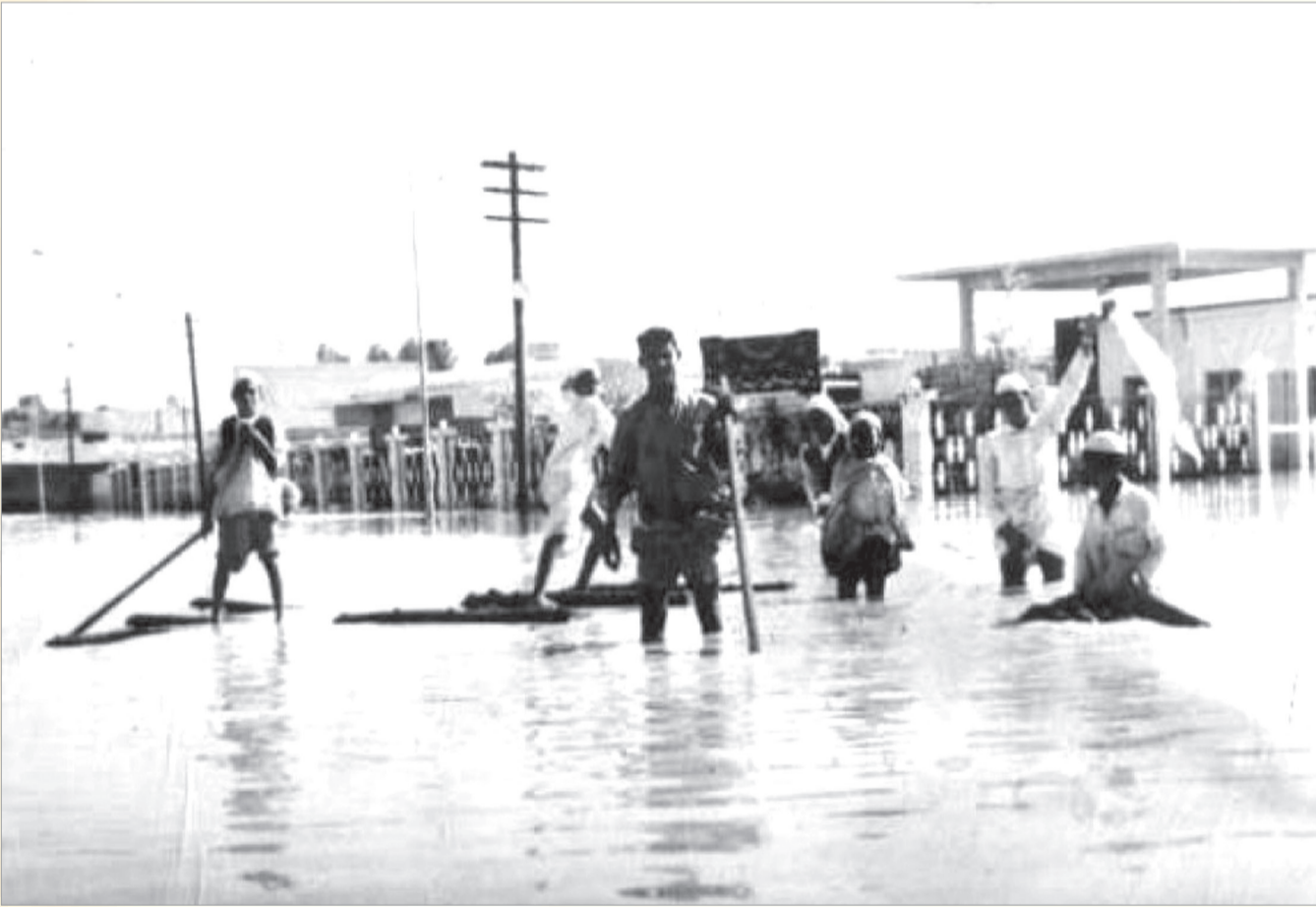
مجموعة من المواطنين يحاولون تصريف مياه الامطار