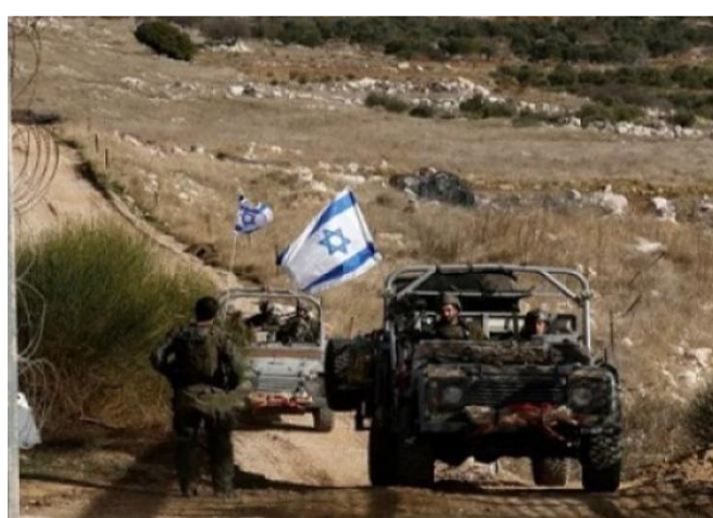
سيارة عسكرية إسرائيلية في ريف القنيطرة

شهد ريف القنيطرة الجنوبي في جنوب سوريا، أمس (السبت)، توغلاً جديداً للقوات الإسرائيلية داخل قرية كودنة، في حادثة وصفت بأنها امتداد لسلسلة الانتهاكات المتكررة في المنطقة الجنوبية. وأفادت مصادر محلية، نقلتها وكالة الأنباء السورية "سانا"، بأن قوة عسكرية إسرائيلية مؤلفة من عدة آليات توغلت في القرية، ونفذت عمليات مدهامة داخل منازل المدنيين، أسفرت عن اعتقال شخصين من أبناء البلدة، قبل اقتيادهما إلى جهة مجهولة دون توضيح الأسباب. وأضافت المصادر أن قوة أخرى توغلت في وقت سابق باتجاه وادي الرقاد في منطقة حوض اليرموك بريف درعا الغربي، حيث تم اعتقال أحد المواطنين، في إطار تحركات عسكرية متزامنة داخل عدة