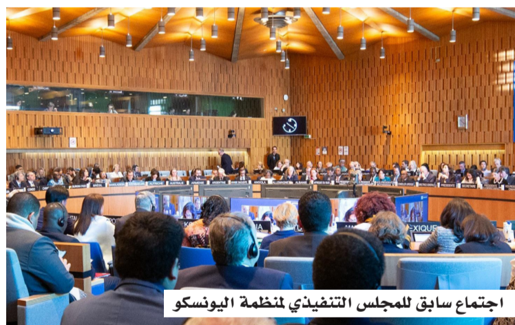
اجتماع سابق للمجلس التنفيذي لمنظمة اليونسكو

الأخر، وترسيخ مبادئ العدالة والمساواة، وتعزيز قيم التعايش الإنساني، واحترام