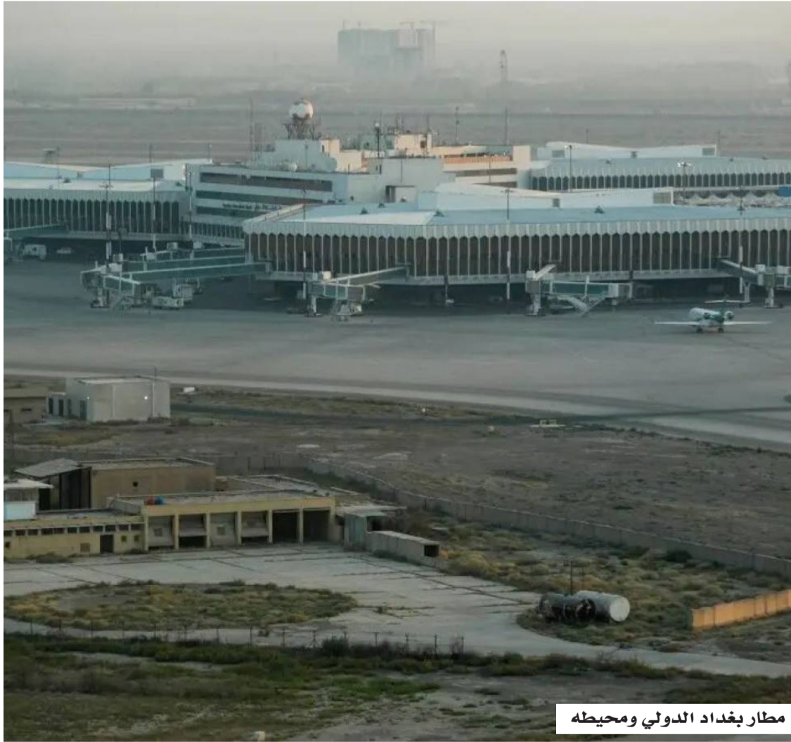
مطار بغداد الدولي ومحيطه