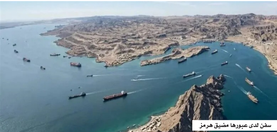
سفن لدى عبورها مضيق هرمز

الجانب الإيراني بنوداً تتعلق بإعادة تنظيم وضع مضيق هرمز، والاعتراف بحق طهران في استخدامه وفرض ترتيبات خاصة به، إلى جانب ملفات أخرى تنصل بالبرنامج النووي والصاروخي. في المقابل، تتمسك واشنطن بشروط تتضمن ضمان حرية الملاحة، ووقف دعم الفصائل المسلحة، والحد من الأنشطة النووية والصاروخية الإيرانية.