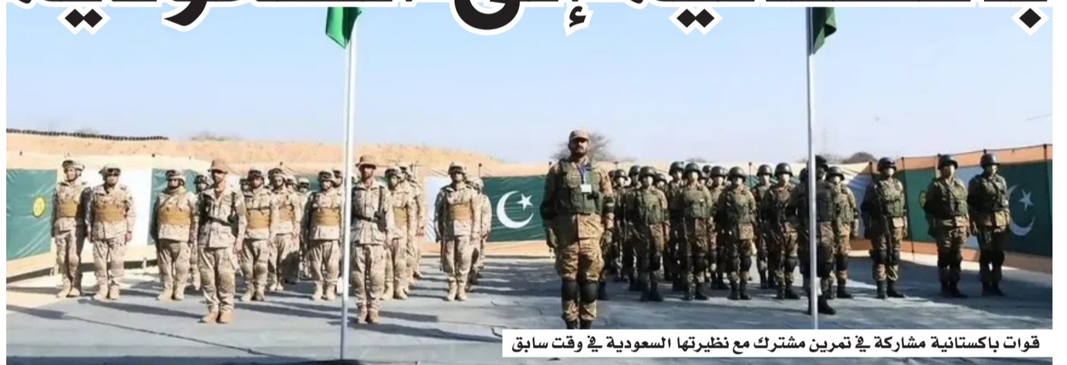
قوات باكستانية مشاركة في تمرين مشترك مع نظيرتها السعودية في وقت سابق