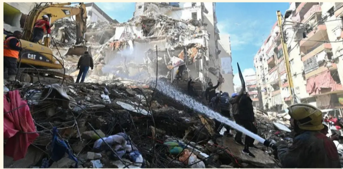
آثار غارة إسرائيلية على مبانٍ في بيروت