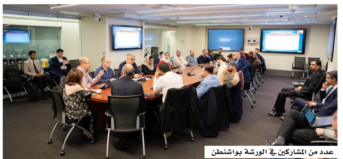
عدد من المشاركين في الورشة في واشنطن

وشهدت الورشة -على مدى خمسة أيام- نقاشات معمّقة وجلسات حوارية، تناولت أبرز الممارسات العالمية في حوكمة الذكاء الاصطناعي، وآليات تطوير الأطر التنظيمية والتشريعية، بما يعزز الاستخدام المسؤول للتقنيات الحديثة، ويسهم في بناء منظومة رقمية آمنة وموثوقة، تدعم مستهدفات التنمية المستدامة. وركزت أعمال الورشة على تعزيز التعاون الدولي، وتبادل الخبرات بين الدول والمنظمات، ومواءمة السياسات الوطنية مع