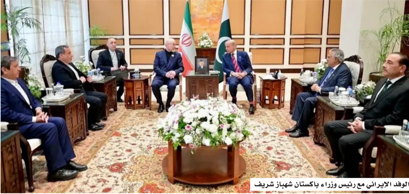
الوفد الإيراني مع رئيس وزراء باكستان شهباز شريف

وقال ترمب في اتصال هاتفي مع كيلي ماير، مراسلة شبكة "NewsNation": "إن المحادثات مع إيران قد بدأت بالفعل، مؤكداً أن الحكم على نوايا طهران سيتم خلال فترة قصيرة جداً. وأضاف ترمب: "سأخبركم بذلك خلال فترة قصيرة جداً، لن يستغرق الأمر وقتاً طويلاً". وفي سياق متصل، أشار ترمب إلى أن عدم تدفق النفط عبر مضيق هرمز في الوقت الحالي لا يعني استمرارية إغلاقه، مؤكداً أنه سيكون مفتوحاً في المستقبل غير البعيد، في إشارة إلى