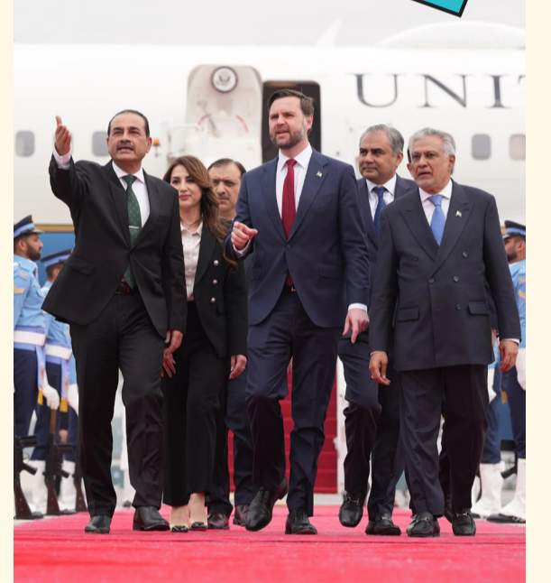
نائب الرئيس الأمريكي يتوسط وزير الخارجية الباكستاني وقائد الجيش الباكستاني لدى وصوله أمس إسلام آباد