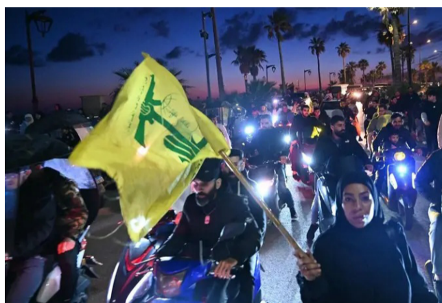
عدد من أنصار حزب الله في بيروت

حذرت قيادة الجيش اللبناني من دعوات متزايدة للتجمع والاحتجاج في عدد من المناطق، في ظل الظروف الأمنية والسياسية الدقيقة التي تمر بها البلاد، واستمرار الاعتداءات الإسرائيلية على الأراضي اللبنانية، وما يرافق ذلك من تصاعد في التوترات الداخلية. وأوضحت قيادة الجيش، في بيان عبر منصة "إكس"، أنها تحترم حق المواطنين في التعبير السلمي عن آرائهم، لكن في الوقت نفسه شددت على خطورة أي تحركات من شأنها تهديد الاستقرار الداخلي أو المساس بالسلم الأهلي، سواء عبر أعمال احتجاجية غير منضبطة أو من خلال الاعتداء على الممتلكات العامة والخاصة. وأكد الجيش أنه سيتعامل بحزم مع أي محاولات من شأنها الإخلال بالأمن أو تعريض الاستقرار للخطر، مشيراً إلى أن المرحلة الراهنة تتطلب أعلى درجات الوعي والمسؤولية الوطنية