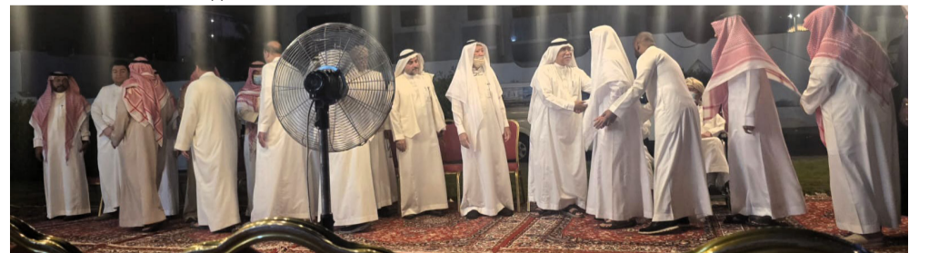
آل فلمبان يتلقون التعازي