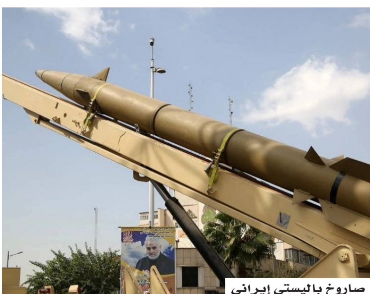
صاروخ باليستي إيراني

من جانبهم، أكد مسؤولون إسرائيليون، أن نحو ثلثي منصات إطلاق الصواريخ الباليستية الإيرانية خرجت من الخدمة، لكنهم أشاروا إلى أن بعض هذه المنصات يمكن استعادته من منشآت تحت الأرض، خاصة تلك المخبأة داخل الجبال، التي شكلت تحدياً كبيراً أمام الضربات الجوية الأمريكية والإسرائيلية.