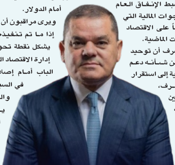
عبد الحميد الدبيبة

ويرى مراقبون أن هذا الاتفاق - إذا ما تم تنفيذه فعلياً - قد يشكل نقطة تحول في مسار إدارة الاقتصاد الليبي، ويفتح الباب أمام إصلاحات أوسع في السياسات المالية والنقدية، بما يعزز فرص الاستقرار الاقتصادي في المرحلة المقبلة.