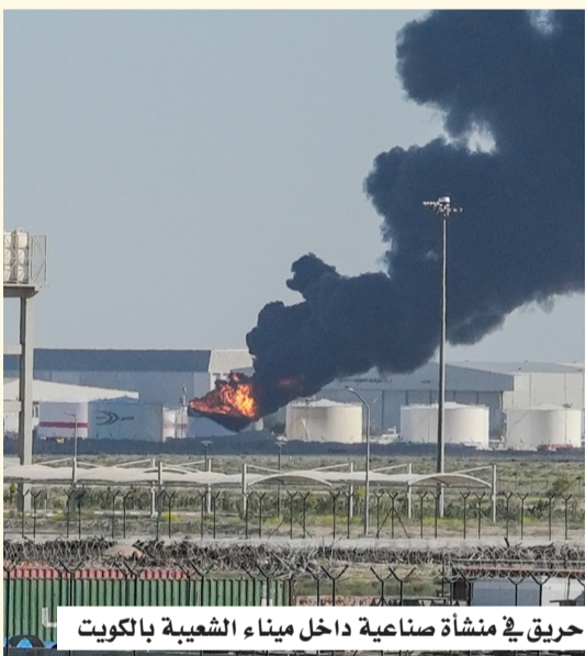
حريق في منشأة صناعية داخل ميناء الشعبة بالكويت

هذه الانتهاكات تقوّض الجهود الدولية، التي تهدف لاستعادة الأمن والاستقرار بالمنطقة". وأضافت: "المملكة تؤكّد على ضرورة وقف إيران ووكلائها لأعمالهم العدائية كافة على الدول العربية والإسلامية، وإنفاذ قرار مجلس الأمن رقم 2817 لعام 2026م، وتعبير المملكة عن تضامنها مع دولة الكويت الشقيقة؛ حكومة وشعباً، مجددة دعمها الكامل لكل ما تتخذه الكويت من إجراءات تحفظ سيادة وأمن واستقرار الكويت وشعبها الشقيق".