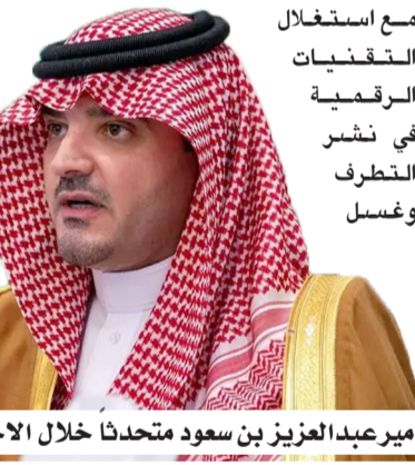
الأمير عبدالعزيز بن سعود متحدثاً خلال الاجتماع أمس

وفي ختام كلمته، أعرب الأمير عبدالعزيز بن سعود عن شكره للأجهزة الأمنية بالدول العربية على مواصلة جهودها في أداء أنوارها وتحمل مسؤولياتها في الحفاظ على الأمن والاستقرار، كما قدم شكره للأمن العام ومنسوبي الأمانة العامة للمجلس على جهودهم في الإعداد والتدريب لهذا الاجتماع، سائلاً الله -عز وجل- التوفيق، وأن يكمل الاجتماع بنجاح؛ بما يعزز مسيرة التعاون الأمني العربي المشترك. وقد ألقى الوزراء كلماتهم خلال الاجتماع، وناقشوا عدداً من الموضوعات المدرجة على جدول أعماله.