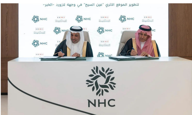
أثناء توقيع مذكرة التفاهم

ويؤسس هذا التعاون إطار عمل متكامل يتيح تقديم خدمات أثرية متخصصة، ضمن مشاريع التطوير العمراني، ويعزز جاهزية المجتمعات السكنية للتعامل مع المواقع ذات القيمة التاريخية؛ وفق منهجيات علمية معتمدة، بما يمهّد لتطوير نماذج مستقبلية لدمج التراث الثقافي في تصميم المجتمعات الحديثة بطريقة تحفظ الهوية الوطنية، وتدعم جودة الحياة للسكان.