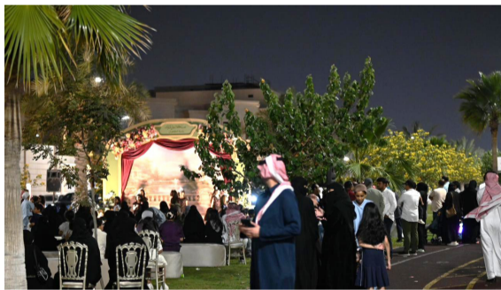
جانب من احتفالات العيد