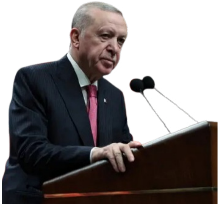
رجب طيب أردوغان خلال مناسبة سابقة بأنقرة

المتوسط. وكان هذا الحادث الرابع منذ بداية الحرب، بعد ثلاث محاولات اعتراض سابقة نفذها الحلف.