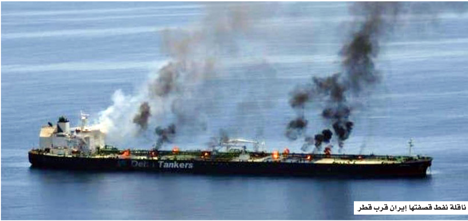
ناقلة نفط قصفتها إيران قرب قطر

وفي الدوحة، أعلنت وزارة الدفاع القطرية أن الدولة تعرضت لهجوم بواسطة ثلاثة صواريخ كروز مصدرها إيران، حيث تمكنت القوات المسلحة القطرية من التصدي لصاروخين منها، فيما أصاب الصاروخ الثالث ناقلة نفط مؤجرة لقطر للطاقة في المياه الاقتصادية القطرية.