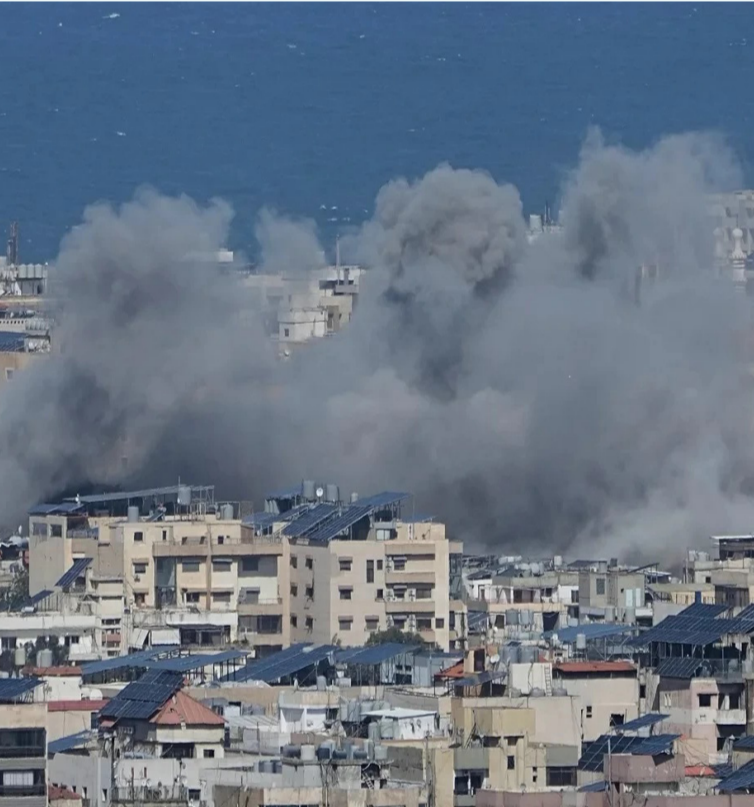
غارة إسرائيلية استهدفت عمق طهران

وتُعد هذه الضربات، وفق مراقبين، من أخطر العمليات التي استهدفت إيران منذ عقود، إذ طالت بشكل مباشر مراكز صنع القرار السياسي والعسكري، ما قد يترك فراغاً كبيراً في هيكل القيادة.