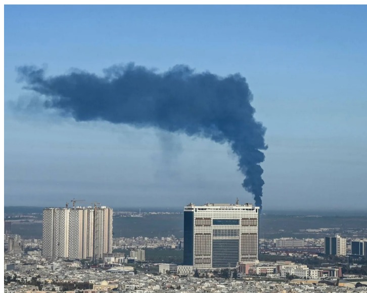
دخان متصاعد من مستودع تم قصفه في أربيل

ومنذ تفجر الحرب بين إيران وإسرائيل والولايات المتحدة،