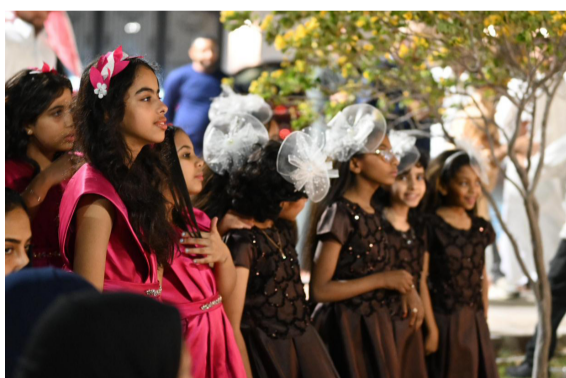
مشاركة الأطفال بالعيد