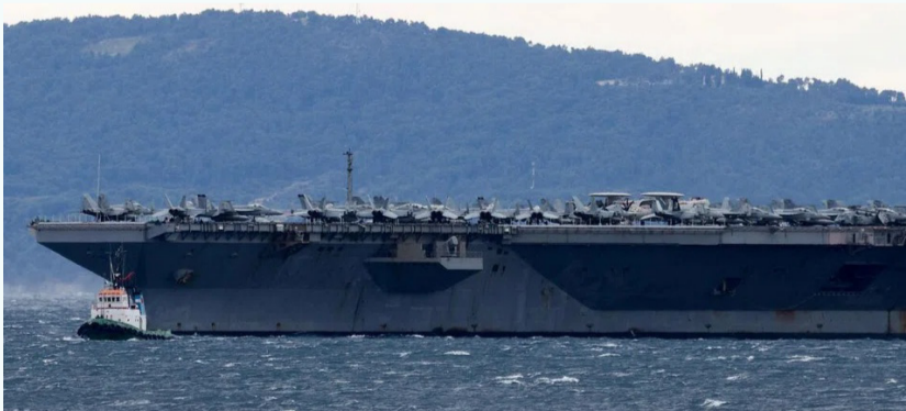
حاملة الطائرات الأمريكية يو إس إس في الخليج

حوالي 2500 من مشاة البحرية، ويجري نشر 2500 إضافيين، ليصل إجمالي القوات الإضافية إلى آلاف الجنود، وسط وجود عشرات الآلاف من العسكريين الأميركيين المنتشرين أصلاً في المنطقة. ورغم هذا التحشيد، تجنّب وزير الدفاع الأمريكي بيت هيغسيث والإدارة إعطاء إجابات واضحة حول احتمال استخدام القوات البرية ضد إيران، مؤكداً أن "لا يمكنك خوض حرب وتحقيق النصر إذا أخبرتك خصمك بما أنت مستعد لفعله أو غير مستعد لفعله"، مشدداً في الوقت ذاته على أن الهدف يبقى التوصل إلى اتفاق من خلال المحادثات.