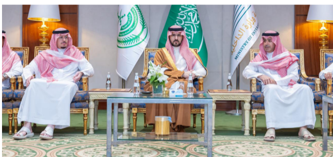
الأمير سعود بن بندر خلال تقديمه العزاء

ورفع العميد السهلي، نيابة عن أسرته، الشكر والتقدير لسموهما على تعازيهما ومواساتهما.