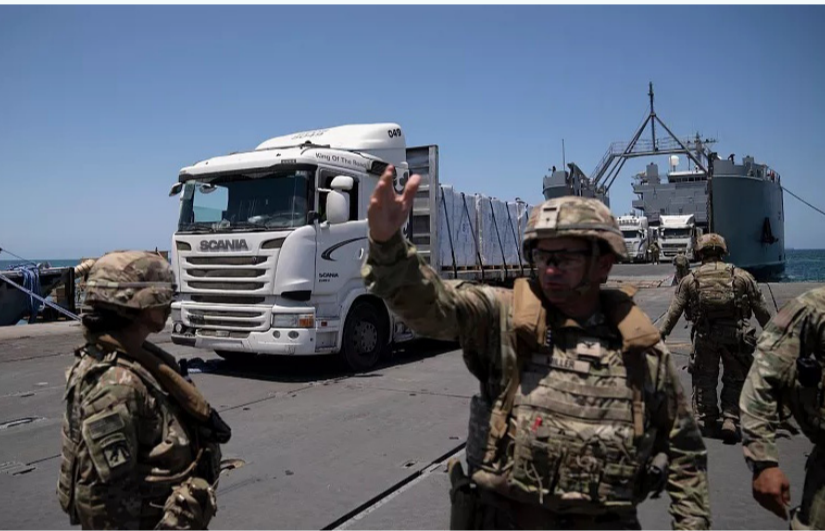
قوة أمريكية في الخليج

من جهته، أشار وزير الدفاع بيت هيغسيث إلى أن إبقاء الخيارات مفتوحة وعدم كشف النوايا يمثل جزءاً أساسياً من الإستراتيجية العسكرية، مؤكداً أن الغموض يمنع الخصم من تحديد الخطوط الحمراء أو الاستعداد لردود محددة.