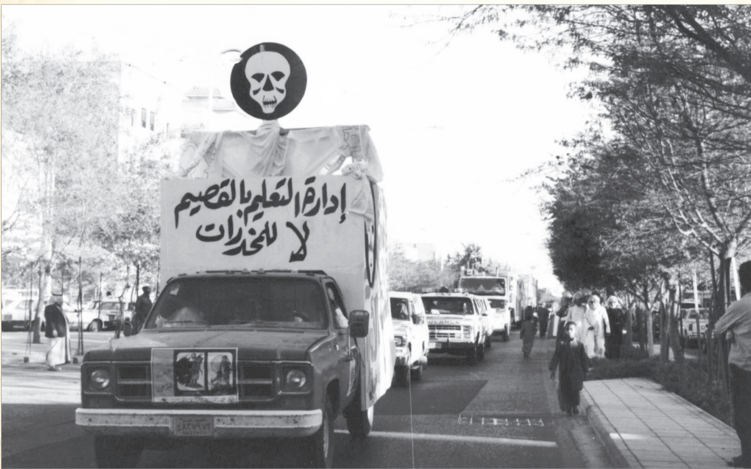
مسيرة قافلة التوعية السعودية لمكافحة المخدرات