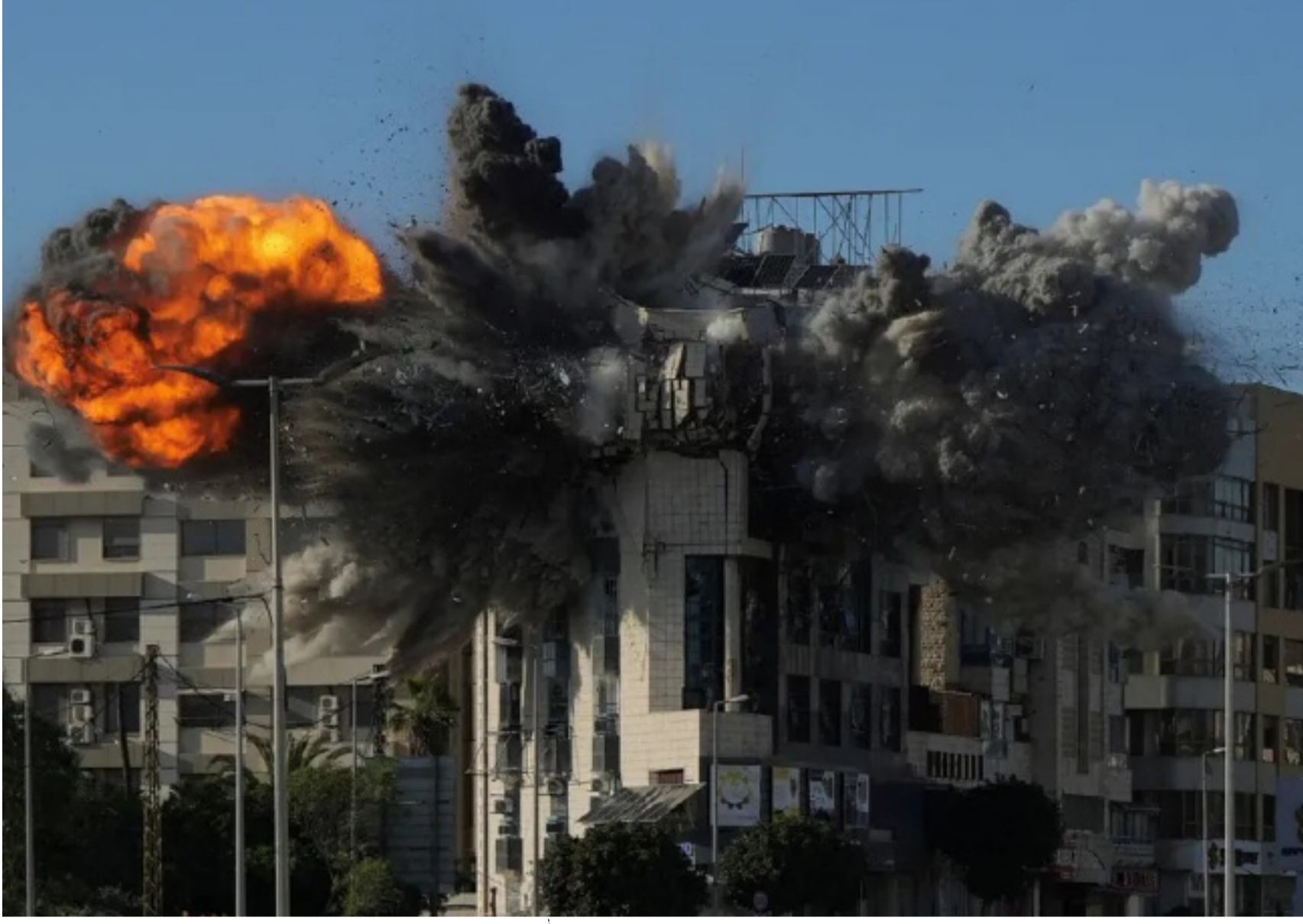
ضربة إسرائيلية استهدفت قيادات حزب الله في جنوب لبنان