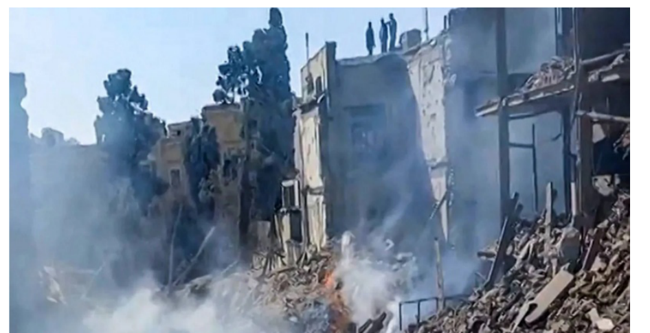
موقع تعرض للقصف جنوب إيران

وأشارت التحقيقات إلى أن خصائص الانفجار وشكل