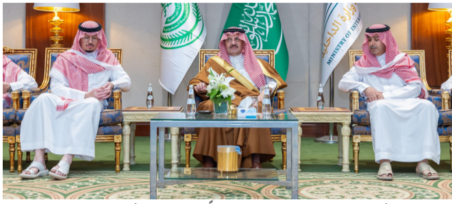
الأمير سعود بن نايف مقبلاً التعازي لأسرة السهلي