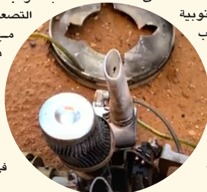
بقايا طائرة مسيرة أسقطتها الدفاعات الجوية السورية

كما شدد على أن دمشق تبذل جهوداً للحفاظ على استقرار البلاد وتجنب المزيد من التصعيد، بالتوازي مع اتصالات دولية، شملت ألمانيا وبريطانيا، لتنسيق جهود إعادة الاستقرار في المنطقة.