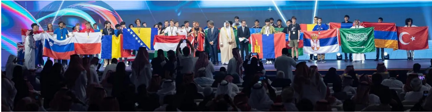
مؤتمر سابق لسدايا حول البيانات والذكاء الاصطناعي