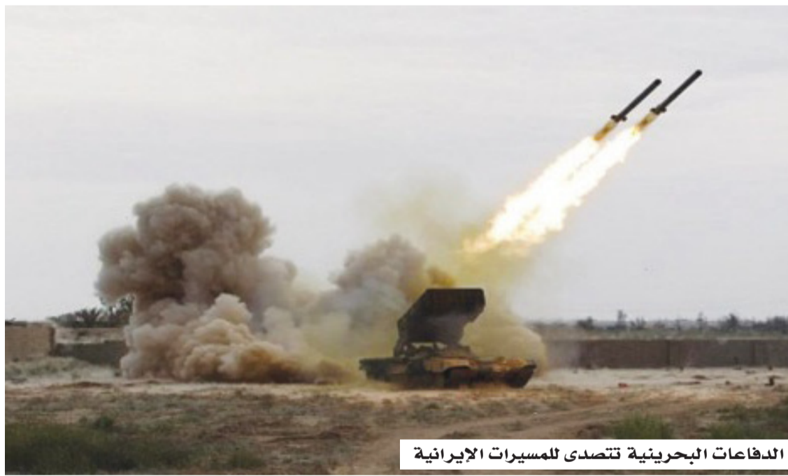
الدفاعات البحرية تتصدى للمسيرات الإيرانية

وأوضح الخطاب أن الهجمات الإيرانية استهدفت عمداً عدة مواقع مدنية وحيوية، منها الموانئ البحرية والتجارية، المطارات، البنية التحتية للطاقة، المنشآت النفطية، محطات التحلية، الطرق، مراكز الشحن، المناطق