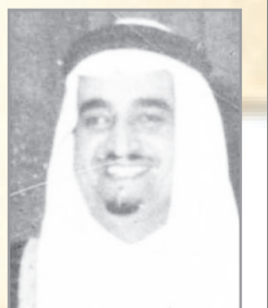
الأمير فهد بن عبد العزيز