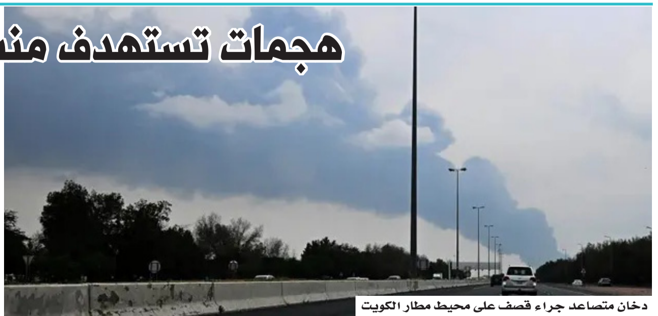
دخان متصاعد جراء قصف على محيط مطار الكويت