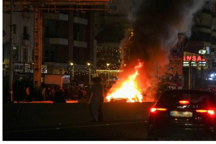
تيران ودخان في موقع طاله القصف الإسرائيلي بطهران

وامتدت الهجمات لتشمل مناطق عدة، حيث سُمع دوي انفجارات في قزوین شمالاً، وأصفهان وسط البلاد، وسط تقارير عن قصف عنيف استهدف