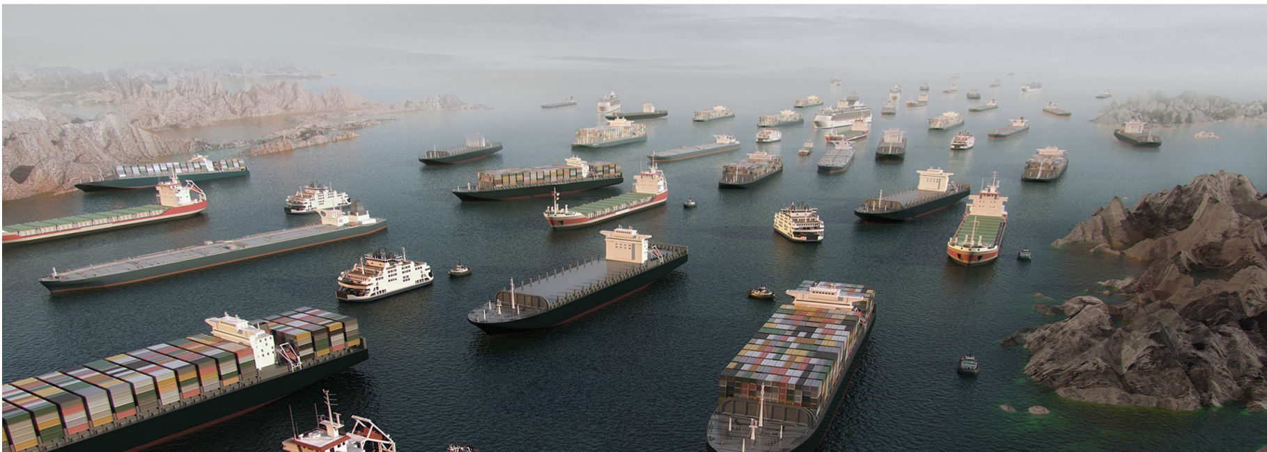
سفن في مضيق هرمز

وفي خطوة تصعيدية، زعم الحرس الثوري الإيراني إطلاق عدة طائرات مسيرة باتجاه حاملات الطائرات الأمريكية أبراهام لينكولن في شمال المحيط الهندي، ما اضطرها إلى تغيير موقعها والانسحاب إلى عمق المحيط، وفق ما أظهرت البيانات المتاحة وصور