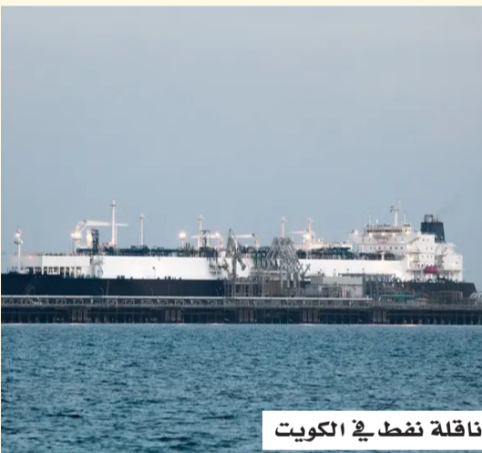
ناقلة نفط في الكويت

في ميناء دبي، ما تسبب في أضرار للسفينة ونشوب حريق على متنها. وكانت الناقلة محملة بالكامل وقت الحادث، وحذرت مؤسسة البترول الكويتية من احتمال حدوث تسرب نفطي في المياه المحيطة. وأفادت المصادر أنه لم ترد أنباء عن وقوع إصابات، وأن تقييم الأضرار لا يزال جارياً.