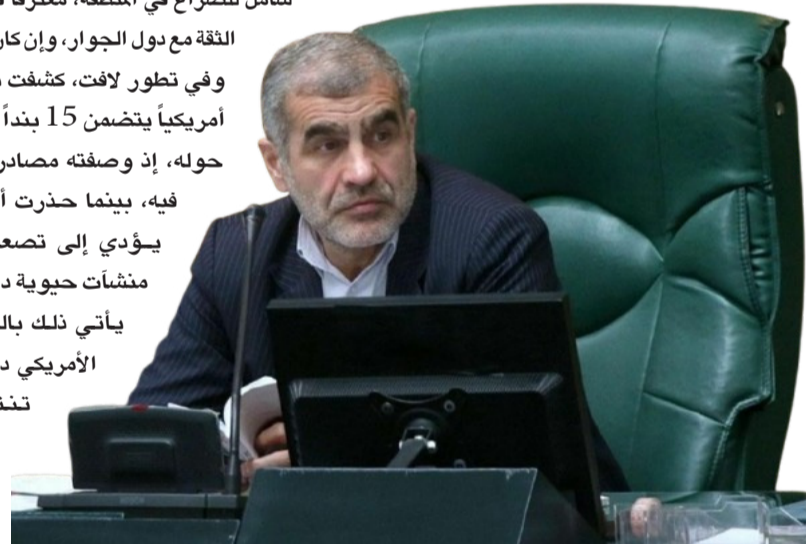
نائب رئيس البرلمان الإيراني علي نيكزاد