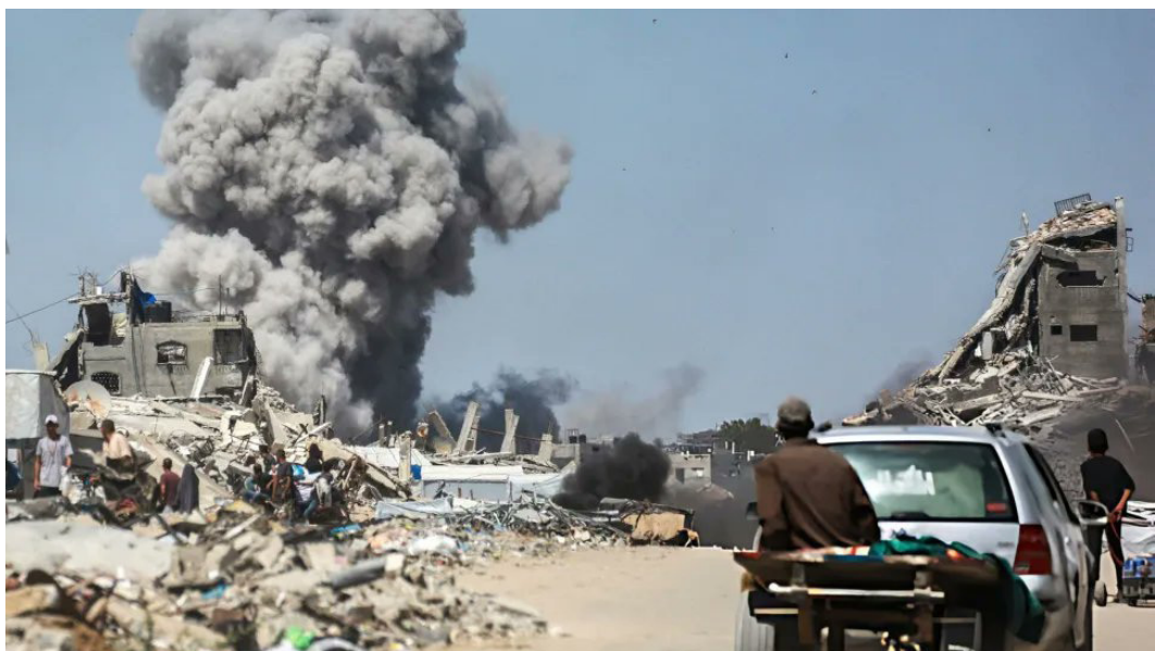
انفجار في الضفة الغربية

الغربية، إذ تتكرر الحوادث بشكل دوري، ما يقام معاناة السكان المحليين ويزيد من التحديات الإنسانية في مناطق النزاع. كما تأتي الاقتحامات والاعتقالات المتكررة في وقت حساس يعاني فيه الفلسطينيون من قيود شديدة على الحركة وارتفاع في الإجراءات الأمنية الإسرائيلية، وسط تحذيرات من تفاقم التوترات في مناطق الأغوار والقدس المحتلة نتيجة استمرار السياسات الاستيطانية والانتهاكات اليومية.