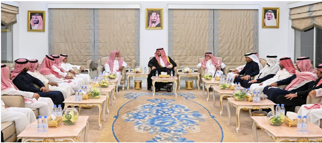
الأمير فواز بن سلطان معزيا آل العبيكان في فقيدهم عبد الله.