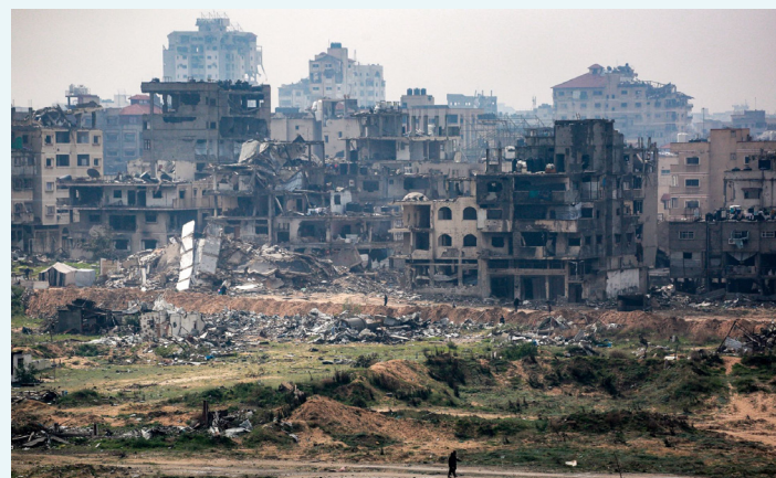
دمار كبير طال المباني في قطاع غزة جراء الغارات الإسرائيلية

كرر وزير المالية الإسرائيلي اليميني المتطرف، بتسليل سموتريتش، موقفه الداعم لهجرة الفلسطينيين من الضفة الغربية وقطاع غزة، مؤكداً أنه يسعى إلى "تشجيع الهجرة" من المناطق الفلسطينية المحتلة. وجاءت تصريحات سموتريتش خلال نشاط نظمته حزبه "الصهيونية الدينية"، حيث أعلن أنه يسعى للقضاء على ما وصفه بـ "فكرة قيام دولة إرهابية عربية"، مؤكداً أنه لا يرى "حلاً آخر طويل الأمد". وأضاف أنه يعتزم إلغاء اتفاقيات أوسلو رسمياً وعملياً، والانطلاق نحو تعزيز السيادة الإسرائيلية في الضفة وغزة مع تشجيع الهجرة