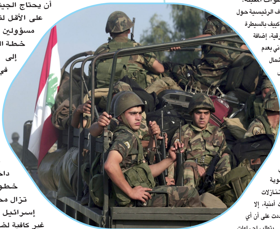
عناصر من الجيش اللبناني في بيروت

وكانت الحكومة اللبنانية قد أقرت خطة نزع سلاح حزب الله في أغسطس الماضي، وكلفت الجيش اللبناني بتنفيذها على خمس مراحل، حيث أنجز الجيش المرحلة الأولى مطلع يناير الماضي في جنوب نهر الليطاني، التي تمتد نحو 30 كلم من الحدود الجنوبية مع إسرائيل. أما المرحلة الثانية، فتشمل المنطقة الممتدة من شمال نهر الليطاني حتى نهر الأولي شمال صيدا، على بعد نحو 40 كلم جنوب بيروت، ويتوقع أن يحتاج الجيش أربعة أشهر على الأقل لتنفيذها. ووفق مسؤولين لبنانيين، فإن خطة الجيش تهدف إلى حصر السلاح في جميع المناطق اللبنانية، بما يضمن سيطرة الدولة ويحد من أي تهديد خارجي أو داخلي، إلا أن خطوات الجيش لا تزال محل شك من قبل إسرائيل التي اعتبرتها غير كافية لضمان الاستقرار على الحدود الجنوبية.