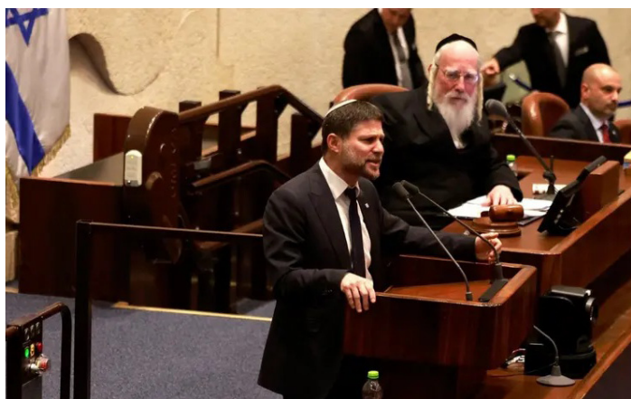
وزير المالية الإسرائيلي بتسليل سموتريتش

وفي هذا السياق، نددت بعثات 85 دولة في الأمم المتحدة بالإجراءات الإسرائيلية الأخيرة، معتبرة أنها تمثل ضماً فعلياً للأراضي الفلسطينية وتقوض جهود حل الدولتين، فيما أعربت عن خشيتها من استمرار سياسة التوسع الاستيطاني التي تهدد استقرار المنطقة وحقوق الفلسطينيين في الضفة وغزة.