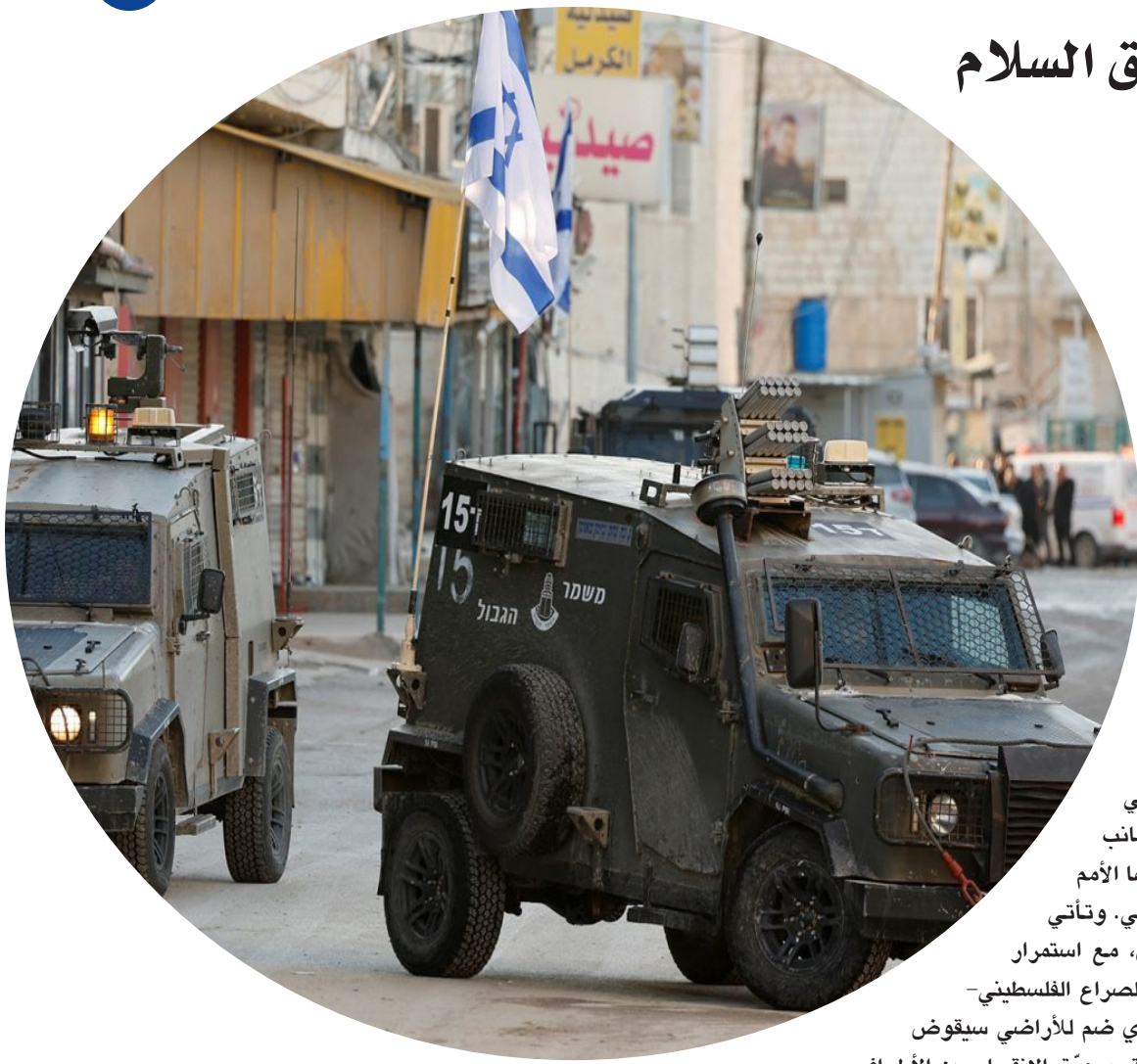
سيارات عسكرية إسرائيلية في الضفة الغربية

وكان الأمين العام للأمم المتحدة أنطونيو غوتيريش قد دعا في وقت سابق إسرائيل