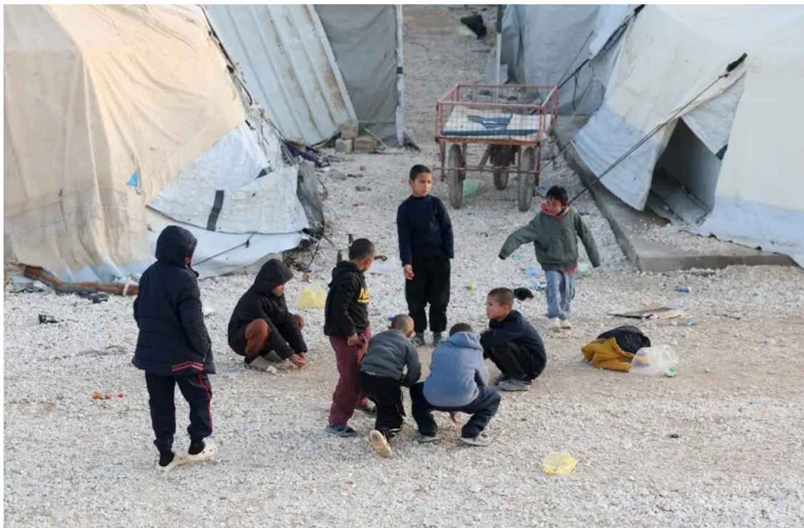
أطفال في مخيم الهول بالحسكة

وفي سياق منفصل، شهد الجنوب السوري توغلاً إسرائيلياً جديداً في ريف القنيطرة، حيث دخلت قوات إسرائيلية إلى قرية عين زيوان وأقامت حاجزاً مؤقتاً ونفذت عمليات تفتيش لمنازل المدنيين، كما أعادت وصول الطلاب إلى مدارسهم، وفق ما أفادت وسائل إعلام رسمية سورية.