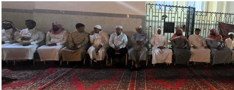
والد وأشقائه الفقيد في مجلس العزاء