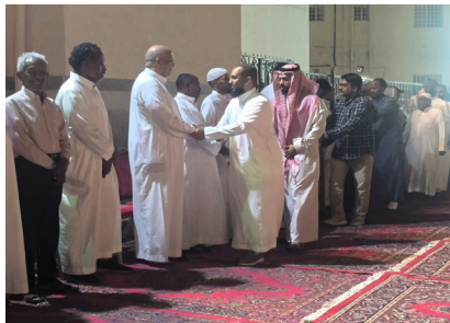
أسرة الفقيد لدى تلقيها التعازي