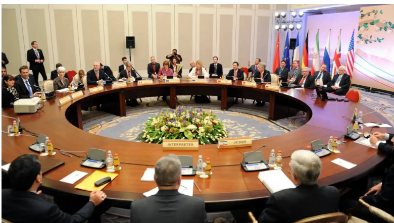
من المفاوضات الأمريكية الإيرانية في جنيف

الإيراني مسعود بزشكيان على أن بلاده لا تسعى إلى امتلاك سلاح نووي، لكنها لن تتخلى عن برنامجها النووي السلمي. وأكد استعداد طهران للخضوع لأي آليات تحقق دولية لإثبات سلمية البرنامج. في الوقت ذاته، ترفض إيران إدراج ملفات أخرى ضمن التفاوض، مثل برنامجها الصاروخي أو علاقاتها مع الجماعات المسلحة في المنطقة، وهو ما يشكل إحدى أبرز نقاط الخلاف مع واشنطن.