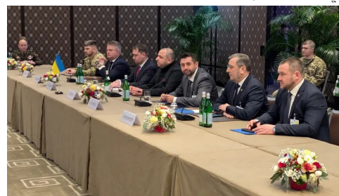
الوفد الأوكراني في المحادثات الثلاثية في جنيف

انتهت جولة المحادثات الثلاثية التي جمعت وفوداً من روسيا وأوكرانيا والولايات المتحدة في جنيف دون تحقيق اختراق حاسم، في وقت أكد فيه الرئيس الأوكراني فولوديمير زيلينسكي أن المباحثات كانت صعبة وتعكس استمرار التباين العميق بين الجانبين حول القضايا الأساسية المرتبطة بإنهاء الحرب المستمرة منذ أربع سنوات. وأوضح أن اللقاءات أفضت إلى بعض الخطوات التمهيدية، إلا أن الخلافات ما زالت قائمة بشأن ملفات مركزية، وفي مقدمتها مستقبل الأراضي الواقعة شرق البلاد، إضافة إلى وضع محطة زابورجيا للطاقة النووية التي تسيطر عليها القوات الروسية، والتي تُعد من أبرز نقاط التوتر في مسار التفاوض.