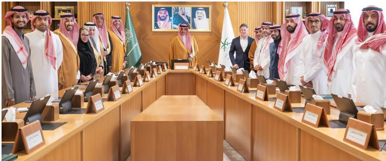
وزير الإعلام ومسؤولو الشركات عقب توقيع الاتفاقيات

11 مقعداً 3 لبرامج الدبلوم 56 مقعداً 2 البكالوريوس 21 مقعداً 1 لدرجة الماجستير