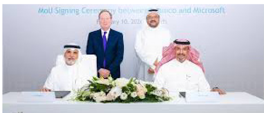
توقيع مذكرة تفاهم بين أرامكو ومايكروسوفت