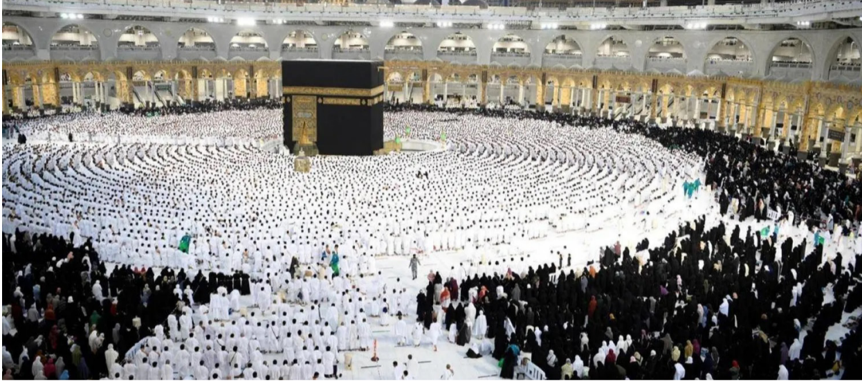
جمع من ضيوف الرحمن يطوفون حول الكعبة المشرفة

العمرة بتنفيذ تعاقدها المعتمدة بدقة، وحرصها على الارتقاء بمستوى الخدمات المقدمة للمعتمرين، انسجاماً مع مستهدفات رؤية المملكة 2030. وشددت الوزارة على أنها لن تتهاون مع أي تقصير أو إخلال بالالتزامات التعاقدية، مؤكدة أن حقوق ضيوف الرحمن أولوية قصوى، وأن جودة الخدمات المقدمة تمثل خطاً أحمر لا يُسمح بتجاوزه، داعية جميع شركات ومؤسسات العمرة إلى الالتزام التام بالضوابط والتعليمات المعتمدة، وتقديم الخدمات وفق البرامج المتعاقد عليها.