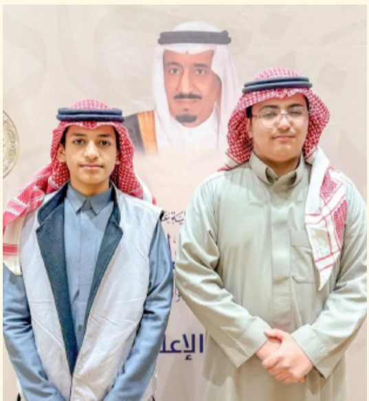
مشاركين في مسابقة الملك سلمان لحفظ القرآن الكريم

المشاركون في مسابقة الملك سلمان للقرآن: التنافس على كتاب الله شرف ورفعة ووسام فخر