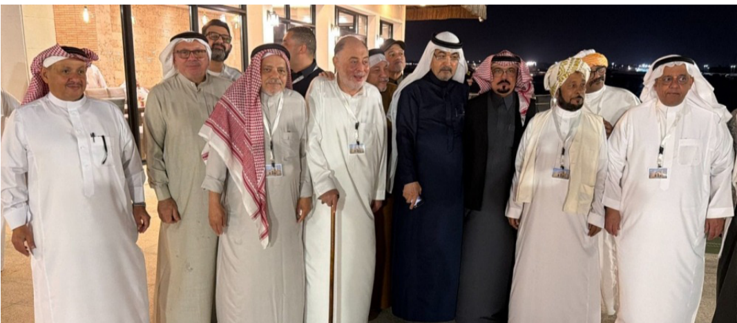
سكان حارة الصحيفة خلال اللقاء