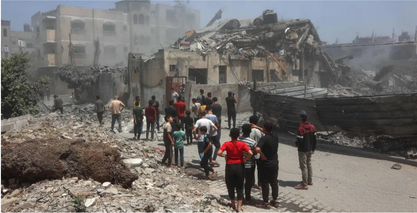
شباب وأطفال يطالعون الدمار الذي خلفته إحدى الغارات الإسرائيلية

12 دولة أخرى، بعضهم أبدى رغبة رسمية، بينما لم يتخذ آخرون موقفاً نهائياً في انتظار مزيد من التفاصيل حول مهام القوة وصلاحياتها. ويُرتقب أن تبدأ القوة الدولية مهامها في المستقبل القريب، في خطوة تهدف إلى تحقيق الاستقرار في غزة، والحفاظ على وقف إطلاق النار، ومنع تجدد العمليات العسكرية، مع الحفاظ على سيادة القرارات الفلسطينية الداخلية.