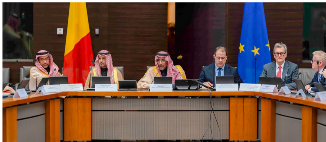
بندر الخريف خلال اجتماع في بروكسل لتعزيز التعاون

مع المفوضة الأوروبية لشؤون المتوسط، والمفوض الأوروبي للتجارة والأمن الاقتصادي. وبحسب (واس)، ناقش الاجتماعات المشتركة في القطاعات ذات الأولوية، بما يعزز مكانة المملكة كشريك محوري في دعم الأمن الاقتصادي، وتأمين إمدادات المعادن الحيوية في العالم، واستكشاف فرص تكامل سلاسل القيمة الصناعية بين المملكة ودول الاتحاد، مؤكداً حرص المملكة على رفع مستوى التنسيق المشترك، بما يعزز الاستقرار الاقتصادي والمرونة تجاه المتغيرات العالمية.