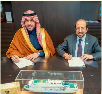
توقيع اتفاقية المنطقة اللوجستية

جرى توقيع الاتفاقية في المقر الرئيسي للشركة بمدينة جنيف السويسرية، عقب مباحثات مع قيادات الشركة، تناولت سبل تعزيز التعاون المشترك، وذلك في إطار مساعي المملكة الرامية إلى ترسيخ مكانتها مركزاً لوجستياً عالمياً.