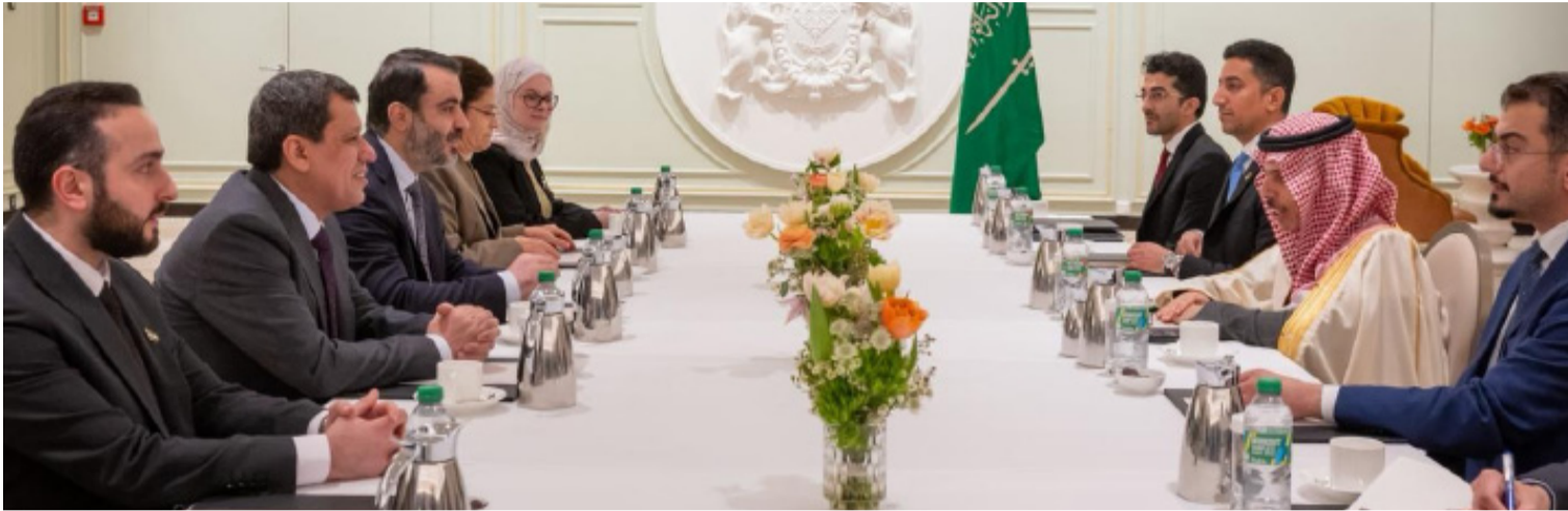
الأمير فيصل بن فرحان خلال لقائه أسعد الشيباني أمس في ميونخ