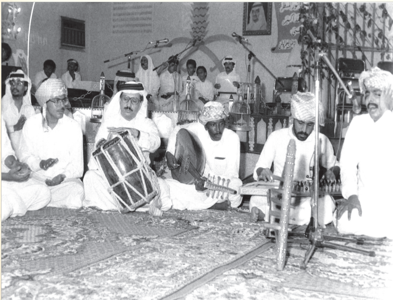
الفرق الشعبية السعودية ارث أصيل ضارب في القدم