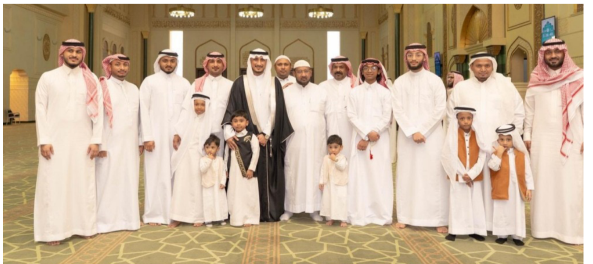
العريس يتوسط أقاربه وإخوانه وأرحامه