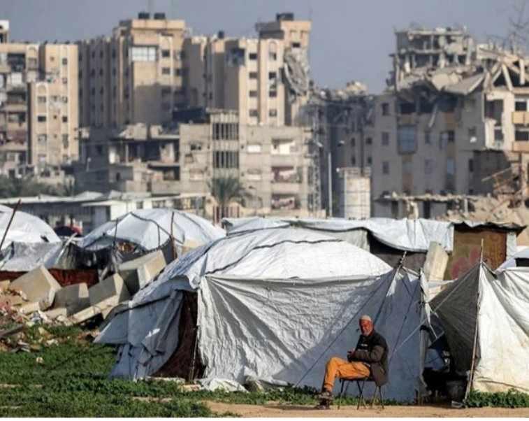
مخيم وسط قطاع غزة

الماضي بناءً على خطة الرئيس الأمريكي دونالد ترمب، وتضم 15 شخصية فلسطينية معتدلة ذات خبرة مهنية وفنية في العمل التنموي والإغاثي والإنساني داخل القطاع، بعيداً عن الاستقطابات السياسية. وتشمل مهام اللجنة إدارة شؤون القطاع اليومية تحت إشراف مجلس غزة، والإشراف على إعادة الإعمار بميزانية محددة لمدة عامين.