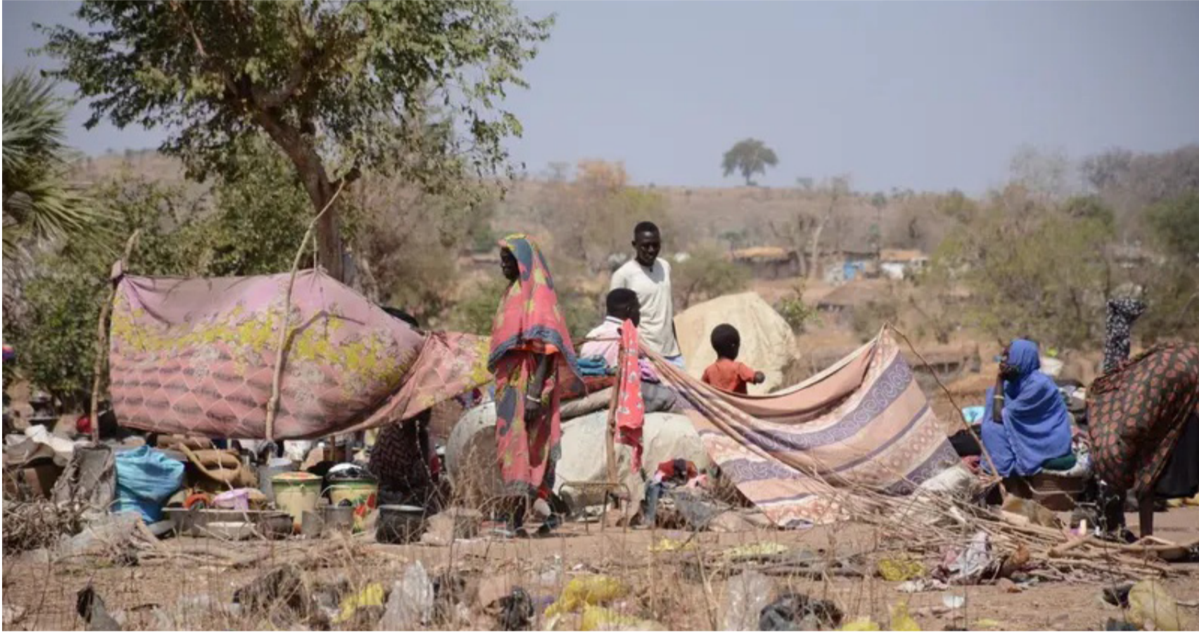
أسر نازحة في دارفور

سأهم في توسيع رقعة القتال وإطالة أمد الحرب، محولاً النزاع إلى حرب مفتوحة واسعة النطاق وأزمة إنسانية حادة، ما يعكس أزمة مركبة تجمع بين جرائم واسعة ضد المدنيين، انهيار إنساني، وصراع إقليمي غير مباشر. ومع تصاعد الضغوط داخل الكونغرس، يبدو أن ملف السودان يتجه نحو مرحلة جديدة من الاهتمام الدولي، وسط تحذيرات من تفاقم الانفجار وعدم الاستقرار في البلاد والمنطقة.