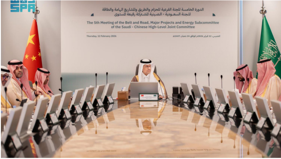
الأمير عبدالعزيز بن سلمان خلال اجتماع عبر الاتصال المرئي

ناقش الجانبان مجالات التعاون التي يسعى البلدان إلى تطويرها، وتشمل قطاعات الطاقة، والاستثمار، والصناعة، والمعادن، والفضاء، والمياه، والنقل، والمشاريع الهامة. يأتي الاجتماع تأكيداً لحرص الجانبين على تعزيز الشراكة الإستراتيجية بينهما، كما جرى تسليط الضوء على الفرص المتاحة في إطار رؤية المملكة 2030 ومبادرة الحزام والطريق، بما يعزز المصالح المتبادلة ووافق التعاون المستقبلي.