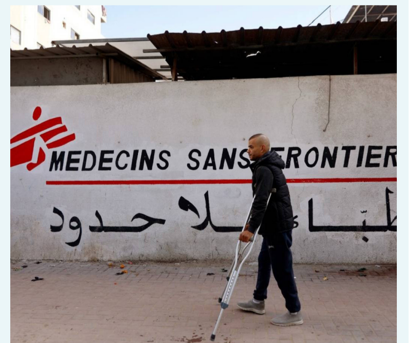
شاب مصاب أمام مقر منظمة أطباء بلا حدود في غزة