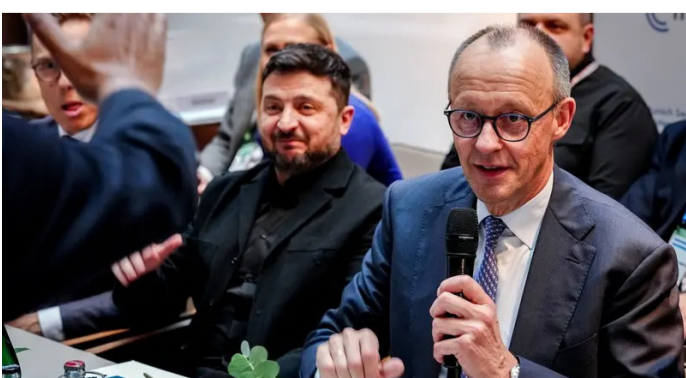
زيلينسكي خلال مؤتمر ميونخ

وتعقد الجولة الجديدة من محادثات السلام الثلاثية بين أوكرانيا وروسيا والولايات المتحدة في جنيف يومي 17 و18 فبراير الجاري، وفق تصريحات الكرملين. وسيقود وفد موسكو فلاديمير ميدفينسكي، المعروف بمواقفه المتشددة في المفاوضات السابقة،