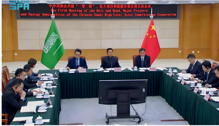
الجانب الصيني خلال الاجتماع المشترك