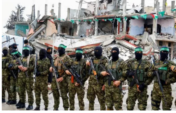
عناصر من حركة حماس في قطاع غزة

رفضت الحركة تسليم أسلحتها، والقضايا العالقة. وشدد على أن الحركة لن تتخلى عن أسلحتها ما لم تلتزم إسرائيل بالاتفاق، في إشارة واضحة إلى استمرار التوتر والصراع بين الطرفين رغم سريان تفاهات لوقف إطلاق النار بوساطة إقليمية ودولية. وتأتي هذه التصريحات في خضم أجواء توتر ميداني مستمرة في قطاع غزة، حيث يتبادل الطرفان الاتهامات بخرق التفاهات، وسط مخاوف متجددة من تجدد جولات التصعيد العسكري، ما يجعل المسار السياسي والأمني في غزة لا يزال هشاً ومعرضاً للتحديات المتنوعة.