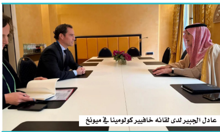
عادل الجبير لدى لقائه خافيير كولومينا في ميونخ

الجبير وممثل أمين عام «الناتو» يبحثان الموضوعات المشتركة