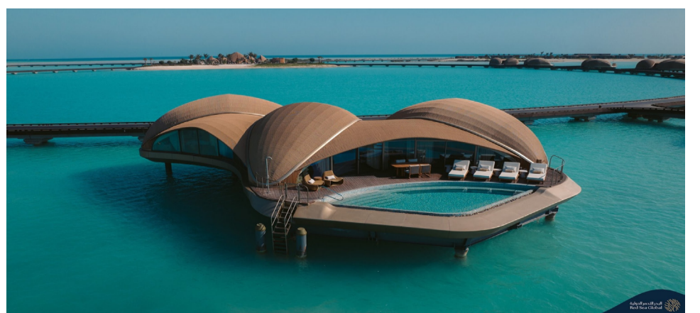
منتج تابع لشركة البحر الأحمر الدولية

البلاد (الرياض) حققت شركة البحر الأحمر الدولية إنجازاً نوعياً بإعلان وجهة "البحر الأحمر" كأول وجهة سياحية في العالم تحصل على الاعتماد الشامل من دليل فوربس للسفر، في خطوة تعكس تحول معايير التقييم من منشآت فندقية منفردة إلى منظومة متكاملة تغطي تجربة الضيف بالكامل. وجاء الاعتماد بعد عام