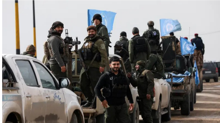
قوات الأمن الداخلي في القامشلي

لإدارة الذاتية الكردية في شمال شرق سوريا ضمن مؤسسات الحكومة السورية، وتسوية أوضاع الموظفين المدنيين، ومعالجة الحقوق المدنية والتعليمية، وتسهيل عودة النازحين بأمان. وشهد مؤتمر ميونخ للأمن لقاءً بارزاً بين وزير الخارجية السوري أسعد الشيباني وقائد قوات سوريا الديمقراطية مظلوم عدي، بحضور وزير الخارجية الأميركي