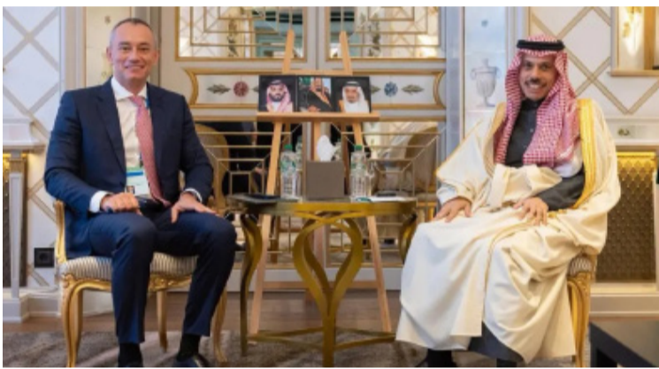
وزير الخارجية مستقبلاً نيكولاي ملاديتوف