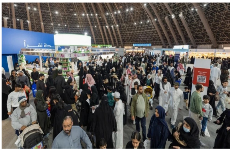
معرض جدة الدولي للكتاب "أرشيضية"

كشفت وزارة الداخلية، أمس (السبت)، أن الحملات الميدانية المشتركة لمتابعة وضبط مخالفين أنظمة الإقامة والعمل وأمن الحدود، أسفرت خلال أسبوع، عن ضبط 21029 ألف مخالف في مناطق المملكة كافة. وأوضحت وزارة الداخلية أن الحملات أسفرت عن ضبط 12875 مخالفاً لنظام الإقامة، و4778 مخالفاً لنظام أمن الحدود، و3376 مخالفاً لنظام العمل، فيما بلغ إجمالي من تم ضبطهم خلال محاولتهم عبور الحدود إلى داخل المملكة 2307 شخصاً، منهم 47% يمينو الجنسية، و52%