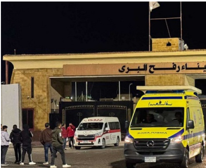
سيارة إسعاف في معبر رفح

ويُفاقم إلغاء تنسيق سفر المرضى والجرحى من الأزمة الإنسانية في قطاع غزة، لا سيما في ظل النقص الحاد في الإمكانيات الطبية واستمرار تدهور الأوضاع الصحية، وسط دعوات متكررة من منظمات إنسانية دولية لتجنيب المدنيين والمنشآت الصحية تبعات التصعيد العسكري.