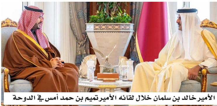
الأمير خالد بن سلمان خلال لقائه الأمير تميم بن حمد أمس في الدوحة

سمو أمير دولة قطر تحياته وتقديره لخادم الحرمين الشريفين وسمو ولي العهد رئيس