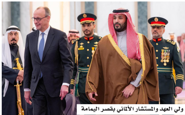
ولي العهد والمستشار الألماني بقصر اليمامة

الوطني، وصاحب السمو الأمير فيصل بن فرحان بن عبد الله وزير الخارجية، وصاحب السمو الأمير بدر بن عبد الله بن فرحان وزير الثقافة، ووزير الدولة عضو مجلس الوزراء مستشار الأمن الوطني الدكتور مساعد بن محمد العيبان، ووزير التجارة الدكتور ماجد بن عبدالله القصبي، ووزير المالية محمد بن عبدالله الجدعان (الوزير المرافق)، ووزير الاستثمار المهندس خالد بن عبدالعزيز الفالح، وسفير خادم الحرمين الشريفين لدى ألمانيا فهد الهذال. فيما حضر من الجانب الألماني، سكرتير الدولة المتحدث باسم الحكومة الاتحادية شتيفان كورنيليوس، والسفير الألماني لدى المملكة ميثائيل كيندسغراب، ومستشار دولة المستشار الاتحادي لشؤون السياسة الخارجية الألمانية الدكتور غونتر زاوتر، ومستشار دولة المستشار الاتحادي لشؤون السياسة الاقتصادية والمالية الدكتور ليفين هول، وعدد من كبار المسؤولين.