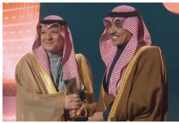
وزير الإعلام مكرمًا أحد الفائزين