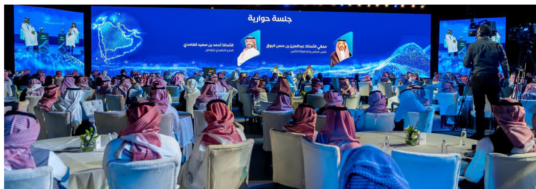
لقاء هيئة التأمين مع قادة القطاع في الرياض

1 23 مليون مستفيد 2 16 مركبة 3 38 ألف وظيفة