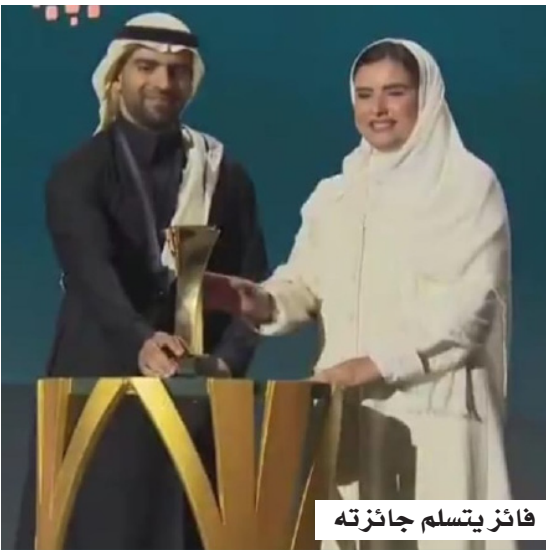
فائز يتسلم جائزته