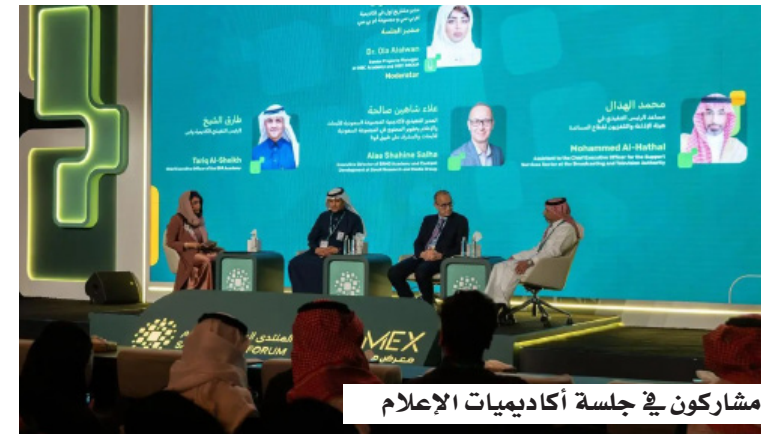
مشاركون في جلسة أكاديميات الإعلام

المنهج التربوية لتواكب متطلبات سوق العمل، مع التأكيد على الحاجة المتزايدة إلى الإعلام المتخصص، الذي يتطلب مهارات فنية وتقنية إلى جانب القدرة على صناعة المحتوى والسر القصصي، مشيرين إلى أن الأكاديميات تؤدي دوراً محورياً في بناء الشخصية الإعلامية منذ المراحل الأولى وحتى المستويات القيادية. واختتمت الجلسة بالتأكيد على أن التحدي التقليدي يقبل في الانتقال من مفهوم التدريب التقليدي إلى بناء رحلة إعداد أكاديمية متكاملة تسبق دخول الإعلامي إلى سوق العمل، وتعزّز جاهزيته المهنية، بما يسهم في تطوير القطاع الإعلامي ورفع كفاءته.