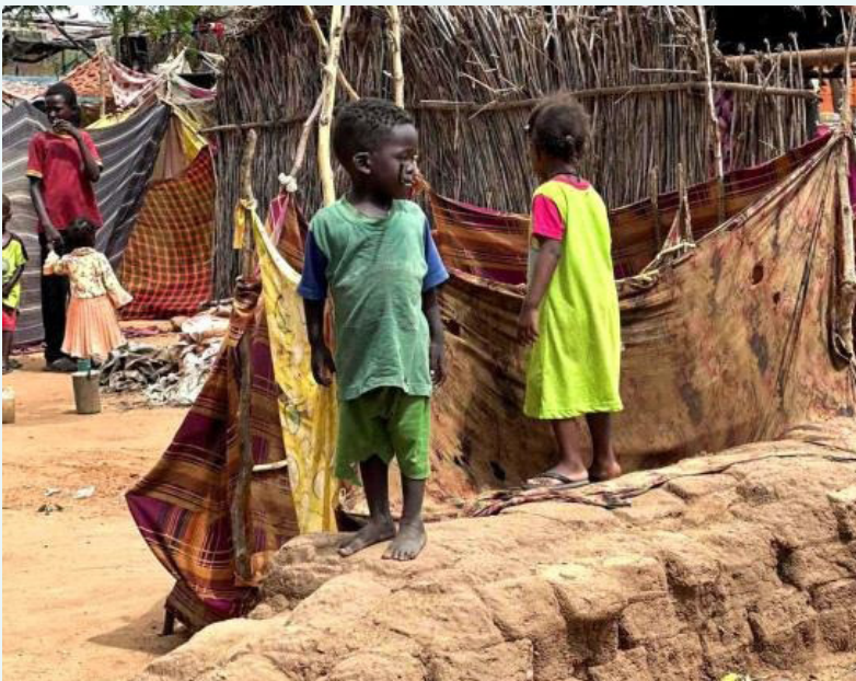
أطفال في معسكر نازحين بدارفور

في سياق متصل، شارك وكيل الأمين العام للأمم المتحدة المعني بالشؤون الإنسانية، توم فليتنر، في فعالية استضافتها الولايات المتحدة في