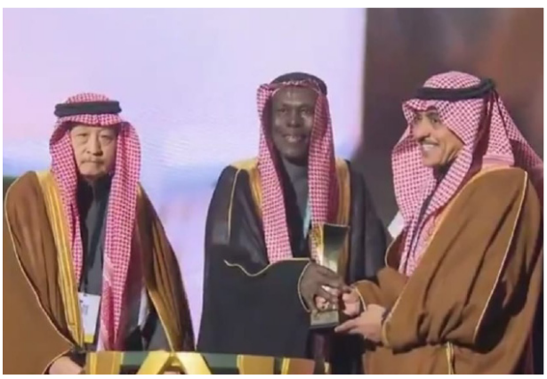
.. ويكرم فائزاً آخر