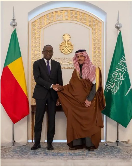
الأمير فيصل بن فرحان مستقبلاً أوشلجون أجادي أمس في الرياض

الفنائي بين البلدين، وبحث المستجدات الإقليمية والدولية والجهود المبذولة بشأنها. حضر الاستقبال، نائب وزير الخارجية المهندس وليد بن عبد الكريم الخريجي، ووكيل وزارة الخارجية للشؤون السياسية السفير الدكتور سعود الساطي.