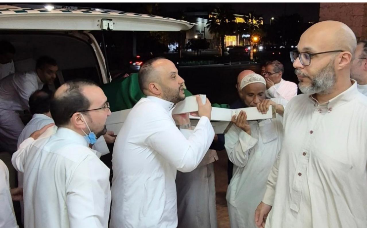
الفقيدة محمولة على الأكتاف من قبل أسرتها