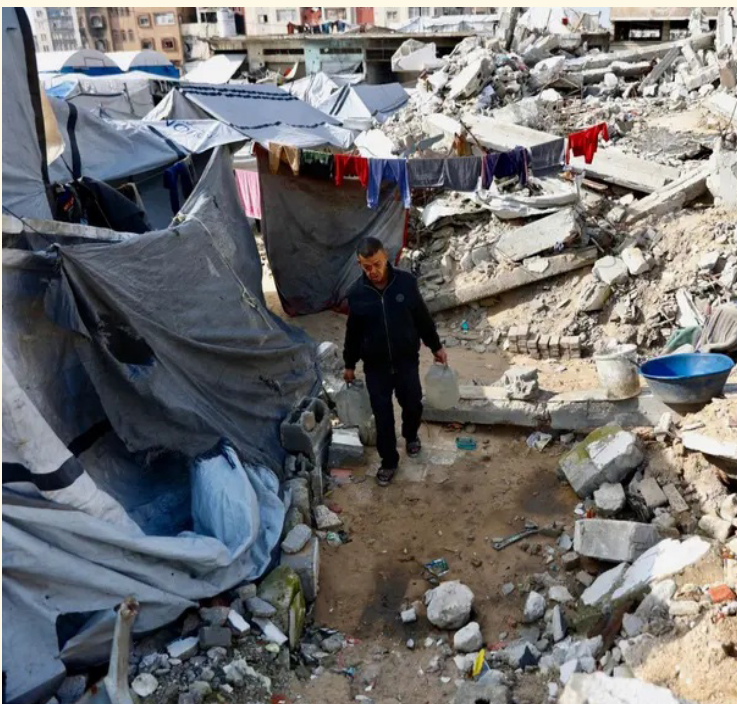
مخيم نازحين في قطاع غزة