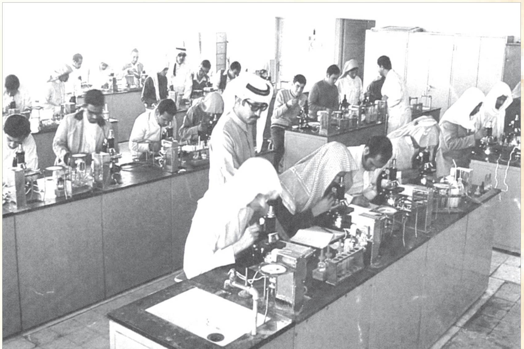
تدريب عملي للشباب في المختبرات والمعامل للحاق بركب النهضة العلمية المتسارعة التي انتظمت البلاد