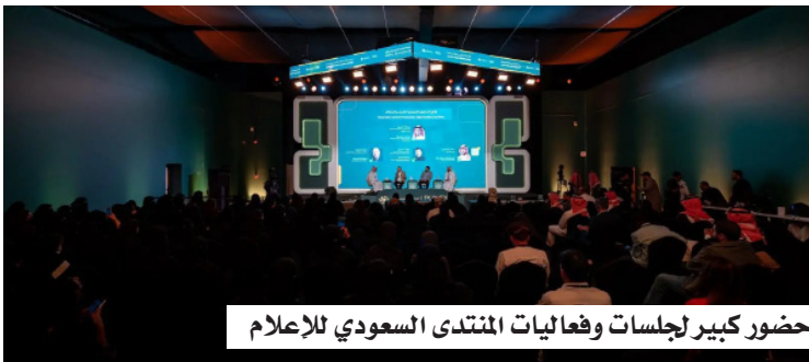
حضور كبير لجلسات وهاليات المنتدى السعودي للإعلام

شهد الإعلام الرسمي خلال السنوات الأخيرة تحولا جوهريا في دوره من مجرد نقل الأخبار إلى صناعة التأثير وبناء الوعي وتعزيز الثقة بين المؤسسات والمجتمع. ففي المراحل الأولى، ركّز الإعلام على الإبلاغ البسيط والموثوق لتعزيز المصداقية، لكن مع تطور أدوات الاتصال وتعدد المصادر الرقمية، أصبح نقل الخبر وحده غير كاف لتحقيق الأثر المطلوب. اليوم، أصبح الجمهور شريكا فاعلا، ما يحتم صياغة الرسائل الإعلامية بعق ووضوح، مع مراعاة احتياجات وتوقعات الجمهور. واختيار اللغة والتوقيت والمنصة المناسبة. وفي ظل هذا التحول انتقالياً نوعياً من الإبلاغ إلى التأثير، حيث تهدف الرسائل الإعلامية