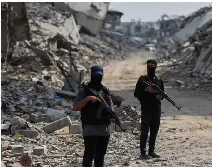
عناصر من حماس في غزة

وفي السياق ذاته، كانت الولايات المتحدة قد أبلغت مجلس الأمن الدولي، الأسبوع الماضي، أن عملية نزاع السلاح في قطاع غزة ستتم عبر آلية متفق عليها، ومدعومة ببرنامج "إعادة شراء" للأسلحة بتمويل دولي. وأوضح المبعوث الأمريكي لدى الأمم المتحدة، مايك والتس، أن واشنطن، إلى جانب 26 دولة منضوية ضمن ما يسمى "مجلس السلام" بقيادة الرئيس ترمب وبالتشاور مع اللجنة الوطنية الفلسطينية، ستكتف ضغوطها على حركة حماس لنزع سلاحها.