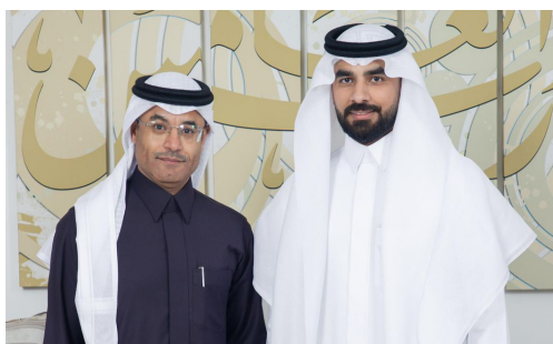
العريس مؤيد ووالد العروس