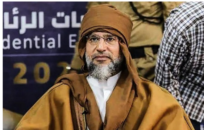
سيف الإسلام القذافي

وقال المجلس في بيان رسمي: إن التحقيقات ستتم بمساندة الدعم الفني والخبرات اللازمة ضمن الأطر القانونية، بهدف تعزيز الشفافية وتسريع إعلان النتائج، بما يسهم في استعادة ثقة الرأي العام الليبي. وشدد البيان على ضرورة ضبط الخطاب العام ورفض أي تحريض قد يستغل الجريمة لأهداف سياسية، تقوض مسار المصالحة الوطنية.