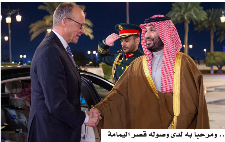
.. ومرحباً به لدى وصوله قصر اليمامة