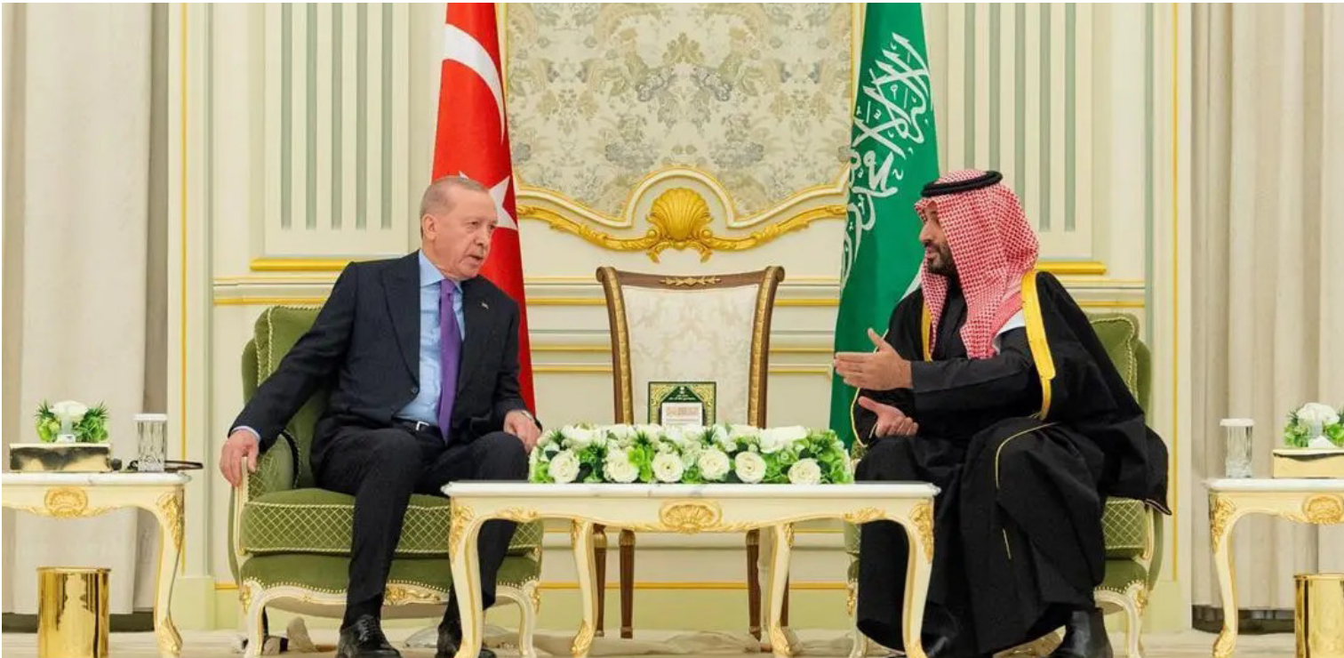
الأمير محمد بن سلمان مستقبلاً رجب أردوغان في الرياض

وقال البيان: إن المباحثات بين السعودية وتركيا أكدت عمق الروابط الأخوية والتاريخية بين البلدين وشعبيهما الشقيقين، وذلك خلال الاجتماع الرسمي بين صاحب السمو الملكي الأمير محمد بن سلمان بن عبدالعزيز آل سعود ولي العهد رئيس مجلس الوزراء، وفخامة رئيس جمهورية تركيا رجب طيب أردوغان. ونقل الجانبان حيياتهما وتبنيتهما بالصحة والعافية والتقدم والرفي لشعبي البلدين، مؤكداً الحرص على تطوير التعاون في جميع المجالات. وأشار البيان أن الجانب التركي ثمن الجهود، التي تبذلها المملكة في خدمة الحرمين