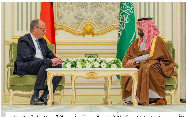
الأمير محمد بن سلمان مستقبلاً فريدريش ميرتس أمس في قصر اليمامة بالرياض

الوطني، وصاحب السمو الأمير فيصل بن فرحان بن عبد الله وزير الخارجية، وصاحب السمو الأمير بدر بن عبد الله بن فرحان وزير الثقافة، ووزير الدولة عضو مجلس الوزراء مستشار الأمن الوطني الدكتور مساعد بن محمد العيبان، ووزير التجارة الدكتور ماجد بن عبدالله القصبي، ووزير المالية محمد بن عبدالله الجدعان (الوزير المرافق)، ووزير الاستثمار المهندس خالد بن عبدالعزيز الفالح، وسفير خادم الحرمين الشريفين لدى ألمانيا فهد الهذال. فيما حضر من الجانب الألماني، سكرتير الدولة المتحدث باسم الحكومة الاتحادية شتيفان كورنيليوس، والسفير الألماني لدى المملكة ميثائيل كيندسغراب، ومستشار دولة المستشار الاتحادي لشؤون السياسة الخارجية الألمانية الدكتور غونتر زاوتر، ومستشار دولة المستشار الاتحادي لشؤون السياسة الاقتصادية والمالية الدكتور ليفين هول، وعدد من كبار المسؤولين.