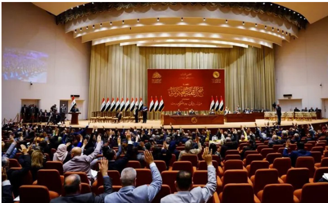
جلسة سابقة للبرلمان العراقي

ويعكس هذا التأجيل المستمر حالة الانقسام السياسي في العراق، والتي تُعيق استكمال المؤسسات الدستورية، وتزيد من الضغوط على الأحزاب الكردية لتقديم حل سريع يتيح استقرار العملية السياسية واستكمال تشكيل الحكومة الجديدة.