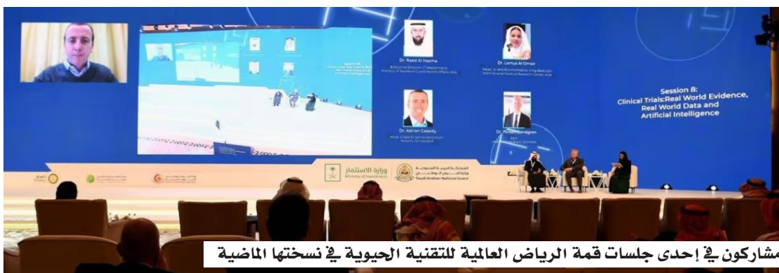
مشاركون في إحدى جلسات قمة الرياض العالمية للتقنية الحيوية في نسختها الماضية

وتُعد القمة أحد أهم الملتقيات الدولية على مستوى العالم، التي تضم نخبة من