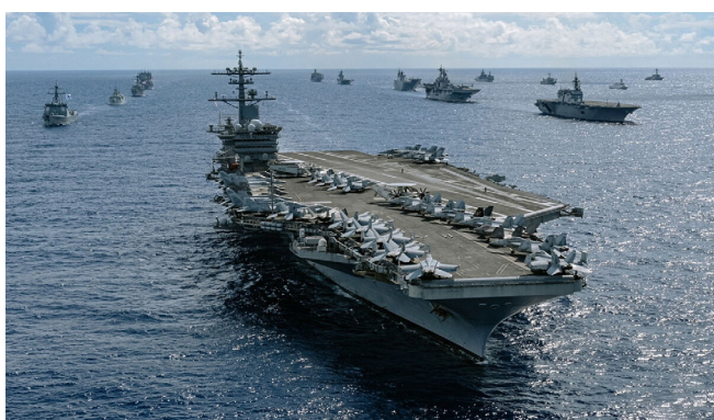
حاملة طائرات أمريكية عقب وصولها المنطقة

وفي إسرائيل، أشارت تقديرات الجيش إلى أن احتمال تنفيذ ضربة أمريكية ضد إيران قد يحدث خلال فترة تتراوح بين أسبوعين إلى شهرين، مع تحديد أربعة مطالب يجب أن يشملها أي اتفاق محتمل: تخصيص اليورانيوم، والبرنامج النووي، والصواريخ الباليستية، وأنزع إيران الإقليمية. المحللون العسكريون والدبلوماسيون يشيرون إلى أن المرحلة المقبلة مفتوحة على كل الاحتمالات، من التصعيد العسكري المباشر إلى فرض تسوية تحت ضغط القوة، مع استمرار واشنطن وطهران في إرسال رسائل متضاربة بين التهديد والتحاور.