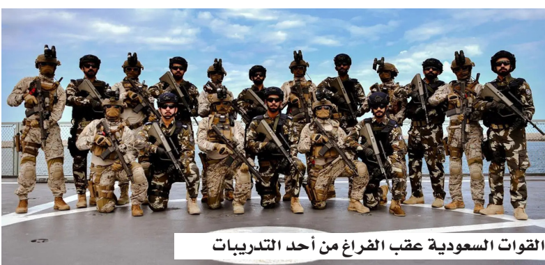
القوات السعودية عقب الفراغ من أحد التدريبات

والتخطيط والتنفيذ، إلى جانب التعاون والتنسيق بين البحريتين في مراقبة وحماية خطوط الملاحة البحرية. وأوضح أن التمرين شهد تنفيذ مجموعة من التدريبات النوعية شملت فرضيات وتشكيلات بحرية، وتدريب الطيارين البحري، ومكافحة الإرهاب البحري، وحق الزيارة والتفتيش، والبحث والإنقاذ، والحرب الإلكترونية، والتصدي لهجمات الزوارق السريعة، وتأمين الممرات البحرية وحماية السفن التجارية. وبين قائد التمرين أن مناورات السفن تضمنت تنفيذ سفن جلالة الملك رماية بالصواريخ والذخائر الحية في مسرح العمليات، مشيراً إلى أن المشاركين من البحريتين السعودية والعمانية أظهروا مستوى عالياً من الاحترافية والجاهزية القتالية، وإتقاناً في تنفيذ مختلف العمليات التي جرت أثناء التمرين.