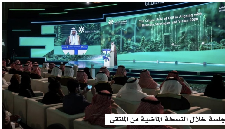
جلسة خلال النسخة الماضية من الملتقى

نخبة من الوزراء وصُناع القرار، والخبراء، والقيادات التنفيذية بالقطاع الخاص، وممثلي المنظمات الدولية؛ لمناقشة أبرز المستجدات والتجارب العالمية، واستعراض أفضل الممارسات، وتقديم حلول مبتكرة تسهم في تحقيق مستهدفات التنمية المستدامة عالمياً، وتعزيز تحقيق مستهدفات رؤية المملكة 2030.