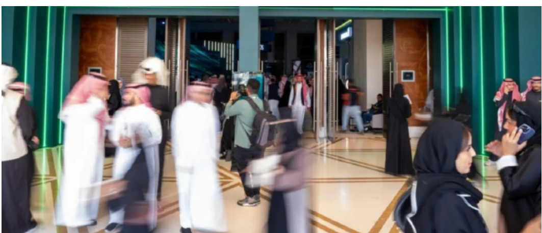
حضور إحدى فعاليات النسخة الماضية للمنتدى السعودي للإعلام