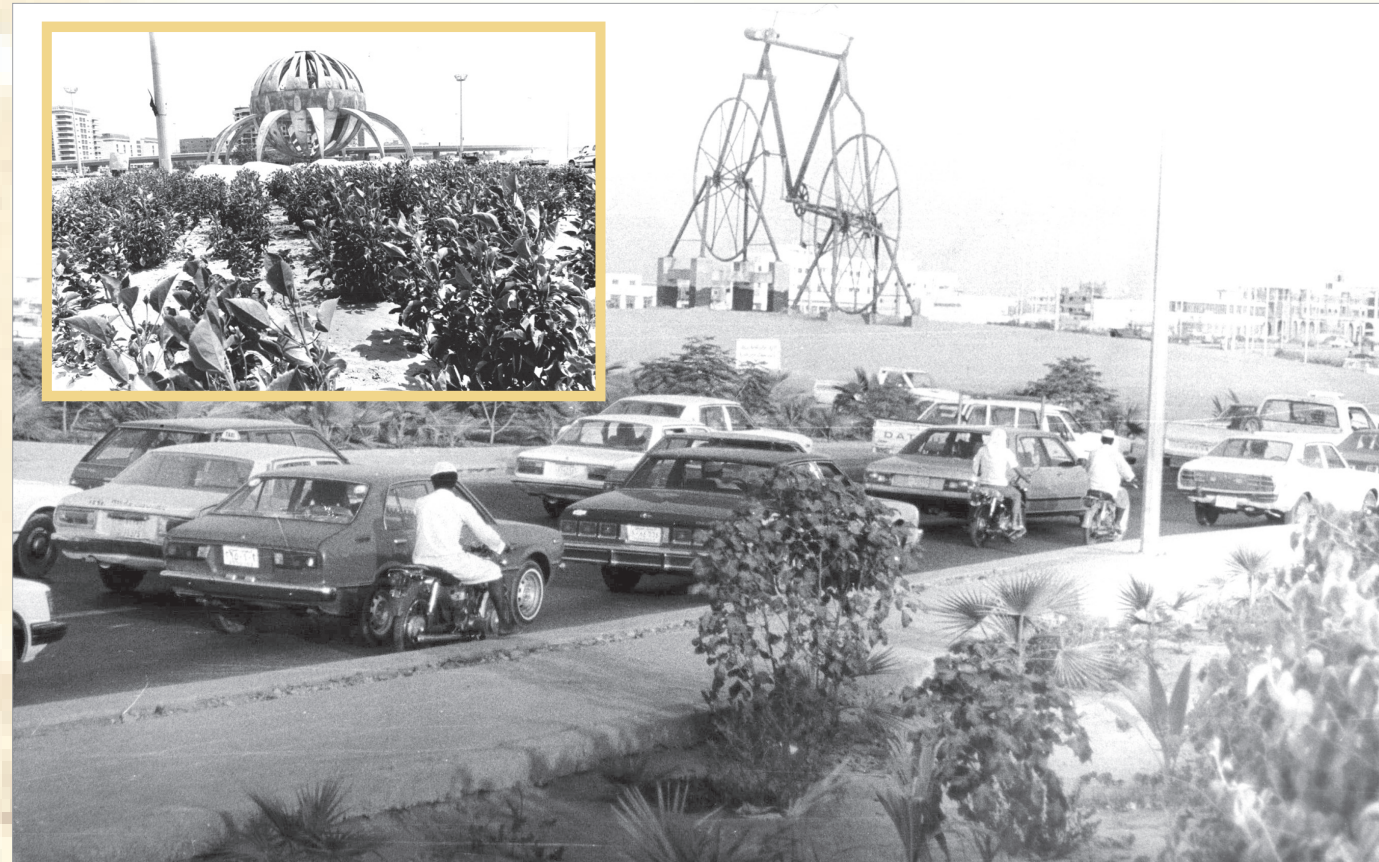
لقطات من زاوية ( حديث الكاميرا) المنشورة بمجلة (اقرأ)