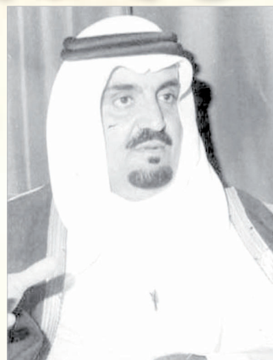
مشعل بن عبدالعزيز

• الاراضي المخصصة لبناء مدرستي الفارعة واملج، قامت لجنة خاصة، مشكلة من بعض المسؤولين في ادارة التعليم بالمدينة، بتسليمها الى المقاول الذي سيتولى بناءها لحساب وزارة المعارف.