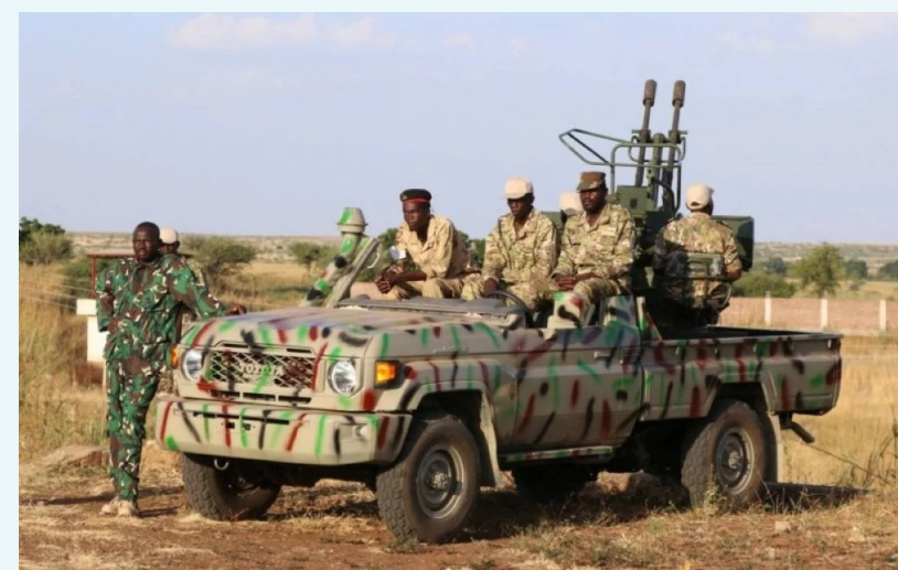
قوة من الجيش السوداني في الدلنج

وفي العاصمة استقبل مطار الخرطوم أمس أول رحلة طيران منذ اندلاع الحرب، وعلى متنها 160 راكباً قادمة من بورتسودان. وتترقب الأوساط الملاحية في السودان عودة 18 شركة طيران أجنبية إلى مطار الخرطوم الدولي خلال الفترة القريبة المقبلة، في خطوة من شأنها أن تُحدث تحولاً جذرياً في واقع الحركة الجوية بالبلاد، بعد سنوات من الانحصار في عدد محدود من الشركات منذ اندلاع الحرب في أبريل 2023، وفقاً لموقع "المشهد" السوداني.