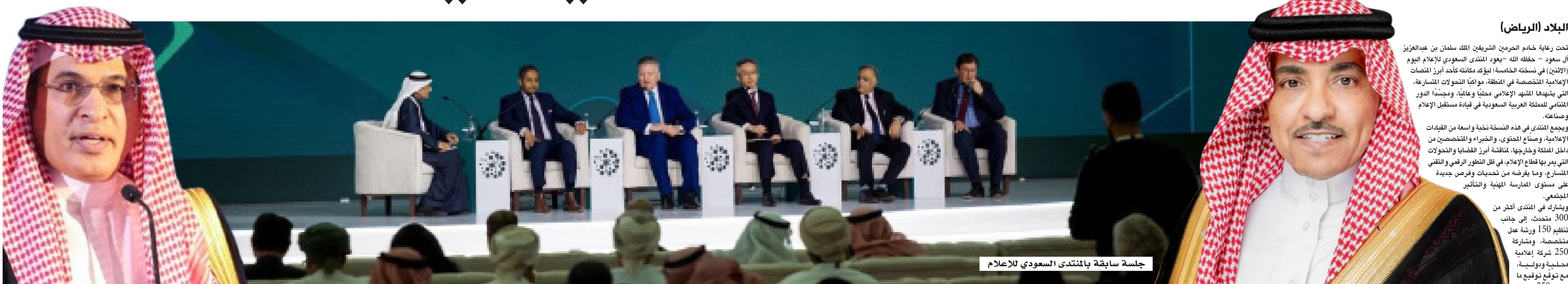
جلسة سابقة بالمنتدى السعودي للإعلام