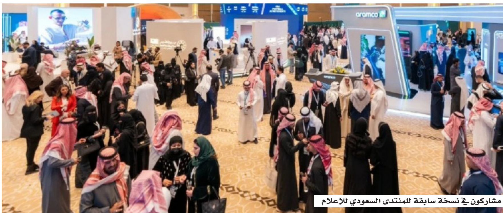
مشاركون في نسخة سابقة للمنتدى السعودي للإعلام