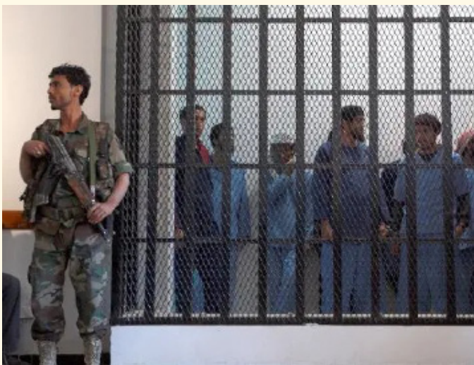
نزلاء داخل سجن المكلا المركزي

وفي السياق ذاته، كان أمن حضرموت قد نفى، في بيان صدر الأحد، صحة الأنباء التي تحدثت عن تعرض سجن المكلا لهجوم مسلح أو اقتحامه من قبل عناصر خارجية، مؤكداً