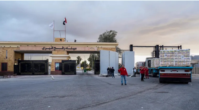
أشخاص ينتظرون عبور معبر رفح

في محيط القدس، تُستخدم ذريعة لتكثيف الإجراءات العسكرية وعمليات الهدم والإخلاء بحق الفلسطينيين. وتشهد مناطق شمال القدس، وخصوصاً محيط مخيم قلنديا وبلدة كفر عقب، توتراً متكرراً في ظل عمليات اقتحام وهدم متواصلة تنفذها القوات الإسرائيلية بحجة البناء غير المرخص. وتقول مصادر حقوقية إن هذه الإجراءات تندرج ضمن سياسة أوسع تهدف إلى إحكام السيطرة الأمنية والإدارية على محيط القدس، وتقليص الوجود الفلسطيني في تلك المناطق.