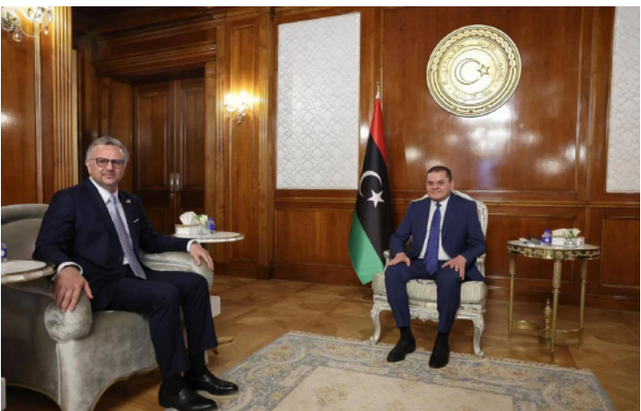
عبد الحميد الدبيبة خلال لقائه مسعد بولس في طرابلس

ومع ذلك، تبقى فرص نجاح هذا المسار مرهونة بمدى استعداد الأطراف الليبية لتقديم تنازلات متبادلة، وتوحيد الرؤى الإقليمية الداعمة للحل، إضافة إلى تفعيل دور المسار الأممي للوصول إلى خطوات عملية تشمل توحيد المؤسسات الحكومية والأمنية والعسكرية، وتهيئة الظروف لإطلاق مسار دستوري وانتخابي، يجدد الشرعية السياسية.