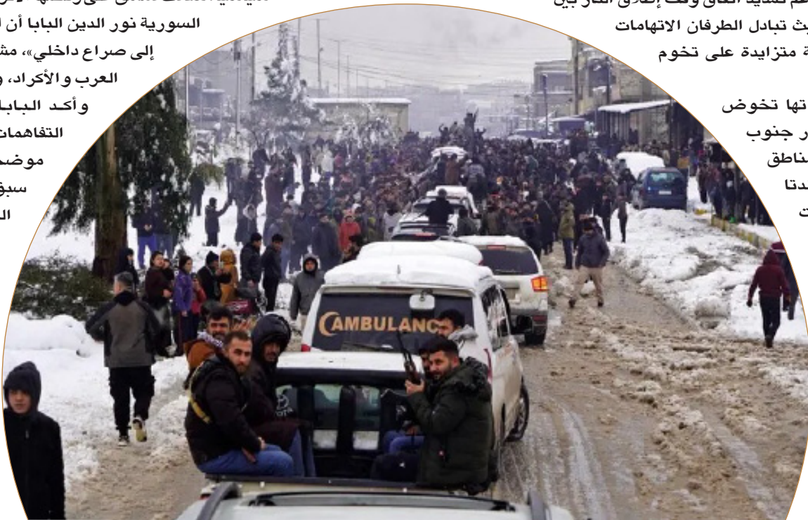
عناصر من قسد في عين العرب

ويأتي هذا التصعيد رغم إعلان الطرفين، قبل يومين، تمديد اتفاق وقف إطلاق النار لمدة 15 يوماً، بضبط من الولايات المتحدة، بعد أسابيع من المواجهات العنيفة. كما تزامن مع انسحاب قوات سوريا الديمقراطية من محافظتي الرقة ودير الزور، مقابل تقدم القوات الحكومية، ما أدى إلى تمرکز الجيش السوري على تخوم عين العرب، القريبة من الحدود التركية، والمعزولة جغرافياً عن بقية مناطق سيطرة «قسد» التي أعادت انتشارها في الحسكة.