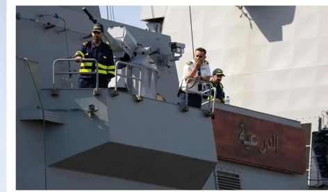
القوات البحرية لدى مشاركتها في التمرين بمسقط