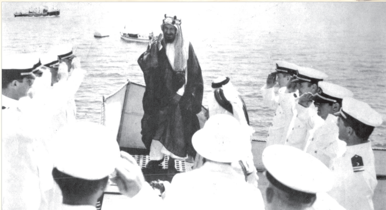
الملك عبدالعزيز - (المؤسس)