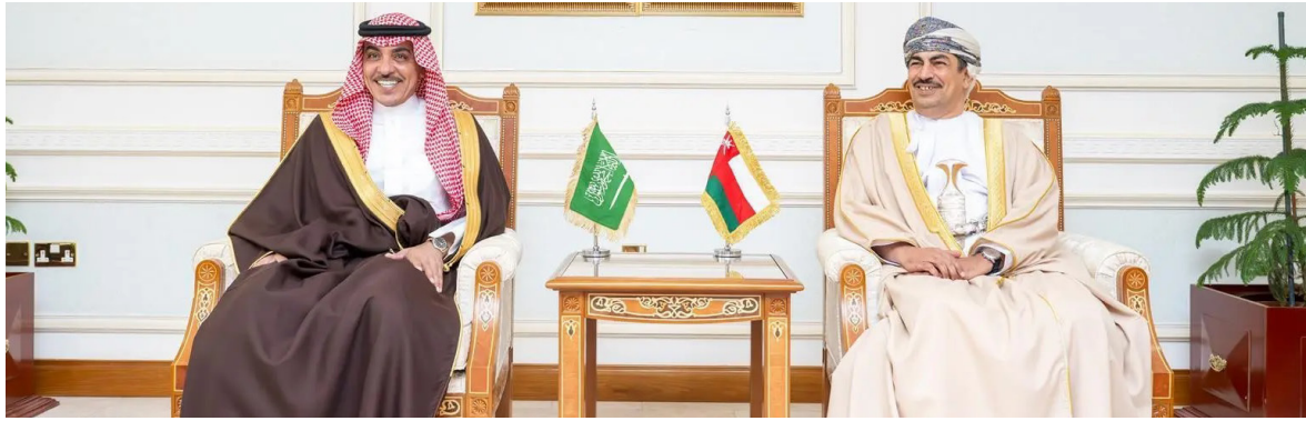
الدوسري لدى لقائه وزير الإعلام العماني

وعقد خلال الزيارة جلسة مباحثات مع المسؤولين في سلطنة عُمان، تناولت سبل تعزيز التعاون الإعلامي، وتبادل الخبرات، وتطوير الشراكات بين المؤسسات الإعلامية في البلدين الشقيقين. كما التقى وزير الإعلام عددًا من رؤساء التحرير والصحفيين العُمانيين، وأطلع على أبرز التجارب والخبرات العُمانية في مجالات الإعلام والاتصال، وبحث فرص الاستفادة منها في دعم المبادرات الإعلامية المشتركة. وأكد الوزير سلمان الدوسري خلال اللقاءات عمق العلاقات الأخوية والتاريخية، التي تجمع المملكة العربية السعودية وسلطنة عُمان، مشيرًا إلى الدور المحوري للإعلام في تعزيز هذه العلاقات، وتطوير التعاون في مختلف المجالات الإعلامية، بما يحقق تطلعات قيادتي البلدين وشعبيهما الشقيقين.