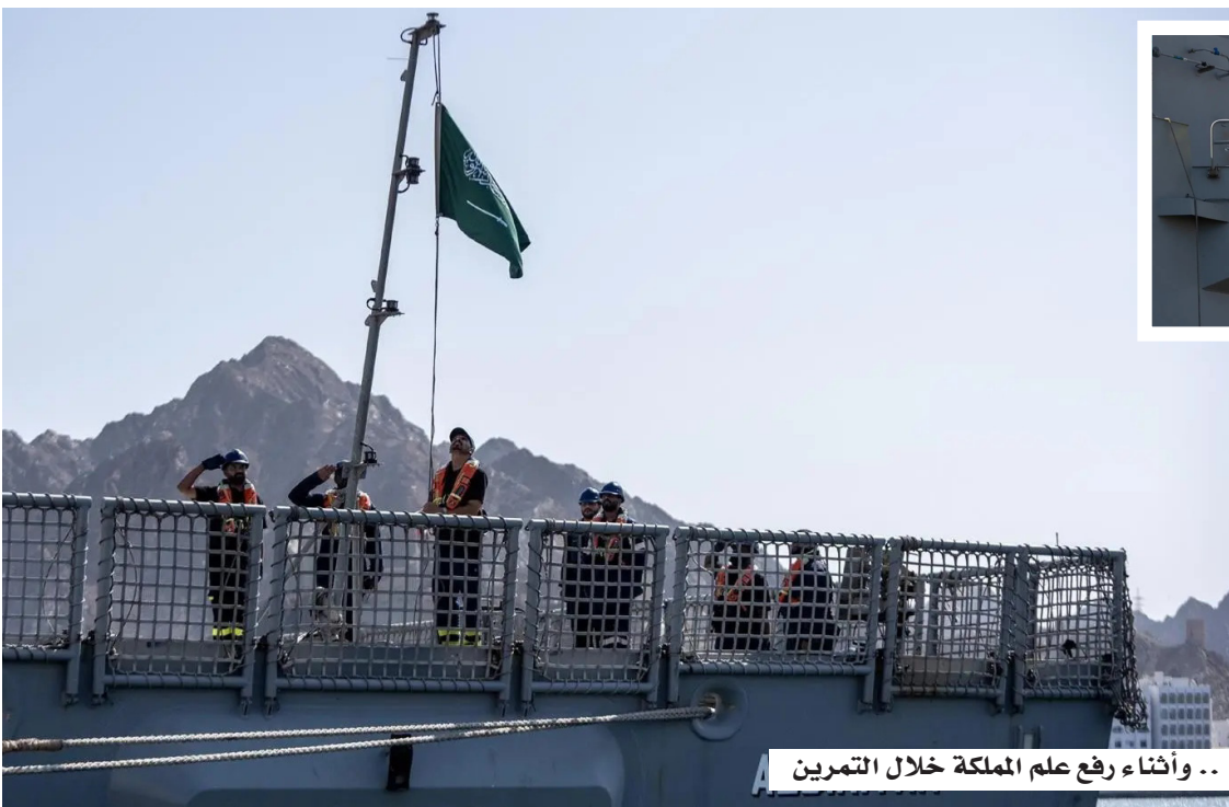
.. وأثناء رفع علم المملكة خلال التمرين