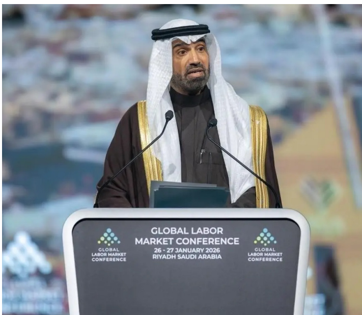
المهندس أحمد بن سليمان الراجحي متحدثًا في المؤتمر أمس

افتتح وزير الموارد البشرية والتنمية الاجتماعية المهندس أحمد بن سليمان الراجحي، في الرياض أمس، أعمال النسخة الثالثة من المؤتمر الدولي لسوق العمل، بمشاركة واسعة من وزراء العمل، وصناعة القرار، والخبراء من مختلف دول العالم؛ وذلك لمناقشة أبرز التحولات والتحديات التي تواجه أسواق العمل على المستويين الإقليمي والدولي. وأكد وزير الموارد البشرية والتنمية الاجتماعية، في كلمته الافتتاحية، أن أسواق العمل العالمية تشهد تحولات متسارعة نتيجة التطور التقني، والتحولات الديموغرافية، وتغير متطلبات المهارات، مشيرًا إلى أن هذه التحولات تتطلب تعزيز التعاون الدولي، وتكثيف تبادل الخبرات؛ لبناء أسواق عمل أكثر مرونة واستدامة.