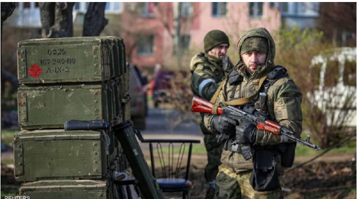
جنديان روسيان في دونباس

وأوضح الرئيس الأوكراني أن الضمانات الأمنية الأميركية تمثل أولوية قصوى لبلاده، في ظل المخاوف من أي اتفاق سلام قد يُفرض على كييف ويمنح موسكو مكاسب إقليمية. وتأتي هذه التصريحات في وقت تُجرى فيه المفاوضات بعيداً عن أوروبا، وهو ما يثير قلق دول الاتحاد الأوروبي من احتمال ممارسة ضغوط أميركية على أوكرانيا لقبول تسوية ترحج كفة روسيا.