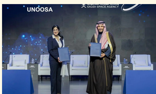
ممثلاً المملكة والأمم المتحدة عقب توقيع الاتفاقية