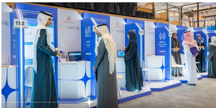
مشاركون في تحكيم معرض إبداع للعلوم والهندسة