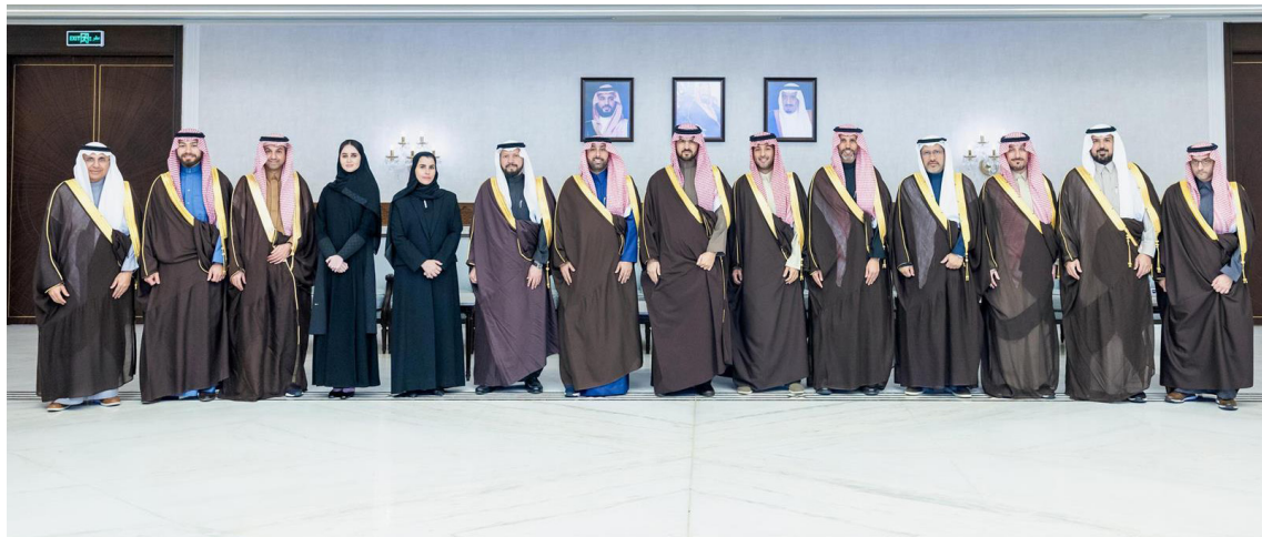
الأمير سعود بن بندر ورئيس وأعضاء مجلس الغرفة