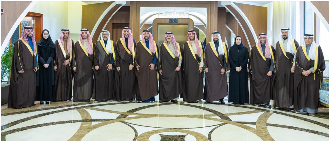
الأمير سعود بن نايف متوسطاً رئيس وأعضاء مجلس غرفة الشرقية

وأعضاء مجلس الإدارة، مؤكداً أهمية دور الغرفة في دعم التنمية الاقتصادية بالمنطقة، وتعزيز تنافسية بيئة الأعمال، وتمكين دور القطاع الخاص في مسارات النمو والاستثمار.