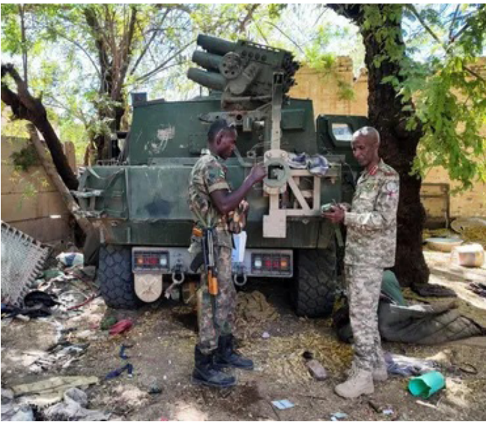
عنصران من الجيش السوداني في كردفان

وكانت مصادر ميدانية قد أفادت بأن الجيش السوداني تصدى لهجوم واسع استمر قرابة ساعتين، شنّه قوات الدعم السريع و«الحركة الشعبية – شمال» على عدة مناطق في إقليم النيل الأزرق، مستهدفاً منطقتي السبّك وتلّكن قرب الحدود مع جنوب السودان، وأسفر عن خسائر في صفوف المهاجمين أجبرتهم على الانسحاب.