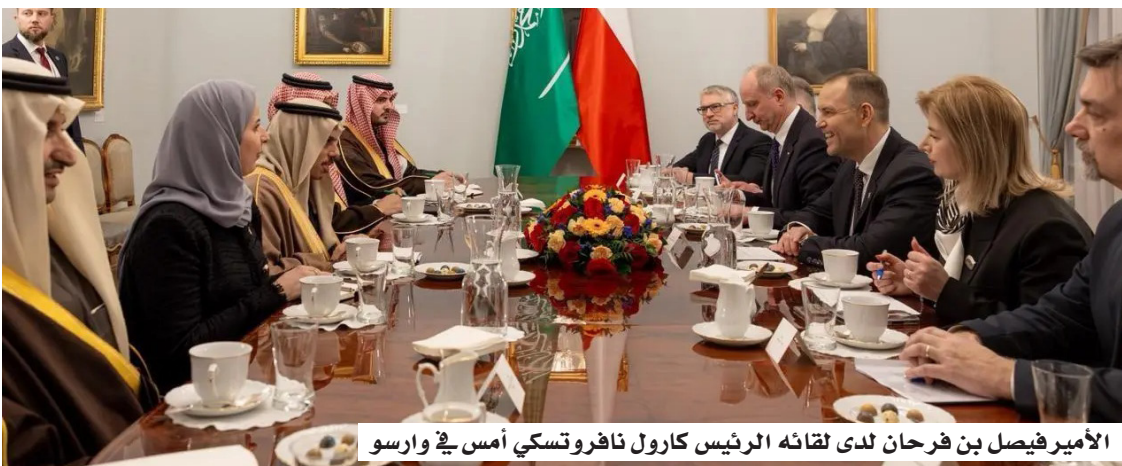
الأمير فيصل بن فرحان لدى لقائه الرئيس كارول نافروتسكي أمس في وارسو

استقبل فخامة الرئيس كارول نافروتسكي رئيس جمهورية بولندا، في القصر الرئاسي بالعاصمة البولندية وارسو أمس (الاثنين)، صاحب السمو الأمير فيصل بن فرحان بن عبدالله وزير الخارجية. ونقل وزير الخارجية في بداية الاستقبال تحيات خادم الحرمين الشريفين الملك سلمان بن عبدالعزيز، وصاحب السمو الملكي الأمير محمد بن سلمان ولي العهد رئيس مجلس الوزراء -حفظهما الله- لفخامته والشعب البولندي الصديق، فيما حملة فخامته تحياته وتقديره لخادم الحرمين الشريفين ولسمو ولي العهد، وتمنياته لحكومة وشعب المملكة بالمزيد من التقدم والازدهار. وجرى خلال الاستقبال استعراض علاقات التعاون بين البلدين الصديقين، ومناقشة مستجدات الأوضاع الإقليمية والدولية. من جهة ثانية، وقع وزير الخارجية، ونائب رئيس الوزراء وزير خارجية بولندا رادوسلاف سيكورسكي، بوارسو أمس، مذكرة تفاهم بشأن إنشاء مجلس التنسيق بين السعودية وبولندا برئاسة وزيري خارجية البلدين وعضوية عدد من المسؤولين. يأتي توقيع مذكرة إنشاء المجلس التنسيق في إطار توجيهاً قيادتي البلدين