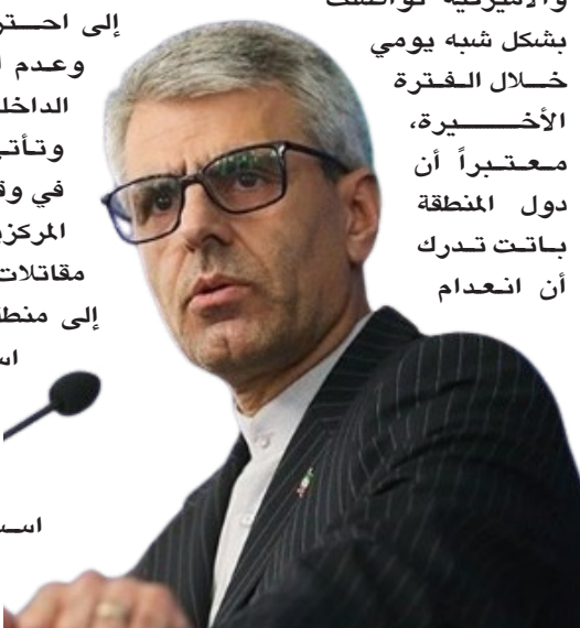
المتحدث باسم الخارجية الإيرانية إسماعيل بقائي