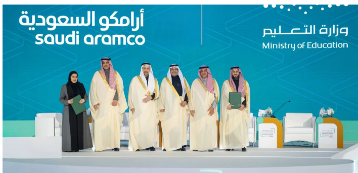
ممثلو أرامكو والتعليم عقب توقيع المذكرة أمس

كما تشمل مجالات التعاون تصميم وتنفيذ برامج تعليمية وتطبيقية في تخصصات العلوم والتقنية والهندسة والرياضيات (STEM)، بما يتوافق مع أولويات وزارة التعليم، ويعزز مهارات المستقبل والابتكار لدى الطلاب. وتشمل المذكرة كذلك تبادل البيانات والإحصاءات والخبرات بين الجهتين، إضافة إلى تطوير برامج توعوية وتدريبية في مجال الأمن والسلامة داخل المدارس.