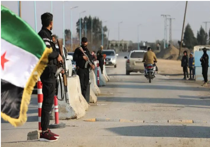
انتشار ميداني لعناصر الأمن السوري في ريف دير الزور الشرقي

نفذت وزارة الداخلية السورية، أمس (الاثنين)، انتشاراً ميدانياً واسعاً في ريف دير الزور الشرقي، في خطوة لتعزيز الأمن والاستقرار وحماية المواطنين وممتلكاتهم، وضمان بيئة آمنة في المنطقة، وفق بيان رسمي للوزارة. وأكد البيان أن هذه الإجراءات تأتي ضمن جهود مستمرة للحفاظ على سلامة المجتمع وضبط النظام العام، ومكافحة أي تهديدات محتملة للأمن المحلي. في المقابل، أعلنت قوات سوريا الديمقراطية "قسد" أن سجن الشدادية، الذي يؤدي آلاف معتقلي تنظيم داعش، تعرض لهجمات متكررة وأصبح حالياً خارج سيطرتها. وأوضحت "قسد" أن هذا التطور يأتي في