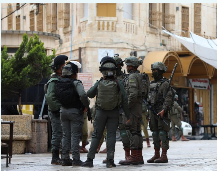
عناصر من الجيش الإسرائيلي في الخليل

كما شدد الوزير المصري على ضرورة استكمال استحقاقات المرحلة الثانية من خطة الرئيس الأمريكي دونالد ترامب، بما يشمل تشكيل قوة استقرار دولية، استمرار إمدادات المساعدات الإنسانية، وإعادة الإعمار المبكر للقطاع. وأكد الدكتور شعث أن اللجنة ملتزمة بتوسيع الأمن واستعادة الخدمات الأساسية، وبناء مجتمع قائم على الاستقرار والكرامة والسلام المستدام. إلى ذلك، أعلن الجيش الإسرائيلي عن شن