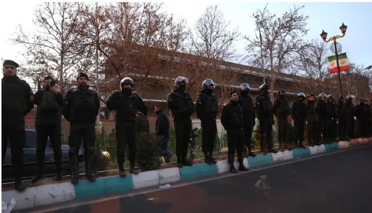
انتشار واسع للأمن الإيراني في طهران

قوات تابعة لهيئة الإذاعة والتلفزيون الإيرانية، التي تحتكر البث الرسمي في البلاد، على صعيد التصعيد السياسي، حذر الرئيس الإيراني مسعود بزشكيان من أن أي هجوم على المرشد الأعلى علي خامنئي سيُعتبر إعلان حرب، مؤكداً أن رد طهران على أي عدوان عسكري سيكون "قاسياً ومؤسفاً". وأضاف بزشكيان تعليقاً على حديث للرئيس الأمريكي دونالد ترامب الذي دعا إلى البحث عن قيادة جديدة في إيران، مشيراً إلى أن السلطات الإيرانية تتعامل مع حملات تشويه الأخبار بحزم.