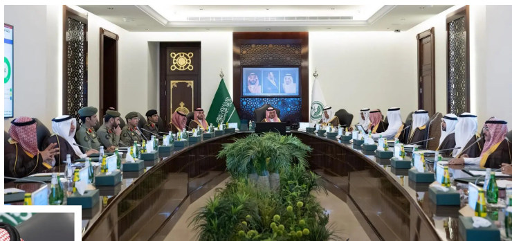
الأمير سعود بن مشعل مترئسا اجتماع لجنة الحج والعمرة أمس بجدة

واستعرضت اللجنة خطط رفع الجاهزية والاستعدادات لشهر رمضان المقبل في المنافذ الجوية والبحرية، وتسيير التقنيات الحديثة لتسهيل إجراءات القادمين لأداء المناسك، إلى جانب جاهزية مواقع إنهاء إجراءات أمتعة الركاب بمطار الملك عبدالعزيز الدولي، والبدلات الهادئة إلى تحسين تجربة ضيوف الرحمن، ومنها بوابات الجوازات