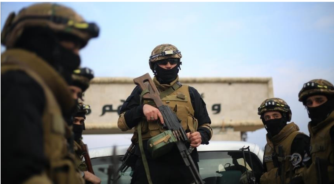
عناصر من الجيش السوري شرق الفرات

في المقابل، اتهمت قوات سوريا الديمقراطية الحكومة السورية بشن هجمات على قواتها في مناطق عين عيسى والشاددة والرقة، مشيرة إلى اشتباكات عنيفة على محيط سجن الأقطان الذي يضم معتقلي تنظيم داعش، في تطور