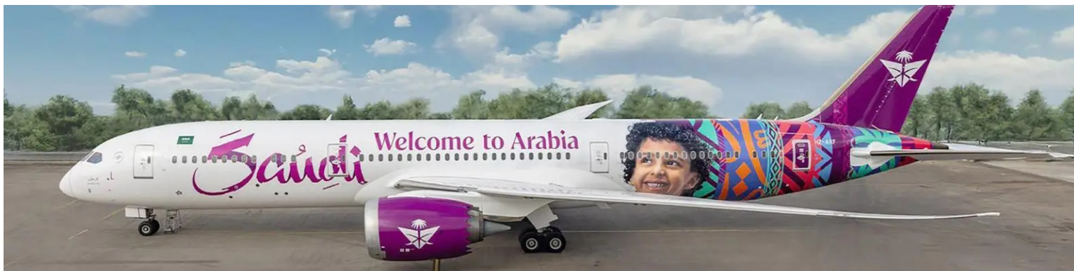
طائرة الخطوط السعودية متوشحة بالشعار

متنامة ترتقي بتجربة الضيوف، مفيدا أن المعدلات المتزايدة لأعداد الزوار، تؤكد نجاح المشاريع المشتركة كافة.