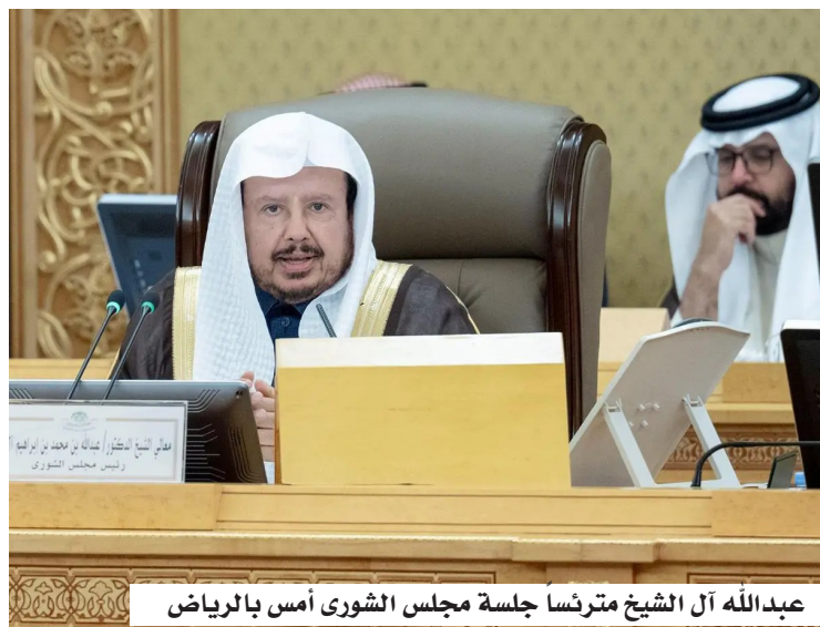
عبدالله آل الشيخ مترئسا جلسة مجلس الشورى أمس بالرياض

طالب مجلس الشورى أمس (الاثنين) في الرياض، جلسته العادية السابعة عشرة من أعمال السنة الثانية للدورة التاسعة برئاسة رئيس المجلس الدكتور عبدالله آل الشيخ، مؤسسة حديقة الأمير محمد بن سلمان بالإسراع في إعداد خطتها الاستراتيجية، وإجراء الدراسات البيئية لمنطقة المشروع؛ لضمان توافق المشاريع مع الحساسية البيئية، وتعزيز التنسيق مع برنامج الرياض الخضراء والجهات ذات العلاقة لتبادل الخبرات وأفضل الممارسات. ووافق المجلس على عدد من مذكرات التفاهم الاقتصادية، شملت التعاون بين وزارة الاقتصاد والتخطيط السعودية ونظيراتها في البرتغال وغينيا، بالإضافة إلى مذكرة تفاهم بين هيئة المدن والمناطق الاقتصادية الخاصة السعودية، ووزارة الاستثمار