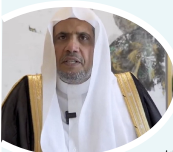
د. عبد الكريم العيسى

رحب رابطة العالم الإسلامي باتفاق وقف إطلاق النار، وإدماج قوات سوريا الديمقراطية بكامل مؤسساتها المدنية والعسكرية ضمن الدولة السورية. وجدد الأمين العام رئيس هيئة علماء المسلمين الدكتور محمد بن عبد الكريم العيسى، في بيان، التأكيد على التضامن الكامل مع الجمهورية العربية السورية، حكومة وشعباً، تجاه كل ما يهدد أمنها واستقرارها وسيادتها ووحدة أراضيها. وأعرب معاليه عن دعم الرابطة لجهود الحكومة السورية في حماية الشعب السوري بكافة مكوناته، وصون مقدراته ومكتسباته، وحفظ السلم الأهلي، وبسط سيادة القانون في جميع أنحاء البلاد.