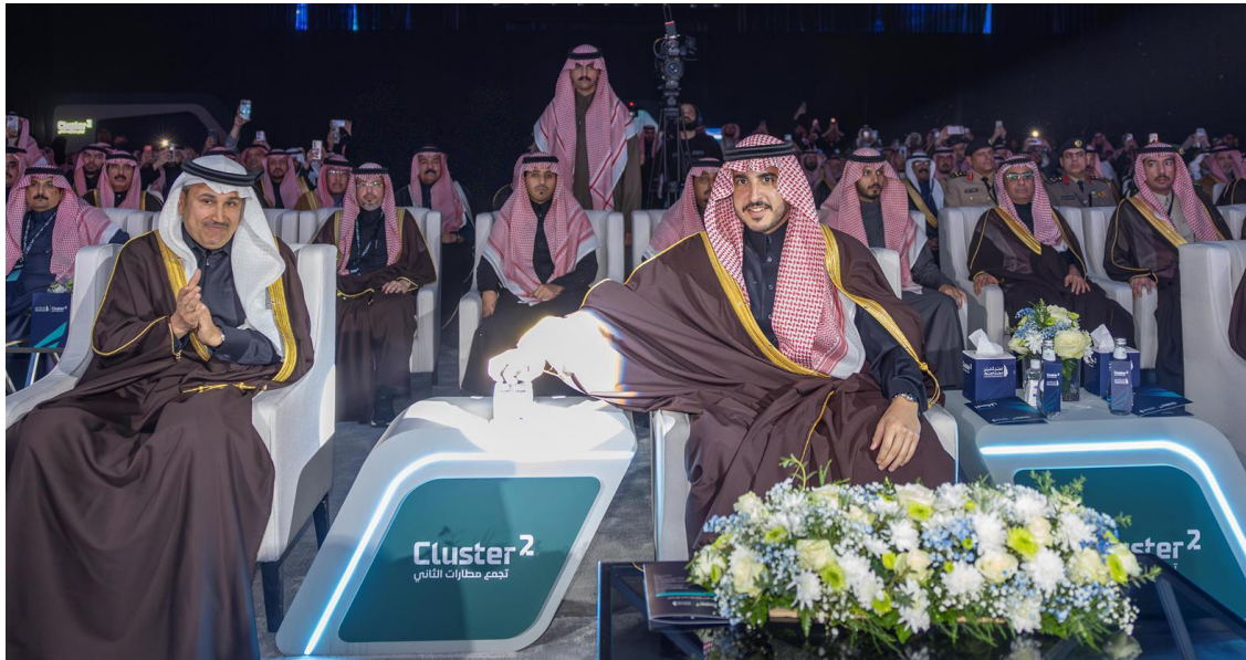
الأمير فيصل بن نواف لدى تدشينه مطار الجوف الدولي

المهندس صالح بن ناصر الجاسر، ورئيس الهيئة العامة للطيران المدني عبدالعزيز بن عبدالله الدجيلج، وعدد من المسؤولين، واستمع سموه والحضور إلى شرح عن مرافق المطار وتجهيزاته، وما يقدمه من خدمات لتعزيز منظومة النقل الجوي بالمنطقة.