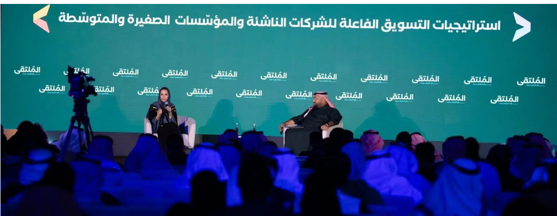
مشاركون في ملتقى سابق لاستراتيجيات التسويق

(مدير تسويق، وكيل دعاية وإعلان، مدير دعاية وإعلان، مصمم جرافيك، مصمم إعلان، أخصائي علاقات عامة، أخصائي دعاية وإعلان، أخصائي تسويق، مدير علاقات عامة، مصور فوتوغرافي)، على أن يبدأ تطبيق القرار بعد 3 أشهر من تاريخ الإعلان؛ بهدف إتاحة الفترة اللازمة للمنشآت للاستعداد وتطبيق القرار. ونصّ القرار الثاني على رفع نسبة التوطين إلى 60% في مهن المبيعات بالقطاع الخاص