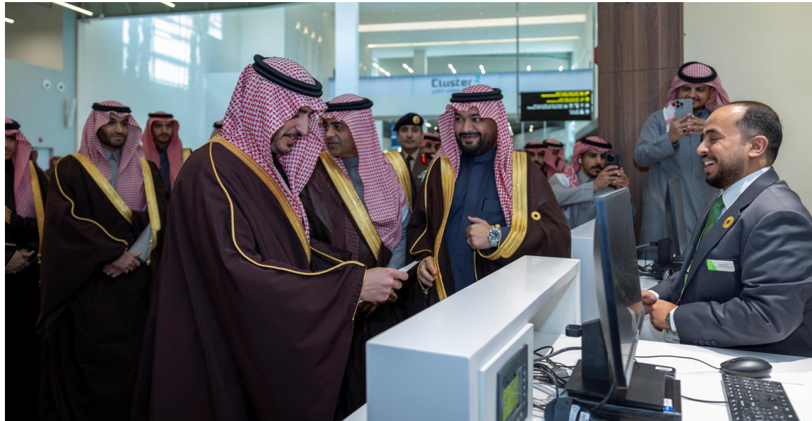
أمير الجوف خلال جولته بمرافق المطار الجديد