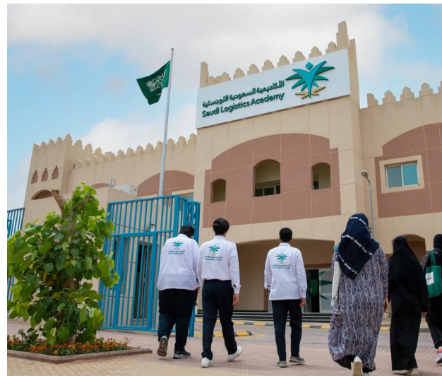
متدربون أمام مبنى الأكاديمية السعودية

ويقدم البرنامج على مدى خمسة أسابيع، تجربة تعليمية متدرجة تجمع بين التدريب عن بُعد، ودراسات الحالة التطبيقية، والتدريب الحضوري، إضافة إلى زيارات ميدانية للشركات، بما يسهم في ربط الجانب المعرفي بالتطبيق العملي، ومواكبة متطلبات القطاع وتحدياته. ويهدف برنامج قادة المستقبل إلى تنمية القدرات القيادية للمشاركين،