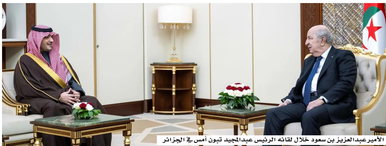
الأمير عبد العزيز بن سعود خلال لقائه الرئيس عبد المجيد تبون أمس في الجزائر