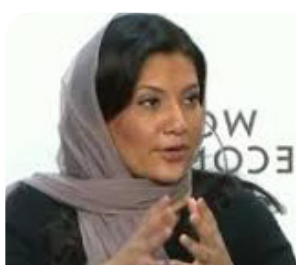
الأميرة ريما بنت بندر

الفالح: الاستثمارات الأجنبية بالمملكة تضاعفت 5 مرات