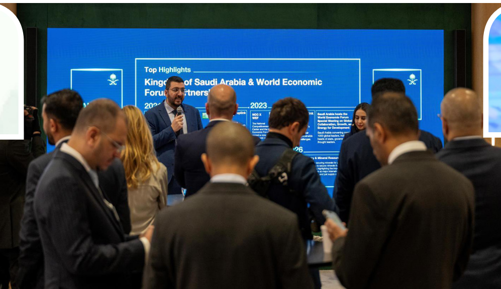
جانب من فعاليات (البيت السعودي) بمنتدى دافوس

الهيدروجين الأكبر عالمياً، من قبل مستثمرين عالميين يضعون أموالهم في السعودية، وكذلك رأس المال السعودي، ونمو أسواق رأس المال السعودية، وصناديق الاستثمار المتداولة، والانضمام إلى المؤشرات العالمية الكبرى. من جانبها، تطرقت الأميرة ريما بنت بندر خلال الجلسة الحوارية، إلى أبرز الإنجازات خلال السنوات العشر الماضية، وهي وجود قاعدة شابة موهوبة وقادرة للغاية، ليس فقط من الطلاب الذين يسافرون حول العالم، بل الذين يختارون المساهمة وبناء مستقبلهم داخل المملكة، وأن هذا الاختيار دليل واضح على نجاح رؤية 2030 والفرص التي توفرها للشباب.