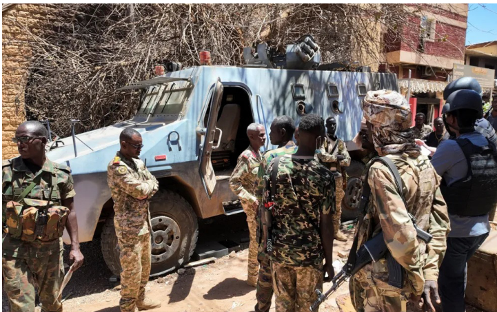
قوة من الجيش السوداني في كردفان

الحوية. وأظهرت صور الأقمار الصناعية. كما وقّع أضرار في محطة توليد الكهرباء بالمدينة، نتيجة غارات الطائرات المسيرة التي نفذتها قوات الدعم السريع في 4 و6 يناير، ما أدى إلى انقطاع الشبكة الكهربائية بالكامل ومقتل ما لا يقل عن 10 أشخاص، بينهم 8 أفراد من عائلة واحدة في حي الجلابية.