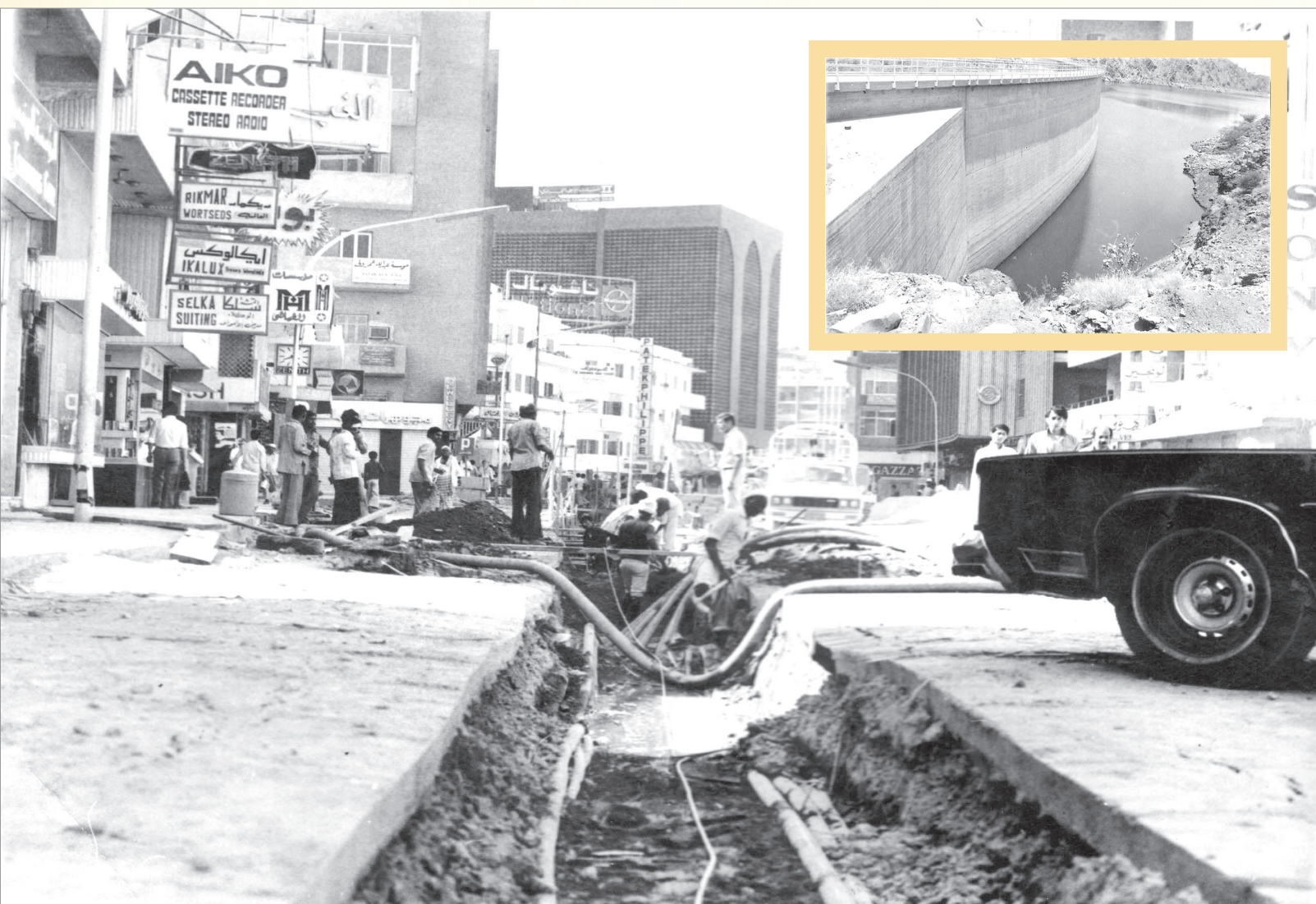
انشاء البنية التحتية من تمديد شبكات المياه وانشاء السدود