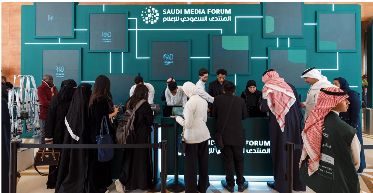
حضور إحدى فعاليات المنتدى السعودي للإعلام

القطاع، وسبل مواكبته لعالم سريع التحول - وذلك تحت شعار "الإعلام في عالم يتشكل". وتُعدّ النسخة الخامسة من المنتدى السعودي للإعلام خلال الفترة من 2 إلى 4 فبراير 2026، متضمنة أكثر من (100) جلسة حوارية، بمشاركة ما يزيد على (300) متحدث، مما يجعل المنتدى حدثاً محورياً ضمن عام التحول الإعلامي.