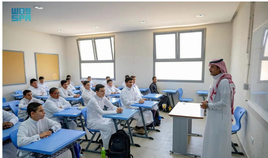
طلاب في فصل دراسي بإحدى المناطق