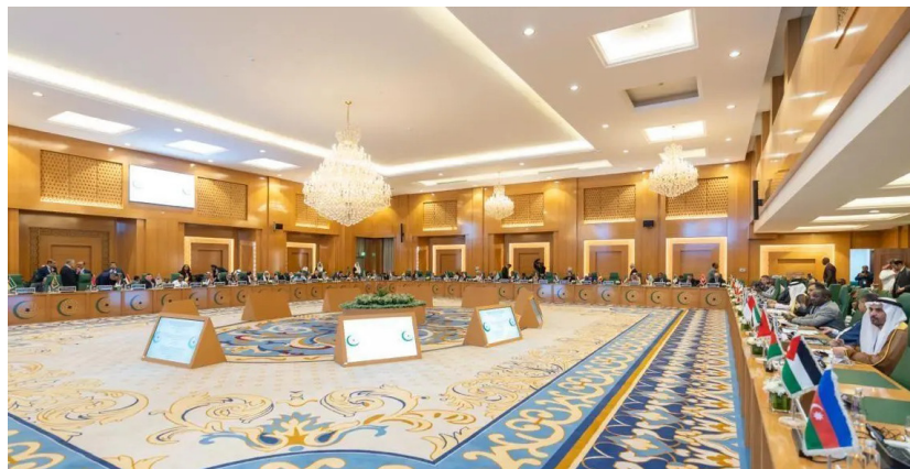
عدد من الوزراء والمسؤولين خلال الجلسة

وجددت منظمة التعاون الإسلامي التأكيد على التزامها الثابت بمبادئ سيادة الدول ووحدتها الإقليمية ورفض أي محاولات لتقسيم الدول أو تهجير شعوبها، مؤكدة أن العمل المشترك والتنسيق بين الدول الأعضاء في الأمم المتحدة والمنظمات الدولية والإقليمية هو الطريق لضمان تطبيق القانون الدولي والحفاظ على السلم والأمن في المنطقة والعالم، ودعم حقوق الشعب الفلسطيني والصومالي في تقرير المصير والحفاظ على سيادتهم ووحدتهم الوطنية.