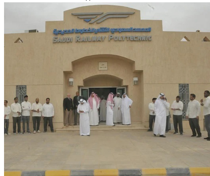
طلاب أمام بوابة معهد سرب

السلطان، أن التدريب سيبدأ الأحد 5 أبريل 2026م في مقر المعهد بمدينة بريدة، ويستمر سنتين، متبوعة بستة أشهر كتدريب على رأس العمل في شركة "سار"، وستتقاضى الطالب مكافأة شهرية تبلغ 2000 ريال للسنة الأولى، وترتفع إلى 3 آلاف ريال شهرياً خلال التدريب في السنة الثانية، ويسجل فور التحاقه في التأمينات الاجتماعية، ويحصل المتدرب على تأمين طبي شامل. وأشار إلى أن الاشتراطات اللازمة للالتحاق في البرنامج، أن يكون سعودي الجنسية، وحاصلاً على شهادة الثانوية العامة "المسار العلمي" بمعدل لا يقل عن 80٪، وحاصلاً على 70٪ في اختبار القدرات العامة، ولائقاً طبياً، ولا يتجاوز عمره 23 عاماً، إضافة إلى اجتياز اختبار القبول والمقابلة الشخصية.