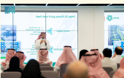
ملتقى سابق للمنشآت الصغيرة والمتوسطة

نظمت الهيئة العامة للمنشآت الصغيرة والمتوسطة (منشآت) أمس، مسار البرامج الإرشادية والاستشارية لتطوير مهارات رواد الأعمال، وذلك في مركز دعم المنشآت بجدة، ويستمر حتى 15 يناير الجاري. وتغطي البرامج الاستشارية مجالات متعددة تشمل: العمليات التشغيلية، والإقراض والتمويل، والتخطيط والإستراتيجية، والتقنية، ودراسة الجدوى، والموارد البشرية، والبيعات والتسويق، والمحاسبة والمالية، والاستشارات القانونية، فيما تشمل برامج الإرشاد قطاعات مثل: الجملة والتجزئة، والتعليم والتدريب والاستشارات، وتقنية المعلومات، وخدمات التسويق والإعلام، والتصنيع. وتأتي هذه البرامج الإرشادية والاستشارية ضمن مبادرات "منشآت" الهادفة إلى تعزيز البيئة الريادية في المملكة وبناء منظومة أعمال مستدامة ترتكز على الابتكار والتكامل بين الجهات الحكومية والخاصة، دعماً لأهداف رؤية المملكة 2030 في تمكين رواد الأعمال ورفع مساهمة المنشآت الصغيرة والمتوسطة في الاقتصاد الوطني.