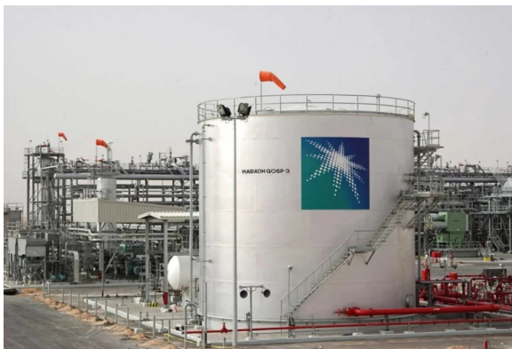
خزان لتكرير النفط في أرامكو

طرحت شركة أرامكو السعودية، منتج بنزين 98 بسعر 2.88 ريال لكل لتر، حيث تم توفيره لتقديم خيارات وقود متعددة للمستهلكين