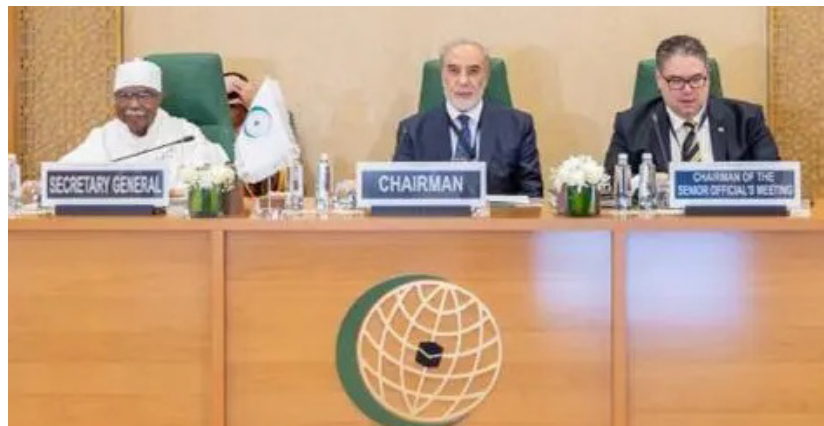
من أعمال الدورة الاستثنائية لمجلس وزراء خارجية منظمة التعاون الإسلامي في جدة

وأكد المجلس أن الاعتراف الإسرائيلي باطل وعديم الأثر القانوني، وأن أي محاولة