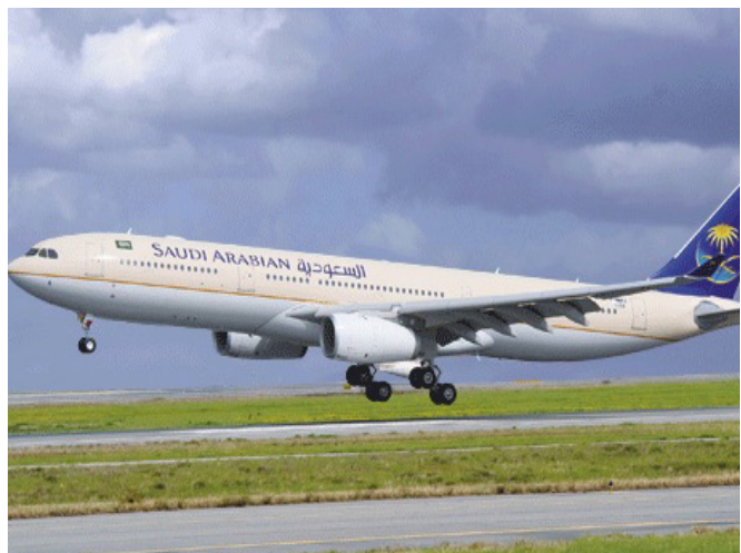
إحدى طائرات الخطوط السعودية أثناء إقلاعها

وأوضحت الخطوط السعودية أنها ستبدأ التشغيل إلى الوجهة الجديدة بدءاً من