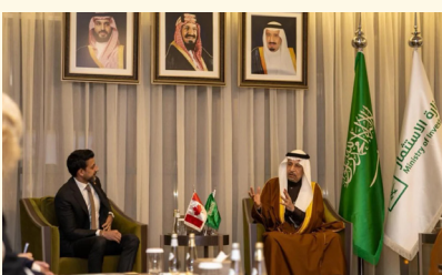
خالد الفالح خلال لقائه مع وزير التجارة الدولية الكندي

يذكر أن حجم التبادل التجاري بين المملكة وكندا بلغ نحو 12 مليار ريال في العام 2023، مع توقعات بأن يشهد ارتفاعات قياسية خلال الأعوام القادمة.