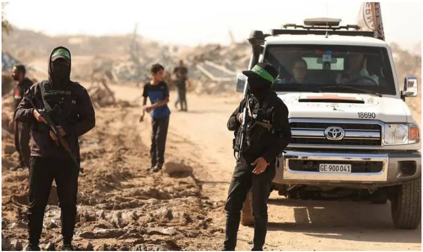
عناصر من حماس في غزة

وتزامن هذا الإعلان مع تصعيد سياسي وإعلامي من جانب الحركة، إذ قال مسؤول في حماس إن الحركة طالبت الوسطاء الدوليين بالتدخل العاجل لوقف ما وصفه بـ"أعمال القتل الإسرائيلية اليومية"، معتبراً أنها تهدف إلى تقويض اتفاق وقف إطلاق النار الساري منذ أكتوبر الماضي.