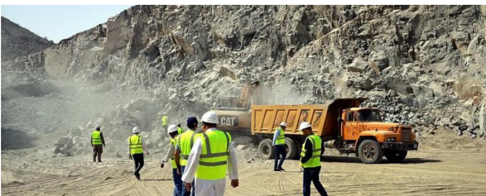
عاملون في أحد مواقع التعدين

وأضافت الهيئة أن مؤشر الرقم القياسي الفرعي لنشاط التعدين واستغلال المحاجر ارتفع في نوفمبر المنصرم بنسبة 12.6% على أساس سنوي، نتيجة لارتفاع مستوى الإنتاج النفطي في المملكة خلال شهر نوفمبر ليصل إلى 10.1 مليون برميل يومياً، مقارنة بـ 8.9 مليون برميل يومياً في شهر نوفمبر