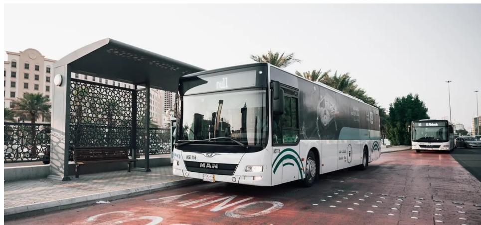
حافلة للنقل بين المسجد الحرام وحراء الثقافي

النقل في مكة المكرمة، والعمل على مواصلة مشاريع النقل مع متطلباتها واحتياجات الزوار والمعتمرين، بما يرسّخ نهج الحوكمة ويعزّز كفاءة الربط بين المواقع الحيوية. ويسهم ربط المسجد الحرام (المنطقة المركزية) بحي حراء الثقافي في تعزيز تكامل منظومة النقل داخل مكة المكرمة، من خلال إتاحة وصول منظم وسهل إلى إحدى الوجهات الثقافية والمعرفية البارزة.