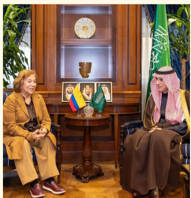
عادل الجبير مستقبلاً روزا يولاندا أمس في الرياض