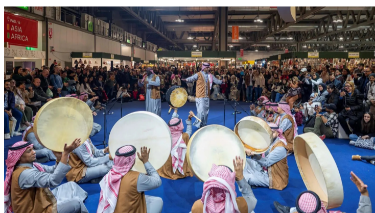
الفنون الشعبية في الجناح السعودي بالمعرض

احتفاءً بالحرف بوصفها عنصراً فريداً في الثقافة السعودية، وأتاح الركن للزوار التعرف على الحرف البدوية السعودية ومكانتها الثقافية، بمشاركة 25 حرفياً سعودياً من مختلف مناطق المملكة عرضوا وباعوا أبرز هذه الحرف، إلى جانب العروض الحية، التي قدمها حرفيو "مدرسة الديرة" بالعلاء، كما شملت الحرف المعروضة صناعة البشت، والعقال، والسج، والمخندة، وحياكة السدو. واستقبل الجناح السعودي زواره من مختلف أنحاء العالم بالضيافة السعودية الأصيلة، التي تقدمها مجموعة من مقدمي القهوة السعودية، قبل أن يتجول الزوار في أركانها مطلعين على عناصر الثقافة السعودية وضّم الجناح ركن "روح السعودية" الهوية الرسمية للسياحة السعودية، تحت إشراف الهيئة السعودية للسياحة، حيث عُرف الزوار بالوجهات السياحية المتنوعة في المملكة،