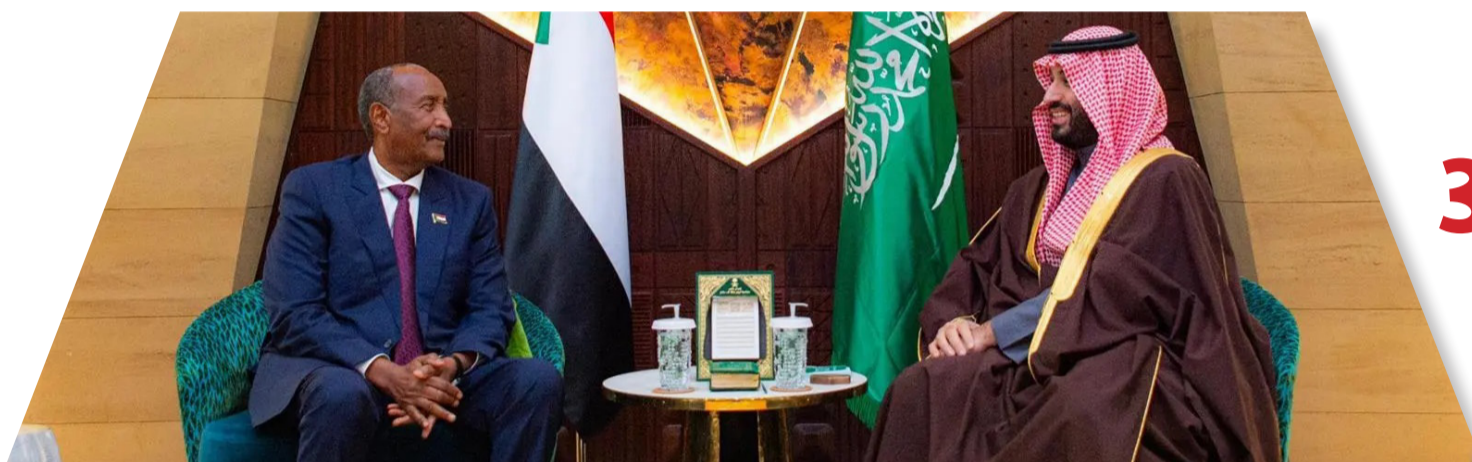
ولي العهد خلال لقائه رئيس مجلس السيادة السوداني أمس بالرياض