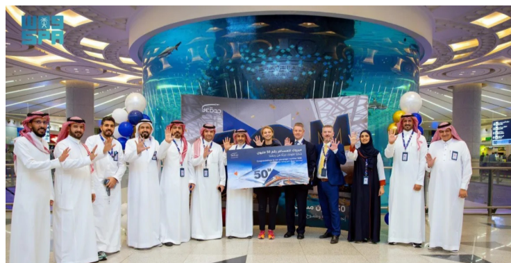
العاملون في مطار الملك عبد العزيز أثناء الاحتفال

في المنطقة، من خلال التوسعات ورفع الطاقة الاستيعابية وتطوير الخدمات، بما يدعم مستهدفات النمو المستقبلية.