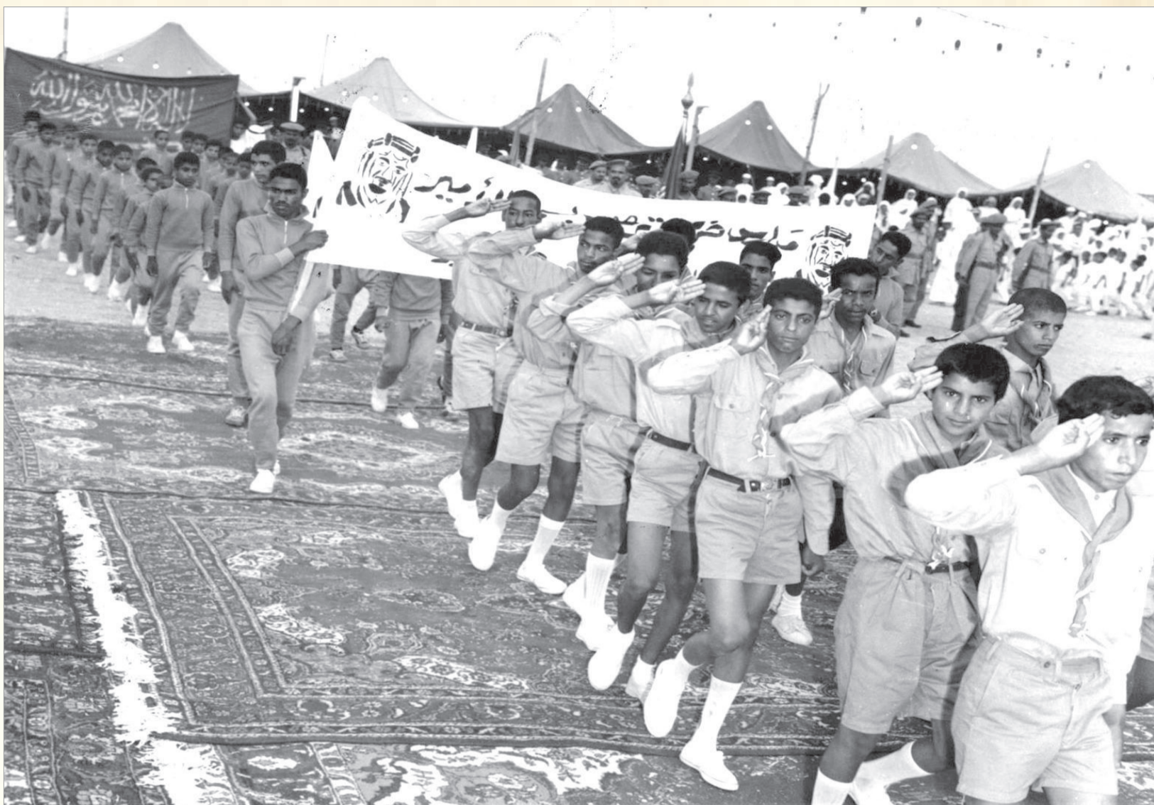
فتتاح المؤتمر الكشفي العربي ببلن و انتخاب رئيس المؤتمر

شركة حجاز كونستراكشن كومباني لإعادة تسير الخط الحديدي الحجازي من معان الى المدينة المنورة ص.ب ٢١٨١ عمان الأردن