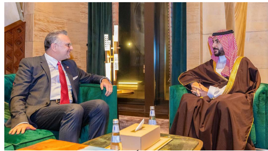
الأمير خالد بن سلمان مستقبلاً مساعد بولس أمس في الرياض

البلد (الرياض) التقى صاحب السمو الملكي الأمير خالد بن سلمان بن عبدالعزيز وزير الدفاع، في الرياض أمس (الاثنين) ، كبير مستشاري الرئيس الأمريكي للشؤون العربية والأفريقية مساعد بولس.