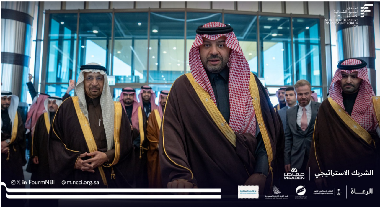
الأمير فيصل بن خالد خلال رعايته منتدى الاستثمار

توقيع 21 اتفاقية ومذكرة تفاهم بين جهات حكومية وهيئات وطنية وشركات محلية ودولية، وطُرحت خلال المنتدى أكثر من 240 فرصة استثمارية بقيمة تقدر بنحو 40 مليار ريال. وقال: إن إمارة المنطقة -بالتنسسيق مع الوزارات والهيئات الوطنية- ستعمل على ترجمة مخرجات المنتدى إلى برامج عملية ومبادرات تنفيذية لتعظيم الاستفادة من قدرات المنطقة، موجها الجهات المعنية بتعزيز التكامل ورفع كفاءة الإجراءات، كما دعا الشركات الوطنية والدولية ورؤاد الأعمال إلى بناء شراكات طويلة الأمد في المنطقة لصناعة قيمة تنموية مستدامة بما يتوافق مع مستهدفات رؤية المملكة 2030. وقد تجول الأمير فيصل بن خالد بن سلطان في الأجنحة المشاركة في المعرض واطلع على المبادرات والبرامج والمشروعات.