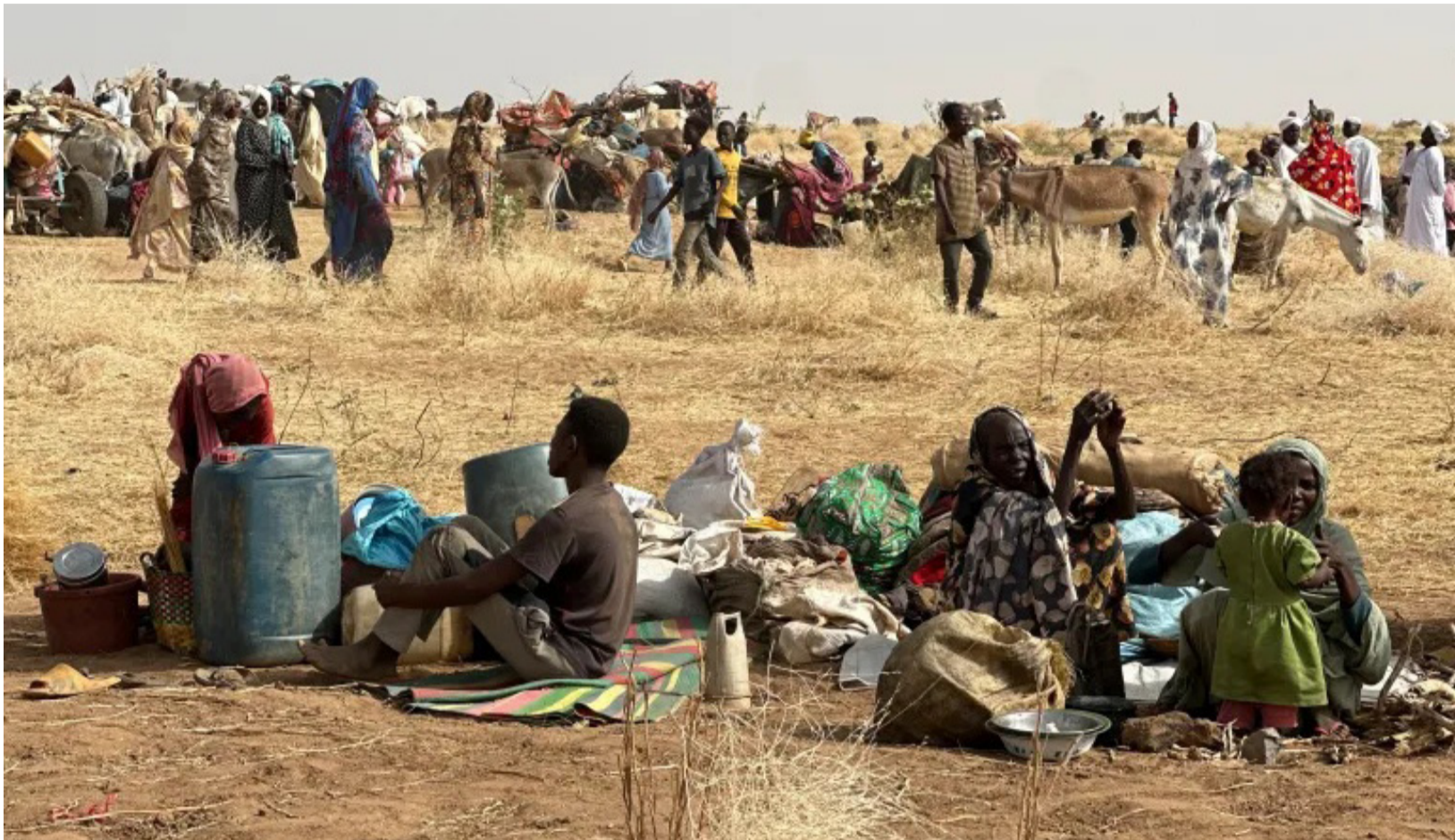
أسرى مخيم نازحين بالفاشر

وأوضح الاتحاد أن الرحلات ستستمر خلال شهري ديسمبر 2025 ويناير 2026، بتكلفة إجمالية تبلغ 3.5 مليون يورو، مشيراً إلى أن الوضع الإنساني في دارفور ازداد سوءاً عقب سيطرة قوات الدعم السريع على مدينة الفاشر، آخر معاقل الجيش في الإقليم.