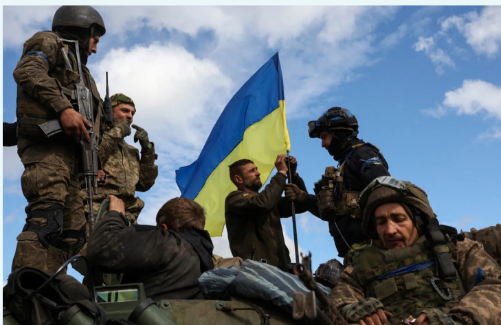
جنود أوكرانيون في دونباس

وأعاد التصعيد الأخير تسليط الضوء على حدود الدور الرسمي للدولة، لا سيما بعد بيان الجيش اللبناني المتعلق بجائحة يانوح، والذي أكد فيه استمرار انتشار قواته في محيط الموقع المعني. ورغم أن الخطوة عكست محاولة واضحة لتأكيد حضور الدولة، إلا أنها لم تكن كافية لاحتواء التداعيات، خصوصاً مع تداول معلومات عن رسالة إسرائيلية نُقلت إلى بيروت عبر