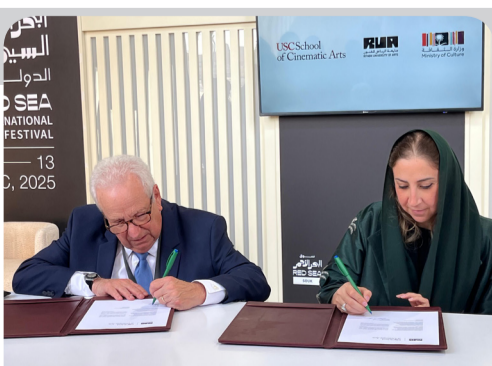
جانب من توقيع الشراكات على هامش مهرجان السينما

السينمائية بجامعة جنوب كاليفورنيا— وهي برامج تهدف إلى ربط صانعي الأفلام بالمتخصصين في الصناعة الأمريكية، وتعزيز التعاون الإبداعي والتجاري بين البلدين. ونكر ستيفن إيبيلي، رئيس قسم الشؤون الثقافية والإعلامية: "تعكس هذه المبادرات التزامنا المشترك بدعم الطموحات الإبداعية للمملكة، وضمان استمرار حضور الابتكار والخبرة