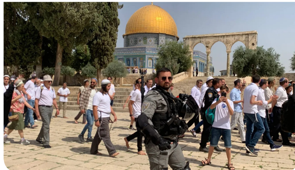
عشرات المستوطنين في المسجد الأقصى

تأتي الاقتحامات والاعتقالات ضمن سلسلة طويلة من