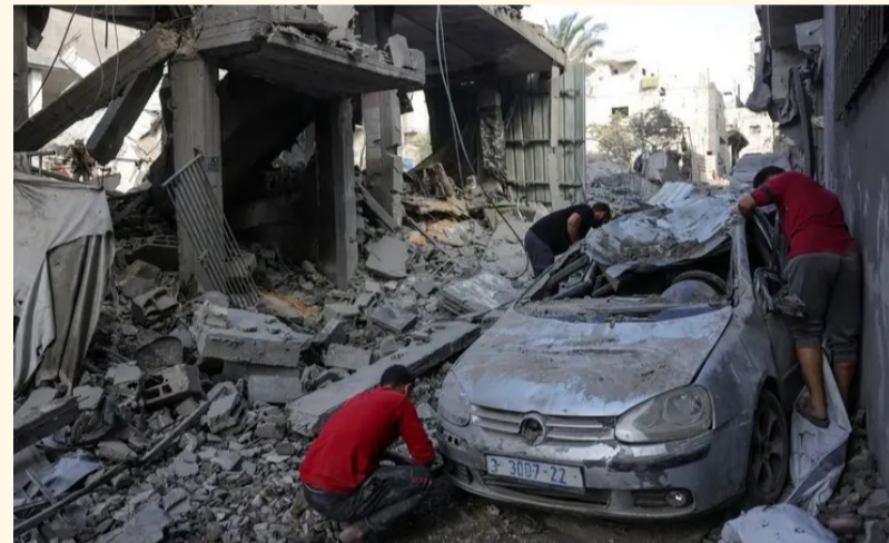
شباب يتفحصون مركبة مدمرة جراء غارة إسرائيلية على جباليا

وتطالب إسرائيل بنزع سلاح حركة حماس ومنعها من أي دور إداري مستقبلي في غزة، بينما تصر الحركة على الاحتفاظ بأسلحتها، مطالبة بانسحاب القوات الإسرائيلية بشكل كامل من القطاع، في ظل فشل المفاوضات في التوصل إلى اتفاق يضمن استقراراً طويل الأمد.