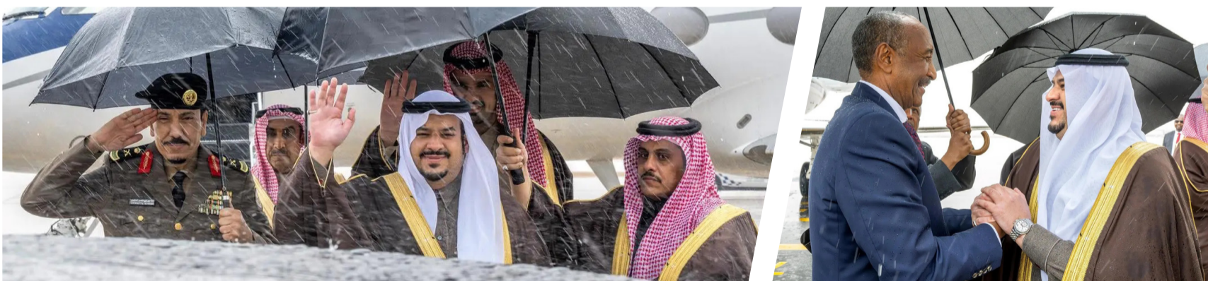
نائب أمير الرياض مرحباً بالبرهان في المملكة

الحاج علي عثمان، ومدير شرطة منطقة الرياض المكلف اللواء منصور بن ناصر العتيبي، ووكيل المراسم الملكية فهد الصهيل. كما غادر البرهان أمس الرياض، وكان في وداعه في مطار الملك خالد الدولي، صاحب السمو الملكي الأمير محمد بن عبدالعزيز بن عبد العزيز نائب أمير منطقة الرياض، وسفير خادم الحرمين الشريفين لدى جمهورية السودان علي بن حسن جعفر، وسفير جمهورية السودان لدى المملكة دفع الله عثمان، ووكيل المراسم الملكية فهد الصهيل.