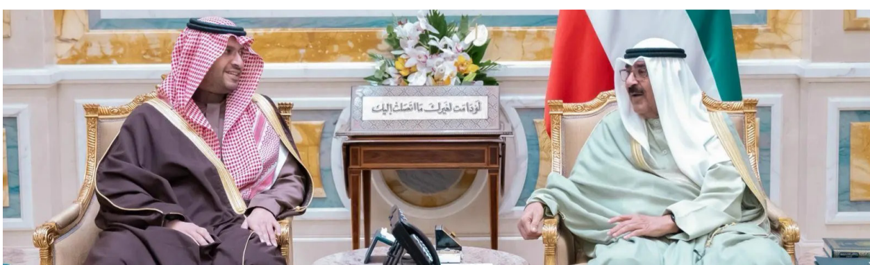
الشيخ مشعل الأحمد مستقبلاً الأمير تركي بن محمد أمس في قصر بيان بالكويت

في بداية الاستقبال، نقل سمو الأمير تركي بن محمد بن فهد تحيات خادم الحرمين الشريفين الملك سلمان بن عبدالعزيز آل سعود، وصاحب السمو الملكي الأمير محمد بن سلمان بن عبدالعزيز آل سعود ولي العهد رئيس مجلس الوزراء. حفظهما الله. لسمو أمير دولة الكويت، فيما حمّله سموه تحياته