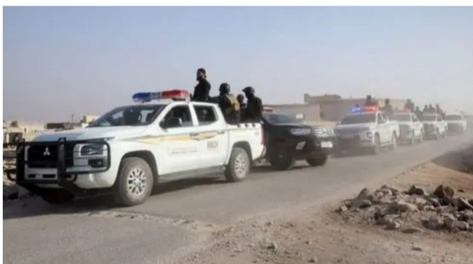
قوة من الأمن السوري جنوب دمشق

وعقب الهجوم، أعلنت وزارة الداخلية السورية تنفيذ “عملية أمنية نوعية وحاسمة” في مدينة تدمر، بالتنسيق مع جهاز الاستخبارات العامة وقوات التحالف الدولي، استناداً إلى معلومات استخباراتية دقيقة. وأسفرت العملية عن إلقاء القبض على خمسة أشخاص مشتبه بتورطهم في الهجوم، وبدء التحقيق معهم فوراً.