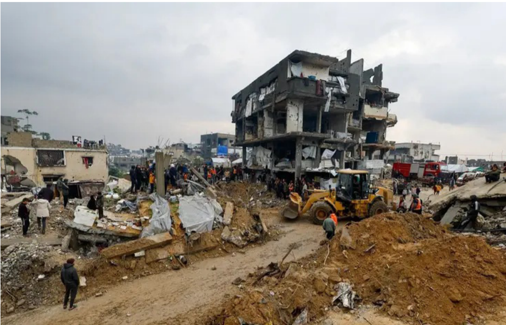
آليات تبحث عن جثث إسرائيليين في جنوب غزة

وتخطط واشنطن لتجنيب نحو 5.000 جندي مع بداية نشر قوة الاستقرار الدولية مطلع العام المقبل، مع إمكانية رفع العدد إلى 10.000 بحلول نهاية 2026. وفي هذا الإطار، تتواصل وزارة الخارجية