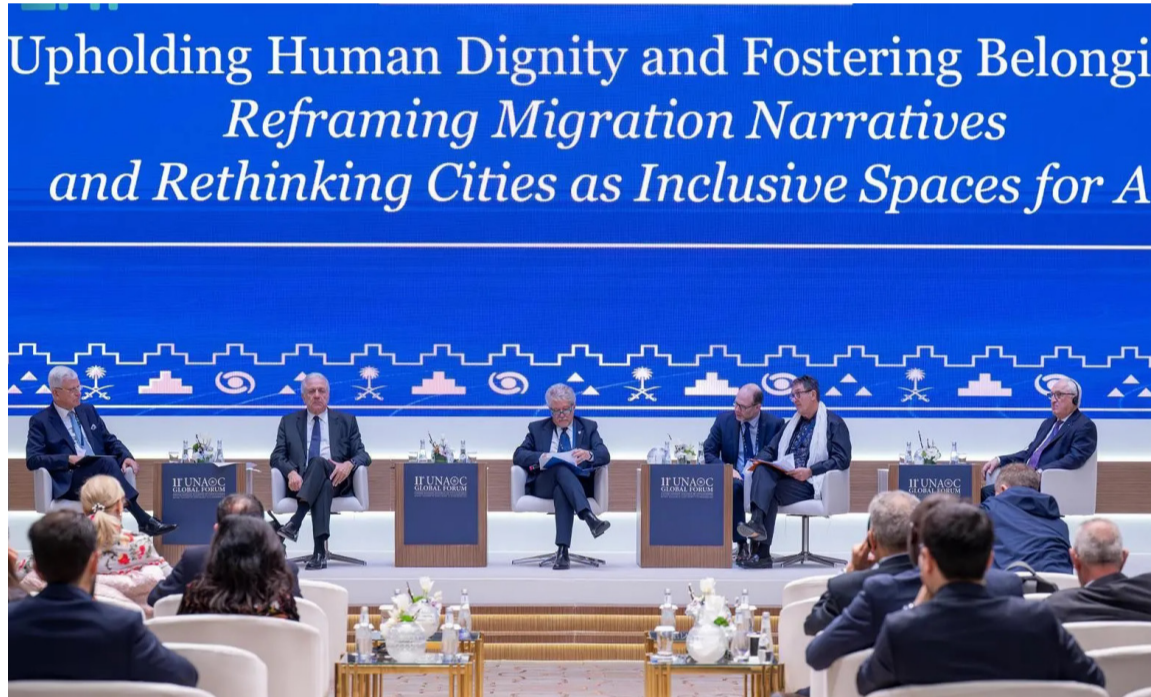
جلسة أمس لتحالف الأمم المتحدة للحضارات

وناقشت الجلسات موضوعات تعنى بالإنسان وعلاقته بثقافة الآخر، من بينها: إعادة صياغة سرديات الهجرة وإعادة التفكير في المدن؛ بوصفها مساحات شاملة للجميع، و"مكافحة خطاب الكراهية والإقصاء والتمييز.. نحو حوار بين الأجيال"، و"النساء في طليعة السلام.. دعوة إلى مشاركة شاملة للمرأة كقاعدة لا استثناء"، إلى جانب جلسة "تسخير الشراكات لمنع الإرهاب ومكافحته - نهج شامل للمجتمع". وشملت الفعاليات أيضاً جلسات بعنوان "اللغة الرابعة.. كيف تشكل الرياضة الحوار والاحترام المتبادل"، و"تعزيز الحوار بين الثقافات وإحياء التراث.. بناء مستقبل