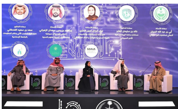
ورشة عمل في أحد ملتقيات أبشر للتحوّل الرقمي

وعبر الخدمات العامة في منصة أبشر أفراد جرى إصدار 124.926 تقريراً في خدمة تقارير أبشر، و 1.729 استفساراً عاماً عن البصمة، و 215 طلباً لتوصيل الوثائق بالبريد. يُذكر أن عدد الهويات الرقمية الموحدة الصادرة من وزارة الداخلية عبر منصة أبشر تجاوز 28 مليوناً، يمكن لها بكل سهولة وموثوقية الاستفادة من خدمات قطاعات وزارة الداخلية عبر منصات الإلكترونية "أبشر" أفراد، وأبشر أعمال، وأبشر حكومة"، والوصول لما يزيد على (500) جهة حكومية وخاصة من خلال بوابة النفاذ الوطني الموحد "نفاذ".