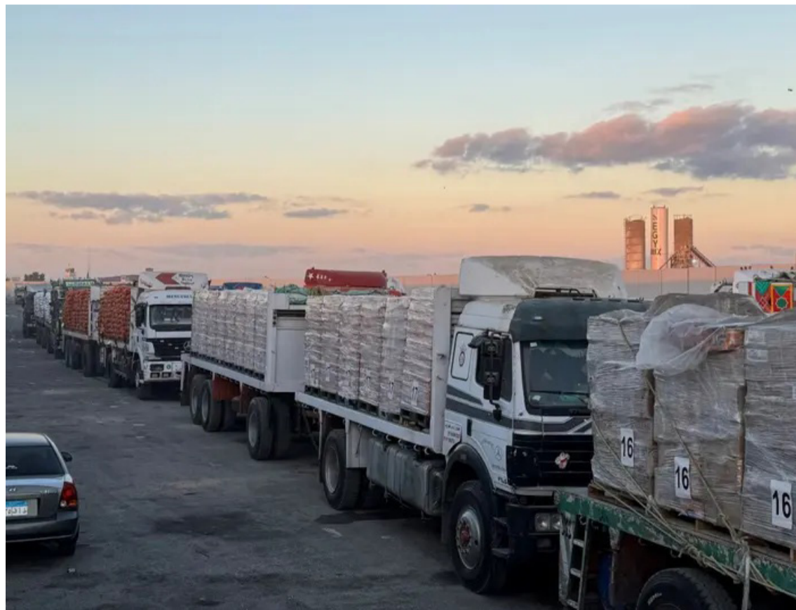
شاحنات متوقفة في معبر رفح

غزة، كما لم يُمنح الاتحاد الأوروبي الإذن بإعادة فتح مكتبه داخل القطاع، الأمر الذي يقيد، وفق قولها، قدرة المؤسسات الأوروبية على متابعة الوضع الإنساني عن كثب وتقديم الدعم اللازم.