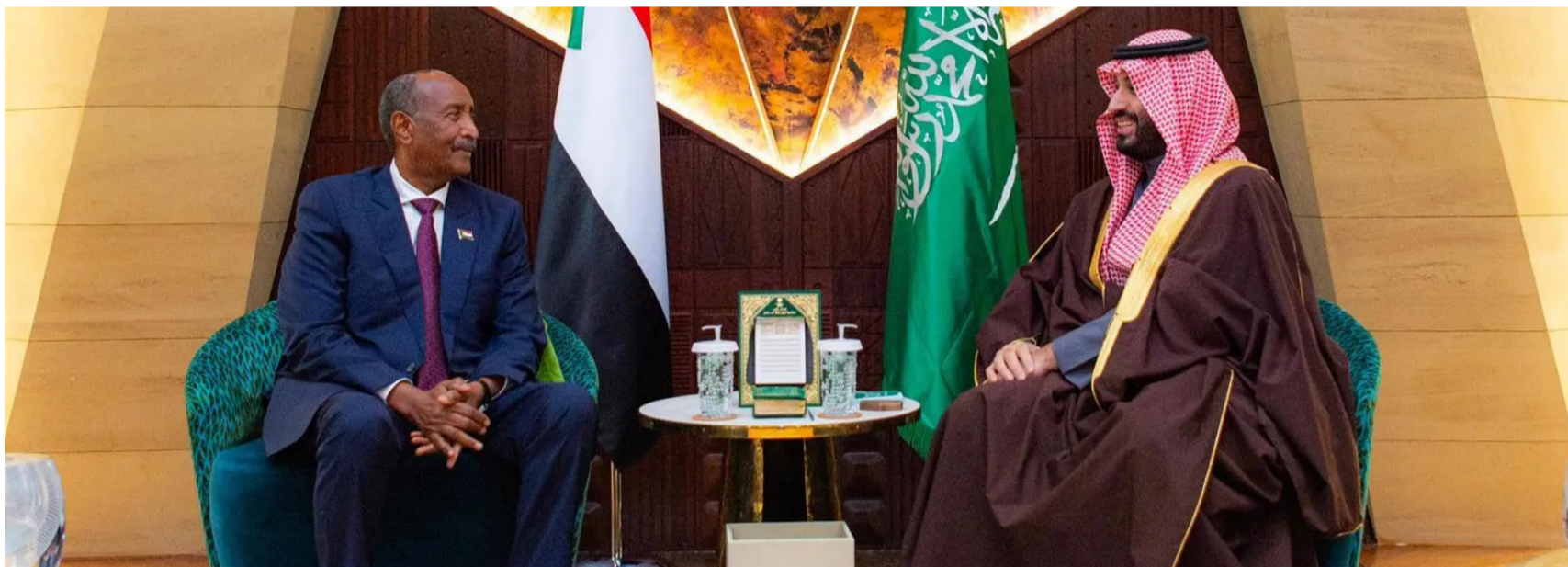
الأمير محمد بن سلمان مستقبلاً عبدالفتاح البرهان أمس في الرياض