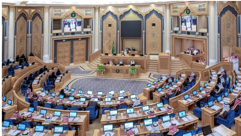
من جلسة مجلس الشورى أمس في الرياض

وأصدر المجلس حزمة من القرارات المهمة، حيث طالب مركز مشاريع البنية التحتية في منطقة الرياض بوضع خطة لتطبيق التنسيق والتكامل بين الجهات المنفذة للمشاريع، واعتماد منهجية الهندسة القيمة في جميع مراحل مشاريع البنى التحتية. كما دعا إلى إعداد خطة شاملة لاستخدام تقنيات الذكاء الاصطناعي في إدارة المشاريع، وتحسين رضا المستفيدين عن الخدمات والمشاريع في المنطقة. وفي قرار آخر، دعا المجلس جامعة الأمير سطام بن عبدالعزيز إلى استحداث مؤشرات أداء لهويتها