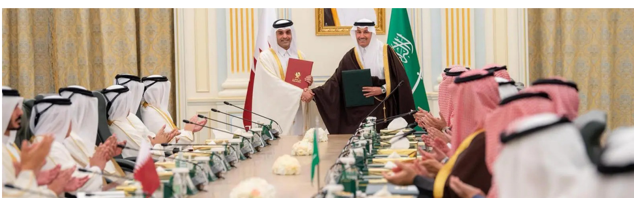
صالح الجاسر ومحمد آل ثاني عقب توقيع الاتفاقية أمس بالرياض

ويُعد مشروع القطار السريع بين البلدين خطوة إستراتيجية ضمن جهود البلدين؛ لتعزيز التعاون والتكامل التنموي، وترسيخ التنمية المستدامة والالتزام المشترك نحو آفاق أوسع من التنمية