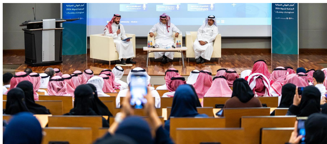
جلسة حوارية لمركز (متعم) حول الميزانية

في جامعة الملك فيصل بمحافظة الأحساء، بحضور عدد من أعضاء هيئة التدريس وطلبة الجامعة. تناولت الجلسة عدداً من المحاور، أبرزها استدامة المالية العامة، وتحقيق النمو الاقتصادي في إطار الميزانية، وترسيخ مبدأ الشفافية والإفصاح المالي. ويعد (متعم) إحدى مبادرات وزارة المالية، ويهدف إلى رفع الوعي المالي وتعزيز المعرفة الاقتصادية عبر برامج نوعية وشراكات؛ تساهم في نشر الثقافة المالية، وتمكين الأفراد من اتخاذ قرارات مالية رشيدة ومستدامة.