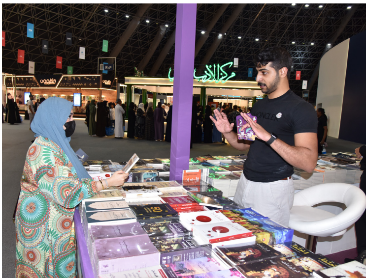
زوار في معرض الكتاب