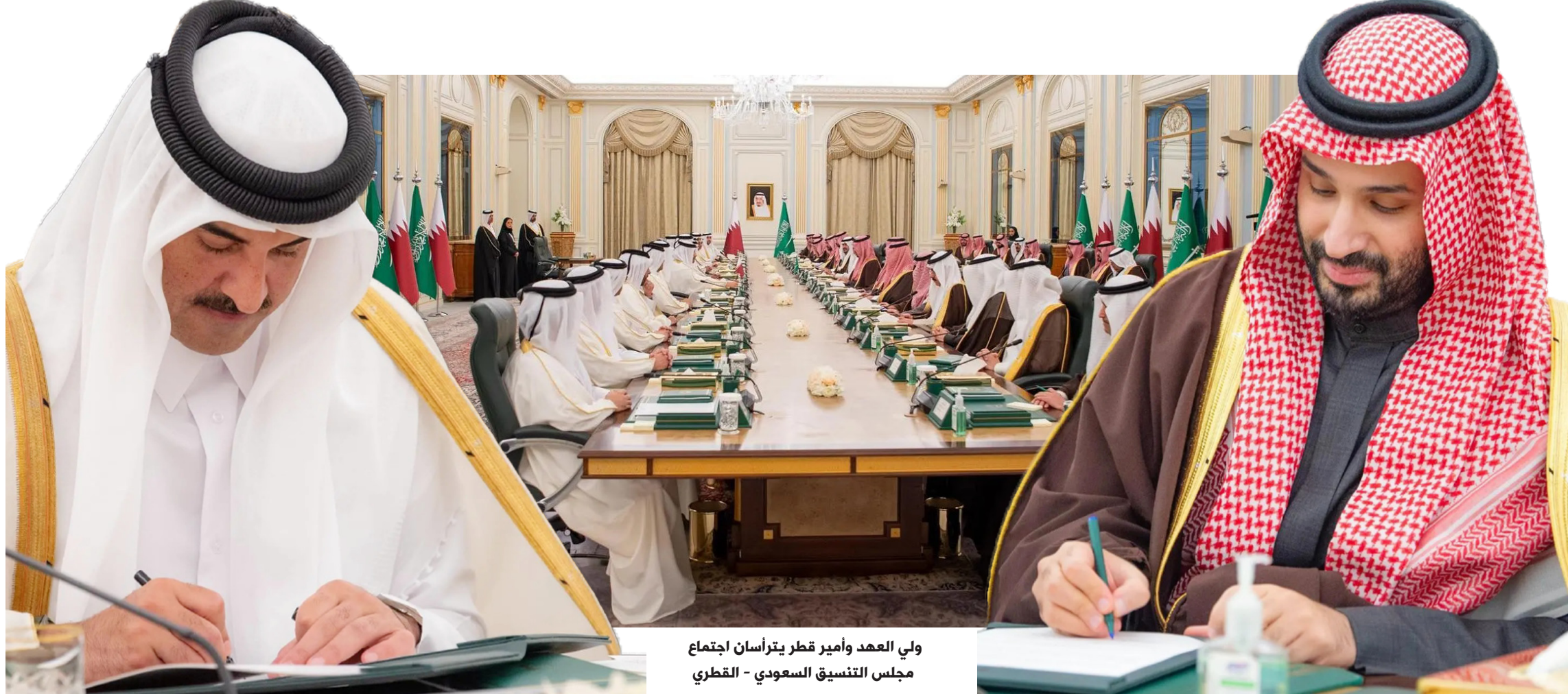
ولي العهد وأمير قطر يترأسان اجتماع مجلس التنسيق السعودي - القطري