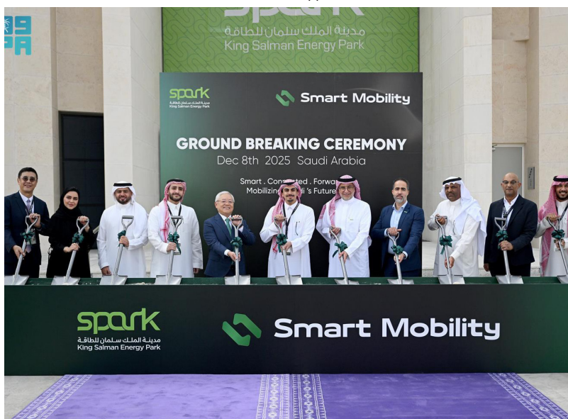
تدشين مصنع شواحن المركبات في (سبارك)

وأكد الزغبى أن مدينة الملك سلمان للطاقة مهبة لتصبح المنصة المركزية الإقليمية للتقنيات الصناعية والطاقة المتقدمة، مشيراً إلى قربها من البنية التحتية الأساسية للطاقة في المملكة، وإمكانية الوصول للموانئ على الخليج العربي؛ بهدف بناء ممر موحد للصناعات والتصدير على مستوى المنطقة، إذ تمثل مهمة "سبارك" في تمكين المستثمرين من بناء قدرات صناعية طويلة الأمد داخل المملكة. من جانبه، أوضح الرئيس التنفيذي لـ "سمارت موبيلتي" صاحب السمو الأمير فهد بن نواف، أن إنشاء المصنع في "سبارك" كان مدروساً ومخططاً له إستراتيجياً، وأن شحن المركبات الكهربائية يجب أن يُعامل كبنية تحتية وطنية، وأن يُطور بالتوازي مع منظومة الطاقة الكبرى في المملكة.