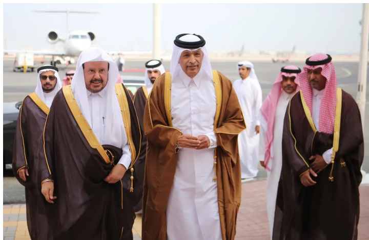
عبدالله آل الشيخ عقب وصوله أمس إلى الدوحة

ويضم وفد الشورى المرافق لرئيس المجلس، الأمين العام للمجلس محمد بن داخل المطيري، وأعضاء المجلس الدكتور عبدالعزيز بن إبراهيم المهنا، ومحمد بن سعد الفراج، والدكتور حسن بن حجاب الحازمي، والدكتور علي بن إبراهيم الغبان، واللواء بدر بن مساعد الشلهوب، والدكتور باسم بن حمدي السيد، والدكتورة تقوى بنت يوسف عمر، وعددًا من مسؤولي المجلس.