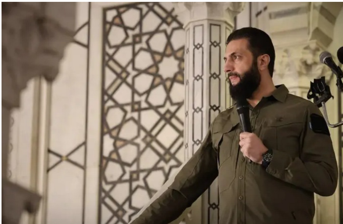
أحمد الشرع ملقياً كلمته في المسجد الأموي بدمشق أمس

وبين مشاهد الاحتفالات الشعبية، والرسائل السياسية والعسكرية التي حملها ظهور الرئيس بالزي العسكري، تبدو الذكرى الأولى للإطاحة بالنظام السابق مناسبة لإعادة تأكيد ملامح مرحلة جديدة، تتطلع فيها دمشق إلى إعادة بناء الدولة وترسيخ الاستقرار بعد سنوات طويلة من الحرب والانقسام.