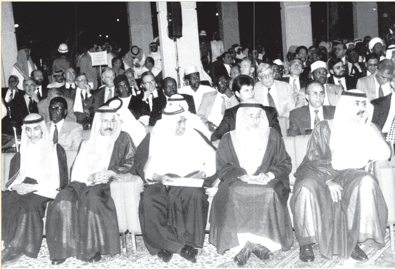
افتتاح معرض ارامكو بمطار الملك عبد العزيز بجده