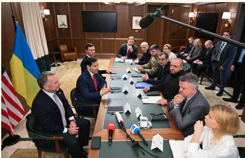
الوفدان الأمريكي والأوكراني خلال مفاوضات سابقة

ديسمبر اجتماعاً مطولاً مع ويتكوف وكوشنر في موسكو، استمر حتى ما بعد منتصف الليل، وُصف من قبل مساعد الرئيس الروسي يوري أوشاكوف بأنه كان "بناءً وموضوعياً". وشملت المناقشات، وفق ما نقلته مصادر روسية، عدداً من الخيارات المتعلقة بخطة السلام، بما في ذلك الملفات الإقليمية العالقة. واتفق الطرفان على مواصلة العمل المشترك خلال الفترة المقبلة.