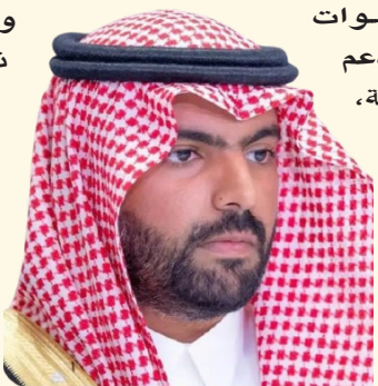
الأمير بدر بن فرحان

خلال السنوات الماضية في دعم مسيرة المنظمة، ومشيداً بإدارتها المتميزة، التي أسهمت في تعميق الشراكات، وتعزيز