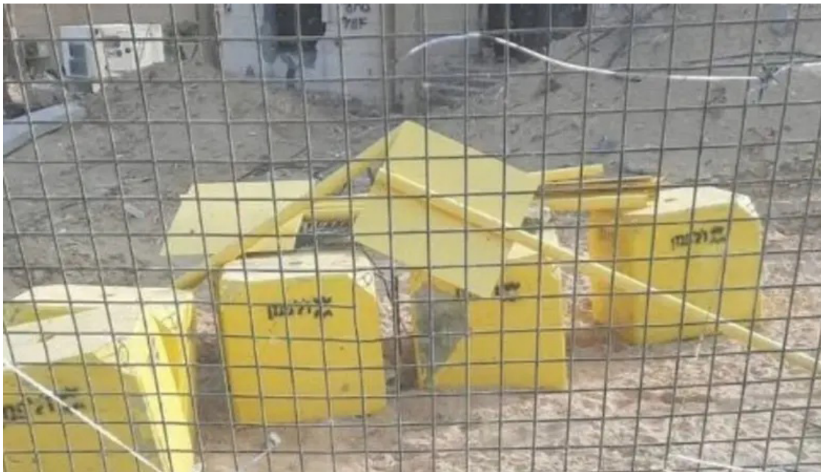
علامات وضعها الجيش الإسرائيلي لتوضيح الخط الأصفر

جهوداً صعبة مماثلة للمرحلة الأولى، وأن المرحلة الثالثة ستستهدف "إزالة التطرف في غزة" بعد تفكيك سيطرة حماس، على غرار التجربة التي شهدتها ألمانيا في إعادة بناء مؤسساتها بعد الأزمات. وأضاف أن استعادة آخر رهينة في غزة ستكون خطوة تمهيدية للانتقال إلى المرحلة الثانية من الاتفاق.