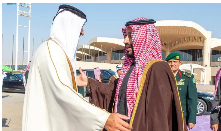
.. ولي العهد مودعاً أمير قطر