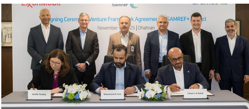
توقيع اتفاقية ثلاثية بين أرامكو وإكسون موبيل وسامرف

مشروع سامرف خطوة متقدمة في مسيرة تعاوننا الإستراتيجي طويل الأمد مع إكسون موبيل، وضم هذا المشروع لزيادة تحويل النفط الخام والسوائل البترولية إلى مواد كيميائية عالية القيمة، كما سيساهم في ترسيخ مكانة سامرف لتصبح محركاً لنمو قطاع البتروكيميائيات في المملكة. وتتمتع "سامرف" حالياً بالقدرة على معالجة أكثر من 400 ألف برميل من النفط الخام يومياً، وإنتاج مجموعة متنوعة من منتجات الطاقة، تشمل: البرويان، وزيت الديزل للسيارات، وزيت الوقود البحري الثقيل، والكبريت.