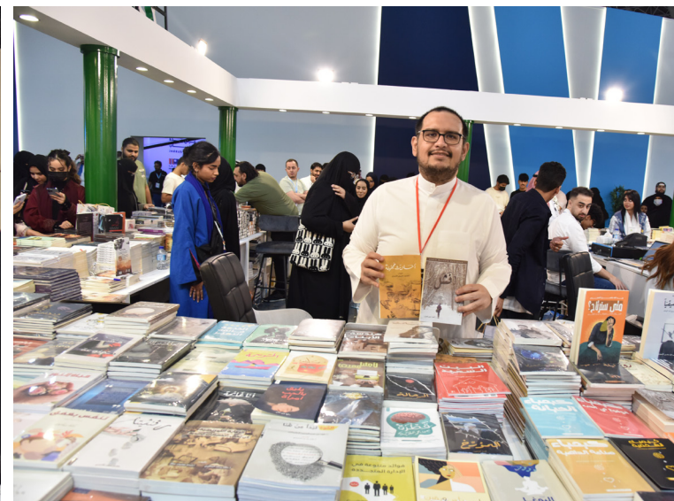
أحد المؤلفين في معرض الكتاب

مخصص لعوالم الإبداع والخيال في منطقة المانجا والأنمي، يضم مقتنيات ومجسمات وشخصيات من عالم المانجا، إضافة إلى كتب متخصصة، كما يخصص قسماً للكتب المخفزة؛ بهدف تعزيز القراءة وإنتاجها عبر خيارات متنوعة.