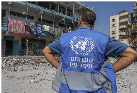
موظف بالأونروا يتأمل مبنى متهاكاً يقطنه نازحون فلسطينيون

وأوضح لازاريني أن هذا الاقتحام يأتي بعد سلسلة