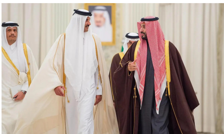
.. وداخل الصالة الملكية بالمطار