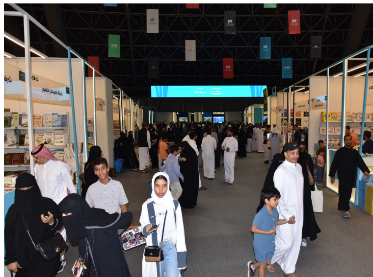
عشاق القراءة في معرض الكتاب