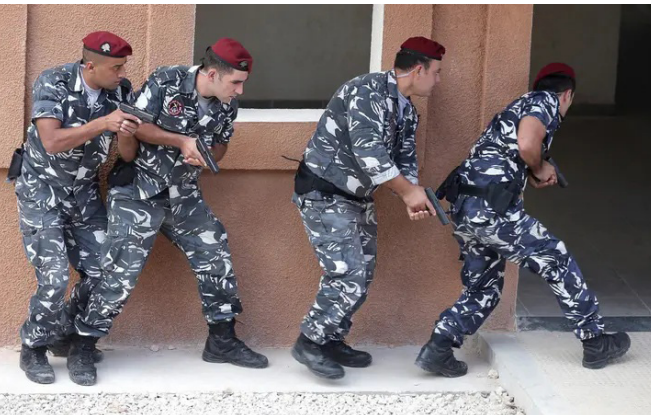
عناصر من قوى الأمن الداخلي في لبنان

ويؤكد مسؤولون أوروبيون أن تعزيز قدرات قوى الأمن الداخلي في لبنان لا يهدف إلى فرض وجود أجنبي عسكري، بل إلى تقديم الدعم التقني والإستراتيجي لضمان قدرة الدولة اللبنانية على حماية المدنيين، والحفاظ على الأمن الداخلي بفعالية أكبر، في ظل التحديات الإقليمية المعقدة والمستمرة.