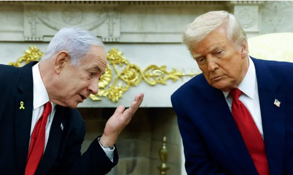
من لقاء سابق بين ترمب ونتنياهو

وجاء الإعلان بعد اجتماع نتنياهو مع السفير الأمريكي لدى الأمم المتحدة، مايك والتز، في القدس الغربية، وهي أول زيارة للسفير الأمريكي إلى إسرائيل منذ توليه منصبه. وأفاد مكتب نتنياهو أن اللقاء ركز على التنسيق السياسي بين واشنطن وتل أبيب، ومواجهة التحديات التي تواجه إسرائيل في مؤسسات الأمم المتحدة، إضافة إلى بحث الخطوات اللازمة لضمان الاستقرار في المنطقة وإحباط أي مبادرات مناوئة لإسرائيل في المجتمع الدولي. ويُتوقع أن يشهد اللقاء في فلوريدا تعزيز التعاون الاستراتيجي بين الولايات المتحدة وإسرائيل، وتحديد الخطوات العملية لتنفيذ المرحلة الثانية من خطة السلام في غزة، بما في ذلك ترتيبات أمنية وسياسية لضمان نجاح الانسحابات الإسرائيلية ونزع سلاح حماس، تمهيداً للمرحلة الثالثة التي تستهدف إعادة استقرار القطاع وتقليص نفوذ التطرف.