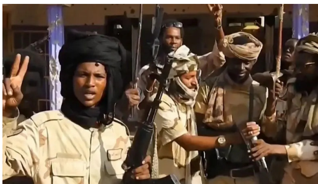
عناصر من قوات الدعم السريع في الفاشر

وبالرغم من هذه الجرائم، واصلت قوات الدعم السريع تحركاتها العسكرية والسيطرة على الموارد الحيوية، حيث أعلنت السيطرة الكاملة على منطقة هجليج النفطية في غرب كردفان، مؤكداً التزامهم بحماية المنشآت النفطية الحيوية وضمان مصالح الدولة، في خطوة تعكس استمرارهم في استخدام الموارد الاقتصادية كوسيلة لتمويل عملياتهم العسكرية وفرض النفوذ في مناطق النزاع.