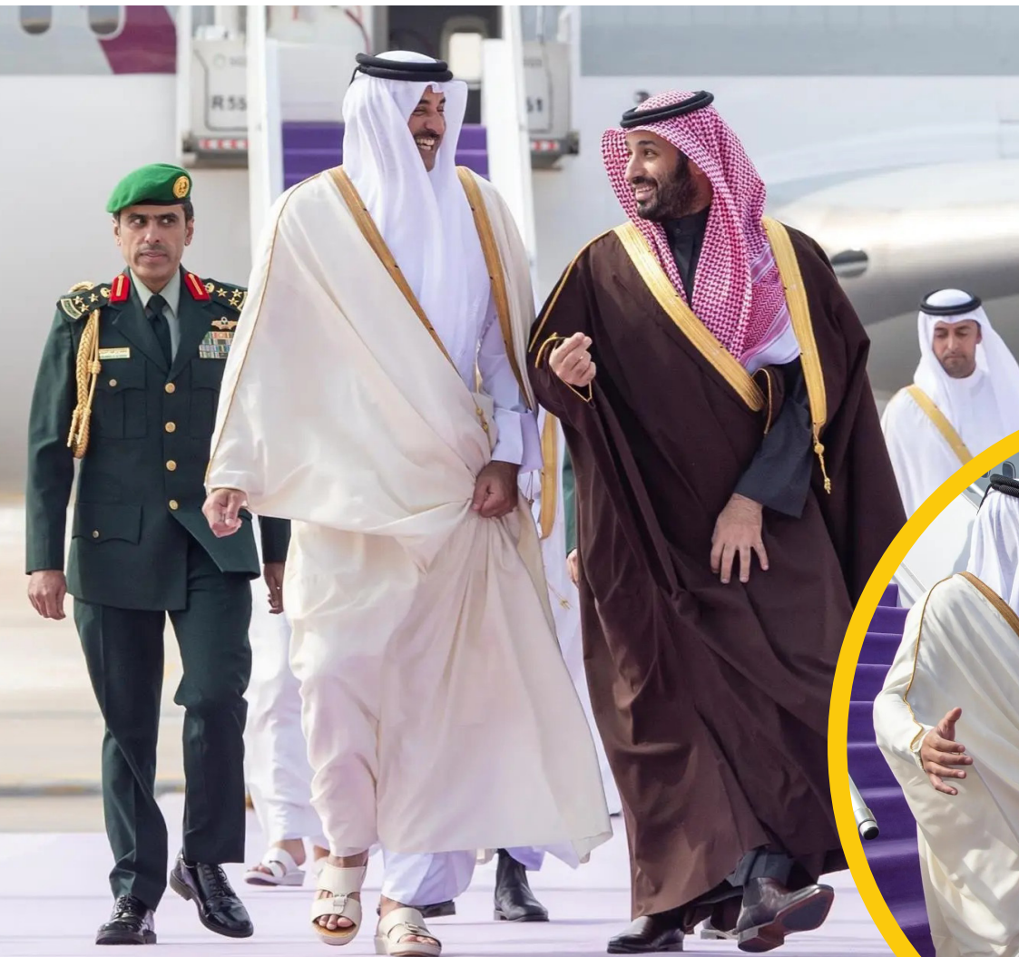
ولي العهد مستقبلاً أمير قطر لحظة وصوله