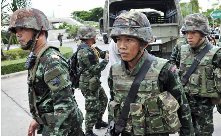
أفراد من الجيش التايلاندي في الحدود مع كمبوديا

ودعت المحافظة المجتمع الدولي إلى التحرك العاجل لمحاسبة إسرائيل ومساءلة قادتها عن الانتهاكات، مؤكداً أن هذه الخطوة تمثل تحدياً مباشراً لتجديد ولاية الأونروا التي أقرها مجلس الأمم المتحدة مؤخراً بأغلبية ساحقة، وتهدد جهود تقديم الدعم والخدمات للاجئين الفلسطينيين في المدينة والمناطق المحيطة.