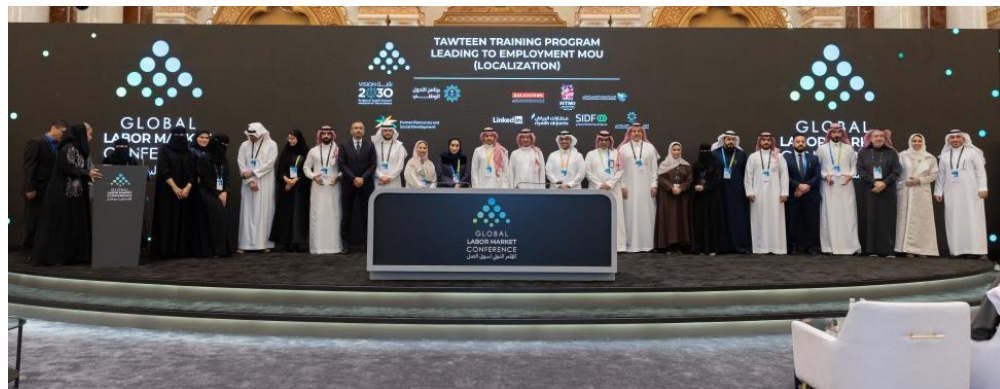
وزارة الموارد خلال مشاركتها بمؤتمر سابق

والعملية، ويمنح الأفراد قدرة أكبر على التوفيق بين العمل والحياة. وأجرت الوزارة تعديلات تطويرية وتنظيمية على العمل المرن، شملت رفع الحد الأعلى لساعات العمل المرن لدى المنشأة الواحدة إلى 160 ساعة شهرياً، وإدراج ميزة احتساب نقطة توظيف كاملة للمنشأة، ضمن برنامج "نطاقات" عند استيفاء هذا الحد من خلال عامل واحد، أو مجموعة عاملين.