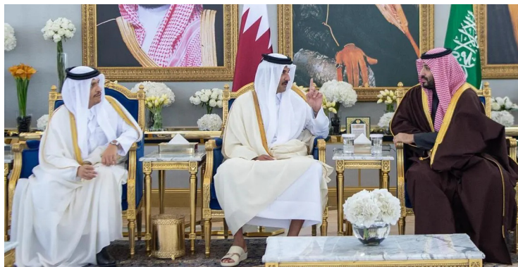
الأمير محمد بن سلمان مستقبلاً تميم بن حمد في الصالة الملكية بمطار الملك خالد

وتبرز الدلالات الإستراتيجية لانعقاد مجلس