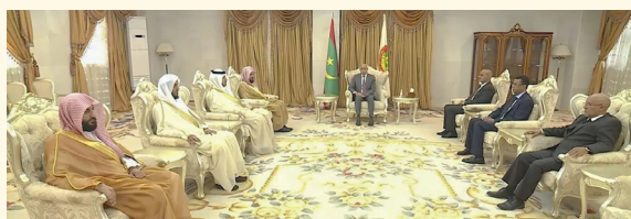
محمد الغزواني مستقبلاً أحمد الحذيفي في القصر الرئاسي بنواكشوط