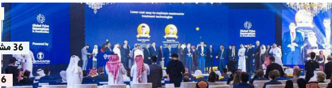
تتويج الفائزين بالجائزة في نسخة سابقة

3 316 جهة مشاركة بدلاً من 85 عند الانطلاق