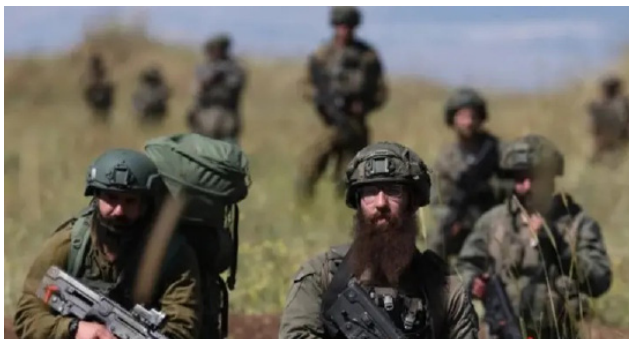
جنود إسرائيليون يتوغلون في أراض سورية

ومع غياب أي إطار سياسي فاعل للتهديد، يبقى الجنوب السوري مرشحاً لمزيد من التوتر، في ظل استمرار التحركات العسكرية الإسرائيلية وتنامي مخاوف السكان من تكرار سيناريو المواجهات الأخيرة في بيت جن.