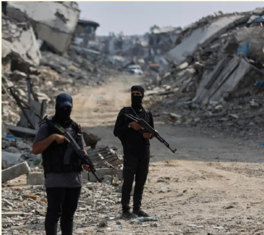
عنصران من حركة حماس في غزة

وفي سياق متصل، كشفت المصادر عن استمرار المفاوضات الأميركية مع قطر ومصر وتركيا وحماس حول اتفاق تقرر بموجبه تخلي الحركة عن حكم غزة ونزع سلاحها تدريجياً، بدءاً من الأسلحة الثقيلة ثم الخفيفة، بما يمهد الطريق لتنفيذ المرحلة الثانية من الاتفاق وتحقيق استقرار طويل الأمد في القطاع.