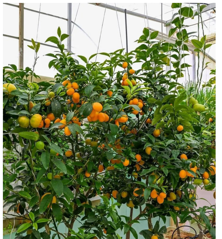
الزراعة المائية بمنطقة القصيم

اكتسبت الزراعة المائية أهمية متزايدة في المملكة؛ بهدف زيادة إنتاجية المحاصيل في مساحات صغيرة مع تقليل استهلاك المياه بنسبة تصل إلى (90%)