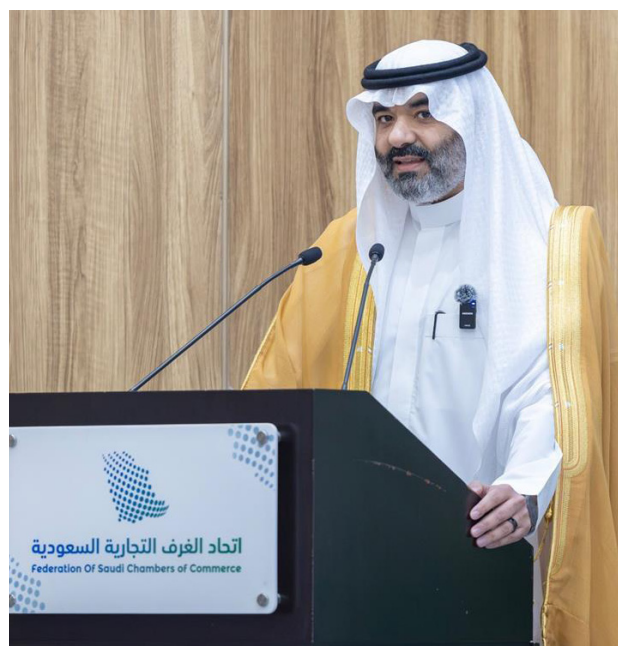
عبد الله السواحه

أحد وزير الاتصالات وتقنية المعلومات المهندس عبدالله بن عامر السواحه، أن القطاع الخاص في مجالات التقنية والاتصالات والابتكار حقق منجزات عظيمة بدعم وتمكين من صاحب السمو الملكي الأمير محمد بن سلمان بن عبدالعزيز آل سعود ولي العهد رئيس مجلس الوزراء - حفظه الله. وأوضح خلال لقاء موسع مع قطاع الأعمال في مقر اتحاد الغرف السعودية، بحضور رئيس الاتحاد حسن بن معجب الحويزي، ورؤساء اللجان الوطنية، ومجالس الأعمال الأجنبية، وعدد من ممثلي الشركات، أن المملكة تصدرت دول مجموعة العشرين في التنافسية الرقمية، وبلغ حجم سوق الاتصالات والتقنية 190 مليار ريال بنسبة نمو 80%. واستعرض المهندس السواحه رحلة التطوير انطلقت منذ عام 2017، وصولاً إلى مرحلة الابتكار في عام 2025، التي شهدت إطلاق شركة (هيوماين) الرائدة عالمياً في تطوير حلول الذكاء الاصطناعي، لافتاً إلى أن البرنامج الوطني لتنمية تقنية المعلومات دعم أكثر من 3 آلاف شركة، وأسهم في تنفيذ 446 مشروعاً للذكاء الاصطناعي و1,187 مشروعاً ناشئاً، ووفر 17 ألف وظيفة. وأشار إلى ارتفاع فيما ارتفع عدد المواهب الرقمية إلى 406 آلاف بنسبة نمو 62%.