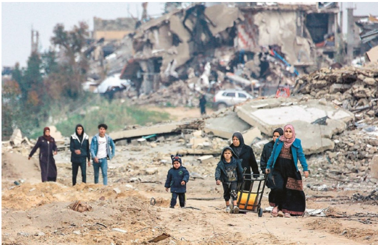
أسرة فلسطينية بلا مأوى في غزة

ووفق المسؤول العربي، لا تزال المحادثات جارية حول الدول التي ستشارك في قوة الاستقرار الدولية المزمع نشرها في القطاع. ومن المتوقع أن تبدأ القوة انتشارها خلال الربع الأول من 2026، لتتولى حفظ الأمن ومنع عودة التصعيد بين إسرائيل والفصائل الفلسطينية. كما توقع أن تكون المفاوضات المقبلة بين إسرائيل وحماس حول المرحلة الثانية "بالغة الصعوبة"، خصوصاً في ما يتعلق بسلاح الحركة