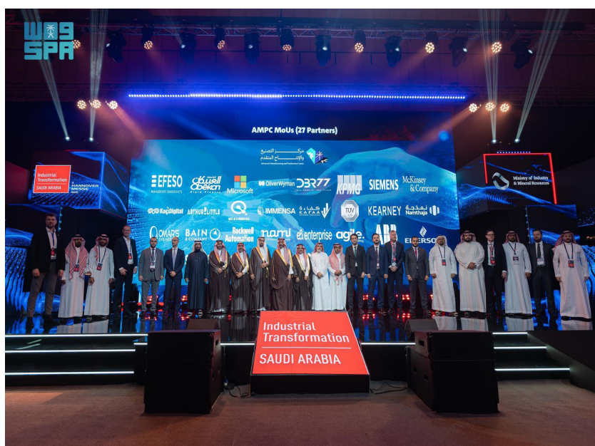
بندر الخريف متوسطاً مستثمرين وقادة شركات محلية ودولية

للمنشآت الصناعية، تعزيز نموها واستدامة أعمالها، ومذكرة تفاهم مع شركة كاتريون للتمويل القابضة، لدعم سلاسل الإمداد الوطنية، والمحتوى المحلي. كما وقع مركز التصنيع والإنتاج المتقدم مذكرات تفاهم مع شركات صناعية واستشارية محلية ودولية، دعماً لمسار التصنيع المتقدم وسلاسل الإمداد والابتكار التقني. وتتكامل جهود الوزارة لتحقيق التحول الذي في المنشآت الصناعية، مستهدفة أتمتة 4 آلاف مصنع؛ لترسيخ دورها في قيادة التحول الصناعي العالمي نحو مستقبل مستدام.