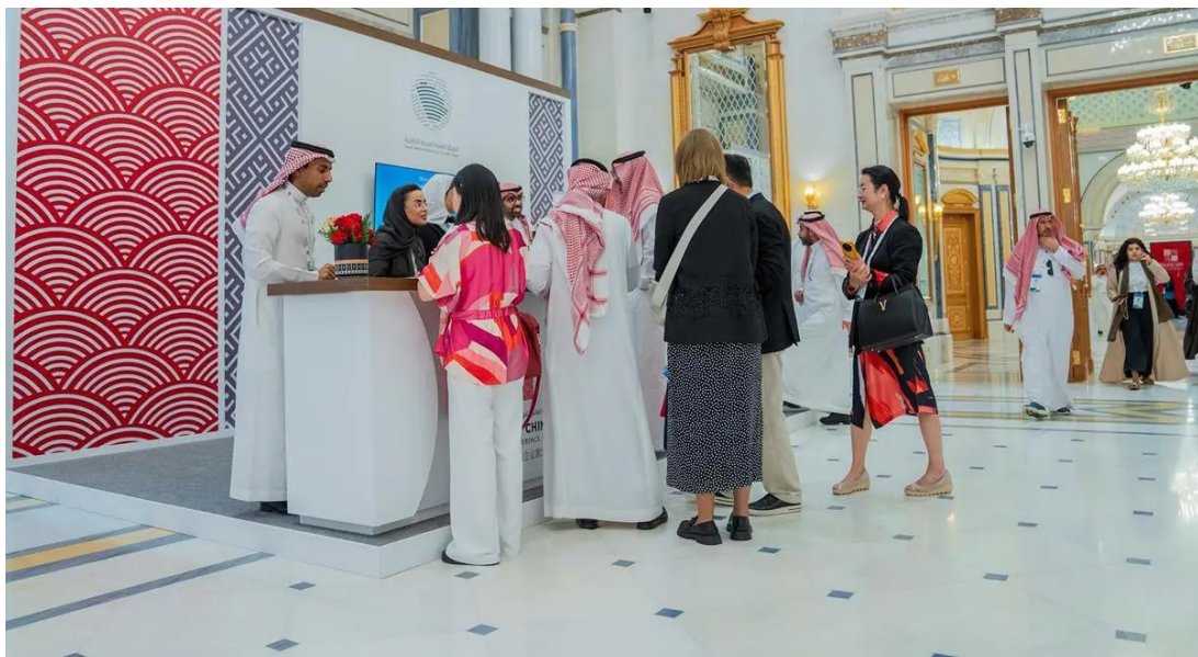
مشاركة وزارة التجارة في مؤتمر دولي سابق

الوزارة في 500 ريال، وفي حال تكرار مخالفة عدم تقديم التأكيد السنوي لبيانات المستفيد الحقيقي خلال المدة المقررة للسنة اللاحقة لقرار المخالفة السابق مكتسب القطعية، فتمت زيادة الغرامة بنسبة 50%. ومن المقرر أن تكون آلية التبليغ بقرار المخالفة المباشرة؛ وفقاً للآلية التي نصت عليها المادة (94) من اللائحة التنفيذية لنظام الشركات.