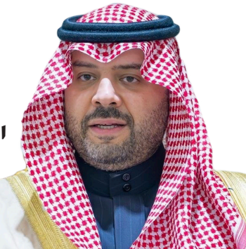
الأمير فيصل بن خالد

تحت رعاية صاحب السمو الملكي الأمير فيصل بن خالد بن سلطان بن عبدالعزيز أمير منطقة الحدود