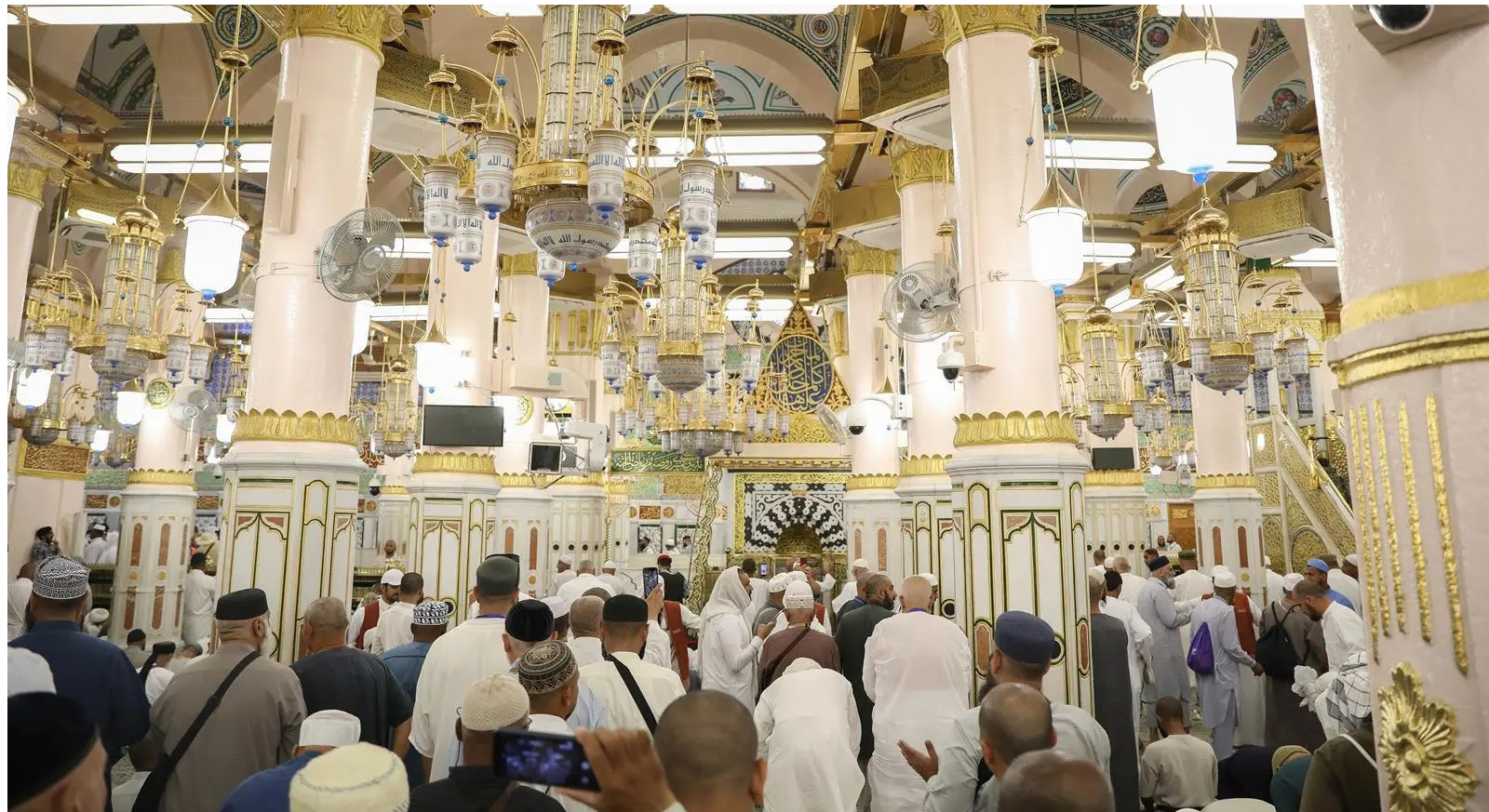
زوار الروضة الشريفة

صباحاً، ثم من بعد صلاة الجمعة حتى صلاة العشاء، في حين تكون للنساء بعد صلاة الفجر وحتى التاسعة صباحاً، ثم من بعد صلاة العشاء وحتى الساعة الثانية فجراً. وأوضحت الهيئة أنه يُسمح بدخول كبار السن بالعربة اليدوية ضمن الضوابط المحددة؛ بما يسهل عليهم أداء الزيارة بكل راحة.