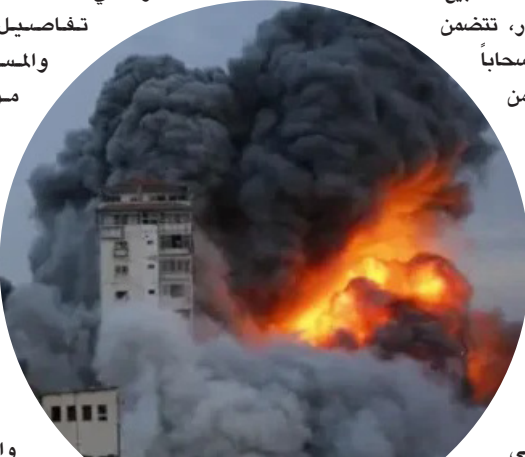
ثيران ودخان متبعث جراء غارة إسرائيلية سابقة على غزة

دونالد ترمب، وهي هيئة دولية وافق عليها مجلس الأمن الشهر الماضي إلى جانب قوة الاستقرار الدولية. وتأتي هذه التطورات بينما لا تزال تفاصيل ترتيبات الحكم والمسؤوليات الأمنية موضع نقاش بين الأطراف المعنية، وسط تساؤلات داخل الساحة الفلسطينية حول مستقبل حكم غزة، ومصير الملفات الحساسة، مثل نزاع السلاح، وإعادة الإعمار، وإدارة المعابر.