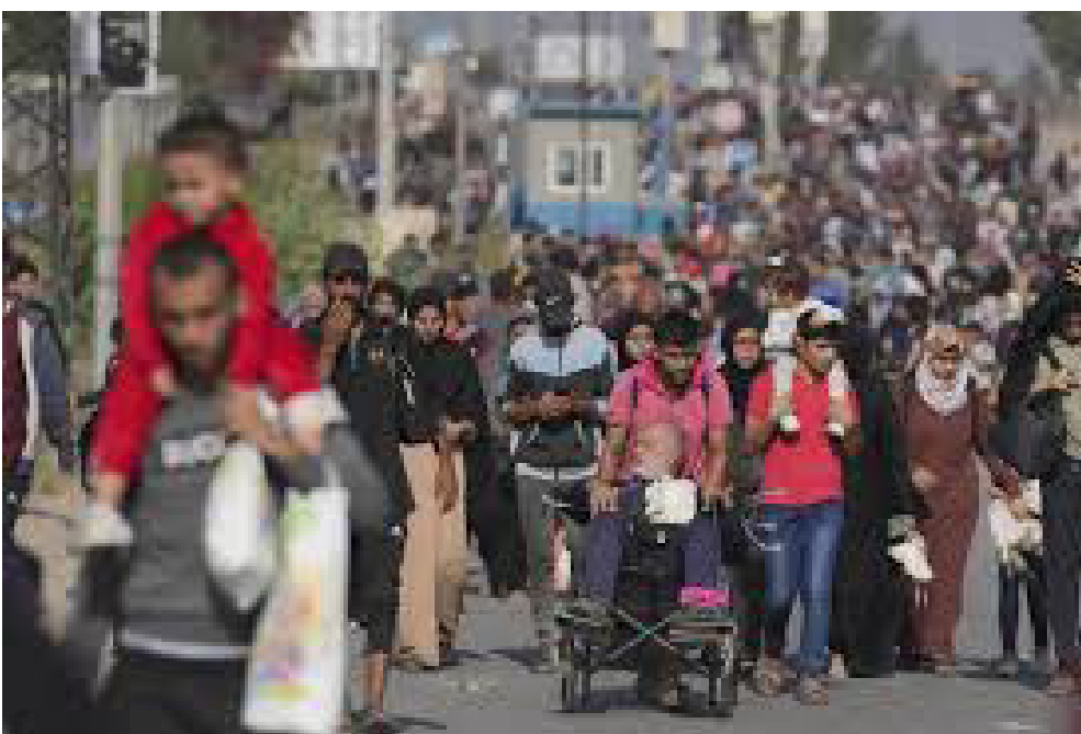
أسر فلسطينية مهجرة

وأشارت إلى أن المحاولات الإسرائيلية لتهجير الشعب الفلسطيني من أرضه، تُعد استمراراً لسياسات الاحتلال الرامية إلى تقويض فرص السلام والوجود الفلسطيني على أرضه، مشددة