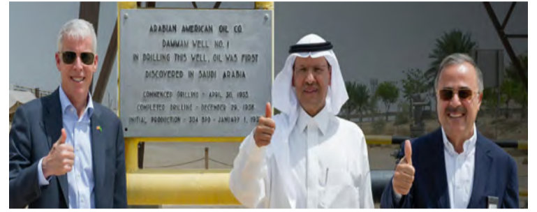
الأمير عبدالعزیز بن سلمان متوسلاً وزير الطاقة الأمريكي ورئيس أرامكو

زار صاحب السمو الملكي الأمير عبدالعزیز بن سلمان بن عبدالعزيز وزير الطاقة، ونظيره الأمريكي كريستوفر راي، ورئيس أرامكو السعودية المهندس أمين الناصر، بئر الدمام (1)، أول بئر بترولي في المملكة العربية السعودية، والذي يعد نقطة الانطلاق لمسيرة التحول الاقتصادي وبداية صناعة النفط في المملكة، وتم حفره من قبل شركة الزيت العربية الأمريكية (أرامكو السعودية لاحقاً) عام 1935. كما استقبل الأمير