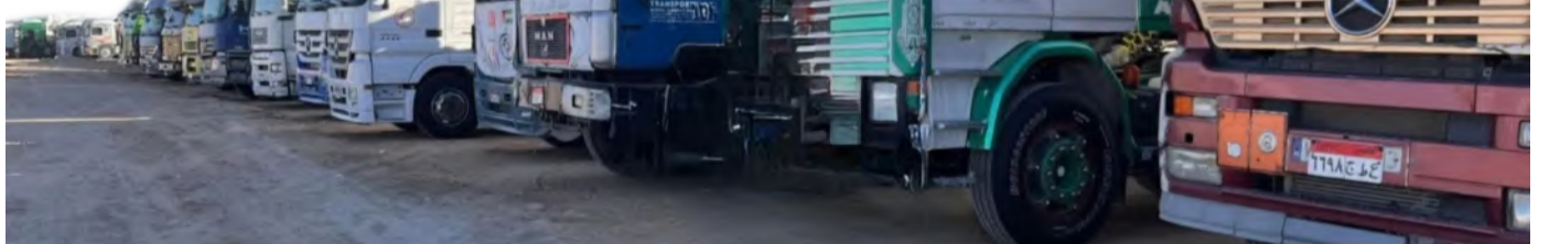
شاحنات مساعدات في معبر رفح بانتظار سماح الإحتلال بدخولها لقطاع غزة

كما طالب بإلغاء الحصار المفروض على غزة فورًا، محذّرًا من أن الوضع يزداد تدهورًا منذ انهيار الهدنة، وأشد بشجاعة الصحفيين الفلسطينيين، مؤكداً أهمية وجود صحافة دولية مستقلة لتوثيق ما يجري.