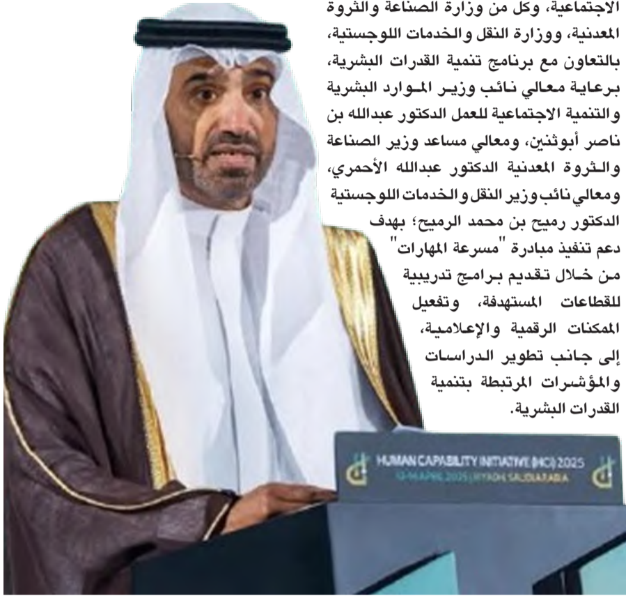
وزير الموارد خلال مؤتمر مبادرة القدرات البشرية

الاجتماعية، وكل من وزارة الصناعة والثروة المعدنية، ووزارة النقل والخدمات اللوجستية، بالتعاون مع برنامج تنمية القدرات البشرية، برعاية معالي نائب وزير الموارد البشرية والتنمية الاجتماعية للعمل الدكتور عبدالله بن ناصر أبوثنين، ومعالي مساعد وزير الصناعة والثروة المعدنية الدكتور عبدالله الأحمرى، ومعالي نائب وزير النقل والخدمات اللوجستية الدكتور رميح بن محمد الرميح؛ بهدف دعم تنفيذ مبادرة "مسرعة المهارات" من خلال تقديم برامج تدريبية للقطاعات المستهدفة، وتفعيل المكتبات الرقمية والإعلامية، إلى جانب تطوير الدراسات والمؤشرات المرتبطة بتنمية القدرات البشرية.