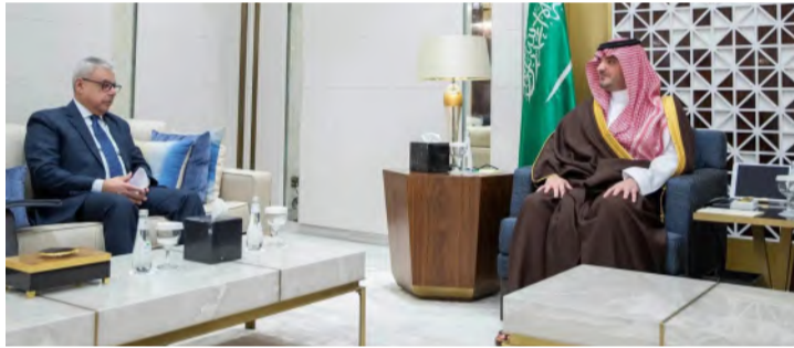
الأمير سعود بن نايف مستقبلاً إيهاب أبو سريع

الوزير للدراسات والبحوث اللواء خالد سليمان العيسى، ومدير عام الشؤون إبراهيم العروان، ومدير عام مكتب محمد بن مهنا المهنا، ومدير عام مكتب