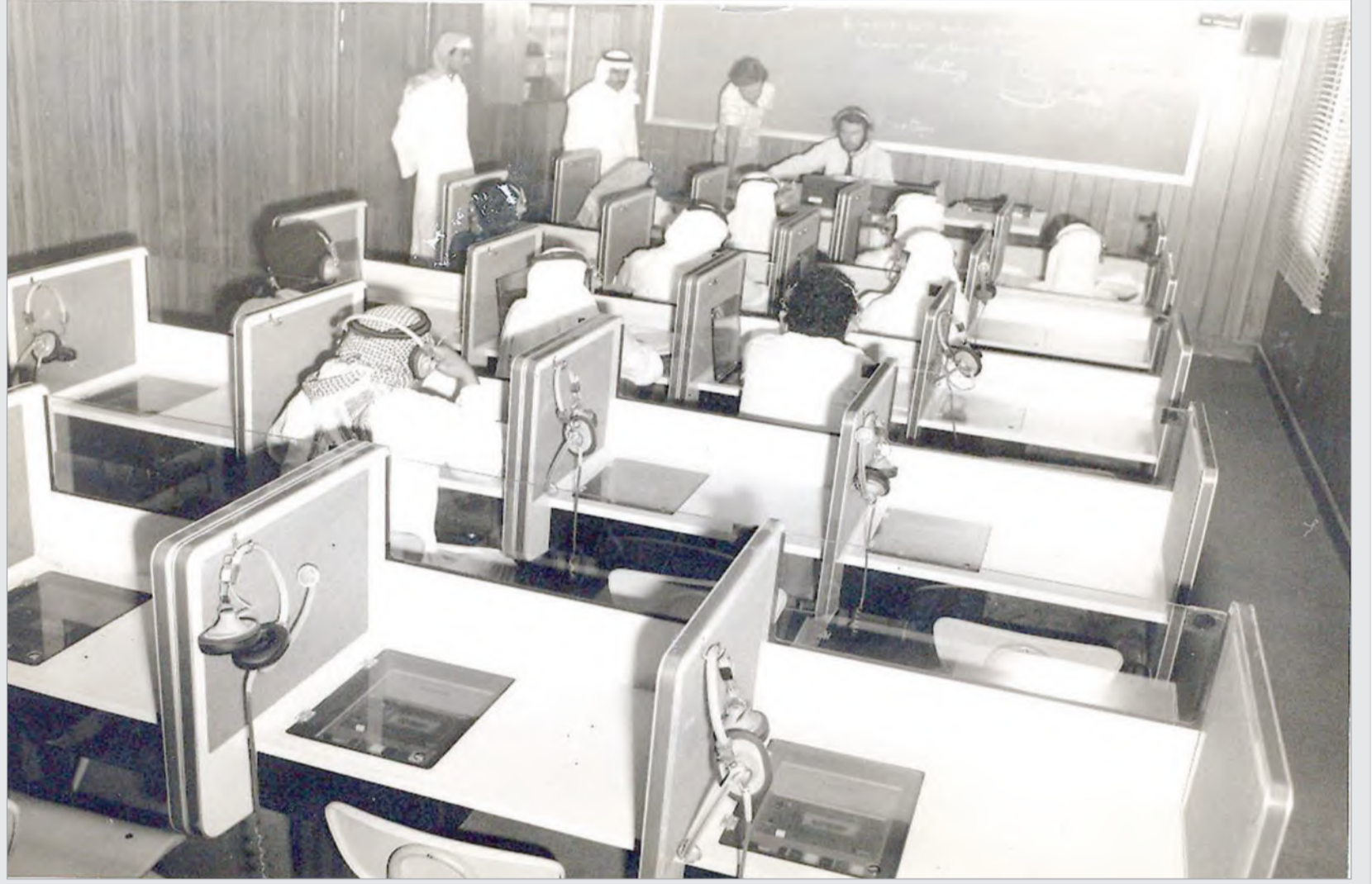
الاهتمام بتدريب الموظفين والشباب وتنمية قدراتهم في شتى المجالات