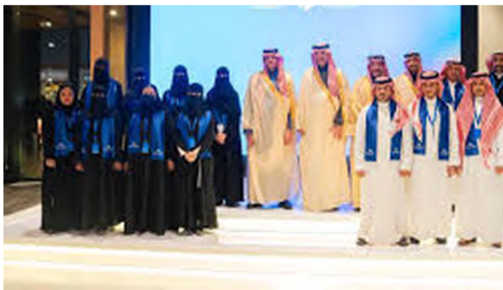
أكاديمية الإعلام تطور قدرات الكوادر الوطنية

يذكر أن الأكاديمية تسعى من خلال هذه المسارات والبرامج إلى تأهيل نخبة من الإعلاميين القادرين على صناعة محتوى إعلامي مهني، وتحقيق تأثير فعال في المشهد الإعلامي، تماشياً مع أهداف رؤية المملكة 2030، فيما تستعد الأكاديمية لإطلاق النسخة الأولى من مسار قادة الإعلام في أغسطس القادم، بالتعاون مع نخبة من الجامعات والمؤسسات العالمية؛ بهدف تأهيل 40 إعلامياً لقيادة التغيير الإيجابي في القطاع الإعلامي، حيث تستقبل الأكاديمية الراغبين في التسجيل وحضور دوراتها وبرامجها التدريبية عبر موقعها الإلكتروني: https://sma.edu.sa/ar