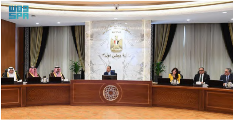
رئيس الوزراء المصري خلال لقائه مساعد وزير الاستثمار

بتعزيز الشراكات الاستثمارية مع المملكة. بدوره قال مساعد وزير الاستثمار إن مصر تزخر بوجود العديد من الفرص الاستثمارية في القطاعات المختلفة، ولسنا حرصاً ورغبة من رجال الأعمال المصريين على الاستثمار في المملكة.