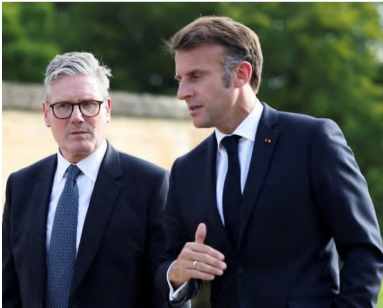
الرئيس الفرنسي ماكرون ورئيس الوزراء البريطاني ستارمر

الدفاعي، تحسبًا لأي تراجع أمريكي عن التزاماتها التقليدية، فيما تُناقش أيضًا آليات دعم أوكرانيا عسكريًا بعد اتفاق سلام محتمل قد ترعاه واشنطن. وتلعب كل من فرنسا والمملكة المتحدة دورًا محوريًا في هذا التحرك، عبر ما بات يُعرف بـ "اتفاق الراغبين"، الذي يهدف الطريق لتوقيع الاتفاق خلال القمة الأوروبية المرتقبة في لندن. ويُنظر إلى هذه الخطوة كعلامة على عودة التعاون العملي بين لندن وبروكسل في ملف الأمن، بعد سنوات من الجمود عقب "بريكست". وبموجب البرنامج الدفاعي الذي تصل ميزانيته إلى 150 مليار يورو، ستمنح الحكومات الأوروبية قروضًا مدعومة من ميزانية الاتحاد المشتركة لتمويل مشتريات عسكرية مشتركة، تشمل أنظمة دفاع جوي وصاروخي. وسيسمح الاتفاق المنتظر لشركات الدفاع البريطانية، المرتبطة بشبكات صناعية في ألمانيا والسويد وإيطاليا، بالمشاركة الكاملة في هذه المشاريع.