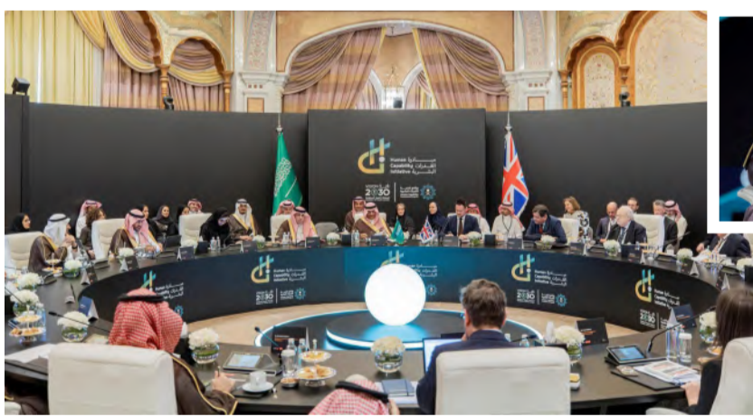
جلسة اللقاء السعودي البريطاني