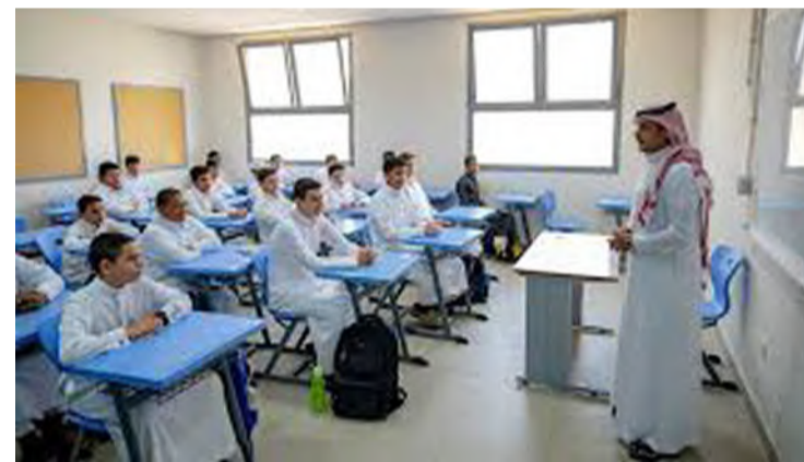
المملكة نموذج رائد في جودة التعليم

وتضمنت المسارات والبرامج التدريبية المنفذة خلال الربع الأول من هذا العام "مسار الإعلام الرياضي" الذي درّب عدداً من قيادات الاتحادات