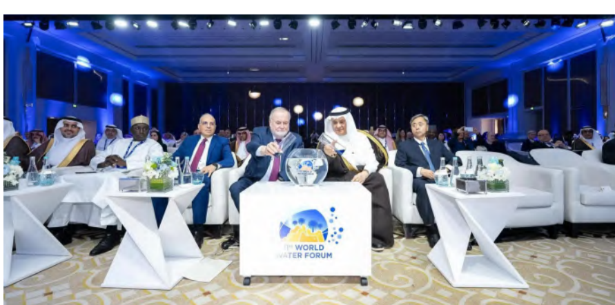
جانب من اللقاء التحضيري لمنتدى المياه

من جهته، أوضح رئيس مجلس المياه العالمي لوك فوتشون أن المجلس والجهات المعنية في المملكة قاموا بإعداد إطار عمل يشتمل على المكونات الموضوعية والإقليمية والسياسية؛ لوضع خارطة طريق لأعمال الدورة الحادية عشرة للمنتدى، مؤكداً أهمية أن يعمل الجميع على جعل المياه قضية ذات أولوية على قدم المساواة مع الطاقة والاتصالات والنقل، مشيراً إلى أن هذا اللقاء سيقيم بوضع الأسس لسياسات المياه في السنوات المقبلة.