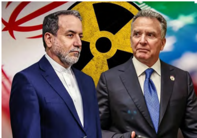
ويتكوف ووزير الخارجية الإيراني عراقجي

يتزامن هذا التحرك الدبلوماسي الجديد مع تصعيد في لهجة الرئيس الأمريكي دونالد ترامب، الذي صرّح من على متن طائرة الرئاسة بأنه "سيخضع قرارًا سريعًا جدًا" بشأن إيران، وذلك بعد تلويحه أكثر من مرة بالخيار العسكري في حال لم تُفضّ المحادثات إلى اتفاق يمنع طهران من تصنيع سلاح نووي. في المقابل، تُصنّر إيران على الطابع السلمي لبرنامجها وتعتبر الضغوط والتهديدات الأمريكية عائقًا أمام أي تفاهم. ويصل المدير العام للوكالة الدولية للطاقة الذرية رافائيل غروسي، غدا الأربعاء، إلى طهران في محاولة لتعزيز التعاون الفتي. وكان غروسي