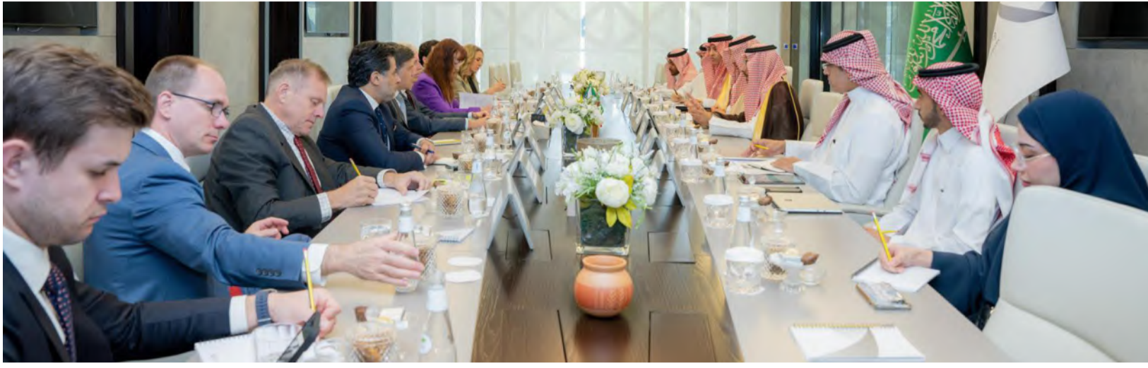
اجتماع وزير الصناعة والتعدين مع الوفد الأمريكي