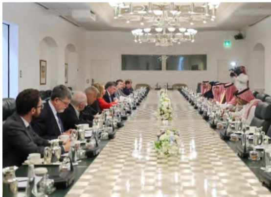
الجبير خلال اجتماعه مع ديفيد ماك والوفد المرافق له أمس

عقد وزير الدولة للشؤون الخارجية عضو مجلس الوزراء ومبعوث شؤون المناخ عادل بن أحمد الجبير، في ديوان الوزارة بالرياض أمس، اجتماعاً مع رئيس لجنة العلاقات الخارجية في البرلمان الأوروبي ديفيد ماك الستر والوفد المرافق له. وجرى خلال الاجتماع استعراض علاقات التعاون المشترك بين المملكة والاتحاد الأوروبي في شتى المجالات، وبحث المستجدات المتعلقة بالساحتين الإقليمية والدولية، بالإضافة إلى القضايا ذات الاهتمام المشترك. حضر الاجتماع وكيل الوزارة للشؤون الدولية المتعددة والمشرف العام على وكالة الوزارة لشؤون الدبلوماسية العامة الدكتور عبدالرحمن الرسي.