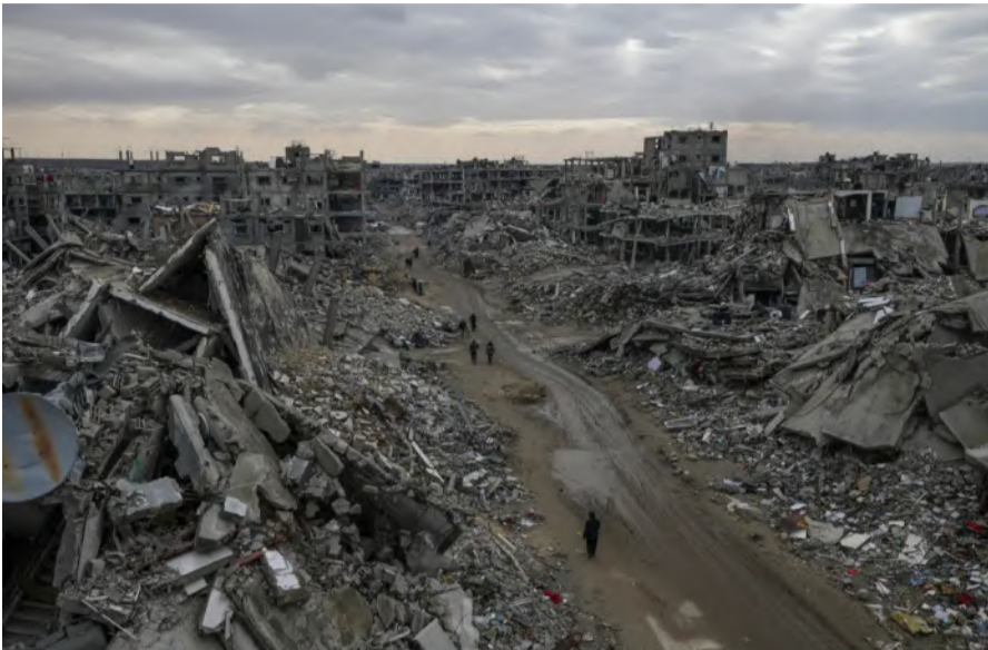
غزة تحولت لتلال من الأنقاض بعد عام ونصف من العدوان الإسرائيلي

وفيما تتعثر المفاوضات بين مدّ وجزر، تكتف إسرائيل بضغطها الميدانية إلى أقصى حد. فقد أعلن وزير الدفاع الإسرائيلي يسرائيل كاتس أن