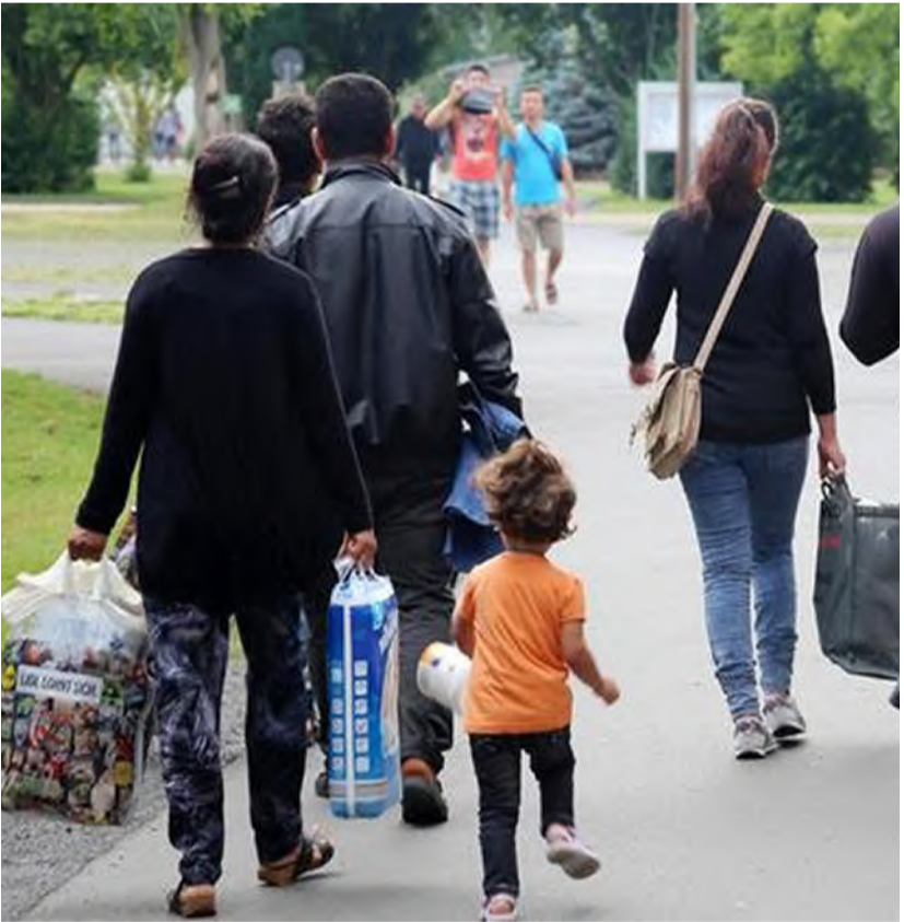
مهاجرون في ألمانيا

أعلنت وزارة الداخلية الألمانية والمفوضية السامية للأمم المتحدة لشؤون اللاجئين، أمس الثلاثاء، عن تعليق ألمانيا مؤقتاً قبول أي لاجئين إضافيين عبر برنامج إعادة التوطين الذي تديره المفوضية. وتعد قضية الهجرة موضوعاً خلافياً منذ فترة طويلة، حيث تتباين مواقف الأطراف السياسية خلال مفاوضات الحكومة الائتلافية بين كتل الاتحاد الديمقراطي المسيحي والاتحاد الاجتماعي المسيحي من جهة، والحزب الديمقراطي الاجتماعي من جهة أخرى. يدعو المحافظون إلى نهج أكثر صرامة تجاه طالبي اللجوء في ظل تزايد الدعم لحزب البديل من أجل ألمانيا اليميني المتطرف،