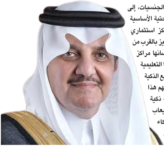
الأمير سعود بن نايف

جانبة للكفاءات والخبراء من مختلف الجنسيات، إلى جانب تنوعها البيئي وكفاءة بنيتها التحتية الأساسية والرقمية، ما يعزز من مكانتها؛ كمرکز استثماري وابتكاري، كما أن موقعها الجغرافي المميز بالقرب من دول مجلس التعاون الخليجي، واحتضانها مراكز الأبحاث والابتكار، إضافة إلى مخرجاتها التعليمية المتميزة، جعلها مؤهلة لاستقطاب المشاريع الذكية ذات الطابع المستقبلي. ويتوقع أن يسهم هذا التقدم في تعزيز مكانة الخبر كمدينة ذكية رائدة في المنطقة، قادرة على استيعاب واستثمار أحدث التقنيات؛ مثل الذكاء الاصطناعي، وإنترنت الأشياء، والمدن المستدامة، بما يعزز من تنافسيتها على الصعيدين الإقليمي والدولي.