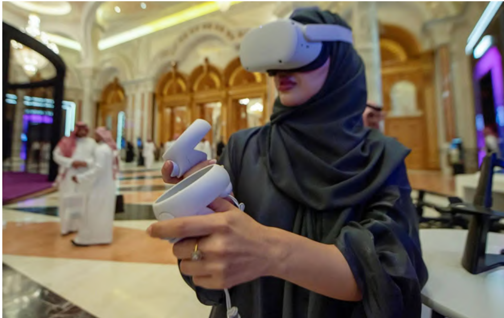
سياسات طموحة ومبادرات نوعية أطلقتها المملكة لتمكين المرأة في القطاعات التقنية تحقيقاً لرؤية 2030