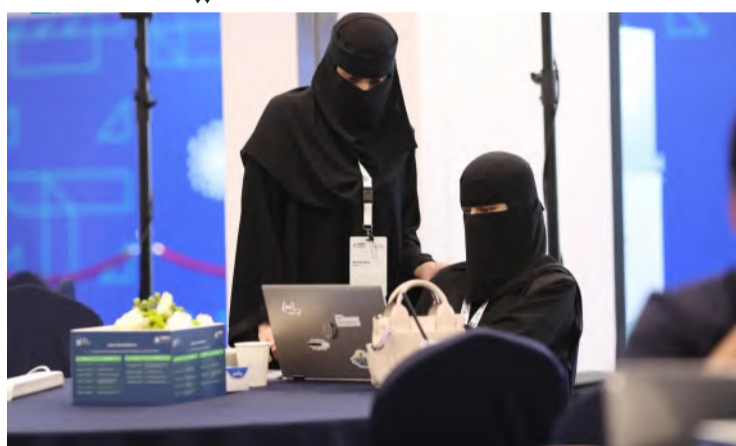
مشاركاتان في إحدى الفعاليات السابقة للذكاء الاصطناعي

وأبرزت "سدايا" جهود المملكة من خلال إدراج النموذج اللغوي الضخم "علام" الذي طوّرت على منصة "Hugging Face" العالمية، ضمن أفضل النماذج التوليدية باللغة العربية في العالم، وإدراجها في منصة watsonx التابعة لشركة IBM العالمية خلال مؤتمر (IBM Think 2024) بمرحلته التجريبية؛ بوصفه أحد أفضل النماذج التوليدية باللغة العربية في العالم، ما يؤكد مكانة المملكة؛ بصفتها قوة فاعلة في تطوير حلول الذكاء الاصطناعي باللغة العربية.