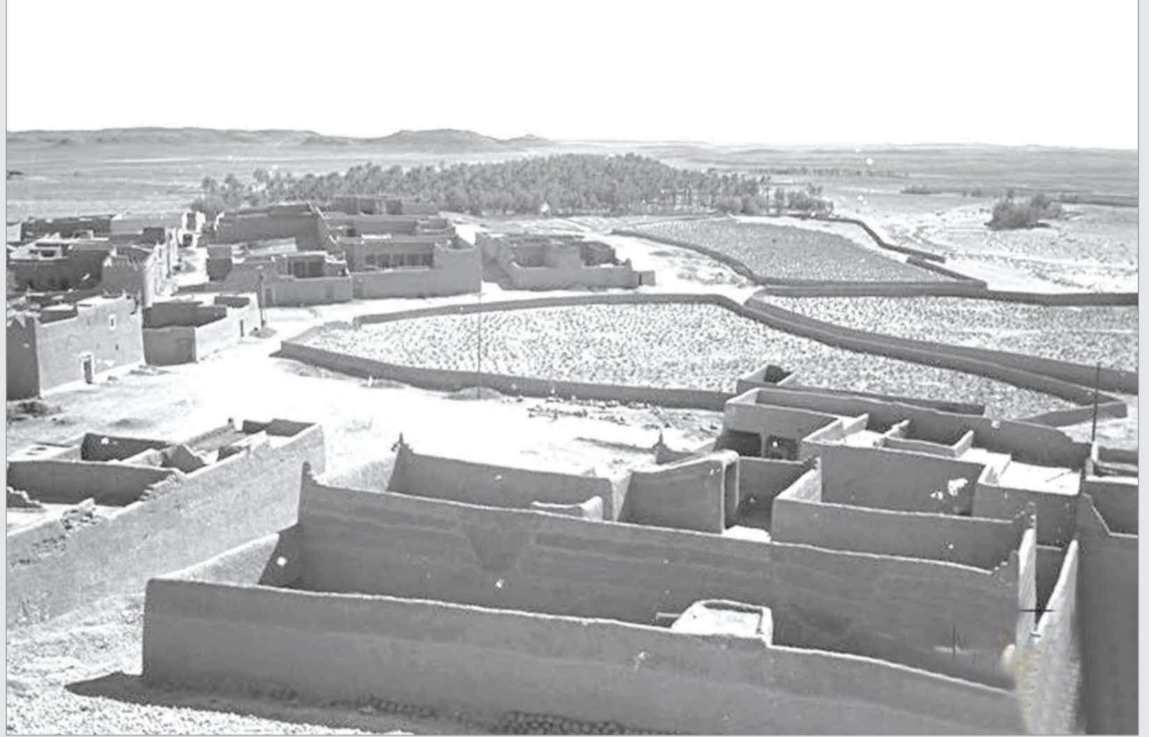
مدينة الجمعة - حي الظهيرة