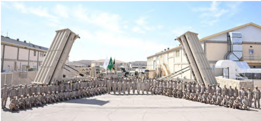
جانبة من حفل تخريج منظومة الدفاع الصاروخي "ثاد"