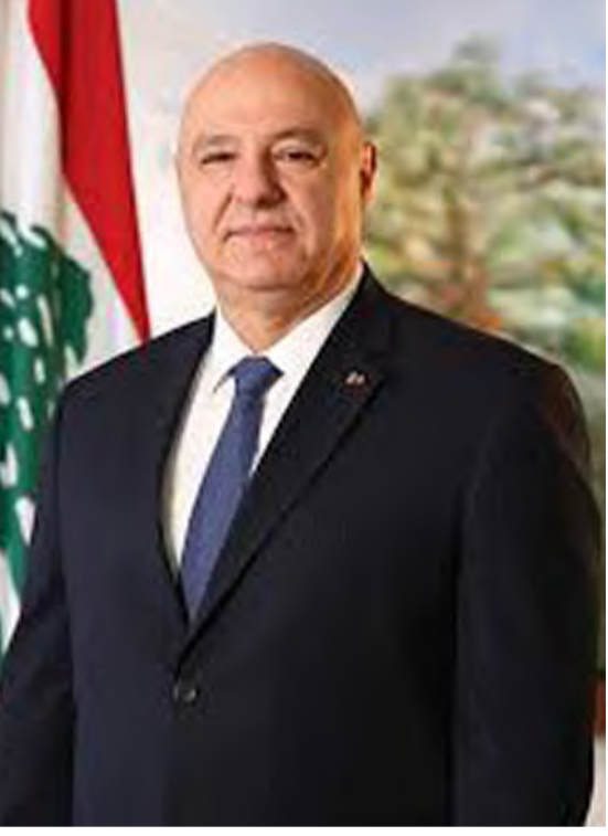
الرئيس اللبناني جوزيف عون

من المقرر أن يزور رئيس الجمهورية اللبنانية العماد جوزيف عون قطر في 16 الجاري، تلبية لدعوة وجهها إليه أمير دولة قطر الشيخ تميم بن حمد آل ثاني. وكان السفير القطري في بيروت الشيخ سعود بن عبد الرحمن آل ثاني قد نقل الدعوة إلى عون أثناء تهنئته له بانتخابه رئيساً للجمهورية. وسيوجه الرئيس عون إلى دولة الإمارات للقاء كبار المسؤولين، على أن يعود إلى بيروت بعد ذلك. ومن المتوقع أن يستمع في كل من قطر والإمارات إلى تأكيدات عن الاستعداد لدعم لبنان ضمن مسار تنفيذ الإصلاحات اللازمة وتعزيز استقرار وسيادة الدولة على كامل أراضيها.