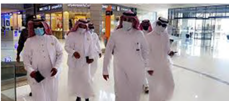
زيارات الموارد تعزز الأداء الحكومي

وزارة الموارد البشرية والتنمية الاجتماعية بتطوير الخدمات الحكومية؛ بما يتماشى مع رؤية المملكة 2030، التي تركز على تعزيز التحول الرقمي والارتقاء بجودة الخدمات. وتؤكد الوزارة استمرارها في تطوير الحلول التقنية المبتكرة، التي تسهم في رفع كفاءة القطاع الحكومي، وتحسين تجربة المستفيدين؛ بما يضمن تقديم خدمات متميزة تلبى تطلعات المواطنين والمقيمين على حد سواء.