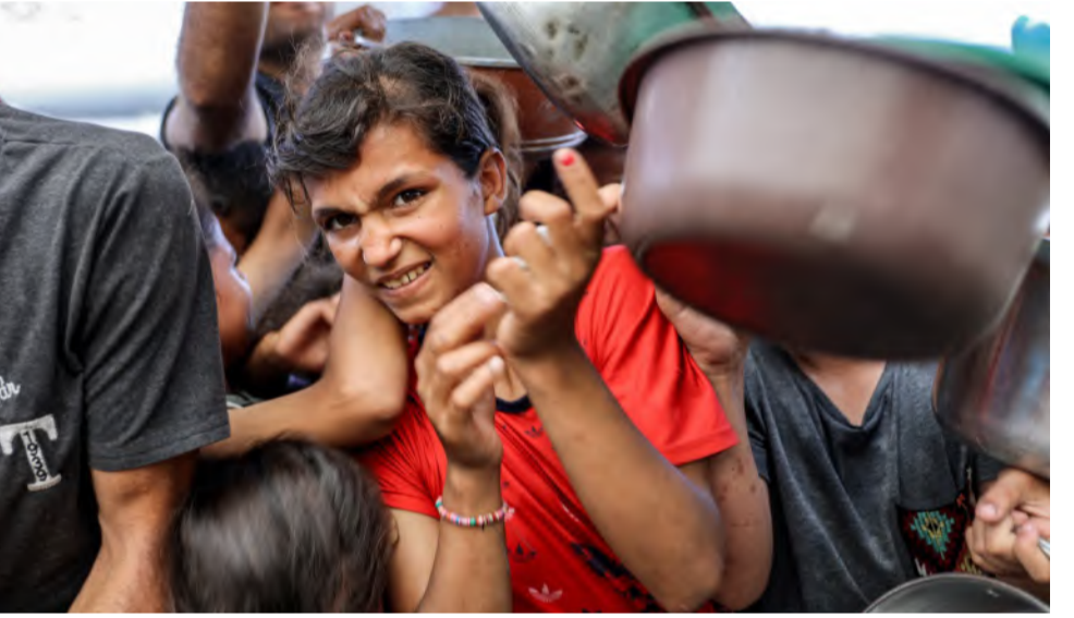
سبي في غزة يكافح للحصول على وجبة طعام

وفي بيان مشترك، أعرب رؤساء مكتب الأمم المتحدة لتنسيق الشؤون الإنسانية، واليونيسف، ومكتب خدمات المشاريع، و"الأونروا"، وبرنامج الأغذية العالمي، ومنظمة الصحة العالمية، عن صدمتهم من استمرار الحصار ومنع تدفق المساعدات، رغم تراكم المواد الغذائية والأدوية والوقود في نقاط العبور.