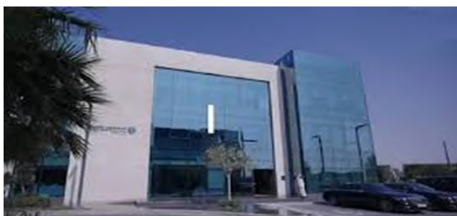
منصة استطلاع تطرح مشاريع لإبداء المرئيات

(تطوير فئات المستثمرين في السوق الموازية)، والذي تسعى من خلاله الهيئة إلى تطوير فئات المستثمرين المسموح لهم الاستثمار في السوق الموازية. أما المشروع الثاني (تعديل القواعد المنظمة للمنشآت ذات الأغراض الخاصة وقائمة المصطلحات المستخدمة في لوائح هيئة السوق