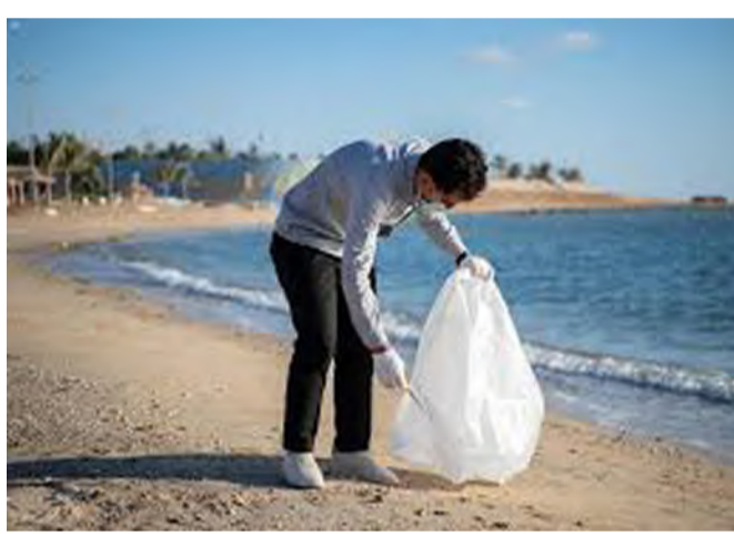
أسبوع لرفع مستوى الوعي البيئي في المجتمع