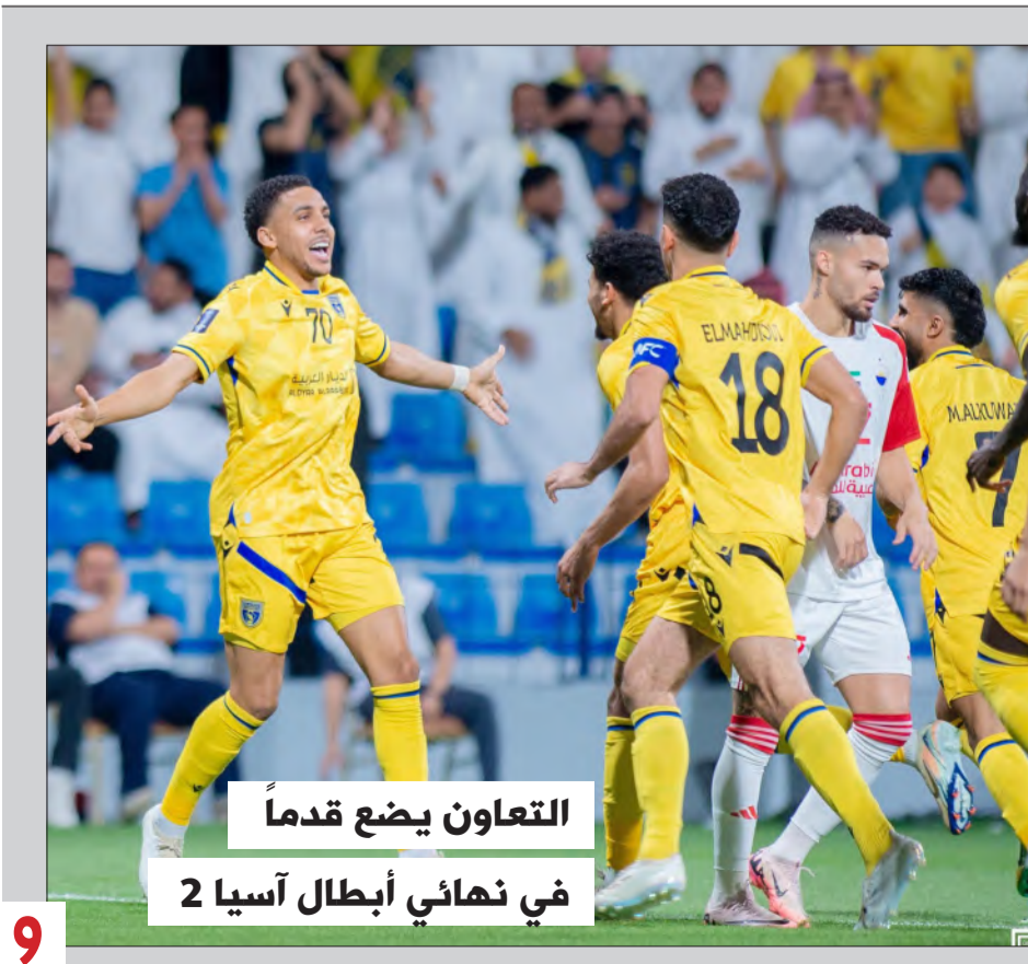
التعاون يضع قدماً في نهائي أبطال آسيا 2

أعلن الرئيس الأمريكي دونالد ترامب، أن واشنطن تجري "مباحثات مباشرة" مع طهران، مشيراً إلى اجتماع "رفيع المستوى للغاية" المقرر عقده السبت المقبل. وقال ترامب خلال لقائه رئيس الوزراء الإسرائيلي بنيامين نتنياهو في البيت الأبيض: "لدينا لقاء كبير