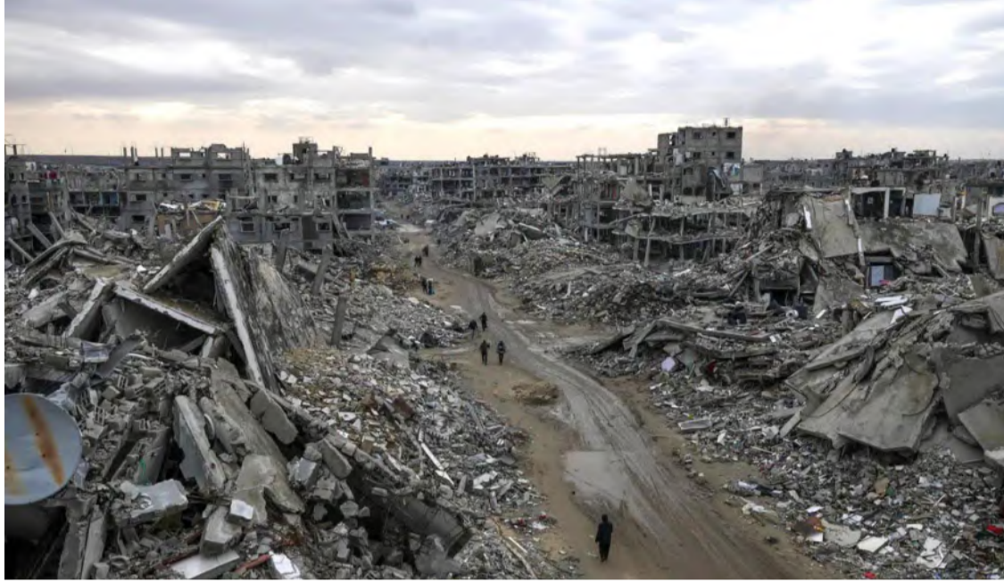
دمار كبير خلفته الغارات الإسرائيلية على غزة

وأبدى ترامب مؤخرًا رغبته في وقف الحرب على غزة، وذلك خلال استقباله لنتنياهو في البيت الأبيض، وقال: "أود أن أرى الحرب تتوقف، وأعتقد أنها ستتوقف في وقت ما، ولن يكون ذلك في المستقبل البعيد"، لكنه أضاف أن "سيطرة الولايات المتحدة على قطاع غزة وامتلأها له" سيكون أمرًا جيدًا، مجددًا اقتراحًا طرحه مرات عدة خلال الأسابيع الأولى من