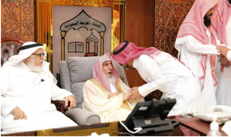
مفتي عام المملكة مستقبلاً المهنيين بعيد أمس في الرياض

ونوه سماحة مفتي عام المملكة، بما تحققت للرئاسة من منجزات خلال شهر رمضان وأيام العيد، في تأدية المهام المفوضي الإفتاء بعموم المناطق والمحافظات التابعة لها، في إطار الحرص على نشر العلم الشرعي بالأحكام العامة والخاصة، وتقديم الفتاوى للمعتمدين والزوار. ودعا سماحة المفتي العام الشيخ عبدالعزيز آل الشيخ الله - تعالى - أن يحفظ القيادة الرشيدة، وأن يجزيهم خير الجزاء.