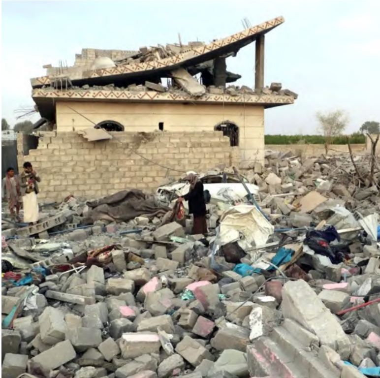
آثار الغارة الأمريكية على صعدة

وفي إطار الجهود الإنسانية، عبر العديد من المهاجرين عن رغبتهم في العودة الطوعية إلى بلدانهم، حيث اصطفاوا أمام مقر الهلال الأحمر والمنظمة الدولية للهجرة لتسوية أوضاعهم وتلقي المساعدة اللازمة.