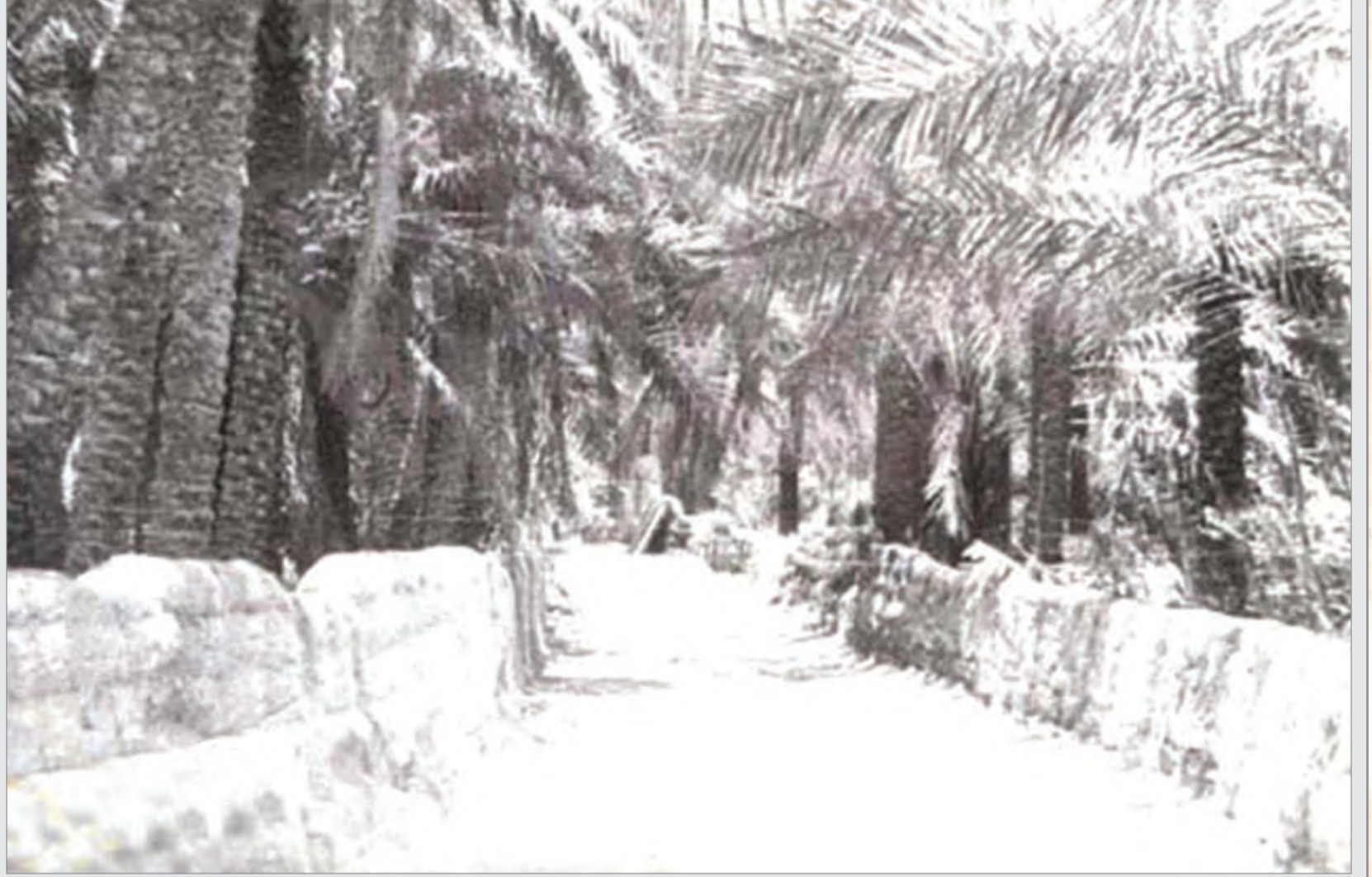
طريق بين المزارع - مدينة القصيم