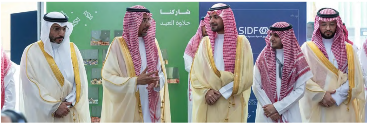
الخريف متحدثًا خلال جولة المعاينة أمس في الرياض

المنظومة؛ بمناسبة عيد الفطر المبارك، قدم خلالها التهنئة للجميع، مؤكدًا أهمية الاستمرار في العمل بروح الفريق الواحد، وتعزيز التنسيق والتكامل بين مختلف الجهات؛ لدفع مسيرة النمو الصناعي والتعديني، وتطوير المحتوى المحلي، وتهيئة بيئة جاذبة للاستثمارات النوعية ذات القيمة المضافة.