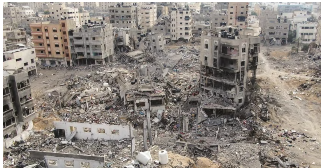
مسكن مدمرة في قطاع غزة

الضمان الوحيد للتوصل إلى السلام الدائم بالمنطقة". وتأتي هذه القمة في وقت حساس، حيث اتصلت إسرائيل في 18 مارس الماضي، من اتفاق وقف إطلاق النار وتبادل الأسرى الساري منذ 19 يناير الماضي، واستأنفت حرب الإبادة الجماعية على قطاع غزة. من المتوقع أن تطلق القمة إلى عدد من المحاور الرئيسية، أبرزها، بحث سبل الوصول إلى اتفاق لوقف إطلاق النار بشكل عاجل بين إسرائيل و"حماس"، والعمل على تجنب المزيد من التصعيد، وتفعيل الدعم الإنساني للعاجل لسكان غزة من خلال فتح ممرات آمنة لوصول المساعدات الطبية والغذائية، ودراسة آليات تنفيذ الخطة العربية لإعادة إعمار غزة.