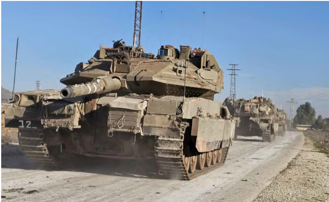
دبابات إسرائيلية في جنوب سوريا

في مقابل هذه القيود، عرضت إسرائيل طروداً غذائية على سكان القرى الفقيرة، في محاولة مكشوفة لكسب ود الأهالي وتحسين صورة جيش الاحتلال. وبينما قبل البعض مضطراً، رفض كثيرون، إدراكاً منهم أن ما يُمنح اليوم كمساعدة، سيتحول غداً إلى أداة لإدامة الاحتلال.