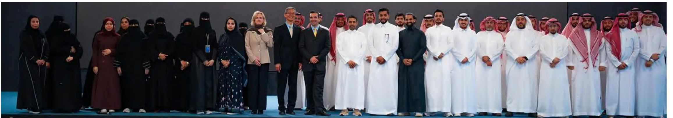
رؤساء تنفيذيون ومديرو إدارات مشاركون في البرنامج