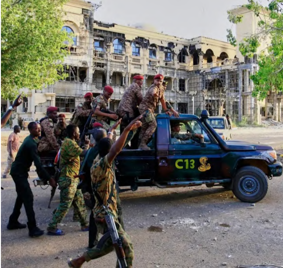
عناصر من الجيش السوداني في الخرطوم أمس

وفي سياق تخفيف معاناة العالقين وتسهيل عودة السودانين إلى وطنهم، وصلت 30 حافلة وشاحنة إلى معبر أرقين الحدودي مع مصر، بهدف إجلاء السودانين العالقين ونقلهم إلى مختلف مدن