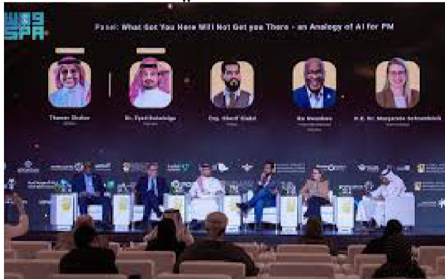
قادة الفكر يشاركون في المنتدى العالمي لإدارة المشاريع

برعاية وزير البلديات والإسكان، ماجد بن عبدالله الحقي، تستضيف العاصمة الرياض النسخة الرابعة من المنتدى العالمي لإدارة المشاريع، الذي يُقام خلال الفترة من 17 إلى 19 من شهر مايو 2025، تحت عنوان "الجيل القادم لإدارة المشاريع: القدرة البشرية، قوة العمليات، قوة التكنولوجيا"، وذلك تأكيداً على الدور الريادي للمملكة في تطوير منظومة إدارة المشاريع، وتعزيز الابتكار والاستدامة على المستوى المحلي والعالمي.