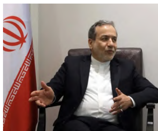
وزير الخارجية الإيراني عباس عراقجي

في المقابل، تتواصل الإشارات الأمريكية الحازمة بشأن ملفات حساسة كالمشروع النووي والبرنامج الصاروخي، في سياق مقارنة صارمة لكنها لا تُخلق باب الحوار كلياً. وقد تؤدي هذه الدينامية، إذا ما تم توظيفها بحكمة، إلى خلق مساحة تفاهم