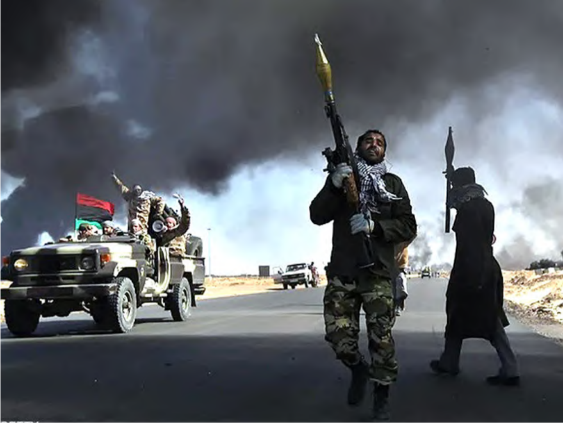
اشتباكات سابقة بين الميليشيات في غرب ليبيا

وفي مدينة الزاوية، تصاعدت الاشتباكات بين ميليشيا "الكابوات" وعناصر جهاز "مكافحة التهديدات الأمنية" في محيط مصفاة النفط، مما أسفر عن مقتل عنصر أمني وشاب مدني، إضافة إلى العديد من المصابين. كما تسببت المواجهات في أضرار للمنازل والمحلات التجارية، مما أضاف حالة من الذعر والقلق بين السكان. وفي ظل هذه التحركات، التي أثارت مخاوف من تصاعد القتال بين التشكيلات العسكرية المتنافسة، تزداد حالة الترقب في طرابلس والمدن المجاورة. هذه التحركات تأتي في وقت حساس للغاية، حيث تشهد البلاد انقساماً عسكرياً وسياسياً متزايداً، ما يزيد من القلق لدى السكان. وقد حذر المجلس الرئاسي الليبي من أي تحركات أو تنقلات أمنية وعسكرية غير مصرح بها، مؤكداً أن أي تصرف خارج الإطار القانوني يعد خرقاً يعرض مرتكبيه للمسائلة القانونية.