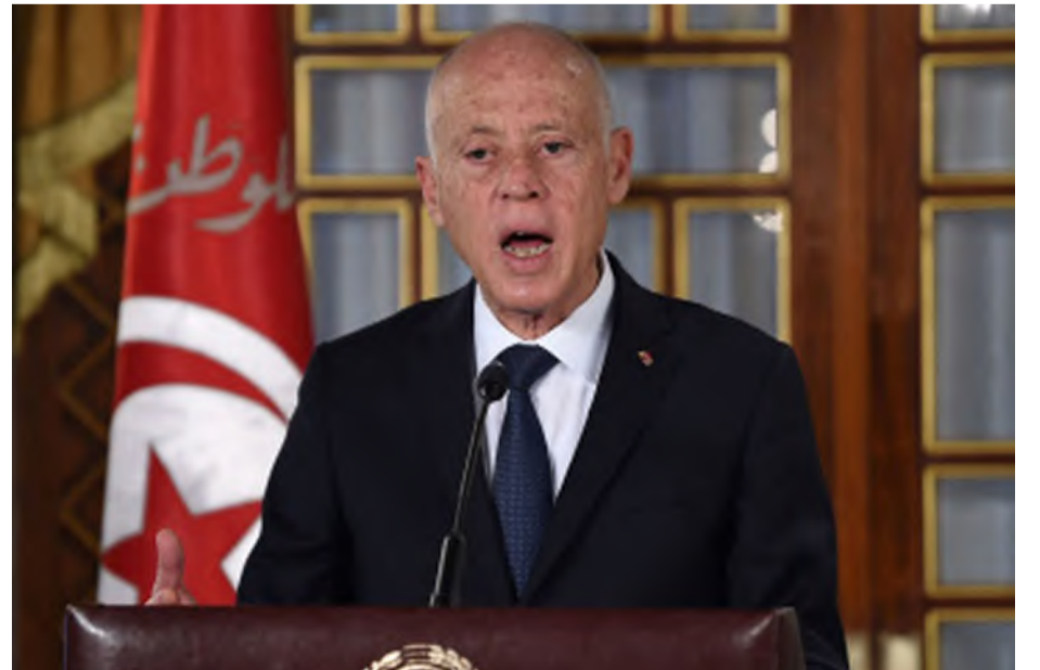
الرئيس التونسي قيس سعيد

أعلن الرئيس التونسي، قيس سعيد، عن إتمام عملية إخلاء مخيمات المهاجرين غير النظاميين من دول أفريقيا