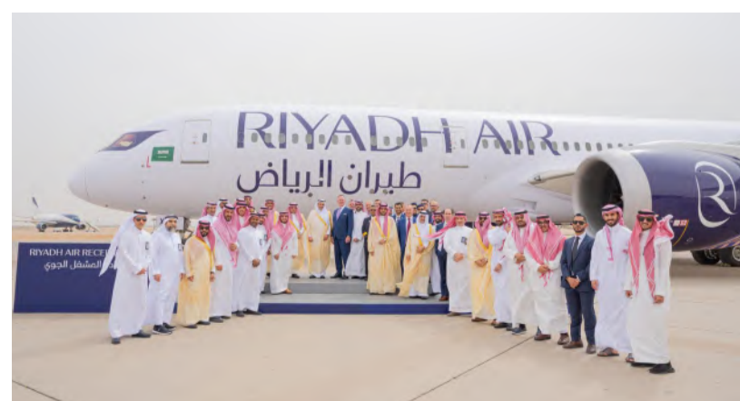
الجاسر مع منسوبي طيران الرياض عقب تسلمهم الرخصة التشغيلية أمس.