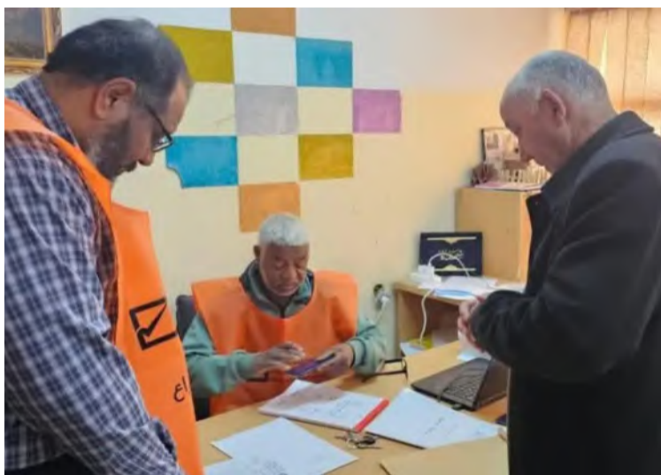
ناخب ليبي يدي بصوته في انتخابات

لتسهيل الإجراءات أمام المواطنين الذين لم يتمكنوا من التسجيل عبر الوسائل الإلكترونية، مشيرة إلى أن العملية الانتخابية تشهد اهتماماً متزايداً من قبل المواطنين، في ظل تطلع شعبي واسع لاستقرار سياسي ومؤسسي. وبحسب الإحصاءات الرسمية، بلغ عدد المسجلين للتصويت في المرحلة الثانية من الانتخابات البلدية - المقرر إجراؤها في 62 مجلساً بلدياً - نحو 461,202 ناخب وناخبة، وذلك حتى يوم الثلاثاء الماضي، وسط دعوات من المفوضية ومنظمات المجتمع المدني إلى تعزيز المشاركة في هذه المحطة المهمة من مسار التحول الديمقراطي. وتواصل المفوضية حملات التوعية لحث المواطنين على المشاركة، وضمان نزاهة وشفافية العملية الانتخابية، تمهيداً لتوسيع نطاق المشاركة في الاستحقاقات الوطنية المقبلة، بما في ذلك الانتخابات العامة التي يأمل الليبيون أن تُنهي حالة الجمود السياسي الراهن.