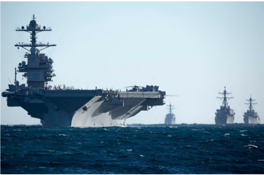
حاملة الطائرات يو إس إس جيرالد آر فورد

الماء إلى قمة الهيكل العلوي. وتعد الحاملة بحجم 4 ملاعب كرة قدم وتصل ارتفاعاً إلى 24 طابقاً تحمل أكثر من 4.500 فرداً من الطاقم و75 طائرة بما في ذلك مقاتلات F/A 18 هورنت F-35. ونكرت مصادر أمريكية أن القيادة المركزية طلبت من البنغاليون 3 مليارات دولار إضافية لدعم عملياتها في المنطقة خلال الأسابيع المقبلة، في مؤشر على أن واشنطن تُحضر لحوادث جديدة من التصعيد، في مؤشر على نية إحقاق خسائر فادحة بالحوثيين. ويشير هذا التحرك العسكري إلى أن المرحلة المقبلة قد تشهد تغييراً جذرياً في قواعد الاشتباك، في ظل إصرار أمريكي على تأمين الممرات البحرية الدولية، مما يبعث برسائل ردع إلى أطراف داعمة للميليشيا الحوثية.