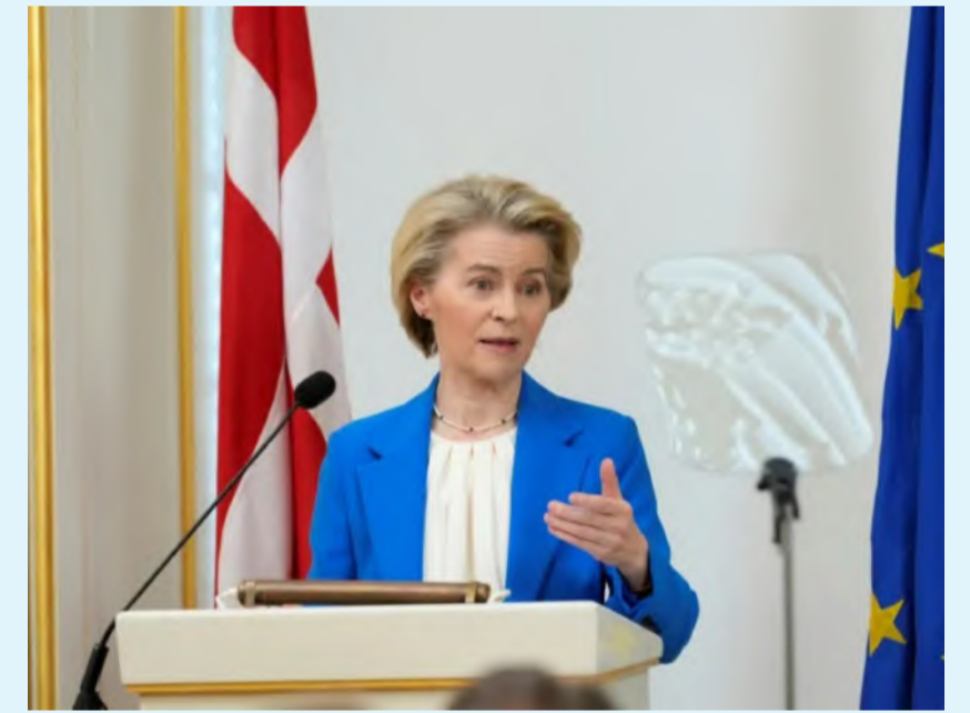
مسؤولة السياسة الخارجية في الاتحاد كايا كالاس