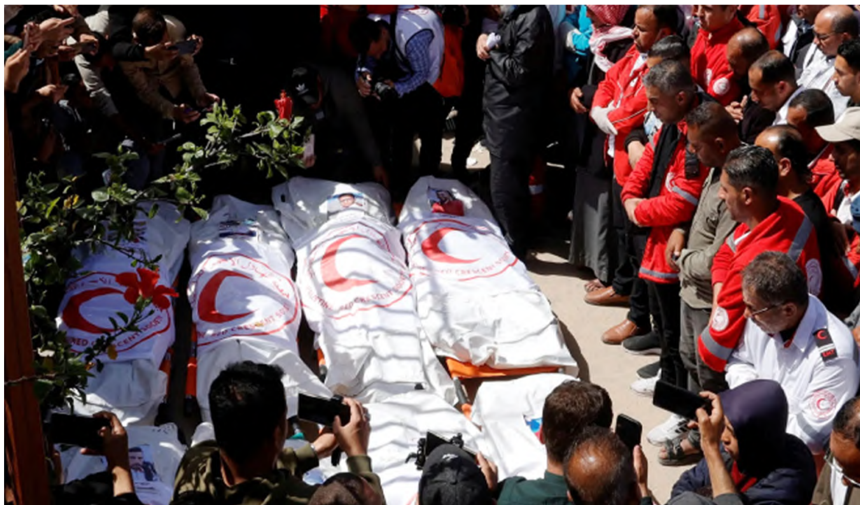
لحظة تشييع عدد من الشهداء الفلسطينيين أمس في غزة