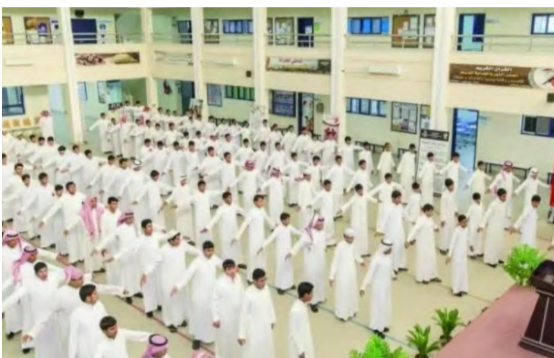
طلاب في إحدى مدارس جدة أثناء طابور صباحي سابق