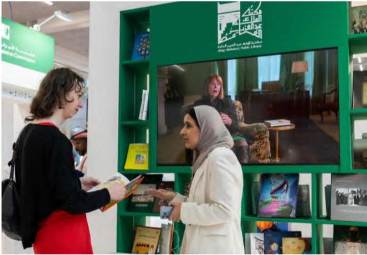
إقبال وتفاعل في جناح المملكة بمعرض الكتاب

قدمت خلال أيام المعرض مجموعة من الفعاليات الثقافية والندوات، التي تناولت المشهد الثقافي السعودي، والنشر والترجمة في المملكة، مشيراً إلى أن الجناح شهد تفاعلاً ملحوظاً من الناشرين والوكالات الأدبية الدولية، مبيّناً أن الهيئة