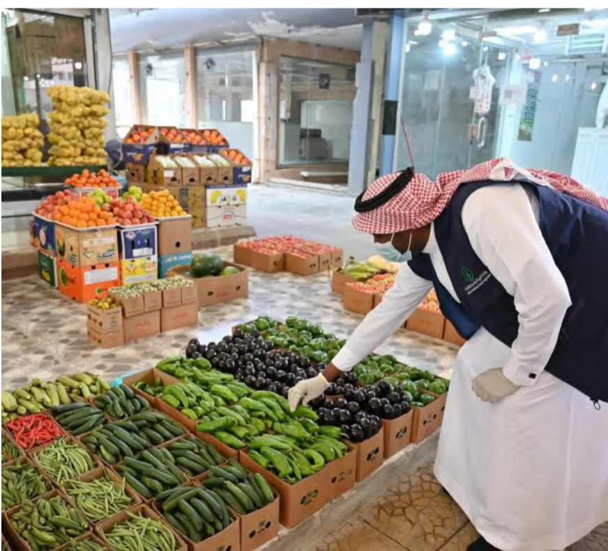
أحد أفراد فرق الرقابة أثناء تفقده سوق خضار في الباحة أمس

نفذ فرع وزارة البيئة والمياه والزراعة بمنطقة الباحة، جولات تفقدية خلال إجازة عيد الفطر، شملت أسواق النفع العام والمسالخ بالمنطقة، وتطبيقهم للاشتراطات الصحية والفنية وسلامة ووفرة المنتجات. وأوضح مدير عام فرع الوزارة بالمنطقة