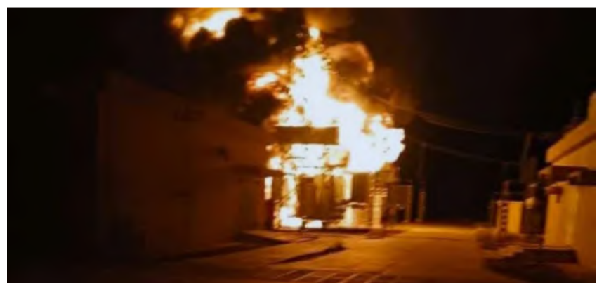
محطة كهرباء سد مروي بالسودان بعد استهدافها أمس

البلاد - الخرطوم فيما يتقدم الجيش السوداني نحو ضاحية الصالحة، ويهدم قوة مليشيا الدعم السريع في أم بدة، في طريقه للسيطرة على مدينة أم درمان، تتخض تهديد القائد الثاني لقوات الدعم السريع، عبد الرحيم دقلو، باجتياح الولاية الشمالية، عن استهداف المليشيا، السبت، محطة كهرباء مروي بطائرات مسيرة، ما أدى إلى انقطاع التيار عن مناطق عدة في الولاية الشمالية. وجاء هذا التقدم الميداني بالتزامن مع تكثيف الجيش السوداني ضرباته الجوية والمدفعية على مواقع الدعم السريع جنوب غربي أم درمان، بعد تصاعد هجمات المليشيا على القرى المحيطة، في محاولة يائسة منها لعرقلة تقدم القوات الحكومية. ويسعى الجيش إلى تطهير الريف الجنوبي للمدينة من فلول المليشيا التي تراجعت من وسط الخرطوم خلال الأسبوع الماضي، متسببة في انتهاكات جسيمة بحق المدنيين، شملت القتل والنهب والاعتقال. ووفقاً لشهود عيان، فإن الجيش يتقدم ببطء باتجاه الصالحة، وسط انهيار معنوي داخل صفوف الدعم السريع، التي تكبّت خسائر متتالية في محلية أم بدة، مما يجعل حسم معركة أم درمان مسألة وقت. في المقابل، وفي تصعيد جديد، استهدفت مليشيا الدعم السريع فجر السبت محطة كهرباء مروي شمال البلاد باستخدام طائرات مسيرة، ما أدى إلى أضرار كبيرة في المحول الرئيسي المزود للولاية الشمالية بالكهرباء، وتسبب في انقطاع واسع للتيار عن عدد كبير من المناطق. وأكد مجلس التنسيق الإعلامي لشركة كهرباء السودان في بيان، أن هذا الهجوم أسفر عن تضرر المحول المغذي للولاية الشمالية بالكامل، محذراً من أن استمرار استهداف المنشآت الحيوية سينعكس سلباً على المواطنين وخدماتهم الأساسية.