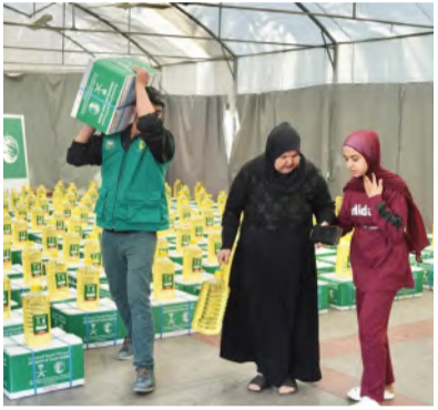
مستفيد من السلال الغذائية في لبنان