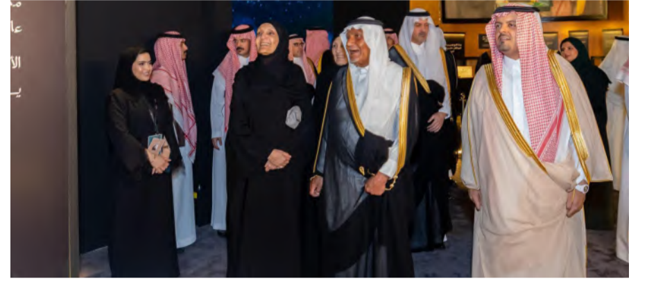
الأمراء يطالعون جوائب المعرض

وجاء انطلاق المعرض تزامناً مع أمسية "ليلة دايم السيف" الغنائية، التي احتضنتها مسرح عبادي الجوهر، بمشاركة عدد من الفنانين العرب، الذين تغنوا بقصائد الأمير خالد الفيصل، في مشهد فني يجسد الحب والتقدير الكبير الذي تحمله الأوساط الثقافية والفنية لشخصه وإبداعه.