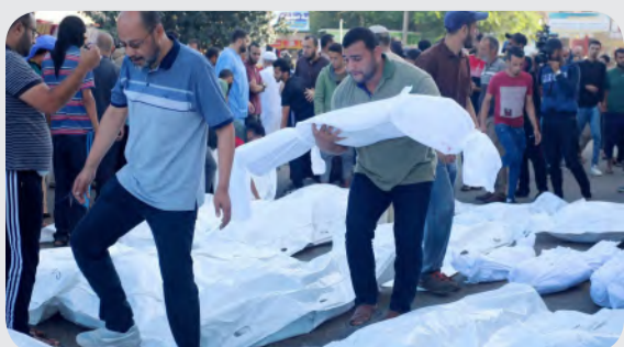
فلسطيني يحمل جثمان طفله الشهيد في غزة

وقالت المؤسسات إن الجرائم التي يرتكبها الاحتلال من قتل متعمد واعتقال وتعذيب وحرمان من الغذاء والدواء والتعليم، تشكل انتهاكاً صارخاً للقانون الدولي الإنساني، وتعد جرائم لا تسقط بالتقادم، مطالبة بمحاكمة قادة الاحتلال كمجرمي حرب، وضمان حماية الأطفال الفلسطينيين.