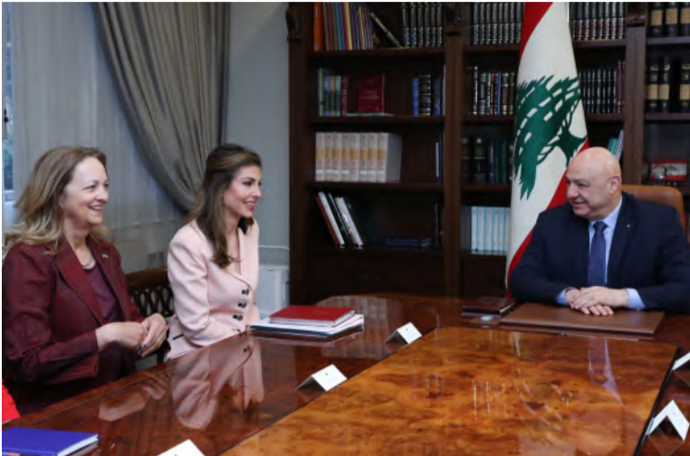
الرئيس اللبناني خلال اجتماعه مع المبعوثة الأمريكية أمس في بيروت

وخلال زيارتها لقائد الجيش اللبناني العماد رولف هيكل، أكدت أورتاغوس دعم واشنطن للجيش ودوره المحوري في حفظ الأمن، خصوصاً في الجنوب، مشيدة بالإجراءات التي اتخذتها في مطار رفيق الحريري الدولي لتعزيز الشفافية والرقابة ومنع نقل الأموال بطرق غير شرعية لتمويل الجماعات غير الخاضعة لسيطرة الدولة، في إشارة إلى ضبط أموال مرسله إلى حزب الله. وهذه هي الزيارة الثالثة للمبعوثة الأمريكية