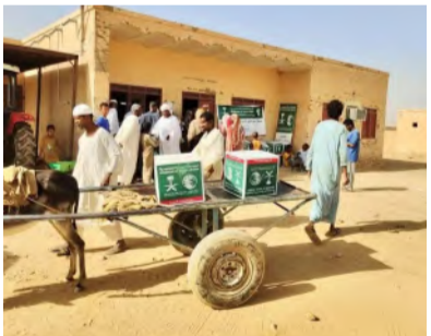
مستفيد آخر تسلّم سلة في مدينة عطبرة السودانية

يأتي ذلك في إطار المشروعات الإنسانية والإغاثية، التي تقدمها المملكة عبر ذراعها الإنساني مركز الملك سلمان للإغاثة للاجئين والفئات الأكثر احتياجاً في لبنان والسودان. وواصل المركز تنفيذ مشروع الإمداد المائي والإصحاح البيئي في مديرية الخوخة بمحافظة الحديدة، وضخ خلال شهر فبراير 2025م، 3,518,000 لتر من المياه الصالحة للاستخدام المنزلي، و448,000 لتر من المياه الصالحة للخزانات، وتنفيذ 104 نقلات لإزالة المخلفات من مخيمات النازحين، وإجراء 59 عملية تجفيف مياه الصرف الصحي، إضافة إلى صيانة 16 حماماً متنقلاً، وتنفيذ حملتين للنظافة المجتمعية، وإجراء عملية واحدة لفحص جودة المياه، فيما نفذت 81 حملة لمكافحة نواقل الأمراض، وصيانة 6 قواعد للخزانات، استفاد من تلك الخدمات 124,006 أفراد.