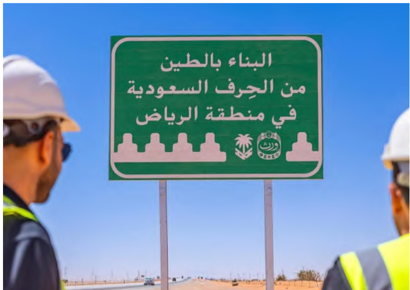
عاملان يشرفان على تركيب إحدى لوحات "ورث السعودية"

البلاد - الرياض أطلقت الهيئة العامة للطرق والمعهد الملكي للفنون التقليدية "ورث" مبادرة "ورث السعودية"، تتضمن لوحات تعريفية على الطرق السريعة بمختلف مناطق المملكة، للتعريف بالحرف الوطني الأصيلة، وإبرازها ضمن سياق ثقافي بصري معاصر. وتأتي هذه المبادرة التوعوية، بالتزامن مع "عام الحرف اليدوية"، حيث بدأت المرحلة الأولى على 3 طرق رئيسية؛ تتمثل في طريق "الرياض- الدمام" وطريق الهجرة "مكة المكرمة - المدينة المنورة"، وطريق الرياض القصيم، على أن تشمل بقية المراحل المستقبلية عدداً من الطرق الحيوية. وتستعرض مبادرة "ورث السعودية" الفنون التقليدية لكل منطقة، قبل وصول المسافر إليها، مثل: حرفة صناعة الأبواب