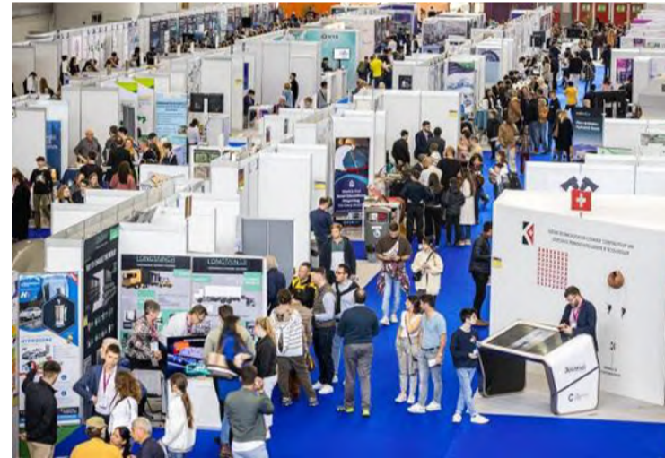
حضور مميز للمخترعين السعوديين في المعرض

للتنافس عالمياً، منوهاً بإمكانة هذا المعرض؛ كأحد أهم وأكبر المعارض الدولية في مجال الاختراع والابتكار.