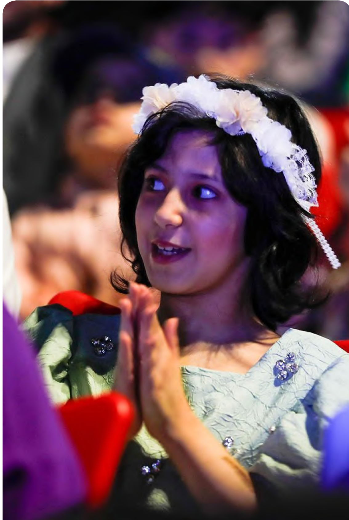
طفلة تشارك في إحدى الفعاليات الترفيهية بالطائف خلال عطلة عيد الفطر المبارك