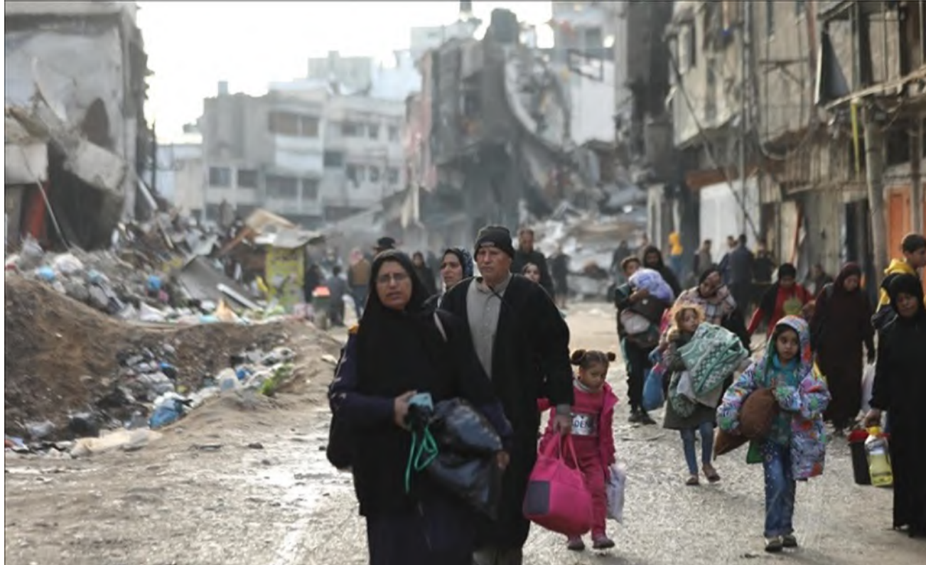
فلسطينيون وسط الدمار الهائل في غزة

مفاوضات في الدوحة أو القاهرة إذا كانت هناك تطورات في المفاوضات بشأن صفقة غزة، خاصة حال موافقة "حماس" على الإفراج عن أكثر من 5 محتجزين أحياء. وسط هذا التصعيد الدامي، يشهد قطاع غزة تدهوراً تاماً في الوضع الإنساني والمعيشي والصحي، حيث يتزامن القصف والنزوح مع فرض الاحتلال حصاراً مطبقاً عليه، متجاهلاً كل الاعتبارات القانونية والأخلاقية.