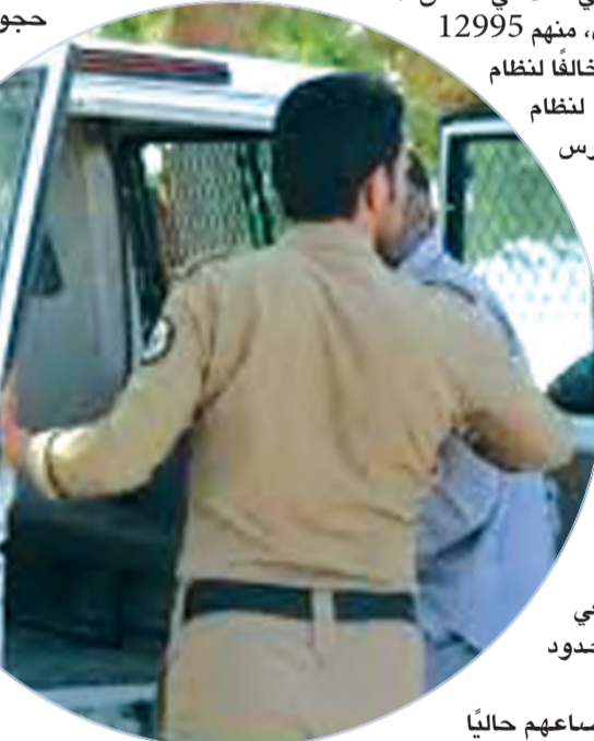
فيما بلغ إجمالي من يتم إخضاعهم حالياً

وأكدت وزارة الداخلية أن كل من يسهل دخول مخالفي نظام أمن الحدود للمملكة أو نقلهم داخلها أو يوفر لهم المأوى أو يقدم لهم أي مساعدة أو خدمة بأي شكل من الأشكال، يعرض نفسه لعقوبات تصل إلى السجن مدة 15 سنة، وغرامة مالية تصل إلى مليون ريال، ومصادرة وسيطة النقل والسكن المستخدم للإيواء، إضافة إلى التشهير به، وأوضح أن هذه الجريمة تعد من الجرائم الكبيرة الموجبة للتوقيف، والمخلة بالشرف والأمانة، حاتمة على الإبلاغ عن أي حالات مخالفة على الرقم 911 بمناطق مكة المكرمة والرياض والشرقية، و999 و996 في بقية مناطق المملكة.