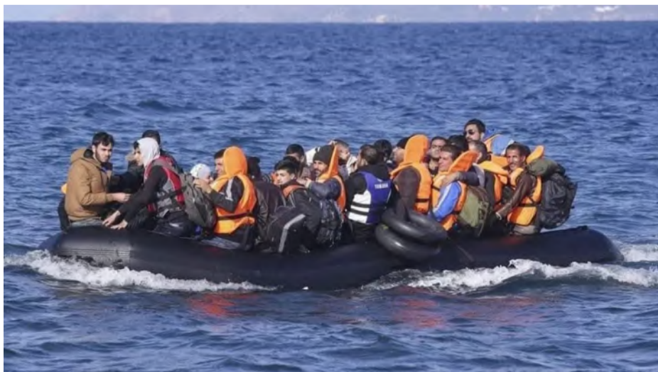
مهاجرون غير شرعيين يستقلون قارباً في المياه الإقليمية

في دول مختلفة، معظمهم في دول الجوار نحو رُب سكان الشعب السوري مشتتين ويواجهون مصيراً غامضاً.