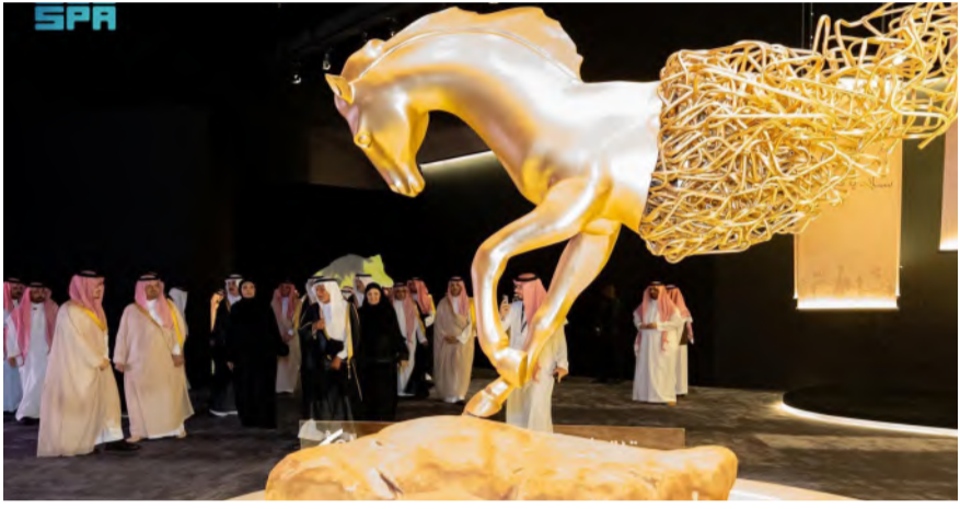
إبداع الثقافة والوطن الأصيلة