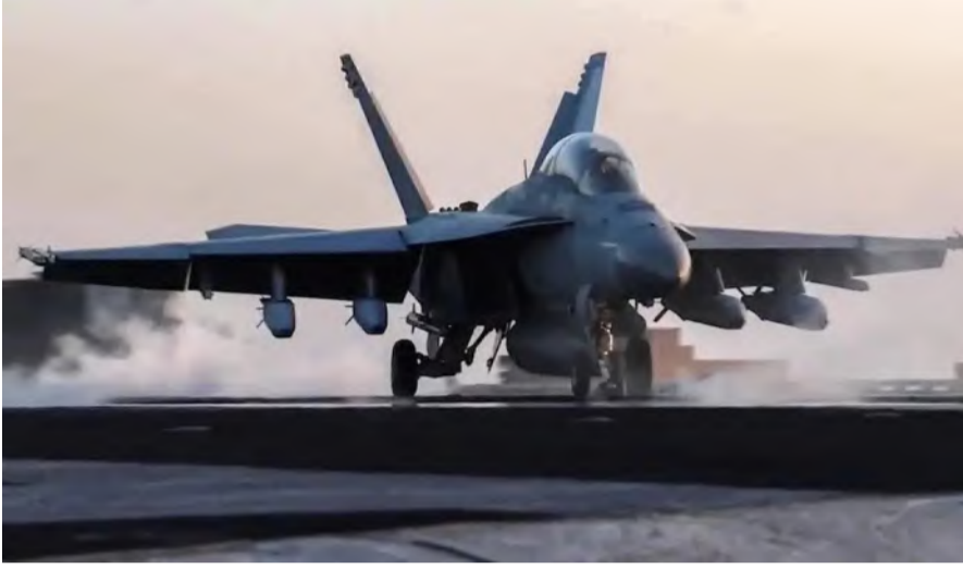
مقاتلة أمريكية تقنع من حاملة طائرات

وتزايدت المخاوف من أن استمرار هجمات الحوثيين على السفن في البحر الأحمر وخليج عدن يؤدي إلى خسائر فادحة للتجارة العالمية، إذ تُقدر الخسائر الناجمة عن هذه الهجمات بأضرار اقتصادية جسيمة، ما دفع العديد من شركات الشحن إلى البحث عن طرق بديلة رغم التكاليف الإضافية الباهظة. وفي ظل هذه المعطيات، تؤكد الولايات المتحدة على ضرورة تقييد نشاط الحوثيين وتدمير قدراتهم العسكرية لضمان استقرار الممرات البحرية ومنع أي تهديد محتمل للتجارة الدولية.