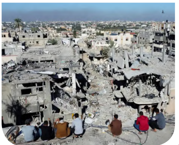
فلسطينيون وسط الركام في غزة

من جانبه، استعرض د. خالد عبد الغفار الخدمات الصحية التي قدمتها مصر لأكثر من ١٠٧ ألف مواطن فلسطيني عبروا إليها منذ بداية الحرب، كما تطرق لتفاصيل المقترح المصري لإعادة بناء وتعزيز القطاع الصحي بالقطاع، لرفع كفاءته والاستجابة للاحتياجات الصحية الأساسية، مستعرضاً التكاليف المتوقعة للمشروعات المقترحة.