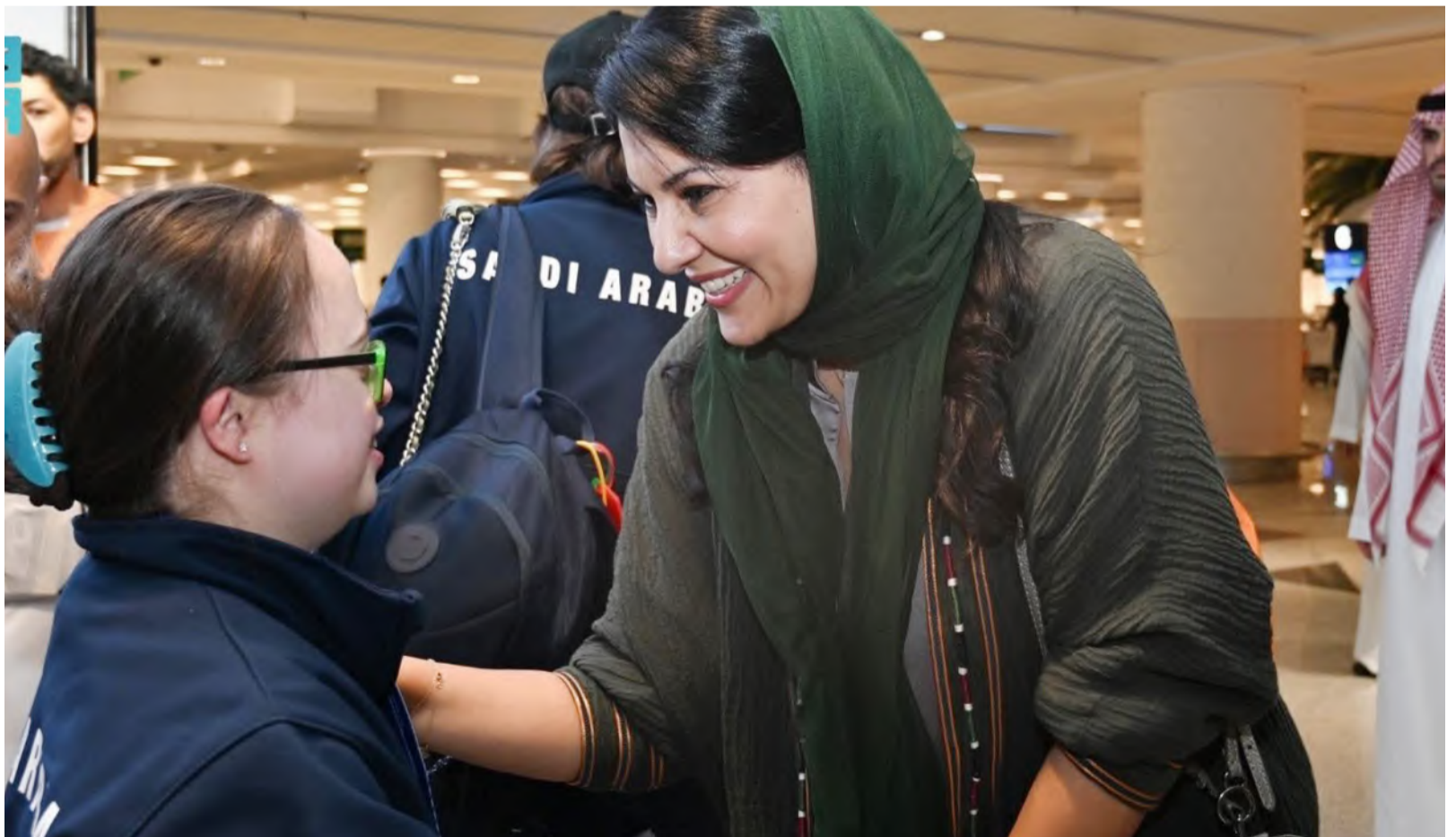
الأميرة ريماء بنت بندر مستقبلة وفد الأولمبياد السعودي الخاص بعد مشاركته في الألعاب العالمية الشتوية لدى وصوله مطار الملك عبدالعزيز في جدة أمس.

البلاد - الرياض أكدت الإدارة العامة للمرور انتهاء مهلة تمديد تخفيض قيمة غرامات المخالفات المرورية المترابطة يوم 18 أبريل المقبل. ودعت المواطنين والمقيمين إلى الاستفادة من الفترة المتبقية من مهلة التمديد؛ للاستفادة من إعفاء 50% من قيمة الغرامة للمخالفات المرورية المسجلة قبل تاريخ 18 / 4 / 2024م. وأوضح المرور السعودي أنه عند انتهاء المهلة ستعود المخالفات إلى قيمتها الأساسية قبل التخفيض، ويمكن للمخالف المتعثر عن السداد، سداد الغرامات دفعة واحدة أو سداد غرامة كل مخالفة على حدة، مؤكداً أن الالتزام بأنظمة وتعليمات السير أساس المحافظة على السلامة المرورية.