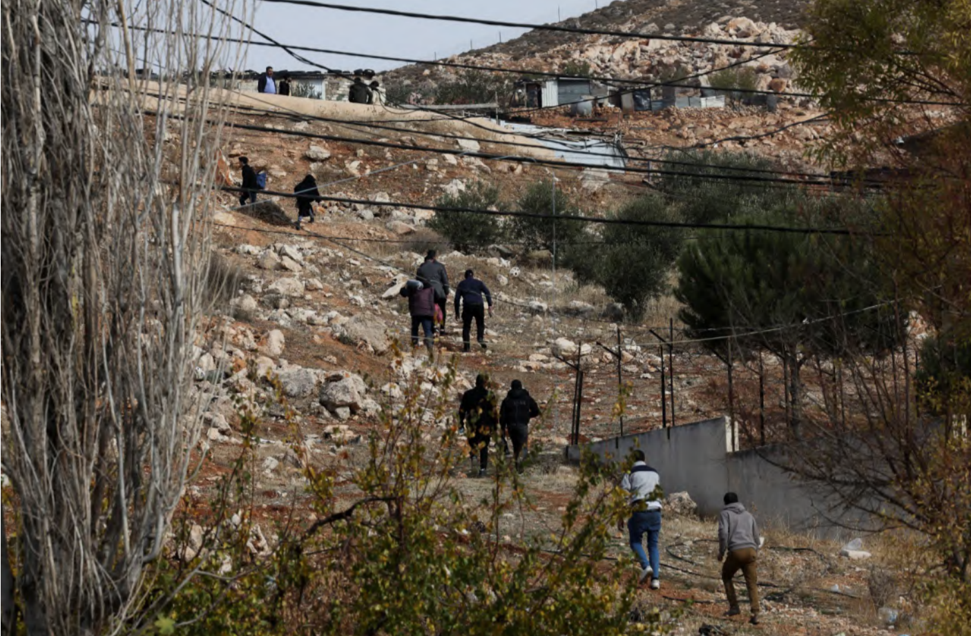
اشتباكات على الحدود السورية - اللبنانية