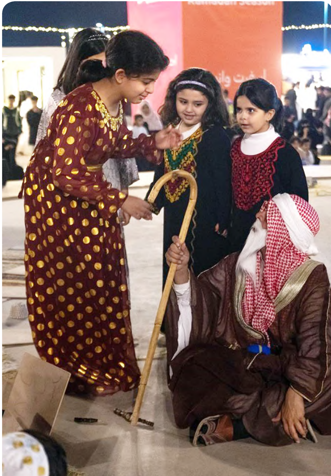
فتيات يتجمعن حول "الحكاوي" في "ركن الراوي" ضمن فعالية "قمره" في عرعر.

وسعت السلطات القضائية الألمانية لائحة الاتهام ضد ممرض ألماني - 44 عاماً - ارتكب 9 جرائم، و34 محاولة قتل عن طريق إعطاء ضحاياه جرعات زائدة من مسكنات الألم، أو المهدئات بعيداً عن ألمانيا؛ لقضاء نوبات عمل هائلة بدون إزعاج المرضى. وكشفت متحدثة باسم المحكمة الإقليمية في مدينة أخن الألمانية، أن الادعاء العام تقدم بلائحة اتهام تكملية للاشتباه في أن الممرض قتل أربعة مرضى آخرين؛ ليصبح العدد 13 مريضاً آخرين، وحاول القيام بذلك في تسع حالات أخرى؛ ليصل العدد إلى 43، في غضون بضعة أشهر. وبحسب بيانات لائحة الاتهام، فإن جميع هذه الجرائم ارتكبت بين ديسمبر 2023، ومايو 2024. ومن المقرر أن تبدأ محاكمة الرجل في 24 مارس الجاري بـ 30 تهمة.