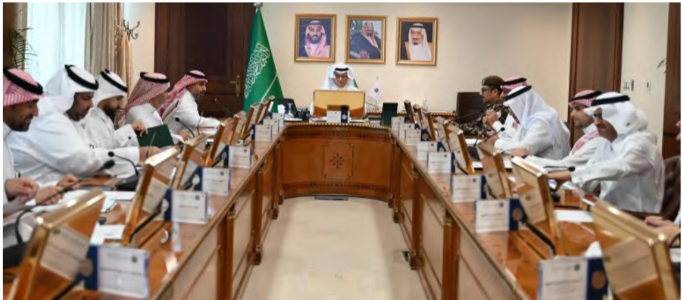
وزير البيئة لدى ترؤسه اجتماع "وقاء" أمس

اللجنة الإشرافية لمكافحة مقاومة مضادات الميكروبات لعام 2024م، وجهود إكحام الرقابة في مجال متبقيات المبيدات الزراعية، والخطة التنفيذية لتخفيض نسبة (الناقص) بمشاريع الدواجن بالمملكة، وتم الإحاطة برحلة تطوير نماذج الأعمال للصحة النباتية والحيوانية، وسجل الأحداث والاندلاعات والفورات، وشركات الأعمال بين مركز وقاء ووكالة الوزارة لخدمة المستفيدين وشؤون الفروع. يذكر أن هذا الاجتماع ينعقد بشكل ربع سنوي لمتابعة سير أعمال المركز؛ وفقاً للخطة الإستراتيجية المبينة على رؤية المملكة 2030.