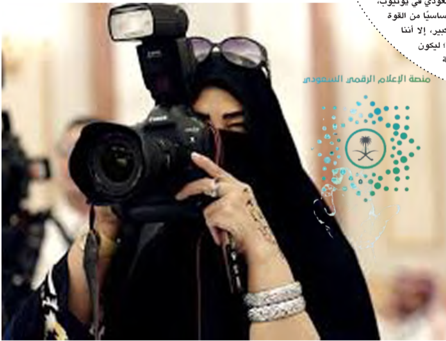
صناعة الإعلام الرقمي السعودي

أكد وزير الإعلام صحة ما نشرته صحيفة Financial Times عن نيّة المملكة إطلاق شبكة إخبارية بالغة الإنجليزية، مبيّنًا أن وجود قناة سعودية ناطقة بالإنجليزية أمر طبيعي وحتمي، وليس مجرد خيار، وذلك لنقل صوت المملكة إلى العالم بلغته. وتكثف الدوسري أن العمل يجري أيضًا على إطلاق مدينة إنتاج عالمية، بالتعاون مع عدد من الوزارات والهيئات؛ بهدف استقطاب الشركات العالمية والشركات الناشئة، وفتح المجال للكفاءات السعودية في المجال الإعلامي، مؤكدًا أن المشرع يمثل نقلة نوعية في تطوير صناعة الإعلام في المملكة، وسيتم الإعلان عن تفاصيله الكاملة لاحقًا.