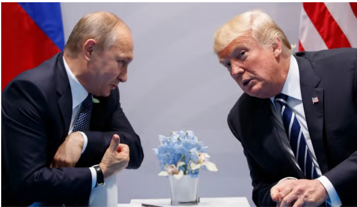
لقاء سابق بين ترامب وبوتين

الولايات المتحدة تحاول إيجاد حل وسط يرضي الطرفين، حيث يسعى ترامب، إلى استخدام مفاوضاته لخلق مناخ دبلوماسي يسمح بالتوصل إلى اتفاق شامل. وفي ظل تبادل الضربات الجوية والصاروخية المكثفة بين روسيا وأوكرانيا خلال الأيام الماضية، تُعتبر مبادرات الاتصال المباشر بين ترامب وبوتين خطوة مهمة لكسر دوامة العنف بين الطرفين وإعادة رسم خريطة العلاقات في المنطقة. ومن جهة أخرى، يبدي حلفاء أوكرانيا اهتمامهم بمبادرات السلام، إذ أعلنت بريطانيا وفرنسا عن استعدادهما لإرسال قوة حفظ سلام لمراقبة تنفيذ وقف إطلاق النار، فيما أبدى رئيس