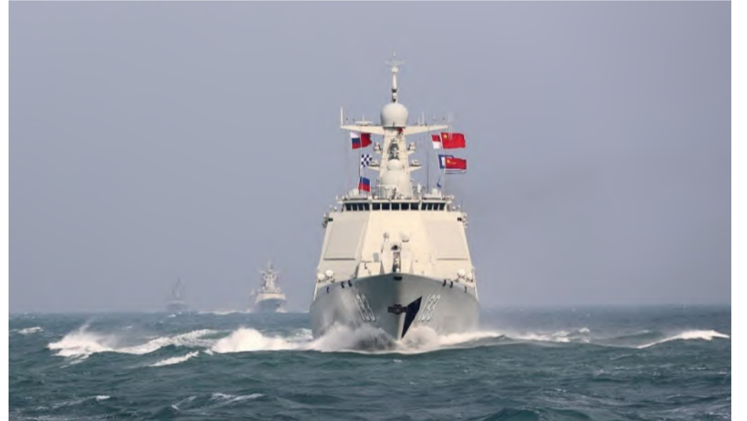
سفينة حربية صينية في مناورات بحرية

على المدى القريب، قد تستمر المناورات العسكرية وإجراءات الرد، مما يزيد من احتمالية حدوث مواقف تصعيدية خطيرة. وفي الوقت ذاته، يُحث الطرفان المجتمع الدولي على لعب دور الوسيط للحد من تفاقم الأزمة. تبقى الأمال معلقة على إيجاد حل سياسي يضمن تسوية الخلافات عبر الحوار والتفاوض، بعيداً عن المواجهات العسكرية التي قد تؤدي إلى تداعيات إقليمية وعالمية واسعة.