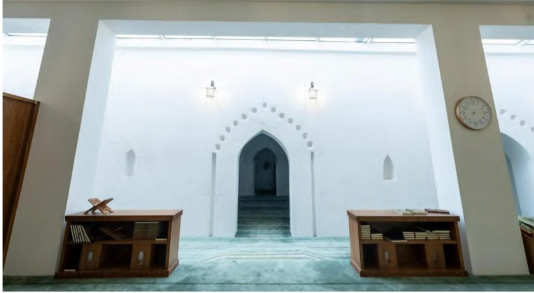
مسجد العباسية يعود تاريخ إنشائه إلى عام 1262هـ

المسجد التاريخية للعبادة والصلاة، واستعادة الأصالة العمرانية للمسجد التاريخية، وإبراز البعد الحضاري للمملكة العربية السعودية، وتعزيز المكانة الدينية والثقافية للمسجد التاريخي، ويسهم في إبراز البعد الثقافي والحضاري للمملكة، الذي تركز عليه رؤية 2030 عبر المحافظة على الخصائص العمرانية الأصيلة، والاستفادة منها في تطوير تصميم المساجد الحديثة.