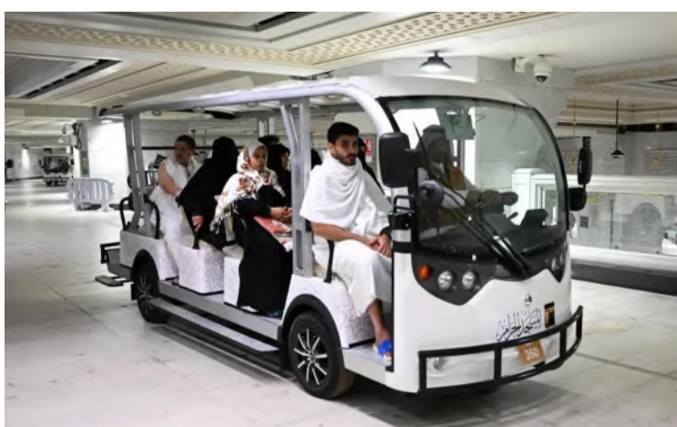
معمرون مستفيدون من خدمة التنقل بالحرم المكي

المدفوعة، التي استفاد منها 86.399 مستخدماً، في حين سجلت العربات الكهربائية "الجولف" 421.144 مستفيداً، واستفاد 15.091 من العربات اليدوية المجانية، ما يعكس حجم التحديتات التي شهدتها خدمة التنقل داخل المسجد الحرام. وتواصل الهيئة جهودها في تعزيز تجربة ضيوف الرحمن من خلال حلول ذكية ومتطورة، تضمن لهم أداء مناسكهم بسهولة ويسر؛ وفق أعلى معايير الجودة والراحة، تحقيقاً لتوجيهات القيادة الرشيدة- أيدها الله- في تقديم خدمات استثنائية لزوار الحرمين الشريفين.