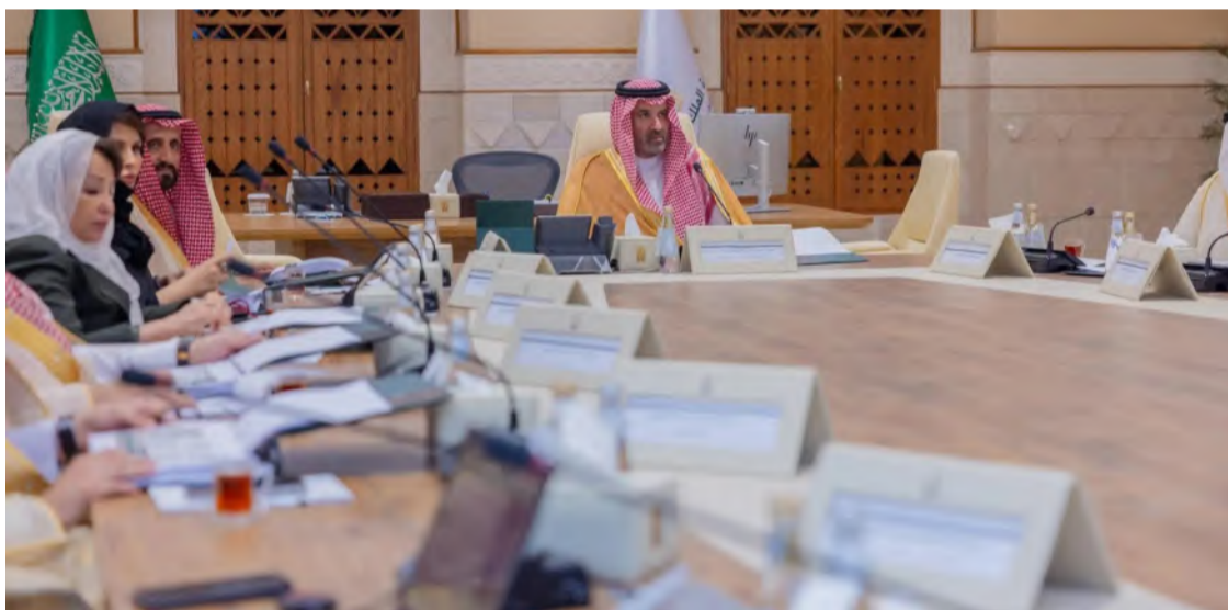
الأمر فيصل بن سلمان مترئساً اجتماع مجلس الدارة