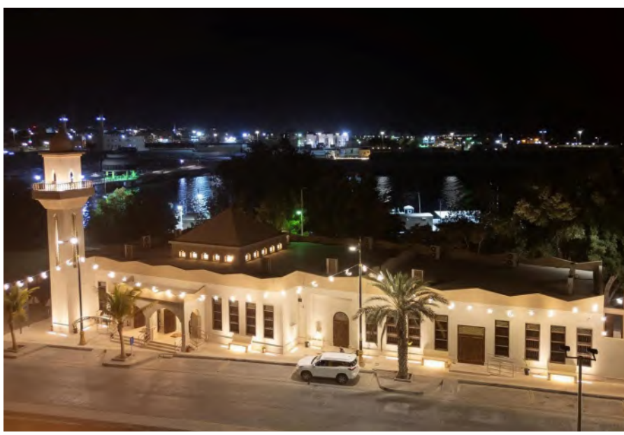
مسجد الجامع في مدينة ضباء ضمن مشروع تطوير المساجد التاريخية

ويعمل مشروع الأمير محمد بن سلمان لتطوير المساجد التاريخية، على تحقيق التوازن بين معايير البناء القديمة والحديثة بطريقة تمنح مكونات المساجد درجة مناسبة من الاستدامة، وتدمج تأثيرات التطوير بمجموعة من الخصائص التراثية والتاريخية، في حين يجري عملية تطويرها من قبل شركات سعودية متخصصة في المباني التراثية، ونوات خبرة في مجالها. ويأتي مسجد الجامع ضمن مشروع الأمير محمد بن سلمان لتطوير المساجد التاريخية في مرحلته