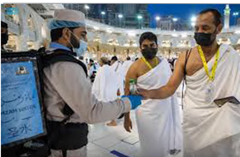
استعداد على مدار الساعة لتنفيذ خطة شركة المياه خلال الشهر الفضيل