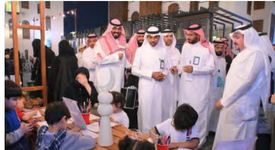
مساعدة شؤون التعليم متجولاً في أرجاء الفعالية