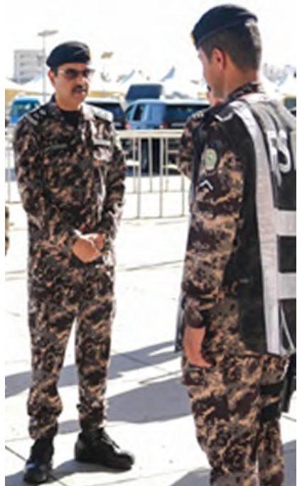
اللواء المغيصيب متفقدًا أحد المواقع الحيوية في مكة أمس