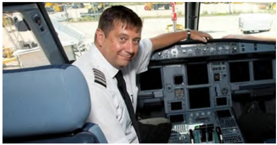
فتاتان أثناء احتفال أهالي محافظة العقيق في الباحة بشهر رمضان بأحد الديوت التراثية.

أوقفت شركة طيران "إيزي جت - EasyJet" البريطانية، طياراً عن العمل، بعد أن كاد يتسبب في حادثة خطيرة في فبراير الماضي فوق الأجواء المصرية. حيث تم إيقاف الطيار بول السورث؛ بعد أن اقتربت الطائرة التي كان يقودها من قمة جبل أثناء رحلة طيران. وكان للسورث مسؤول عن قيادة رحلة تابعة لشركة "إيزي جت"، التي كانت متجهة من مطار مانشستر إلى مطار الغردقة في مصر الشهر الماضي. وعند هبوط الطائرة من نوع "Airbus A320" تم تفعيل جهاز التحذير من قرب الأرض (GPWS)، وهو نظام أمان؛ يُطلق تحذيرات في حال كانت الطائرة في خطر الاصطدام بالتضاريس. اضطر الكابتن إلى رفع الطائرة؛ لتفادي الاصطدام بأحد جبال البحر الأحمر شرقي مصر، قبل أن تهبط بأمان. في اليوم التالي للحادثة، أبلغ السورث عن الواقعة إلى المسؤولين في الشركة، وتم اتخاذ قرار بمنعه من قيادة الطائرة مجدداً. وعلى الرغم من أنه كان من المقرر أن يقود الطائرة نفسها في رحلة العودة، إلا أنه تم نقله كراكب بدلاً من ذلك.