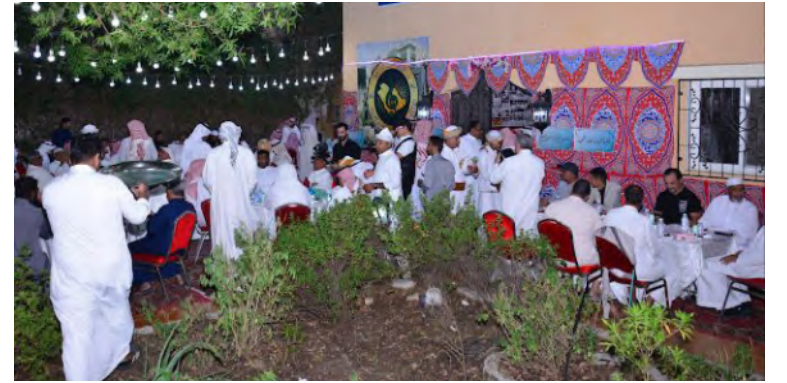
جانب من الإفطار السنوي للفرقة