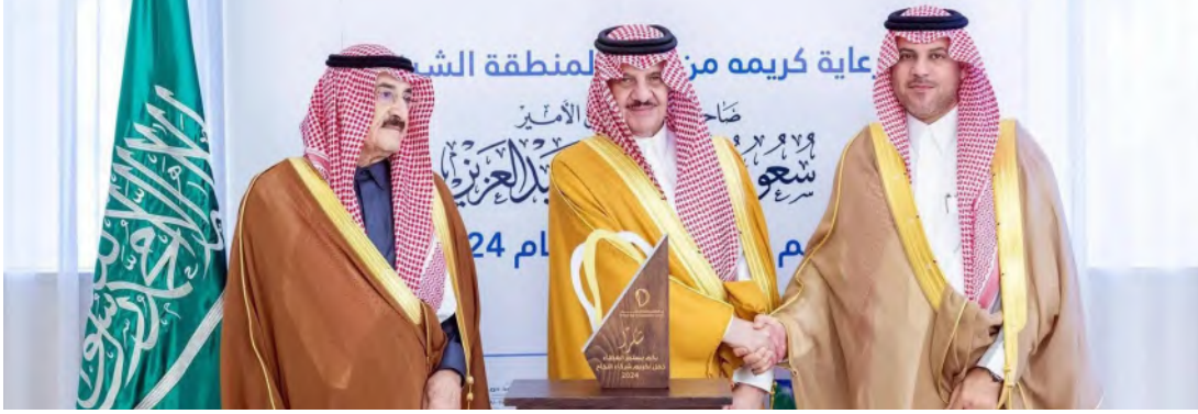
الأمير سعود بن نايف خلال تكريمه الداعمين لمركز التأهيل

وأضاف، أن المركز يواصل مسيرته بخطة تشغيلية طموحة تتضمن 12 هدفاً إستراتيجياً، و 27 مؤشر أداء؛ بهدف رفع جودة الخدمات، وتعزيز الشراكات مع مختلف القطاعات، وحوكمة العمليات، والاستثمار في رأس المال البشري؛ تحقيقاً للاستدامة. وفي ختام الحفل، كرم سمو أمير المنطقة الشرقية شركاء نجاح مركز الأمير نايف للتأهيل؛ تقديراً لدورهم في دعم المركز.