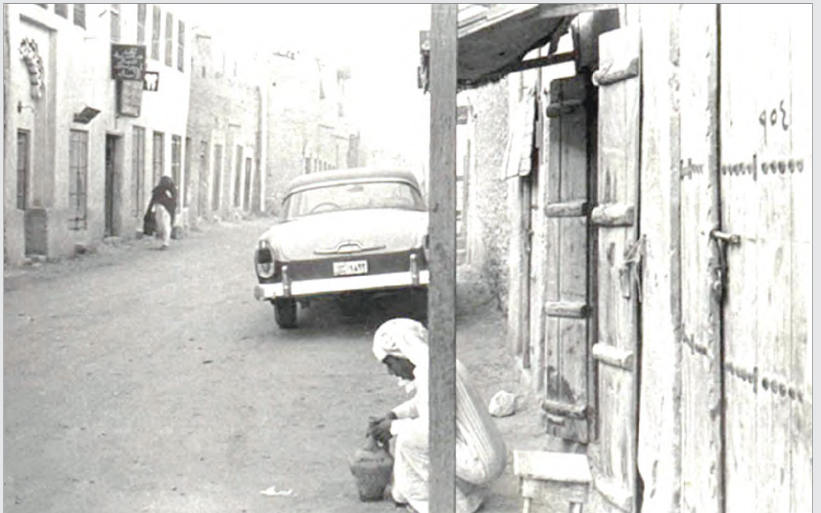
من مدينة الاحساء