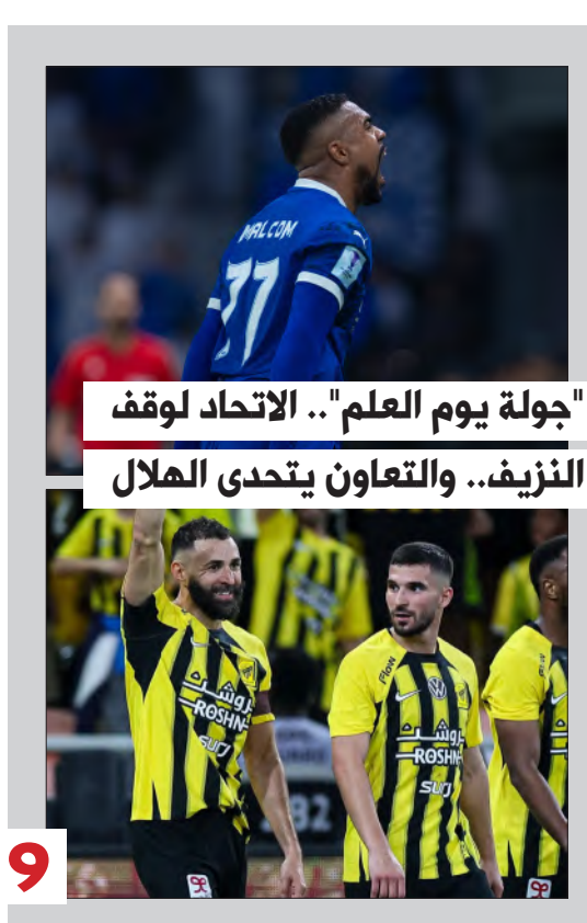
"جولة يوم العلم" .. الاتحاد لوقف النزيف.. والتعاون يتحدى الهلال