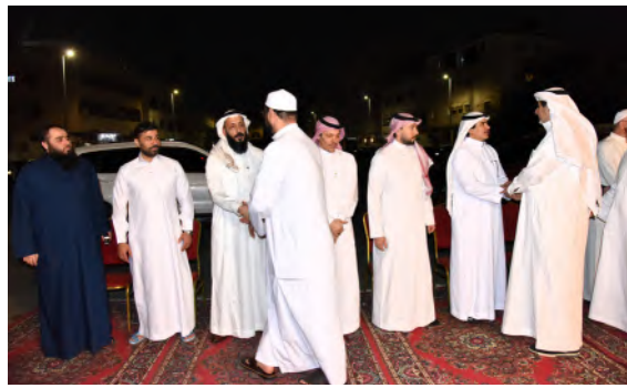
آل خوجه يتلقون العزاء في اليوم الثالث