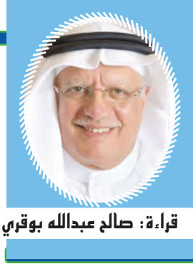
قراءة: صالح عبدالله بوقري

رواح.. ذلك الصمت يوغل في إحساسك حتى يلامس منك العصب فتعتريك رعشة ويلوح في ذاتك بارق الهيبة والصفاء.