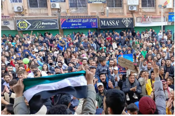
احتفالات سابقة في السويداء بعد رحيل الأسد