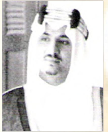
سلطان بن عبدالعزيز