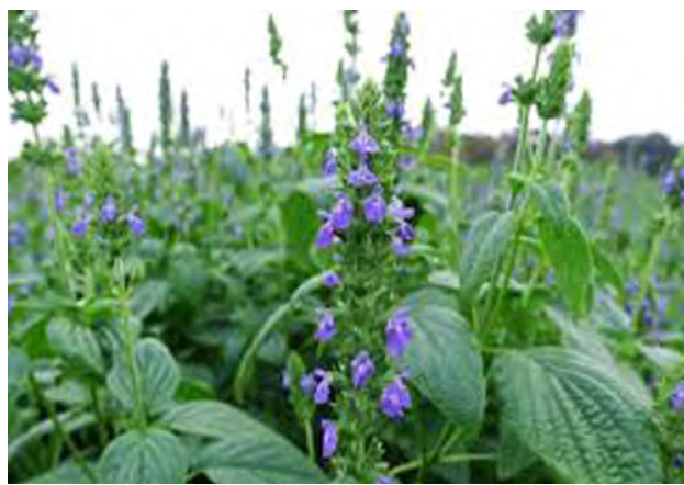
نبات الشيا لا يحتاج لمياه كثيرة

المملكة، حيث ينمو في المناطق ذات الطقس الدافئ في درجات حرارة تتراوح بين (15-30) درجة مئوية، مؤكدة أن نجاح زراعتها في المملكة؛ يأتي ضمن خططها لتنوع المحاصيل الزراعية وتحقيق استدامتها، ما أثبتت التجارب الميدانية نجاح توطينها في محافظة الطائف بمنطقة مكة المكرمة على مساحة يتراوح طولها (100) متر مربع، وتبلغ عرضها (70) متراً مربعاً؛ لي مهد الطريق نحو التوسع في توطين زراعتها وزيادة إنتاجها محلياً.