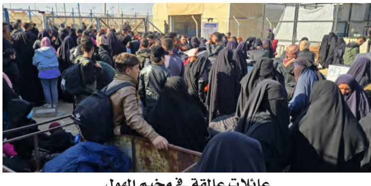
عائلات عاتقة في مخيم الهول

من قرارات تجسيم أو وقف الدعم، لأن ذلك سيسفر عن كارثة إنسانية، موضحاً أن الإدارة الذاتية ليس لديها موارد كافية لتوفير الخدمات والحراسة بالبحرين. وفي شأن آخر، وفيما تتر العالقات العراقية السورية بمرحلة جس النبض بعد سقوط نظام الأسد، يحاول البلدان إنهاء أي ادعاءات لواقعة تعرض عمال سوريين لانتهاكات في العراق، إذ وجه رئيس الحكومة العراقية، محمد شياع السوداني، الأربعاء، بتشكيل فريق أمني مختص لملاحقة مرتكبي اعتداءات مؤثمة ضد عمال سوريين في العراق.