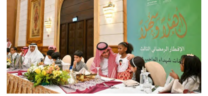
حنو أبوي من سموه على أبناء شهداء الواجب