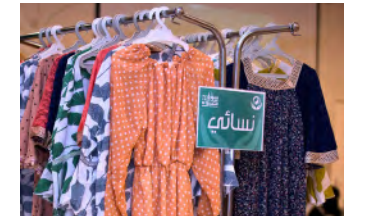
جانب من معروضات السوق الخيري

أقامت «كسوة» السوق الخيري الخامس على التوالي خلال شهر رمضان المبارك، في مبادرة تهدف إلى إدخال الفرح والسرور على الأسر المتعضة، وتمكينها من التسوق مجاناً بما يعكس القيم النبيلة لهذا الشهر الفضيل، حيث يتجلى التكافل الاجتماعي في أسس صورته، ويشعر الجميع بروح المحبة والتعاون. ويأتي تنظيم السوق ضمن جهود كسوة المسترة لنشر الخير، وتعزيز مفهوم التبرع بأسلوب مبتكر يضمن احترام وكرامة المستفيدين، خاصة خلال رمضان، شهر الرحمة والبركة. كما يحمل السوق الخيري بجلته الجديدة هذا العام، لسة متجددة، حيث تم تجهيز كافة الأقسام لتلبية احتياجات الأسر المتعضة بشكل متكامل، بدءاً من الملابس