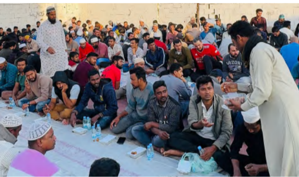
صائمون يتناولون الإفطار في مخيم شبيرق بأملج

يقيم مخيم البطحاء بأملج إفطاراً للصائمين، وهو مستمر منذ أكثر من 15 سنة، ويتوسط هذا المخيم محافظة أملج، في حي البطحاء وعلى مقربة من تجمع العمالة في