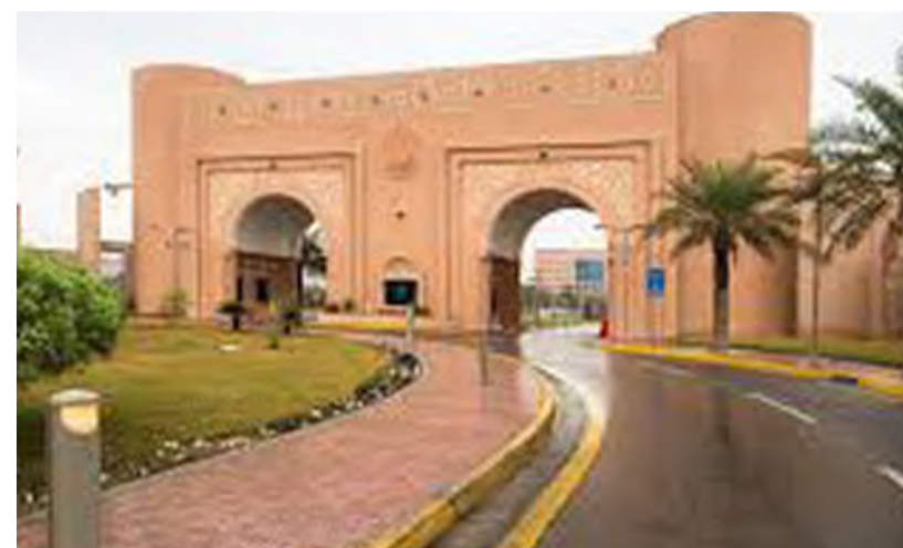
جامعة الملك فيصل ضمن أفضل الجامعات في العالم

نشرت منظمة الأكاديمية الوطنية للمخترعين National Academy of Inventors في الولايات المتحدة الأمريكية قائمة أفضل 100 جامعة في جميع أنحاء العالم لعام 2024م، حيث تصدرت الجامعات السعودية الترتيب العالمي. وتركز المنظم من خلال تصنيفها على الدور الحيوي الذي تلعبه براءات الاختراع في ترجمة البحوث والابتكارات الجامعية إلى منتجات تسهم في تعزيز الابتكارات في التنمية الشاملة والمستدامة، بالإضافة إلى الدور المهم الذي تلعبه المؤسسات الأكاديمية في منظومة البحث والابتكار، وتضم القائمة جامعات عالمية مرموقة، ومؤسسات حكومية وغير حكومية. وسجلت الجامعات السعودية تقدماً ملحوظاً في