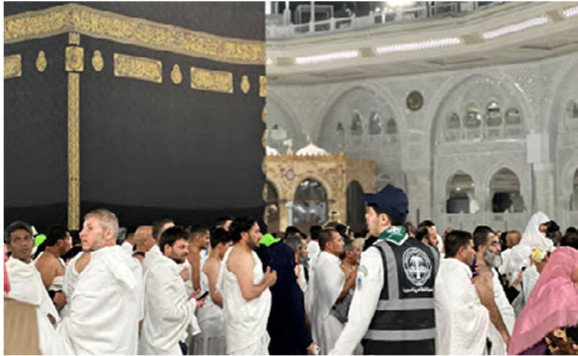
معتمرون يؤدون النسك أمس

وزعت وزارة الشؤون الإسلامية والدعوة والإرشاد، ممثلة بفرعها في منطقة مكة المكرمة، أكثر من 29 ألف نسخة من المصحف الشريف من إصدارات مجمع الملك فهد لطباعة المصحف الشريف بمختلف الأحجام والترجمات، عبر مكتب أعمال الوزارة بمطار الملك عبدالعزيز الدولي بجدة، وذلك في إطار جهودها المستمرة لخدمة ضيوف الرحمن وتوفير نسخ من كتاب الله الكريم للمعتمرين القادمين من مختلف أنحاء العالم. وعيّن المعتمرون عن سعادتهم بوصولهم إلى المملكة، مشيدين