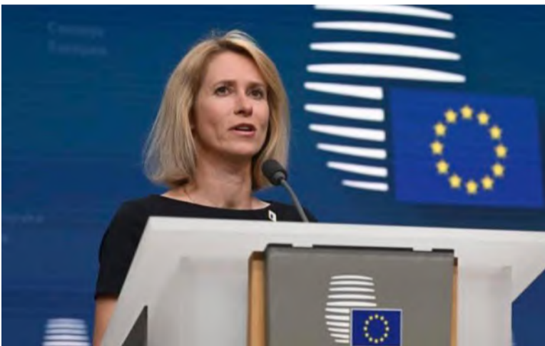
كيا كالاس الممثلة العليا للسياسة الأمنية والدفاعية في الاتحاد الأوروبي

وكانت الدول الكبرى في أوروبا قد رحبت بالخطة العربية لإعمار غزة، إذ اعتبرت ألمانيا وفرنسا وبريطانيا وإيطاليا، السبت في بيان مشترك، أنها توفر "مسارًا واقعيًا لإعادة إعمار القطاع". وجاء في البيان أنه "في حال تنفيذها" فإن هذه الخطة تعد "بتحسن سريع ودائم في الظروف المعيشية الكارثية للفلسطينيين الذين يعيشون في غزة" جراء الحرب بين إسرائيل وحماس. وتؤكد الخطة على إعادة إعمار غزة دون تهجير الفلسطينيين من ديارهم ووطنهم.