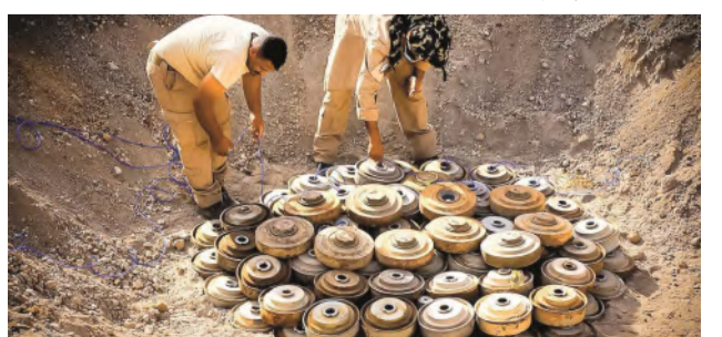
كمية من الألغام المستخرجة ضمن برنامج مسام في اليمن

تضمنًا من الألغام على مستوى اليمن. وتعد محافظة مأرب، التي توصف بـ "قلعة الصمود" اليمنية، مسرحًا لمعارك عنيفة منذ سنوات، مما جعلها منطقة ملوثة بألاف الألغام التي تسببت بمقتل وإصابة مئات المدنيين، بينهم أطفال ونساء، ووفقًا لإحصائيات رسمية، فإن أكثر من 30% من الضحايا في المحافظة سقطوا بسبب الألغام خلال العامين الماضيين، بينما لا تزال عشرات القرى والمزارع مهجورة بسبب هذه التهديدات. ورأى خبراء دوليون أن جهود "مسام" تمثل "شريان أمل" للمدنيين في اليمن، لكنهم حذروا من أن استمرار زراعة الحوثيين للألغام يعرقل جهود الإغاثة وإعادة الإعمار، وطلبوا بضرورة تكثيف الدعم الدولي للمشروعات الإنسانية، خاصة تلك المتعلقة بنزع الألغام، لتجنب كوارث إنسانية طويلة الأمد.