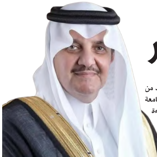
الأمير سعود بن نايف

المركز الأول عالمياً بـ 631 براءة اختراع، متقدمة على العديد من الجامعات والمؤسسات البحثية المرموقة، فيما احتلت جامعة الملك فهد للبترول والمعادن المركز الخامس عالمياً بـ 265 براءة اختراع، وجاءت جامعة الإمام عبدالرحمن بن فيصل في المركز الخامس عشر عالمياً بـ 141 براءة اختراع، مما يعكس مكانة المملكة الرائدة في مجال البحث والابتكار، ويؤكد قدرة المؤسسات الأكاديمية السعودية على تحقيق إنجازات تنافسية على المستوى الدولي.