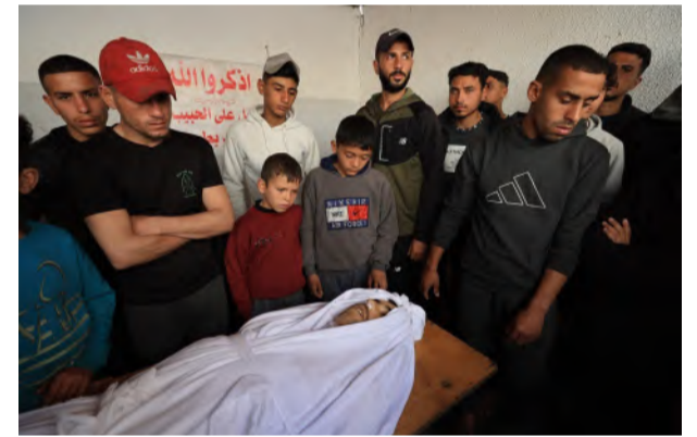
شهيد في غزة أمس الأول