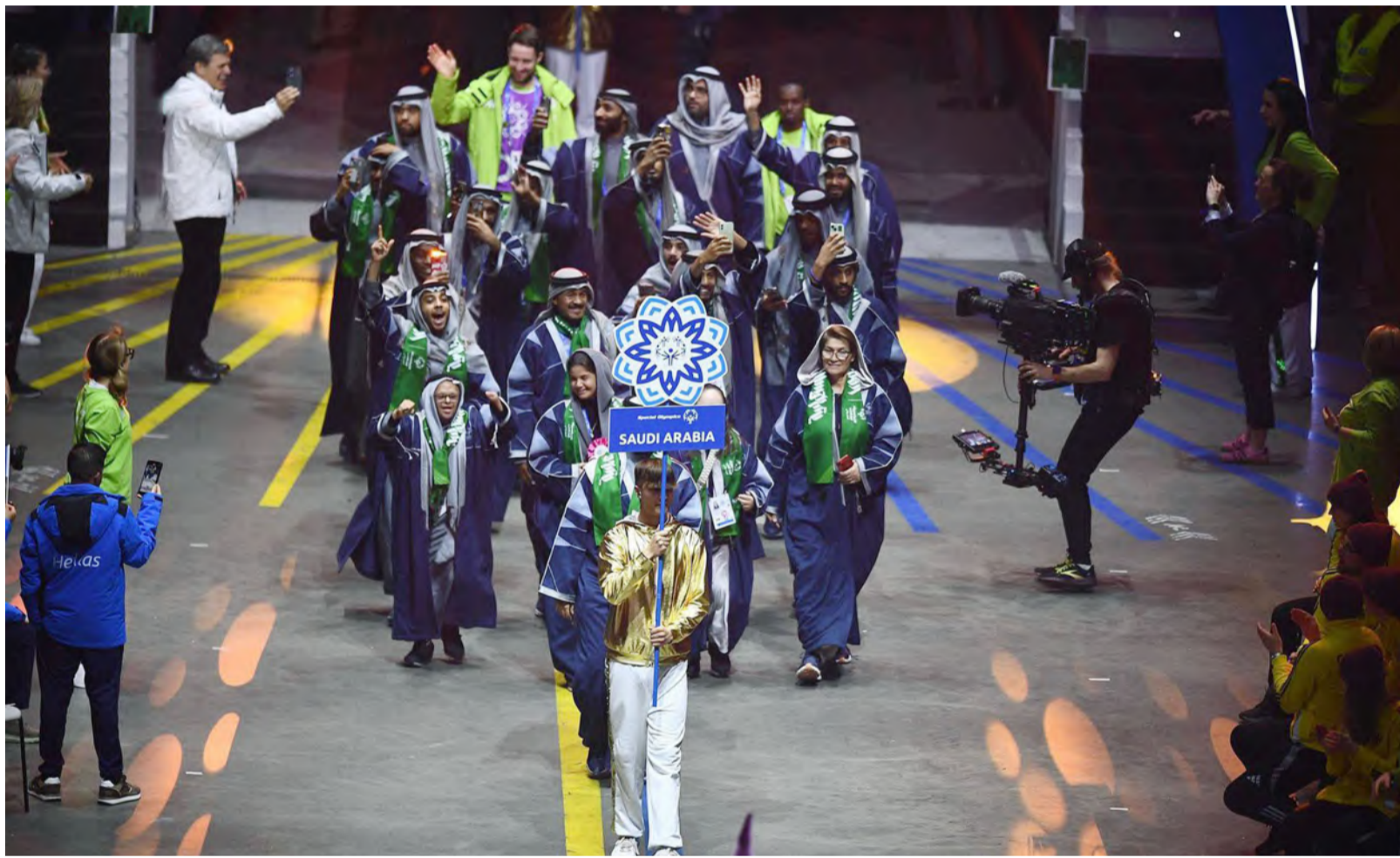
وفد الأولمبياد الخاص السعودي مشاركاً في افتتاح الألعاب العالمية الشتوية في مدينة تورين الإيطالية أمس. (واس)

البلاد - الرياض أكدت وزارة الصحة أن عقوبة كل من يصدر تقريراً طبياً غير صحيح، أو مخالفاً للحقيقة، تصل إلى السجن لمدة سنة، وغرامة مالية تصل إلى 100.000 ريال. وحذرت الوزارة- في إطار دورها الرقابي