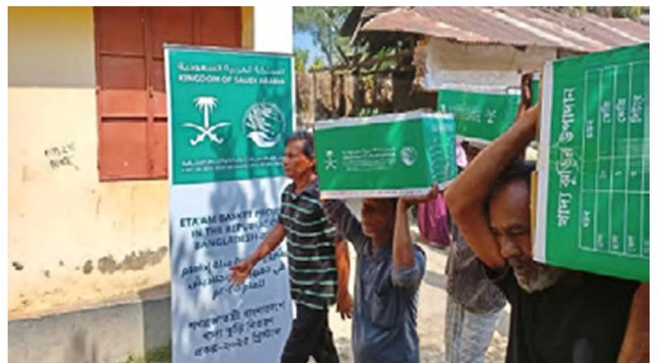
مستفيدون من السلال الغذائية التي وزعها المركز في دكا أمس الأول

البلاد - عواصم وزّع مركز الملك سلمان للإغاثة والأعمال الإنسانية، أمس الأول، 400 سلة غذائية بمنطقة بوغرا في مدينة دكا بجمهورية بنغلاديش، استفاد منها 400 أسرة، ضمن مشروع سلة "إطعام" الرمضاني في جمهورية بنغلاديش الشعبية للعام 1446هـ. ويهدف مشروع "إطعام" بمرحلته الرابعة لتوزيع 390.109 سلال غذائية خلال شهر رمضان، في 27 دولة يستفيد منها 2.304.104 أفراد بتكلفة تتجاوز 67 مليوناً، و64 ألف ريال. كما وزّع المركز 350 سلة غذائية بمنطقة لاونويرات في مدينة دكا بجمهورية بنغلاديش، استفاد منها 350 أسرة، ضمن مشروع سلة "إطعام" الرمضاني في جمهورية بنغلاديش الشعبية للعام 1446هـ. يذكر أن مشروع "إطعام" بمرحلته الرابعة يستهدف توزيع 390.109 سلال غذائية في 27 دولة خلال شهر رمضان، وذلك في إطار منظومة المشاريع الإنسانية والإغاثية المقدمة من المملكة عبر ذراعها الإنساني مركز الملك سلمان للإغاثة؛ لتوفير الأمن الغذائي في العديد من الدول الشقيقة والصديقة حول العالم.