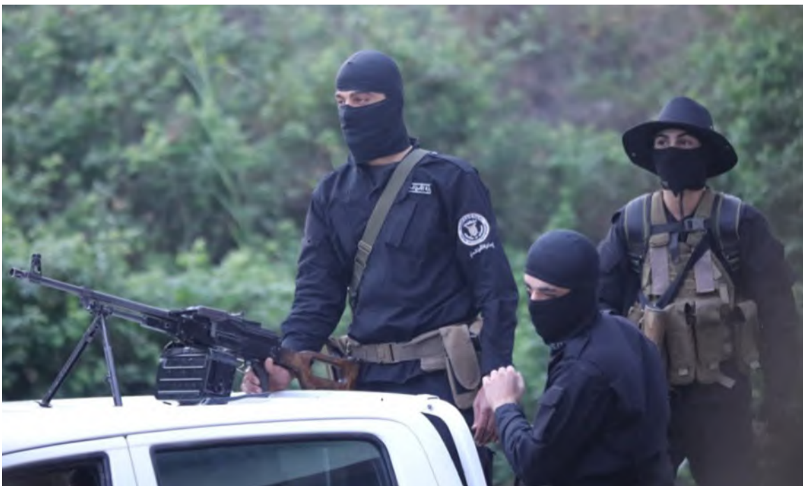
عناصر من الأمن السوري في الساحل

حسب قوله، لكنه شد على أن الأوضاع باتت آمنة بنسبة 90%، وأن القوات الأمنية تتواصل مع وجهاء الساحل لتسليم مسلحين مطلوبين من فلول الأسد ولتجنب المنطقة وقوع حوادث أو اشتباكات. وفي السياق، أشار محافظ اللاذقية محمد عثمان، في مداخلة إعلامية إلى أن "جهات خارجية تكف وراء نشر الفتنة وتجنّد عناصر لهذا الغرض"، ودعا إلى ضبط النفس ونبذ الشحن الطائفي، مؤكدًا أن "هناك من يراهن على الطائفية وإشعال الفتنة".