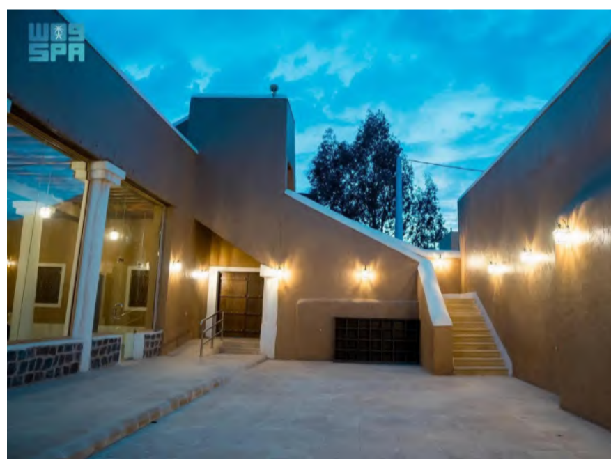
مسجد "فيضة أثقب" ضمن مشروع تجديد المساجد التاريخية

وينطلق المشروع من أربعة أهداف إستراتيجية، تتمثل في تأهيل المساجد التاريخية للعبادة والصلاة، واستعادة الأصالة العمرانية للمساجد التاريخية، وإبراز البعد الحضاري للمملكة العربية السعودية، وتعزيز المكانة الدينية والثقافية للمساجد التاريخية، ويساهم في إبراز البعد الثقافي والحضاري للمملكة، الذي تركز عليه رؤية المملكة 2030 عبر المحافظة على الخصائص العمرانية الأصيلة، والاستفادة منها في تطوير تصميم المساجد الحديثة.