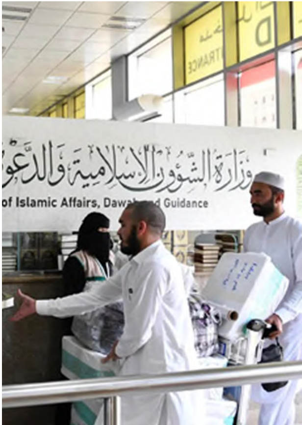
معتمرون يتسلمون نسخاً من المصحف في مطار الملك عبدالعزيز بجدة أمس

بحفاوة الاستقبال والاهتمام الذي لمسوه منذ لحظة وصولهم، والذي يعكس جهود حكومة خادم الحرمين الشريفين الملك سلمان بن عبدالعزيز آل سعود، وسمو ولي عهده الأمين - حفظهما الله - في خدمة الإسلام والمسلمين. كما تُمنوا هذه الهدية القيمة التي أتاحت لهم فرصة الحصول على نسخة من المصحف الشريف بلغاتهم؛ ليكون رفيقاً لهم في رحلتهم المباركة وبعد عودتهم إلى ديارهم، وتجسد هذه الهدية الدور الريادي للمملكة في العناية بالحجاج والمعتمرين، وتسخير كافة الإمكانيات لخدمتهم.