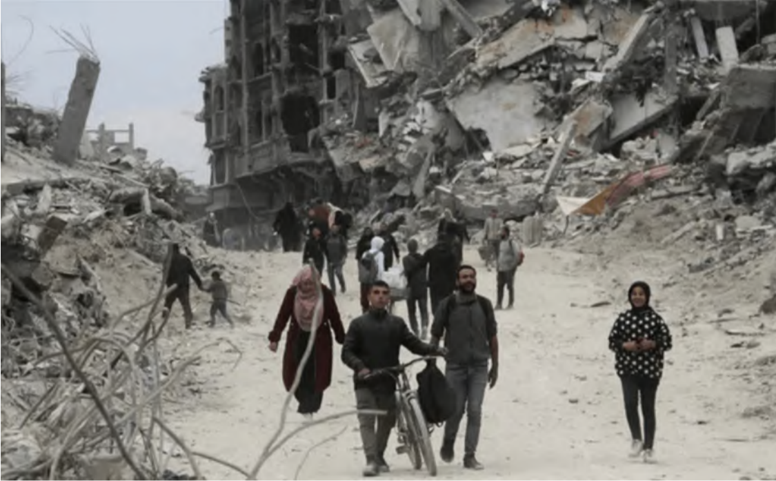
فلسطينيون يتجولون وسط الدمار في غزة

الاحتلال بخيار استئناف الحرب، ما يُرجح إمكانية تمديد المرحلة الأولى وإطلاق عدد محدود من الرهائن، لكن بثمن كبير لحماس، يتيح لها الحفاظ على صورة القوة كما في استعراضاتها خلال مراسم تسليم الرهائن، على أن تُوجَل محادثات التسوية السلمية انتظارًا لإختراق ما أو صفقة كبرى.