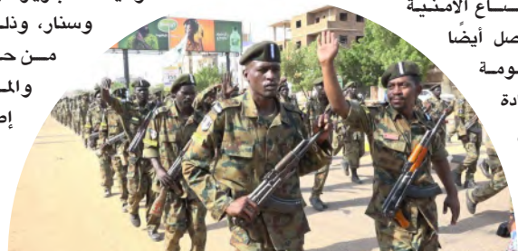
أفراد من الجيش السوداني في الخرطوم مؤخراً

البلاد - الخرطوم ضاعف الجيش السوداني عملياته وسط الخرطوم بالقرب من القصر الجمهوري، وتمكن من السيطرة على مواقع جديدة بالقرب من القيادة العامة للجيش، من بينها رئاسة الشرطة الأمنية وسط الخرطوم، إلى جانب تحقيق تقدم في شارع البلدية. وقالت مصادر إن الجيش يواصل تضيق الخناق على قوات الدعم السريع المتمركزة في مناطق المنشية والرياض وناصر، في إطار سعيه لاستعادة السيطرة على مناطق حيوية داخل العاصمة. وفي ظل الأوضاع الأمنية المتوترة، تتواصل أيضاً جهود الحكومة السودانية لإعادة الشازحين إلى مناطقهم الأصلية، إذ أكد وزير المالية ورئيس