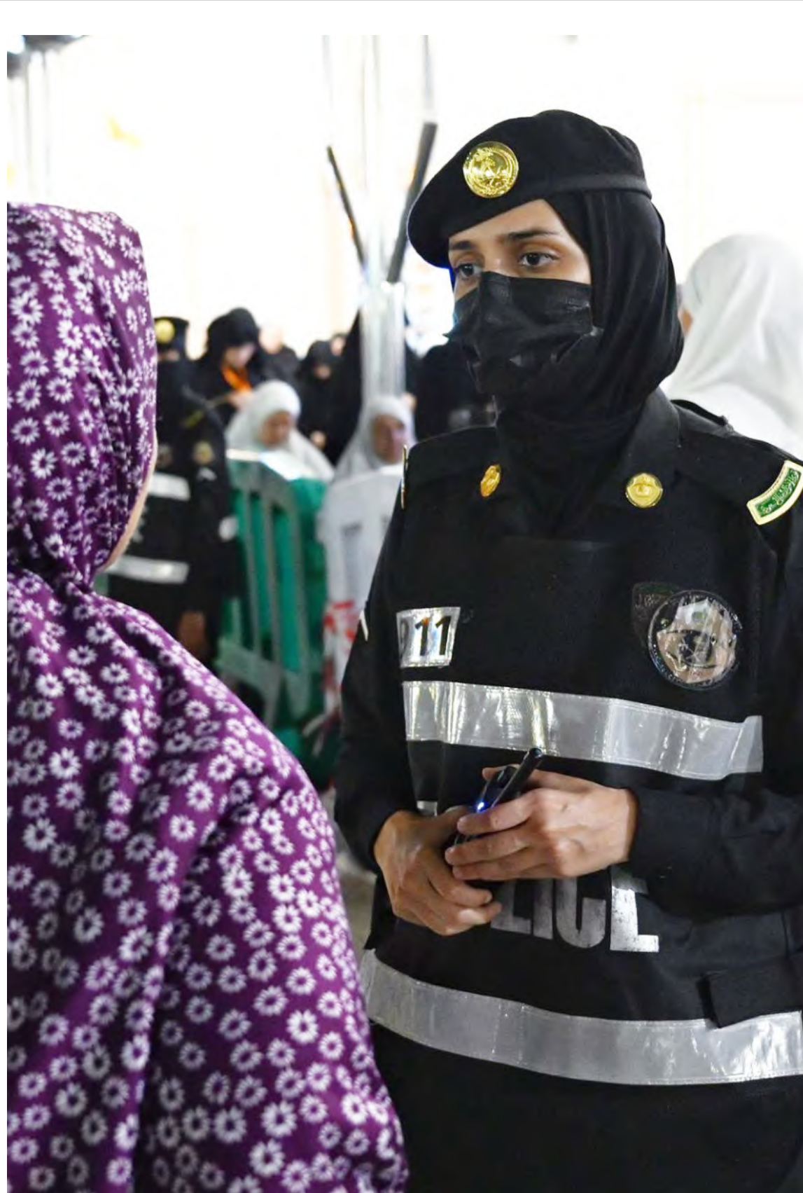
مجندة سعودية ترشد معتمرة في ساحات المسجد الحرام أمس.