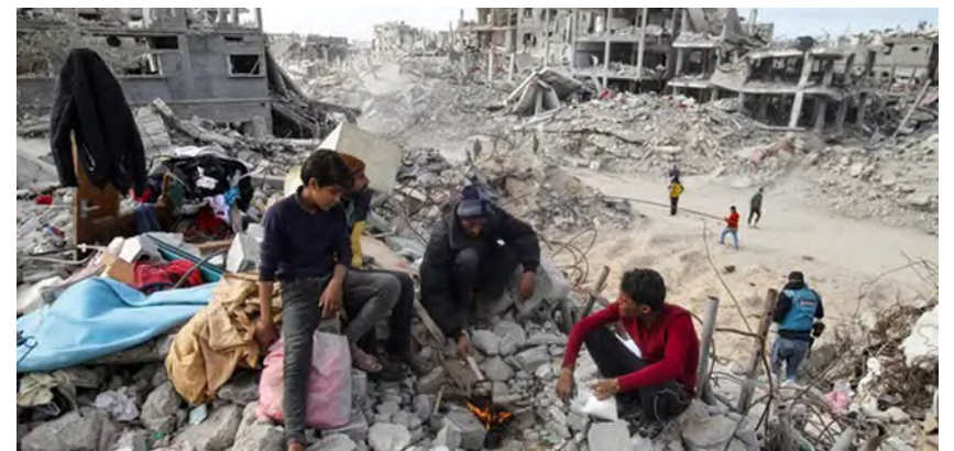
أب وابنه عائدان لمنزلهما بغزة