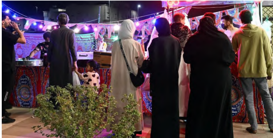
المباسط الشعبية جزء أصيل من التراث

وتشكل ملتقى يجمع أفراد المجتمع في أجواء ودية يتبادلون فيها الأحاديث والتجارب؛ كونها وسيلة للتواصل الاجتماعي بعيداً عن أجواء التقنية الحديثة. وفي الأسميات الرمضانية تنبض المباسط الشعبية، التي