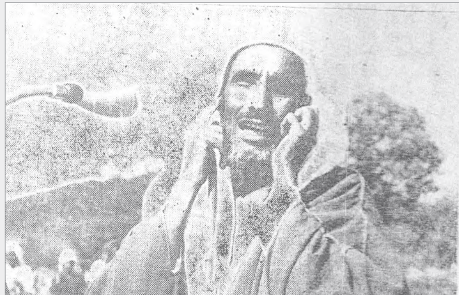
شيخ من بلاد غامد يؤدي دوراً غنائياً شعبياً في إحدى الحفلات التي أقيمت لبعثتنا الصحفية