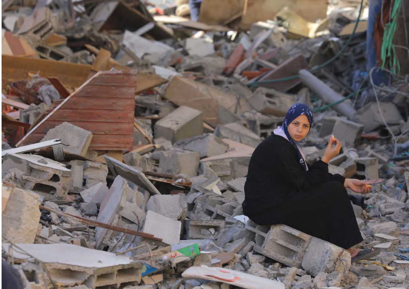
فتاة فلسطينية وسط أنقاض غزة

عن جرائمه وانتهاكاته المستمرة، وإرهاب مستعمره، وإحقاق حقوق الفلسطينيين في تقرير المصير والاستقلال والعودة للاجئين الى درياهم التي شردوا منها، فوراً ودون قيد أو شرط، وتجسيد دولة فلسطين المستقلة بعاصمتها القدس.