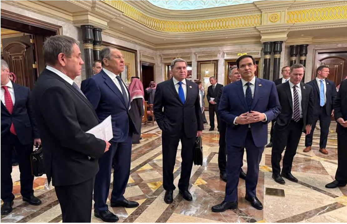
وزيرا خارجية أمريكا وروسيا خلال المباحثات السابقة

بوتين، لمناقشة سبل التسوية السياسية بين روسيا وأوكرانيا. وداومت المملكة على الحياد طوال الحرب الروسية الأوكرانية، حيث امتنعت بوضوح عن الانضمام إلى الغرب في انتقاد روسيا ومعاقبتها، كما حافظت على اتصالات منتظمة مع الرئيس الأوكراني فولوديمير زيلينسكي. بدوره أعلن الرئيس الروسي فلاديمير بوتين في عام 2023 أنه يقدم الامتنان إلى ولي العهد الأمير محمد بن سلمان لمساعدته في تنظيم أكبر عملية تبادل أسرى بين الولايات المتحدة وروسيا منذ الحرب الباردة.