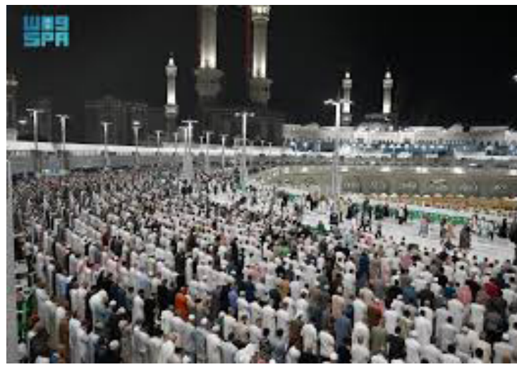
ضيوف الرحمن يؤدون الصلاة في راحة وطمانينة بالمسجد الحرام

وتتيح الخدمة لقاصدي المسجد النبوي معرفة حالة الطاقة الاستيعابية في جميع أنحاء المسجد قبل القدوم للصلاة فيه، والتأكد بشكل لحظي من الطاقة الاستيعابية في الأماكن المخصصة للصلاة في 12 موقعاً داخل المسجد النبوي وفي الحصوات، وفي التوسعات الشرقية والغربية والشمالية، وللنساء في الجهات الشرقية والغربية داخل المسجد، وفي الساحات الشرقية والغربية والشمالية، والساحات الغربية الجديدة، وفي السطح. وتظهر الخدمة المتاحة عبر الرابط: https://eserv.wmn.gov.sa/e-services/prayers_map للمستفيد حالة إشغال المصليات بأربعة ألوان؛ سواء "متاح" أو "شبه مشغول" أو "مشغول" أو "غير متاح"؛ بما يسهم في انسيابية دخول وخروج المصلين في أرجاء المسجد النبوي والساحات، وتفعيل الخطط التشغيلية الميدانية لتنظيم الحشود خلال أوقات الذروة.