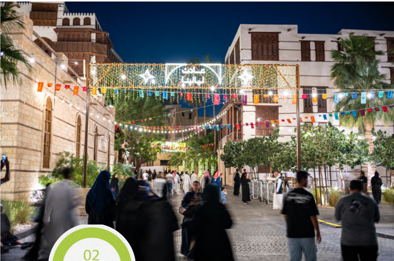
ملاحم عريقة من فعاليات جدة التاريخية

تحتضن منطقة جدة التاريخية فعاليات موسم رمضان 2025 الذي ينظمه برنامج جدة التاريخية التابع لوزارة الثقافة، ويهدف من خلاله إلى إحياء التراث الثقافي وتعزيز الهوية الوطنية عبر أنشطة وفعاليات ثقافية ومجتمعية متنوعة تحمل ملامح رمضان عريقة، وتعكس روحانيات مستمدة من قيمنا وعاداتنا التي اكتسبها المجتمع السعودي وحافظ بها على الموروث الثقافي والاجتماعي رغم التطور المتسارع في كافة مجالات الحياة. يحظى زوار جدة التاريخية بتجربة فريدة تمتد طوال الشهر الكريم، حيث يحتضن موسم رمضان 2025 أنشطة وفعاليات متنوعة تستمر حتى نهايته، موفرة للزوار فرصة استكشاف أجواء رمضان التقليدية وقضاء أوقات مفعمة بالروحانيات ضمن بيئة تراثية غنية بالتاريخ والثقافة، تعزز قيمة منطقة جدة التاريخية كوجهة للزوار في ليالي رمضان، وموقعاً بارزاً ضمن مواقع التراث العالمي لمنظمة اليونسكو. يضم الموسم مجموعة متنوعة من الأنشطة المتميزة التي تنقل الزوار إلى أجواء رمضان الأصيلة، حيث تتاح لهم فرصة التجول في البيوت التاريخية والاستمتاع بجولات استكشافية في المباني التراثية بالمنطقة، إلى جانب الأسواق التقليدية التي تعكس أجواء الماضي بعرض المنتجات المحلية والمأكولات التراثية. كما تتوفر ورش عمل متخصصة لتعليم الحرف التقليدية مثل الخط العربي وصناعة الفخار، مما يسهم في تعزيز الوعي بالحرف اليدوية وإبراز قيمتها الثقافية.