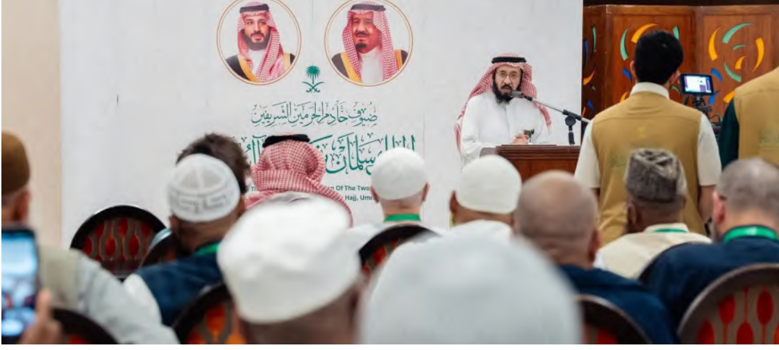
جانب من الاحتفاء بضيوف خادم الحرمين الشريفين

مغادرتهم، مقدماً شكره وتقديره للجهود الكبيرة، التي بذلتها جميع لجان البرنامج. من جهتهم، قدم ممثلو وفود الدول الشكر والامتنان والوفاء للمملكة؛ على كرم الضيافة وحفاوة الاستقبال التي حظوا بها، معبرين عن سعادتهم باختيارهم ضمن المستضيفين لهذا البرنامج المبارك لأداء العمرة في شهر رمضان، مثمّنين الجهود الكبيرة التي قدمت لهم منذ وصولهم إلى المملكة، سائلين الله أن يحفظ قيادة المملكة وشعبها.