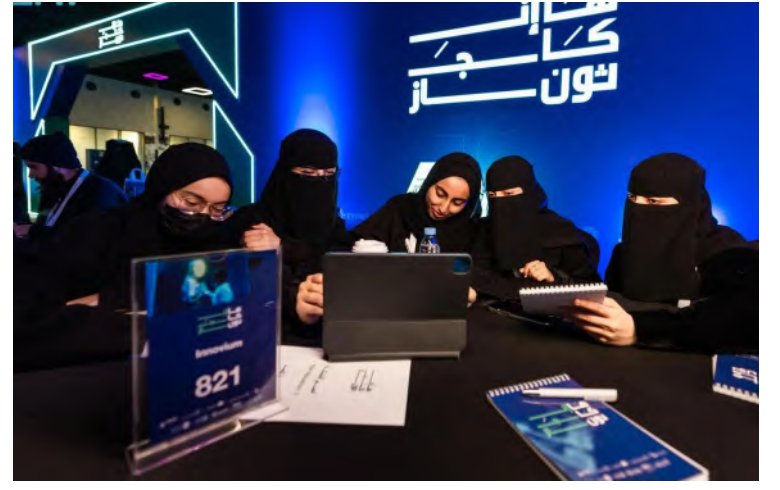
سعوديات يشاركن في برامج سدايا التدريبية وورش العمل المتخصصة في مجال البيانات والذكاء الاصطناعي

استراتيجية الهيئة لدعم تحقيق الأهداف الوطنية لسدايا. وفي الجانب التطويري، قدمت "سدايا" عددًا من البرامج التدريبية وورش العمل المتخصصة، التي تهدف إلى رفع كفاءة المرأة في مجال البيانات والذكاء الاصطناعي، من خلال دورات متقدمة في هذا المجال؛ بهدف إكسابهن المهارات المتطورة وفق أحدث التقنيات والأدوات في المجال، فضلاً عن تعزيز قدراتهن الابتكارية التي كان لها الأثر الفعال في تحقيق مستهدفات الهيئة في العديد من المجالات؛ مثل: حوكمة البيانات وإدارتها، وقيادة إستراتيجية الهيئة، وتحقيق أهدافها المتطلبة في تعزيز التحول الرقمي، وتمكين استخدامات الذكاء الاصطناعي بشكل فعال ومسؤول. وترتكز "سدايا" على دعم المرأة الباحثة في مجال البيانات والذكاء الاصطناعي، من خلال إتاحة الوصول إلى قواعد بيانات ضخمة تُستخدم لتطوير حلول مبتكرة في قطاعات حيوية؛ كالصحة والطاقة والتعليم، ودعمهن في المشاركة بالمبادرات الوطنية والعالية التي تهدف إلى تعزيز