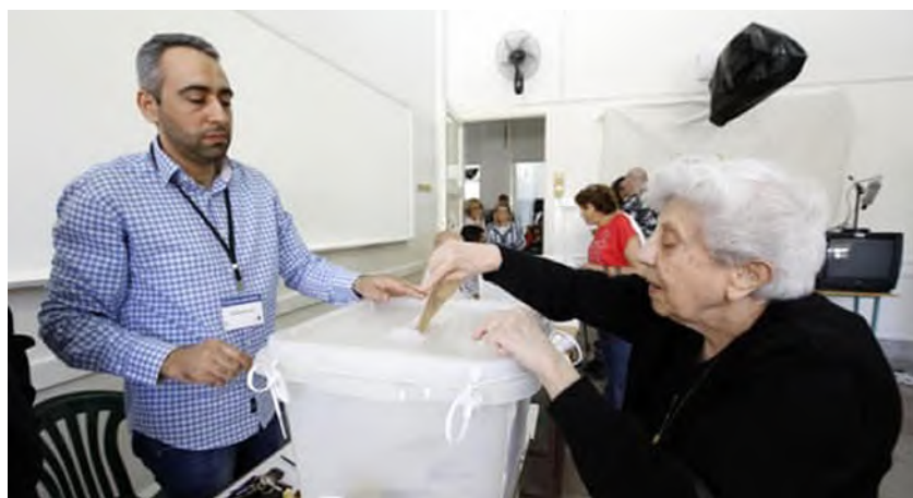
مستة لبنانية تدلي بصوتها في انتخابات سابقة

ترامب سفيراً أميركياً جديداً في لبنان، واعتبر مسعد بولس، كبير مستشاري ترامب للشؤون العربية والشرق الأوسط، أن اختيار ميشال عيسى سفيراً أميركياً في بيروت يظهر مدى أهمية لبنان والجالية اللبنانية- الأمريكية بالنسبة للرئيس ترامب، خاصة في ظل عقيدته الساعية إلى تحقيق السلام في المنطقة". أكد بولس التزام الولايات المتحدة بمراقبة وضمان التنفيذ الكامل لترتيبات وقف إطلاق النار وتطبيق القرار 1701، قائلاً: "من المتوقع أن يكون التزام الحكومة اللبنانية بتنفيذ هذا الاتفاق وجميع قرارات مجلس الأمن ذات الصلة كاملاً، وذلك مع الهدف المشترك المتمثل في نزع سلاح وتفكيك البنية التحتية المالية لحزب الله وجميع الجماعات المسلحة الأخرى". ووصف بولس السفير العيين بأنه "رجل محترم يتمتع بكفاءة عالية في المجال المصرفي وقيادة الأعمال، كما أنه من أشد الداعمين للرئيس ترامب، وسيخدم الولايات المتحدة بشرف وتميز". وتعود جذور عيسى إلى بلدة بسوس في قضاء عاليه، طفولته كانت في بيروت، ثم انتقل إلى باريس ومنها إلى نيويورك، وهو الآن يقيم في فلوريدا. يُشار إلى أن مسعد بولس هو والد مايكل زوج تيفاني ابنة الرئيس الأمريكي، وقد اختاره ترامب في منصب كبير مستشاريه للشؤون العربية والشرق أوسطية.