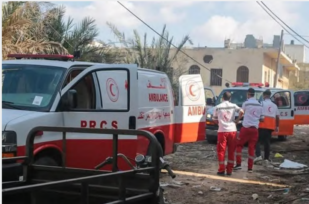
سيارات إسعاف في غزة