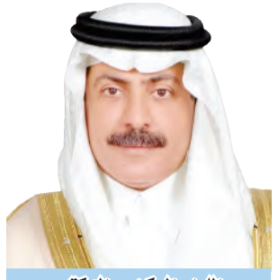
الدكتور نواف بن عبد الله بن تركي آل سعود

والحقيقة الأمثلة كثيرة على إنجازات بلادنا المدشنة وقادتنا في صمت، وكراهيتهم للخطب الرنانة الجوفاء، ويبقى أسدق مثال على هذا: الاتفاق الذي توصلت إليه قيادتنا الرشيدة مع إيران، وفاجأت به العالم كله، حتى الدول (العظمى)، لم يسمع به أحد إلا بعد أن تم كل شيء على أحسن مما يرام،