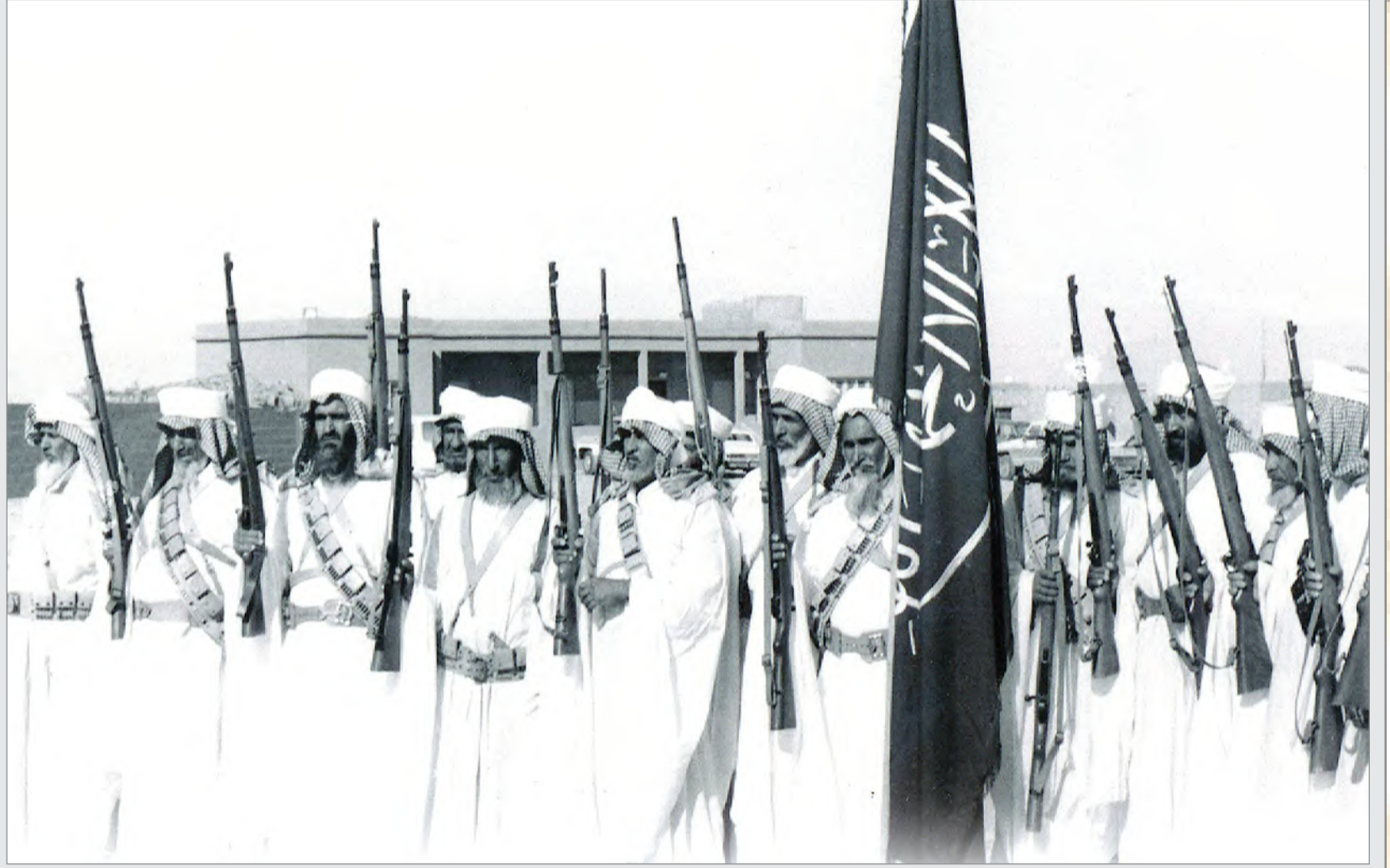
الحرس الوطني السعودي