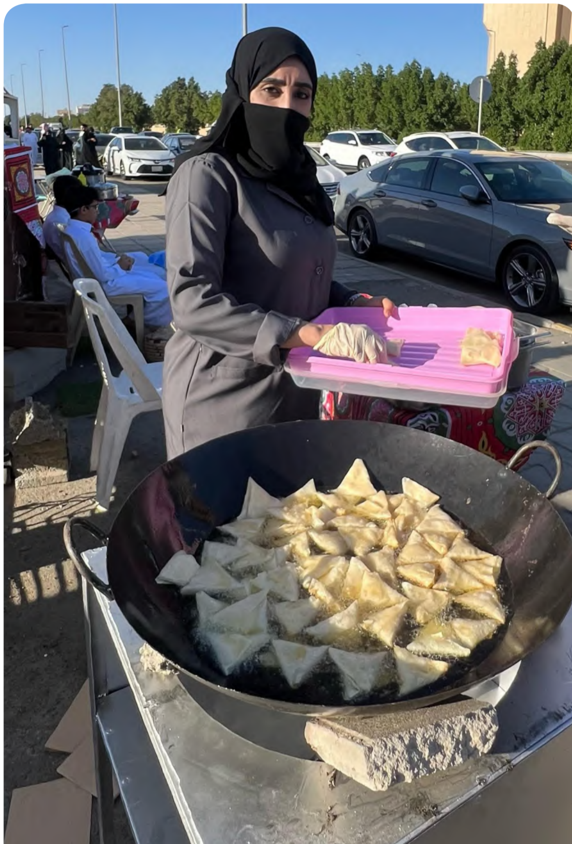
سيدة تقوم بإعداد السمبوسة لبيعها على إحدى البسطات الرمضانية في جدة أمس.