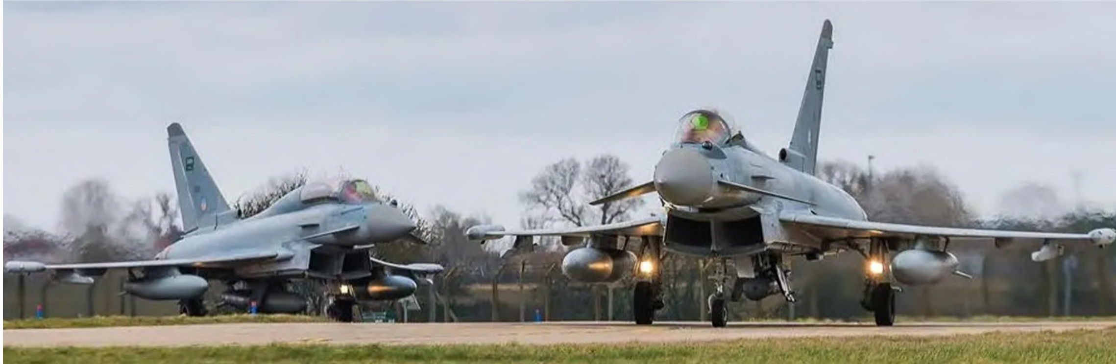
القوات الجوية الملكية السعودية، خلال مشاركتها في مناورات تمرين "محارب الكوبرا" بالمملكة المتحدة.