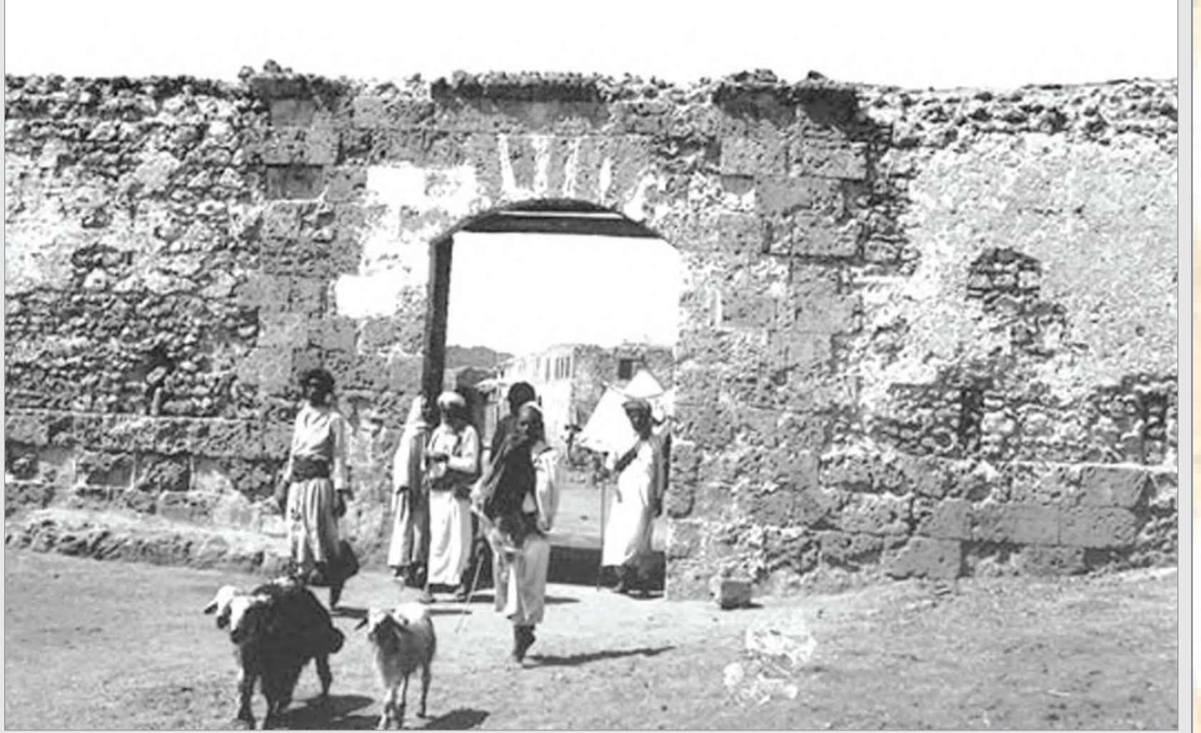
البوابة - من مدينة الوجه