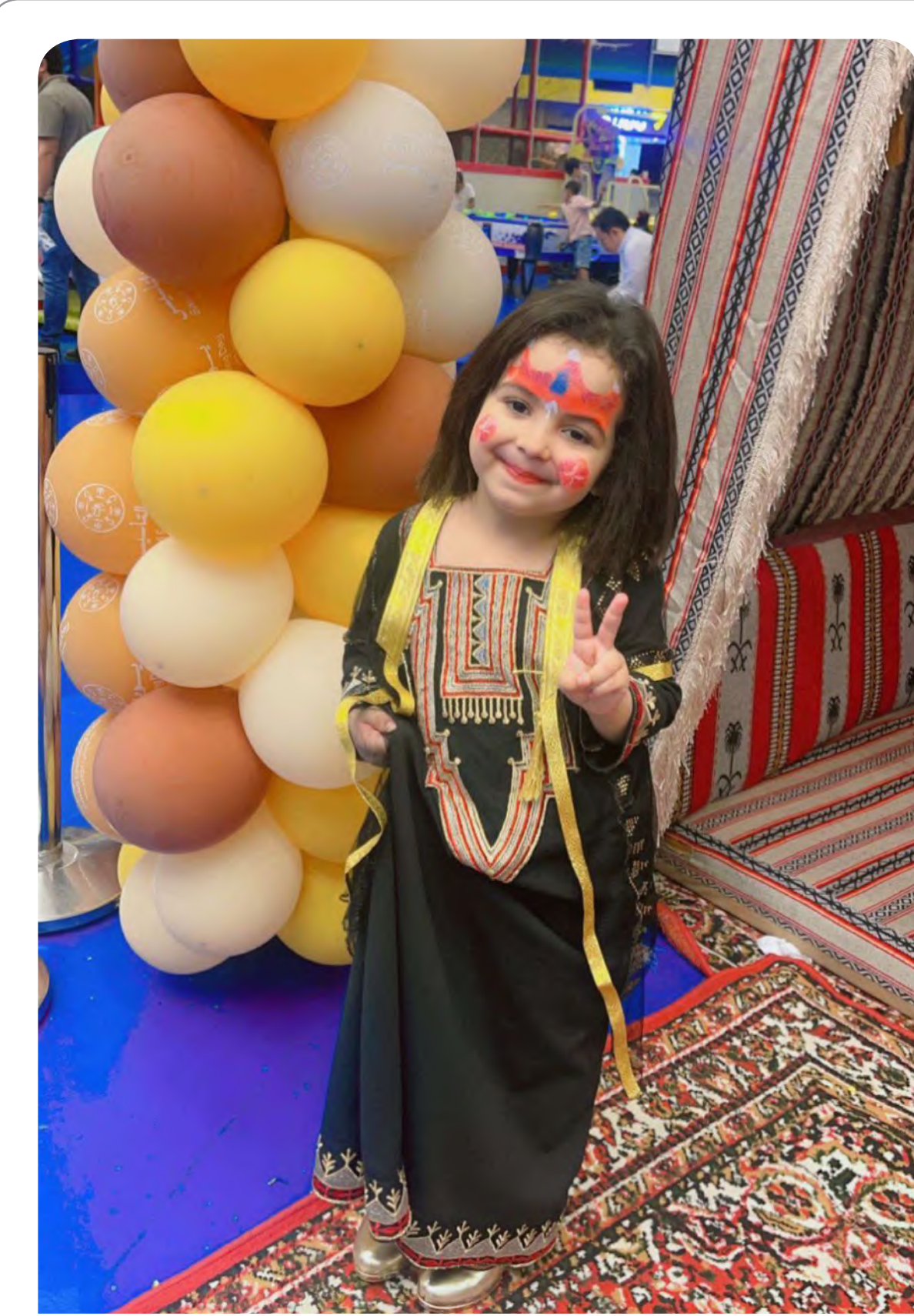
طفلة ترتدي الزي التراثي خلال الاحتفالات بيوم التأسيس.

يذكر أن الشواطئ الأسترالية تعج بأعداد كبيرة من أسماك القرش المعروف بعدوانيتها.