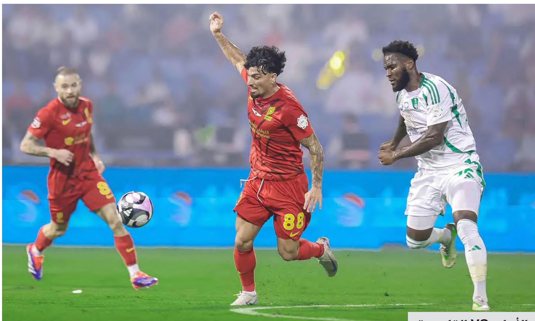
الأهلي VS القادسية

تواصل اليوم منافسات الجولة الـ 22 من دوري روشن السعودي للمحترفين بأربع مباريات؛ حيث يحل فريق الشباب ضيفاً على الرائد في الـ 5:10 مساءً، ويستقبل الهلال ضيفه الخلود في الـ 6:30 مساءً، ويحل النصر ضيفاً على الوحدة في الـ 7 مساءً، ثم يستقبل الأهلي نظيره القادسية في الـ 8:30 مساءً.