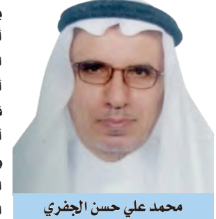
محمد علي حسن الجزائري

منذ فجر التاريخ، لم يصف شاعر من شعراء العرب نقيق الضفادع، كما وصفه الشاعر العراقي الكبير محمد مهدي الجواهري حين يقول: سسلام على