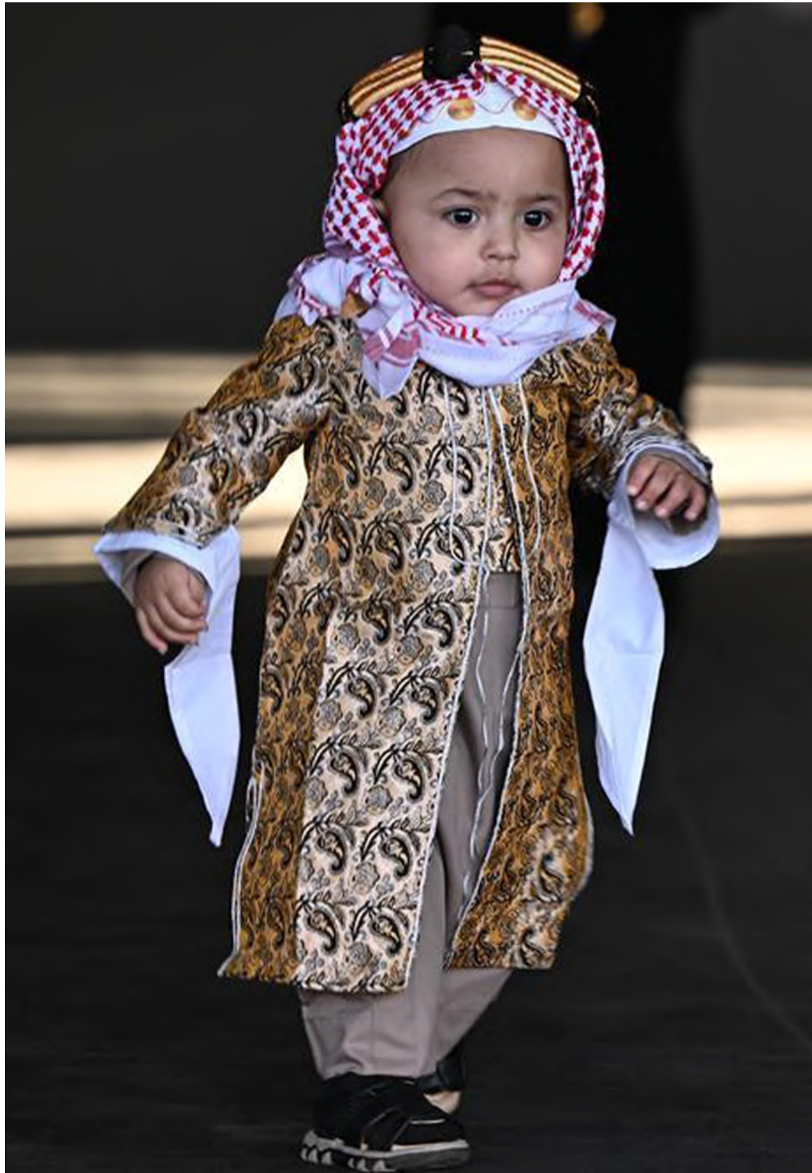
طفل يرتدي زيًا تراثيًا في فعاليات قرية "ذاكرة الوطن"، احتفاءً بيوم التأسيس أسس في تبوك.