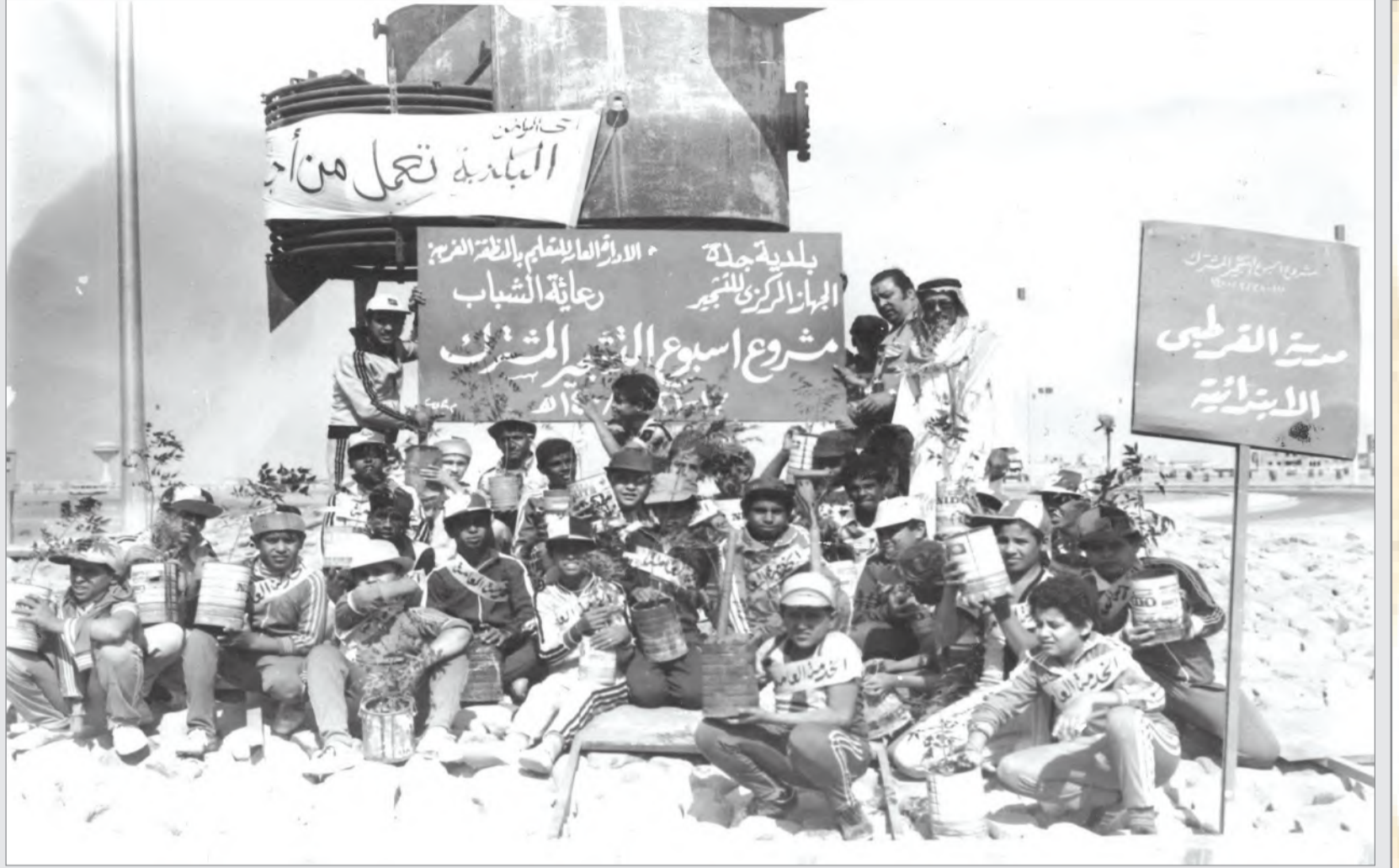
الاهتمام بحملة تشجير واسعة النطاق والاحتفال بأسبوع الشجرة