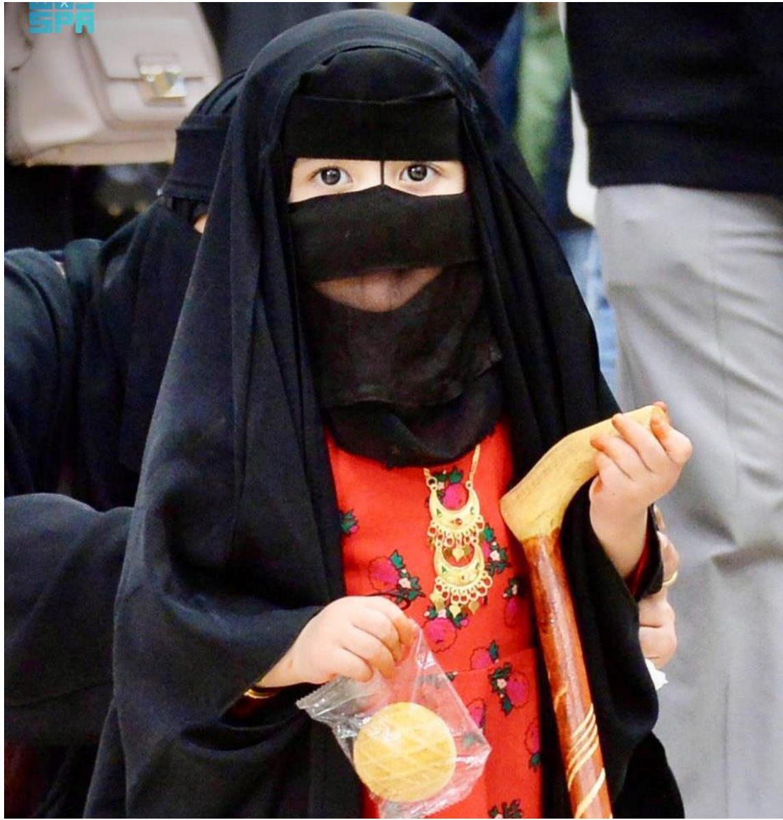
بائعة في مهرجان الكليجا، الذي أسدل الستار على فعالياته أمس في بريدة، بحضور نحو نصف مليون زائر؛ حيث تعد الكليجا طبقاً رئيسياً شعبياً بمنطقة القصيم، وباتت الفعالية محط أنظار السياح في كل عام.