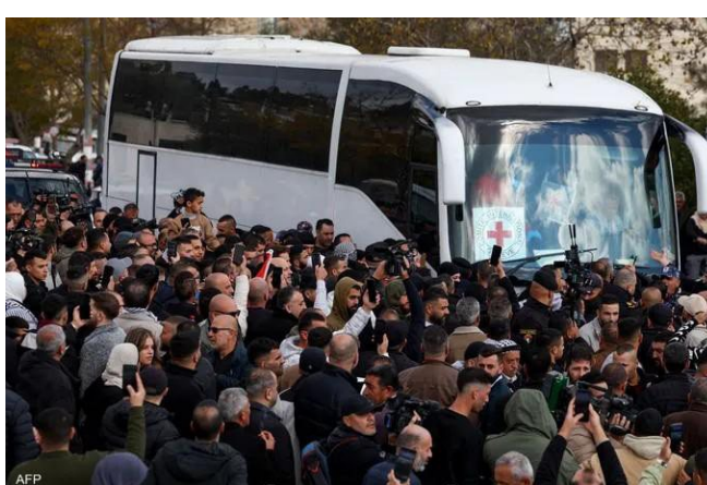
إفراجة والإعلان عن عمليتي التبادل الخميس والسبت.

تأتي هذه التصريحات فيما دخلت بعض الآليات والبيوت المتنقلة إلى القطاع الدمري، عبر معبر رفح، بعد انتظار دام أيام، وسط معارضة ومماطلة إسرائيلية. ونجحت جهود الوساطة في تذليل العقبات وإدخال بعض الآليات الثقيلة والبيوت المتنقلة إلى القطاع الدمري، عبر معبر رفح، بعد انتظار دام أيام، ومعارضة ومماطلة إسرائيلية، ما ساهم في