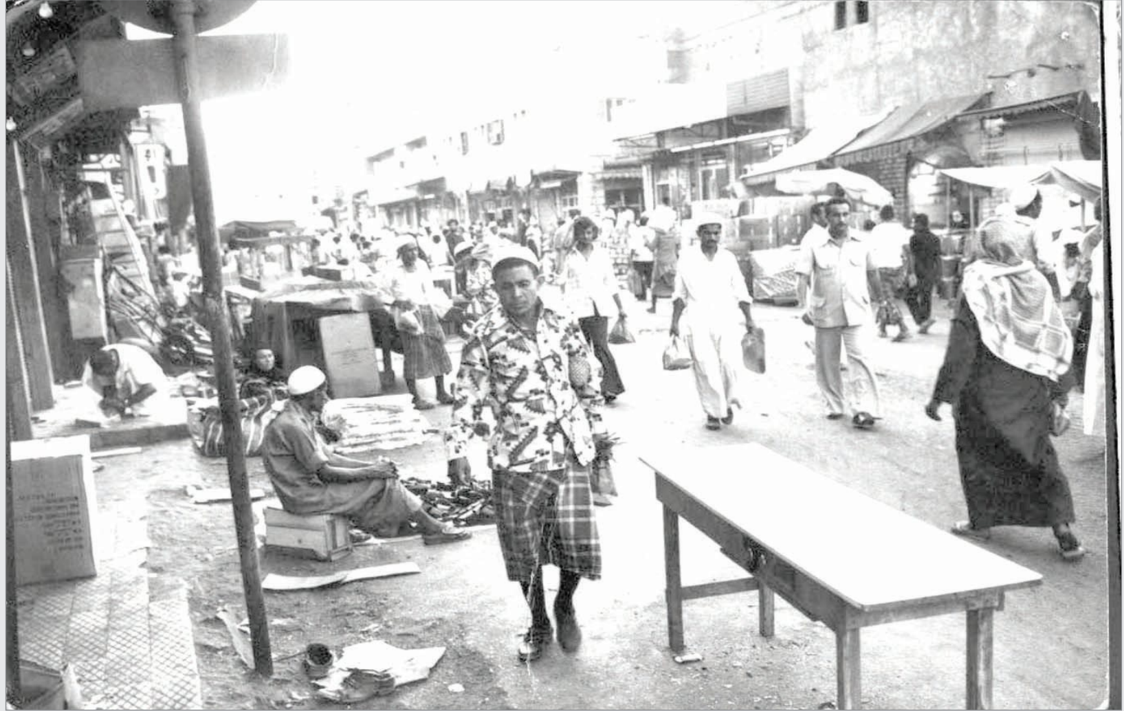
بعض اسواق مدن المملكة قديماً - سوق باب شريف