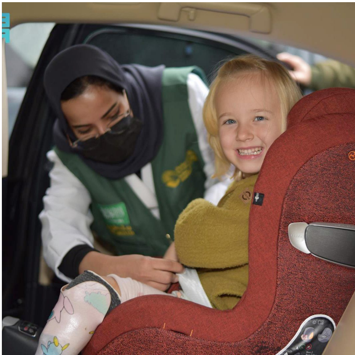
طفلة أوكرائية دخلت على كرسي متحرك مركز الأطراف الصناعية التابع لمركز الملك سلمان للإغاثة والأعمال الإنسانية في بولندا، وساعدها الفريق المختص في الوقوف على رجليها مرة أخرى عبر عملية زراعة أطراف صناعية.