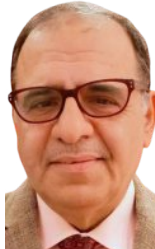
د. صالح هاشم الشحري @SalehElshehry

الخطر النسبي لحدوث سرطان الثدي عند من يتعاطين موانع الحمل الهرمونية، أو تعاطيه مؤخراً يساوي ١,٢، مقارنة بمن لم يسبق لهن تعاطيه، وهذه النسبة تتراوح بين أقل من ١,١ عند من تعاطينه مدة أقل من سنة إلى ١,٤ عند من تعاطينه بشكل مستمر لمدة تزيد على عشر سنوات. ولتبسيط المسألة، نوضح أننا لو قارنا بين مجموعتين من النساء، الأولى فيها مائة ألف امرأة في سن الحمل لم يسبق لأي منهن أن تعاطت موانع الحمل ثنائية الهرمون، والثانية مكونة من مائة ألف امرأة في سن الحمل كلهن يتعاطين موانع الحمل ثنائية الهرمون، وجدنا أن خمسين حالة سرطان الثدي قد حصلت في المجموعة الأولى، فإنا سنجد ستين حالة في المجموعة الثانية. وهذا الفرق طفيف جداً، ولا يحتاج إلى أكثر من الانتباه إلى مواعيد الفحوص الاستقصائية لسرطان الثدي، وابتدائها عند سن الأربعين لا بعدها، علماً بأن أخذ موانع الحمل ثنائية الهرمون بين حمل وآخر، ومن ثم التحول إلى موانع الحمل طويلة المفعول عند اكتمال الأسرة، هو أفضل طريقة للحصول على الفوائد وتفادي المشكلات.