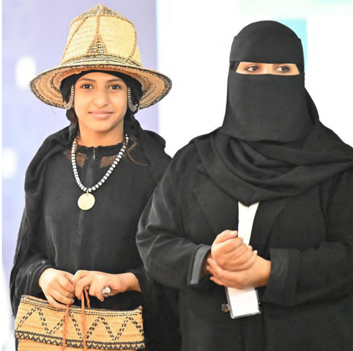
زائرتان لمهرجان جازان للعسل المقام في ساحة المركز الحضاري بمحافظة العيادي بمشاركة 60 نحلاً؛ يعرضون أكثر من 15 نوعاً من العسل السائل عالي الجودة، وعسل الشمع الذي تتميز به المنطقة، إلى جانب عروض منتجات النحل الأخرى.