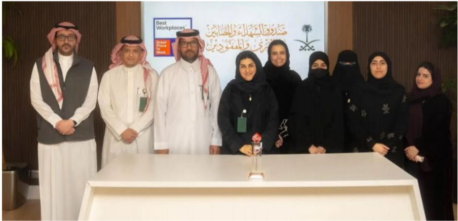
في استقبال كفاءات متميزة، وعمل على حوكمة الإجراءات، وإصدار عدد من سياسات العمل، الأمر الذي أسهم في تهيئة بيئة متميزة ومحفزة لمزيد من الإنجازات والتحديات.

وشاملة، تلبية معايير عالمية، وتركز على تقييم ثقافة المؤسسات من خلال مزيج من استطلاعات آراء الموظفين (مؤشر الثقة)، وتحليل سياسات الجهة (مراجعة الثقافة التنظيمية)، عبر معايير تركز على الثقة في القيادة، ورفاهية الموظفين، والتنمية المهنية، والشمول والتنوع، والتكيف مع المستقبل.