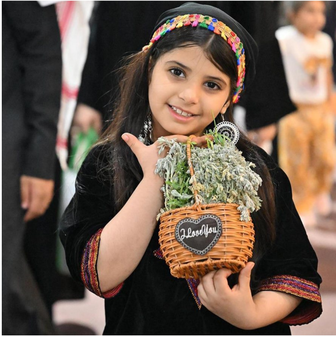
طفلة مشاركة في فعاليات "مهرجان عسل جازان" في نسخته العاشرة، التي تقدم خلالها تجربة فريدة للأطفال، في رحلة عبر خيمة العسل؛ لاستكشاف عالم النحل وتربيته وفهم أهميته في البيئة.