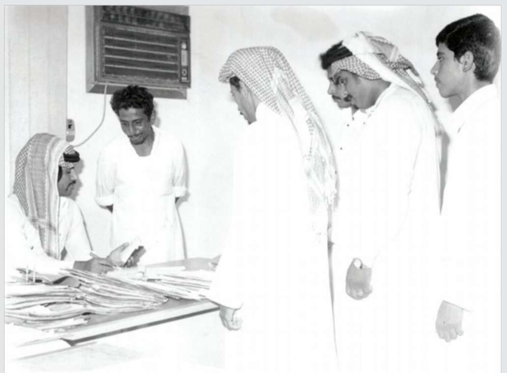
مراجعون أمام موظف في الخدمة المدنية