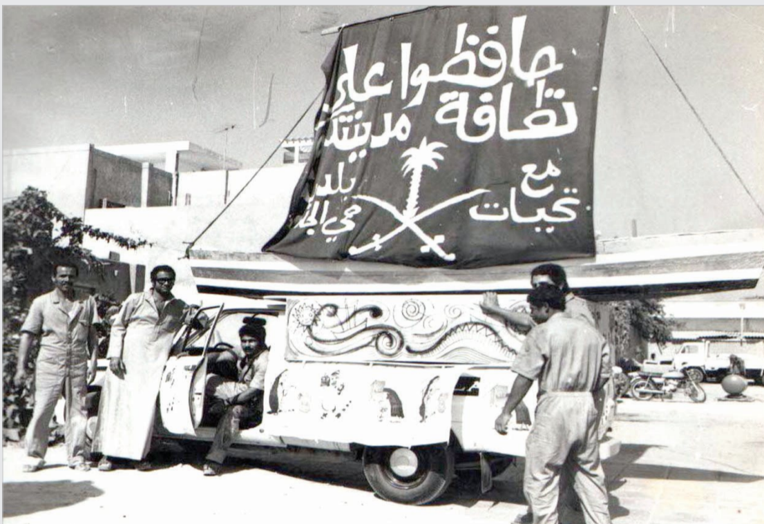
حملة للاهتمام بالنظافة وتشجير المدن