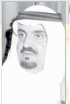
مشعل بن عبدالعزيز

الضيوف عند مدخل السفارة. وبعد ان اكتمل عقد المدعوين اديرت كؤوس المرطبات ثم توجهوا الى موائد الطعام.. وبعد ان اكلوا وشربوا هنيئاً مريئاً انصرفوا مودعين سعادة السفير مقدمين صادق تهنيتهم وتمنياتهم الى البلد العربي الشقيق في يومه الوطني متمنين للشعب التونسي اضطراد التقدم والازدهار.