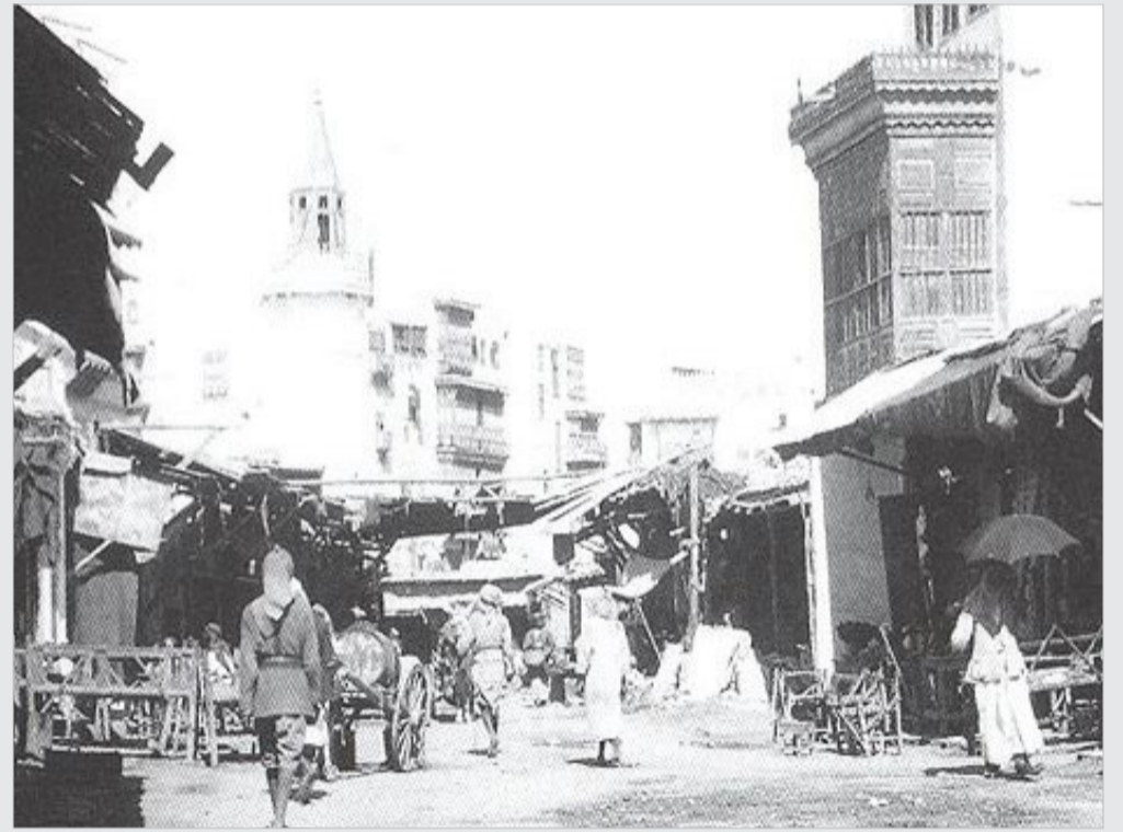
من أسواق جدة ١٣٣٦ هـ الموافق ١٩١٧ م