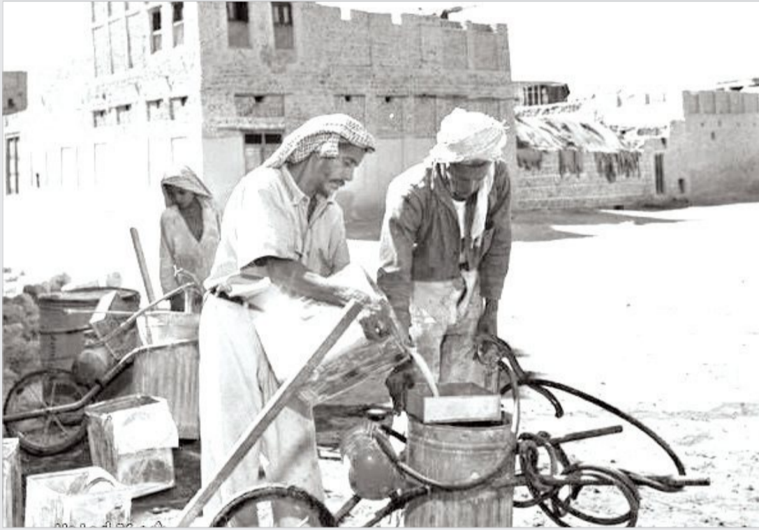
رش المبيدات لمكافحة البعوض المسبب لمرض الملاريا