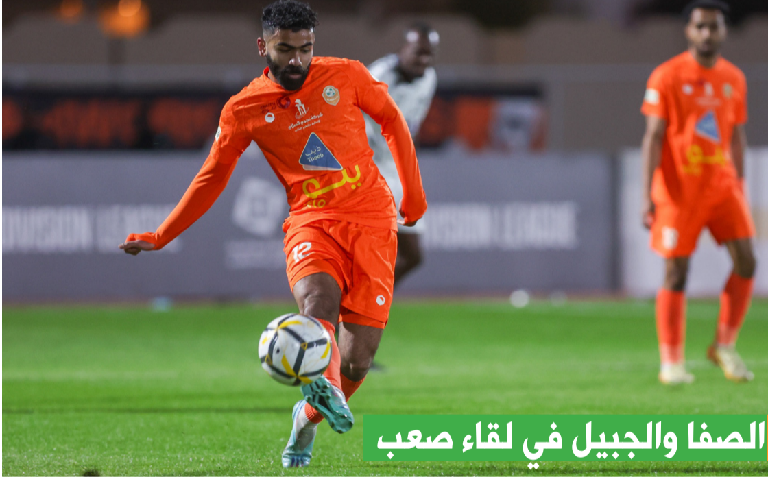
الصفا والجبيل في لقاء صعب

على ملعبه بالحفر، يواجه الباطن الـ 14 بـ 20 نقطة نظيره العين الـ 16 بـ 16 نقطة. يطمح المضيف لتحقيق الفوز على ملعبه وأمام جماهيره للإبقاء على حظوظه والابتعاد عن حسابات الهبوط، فيما سيخوض العين مهمة صعبة أمام منافسه، ويأمل تعزيز موقعه في سلم الترتيب. لقاء الذهاب بين الطرفين انتهى بالتعادل الإيجابي بهدف لهدف.