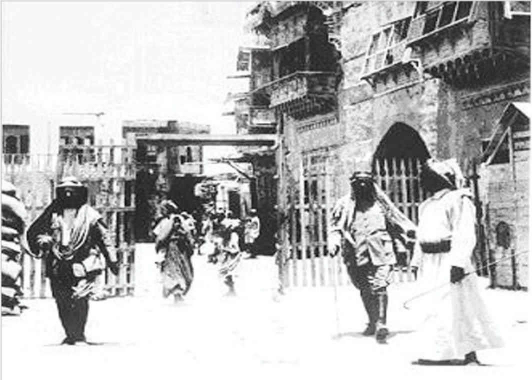
مدينة ينبع - باب الجمارك