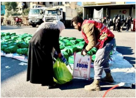
مركز الملك سلمان يواصل مساعداته الإغاثية للشعب السوري