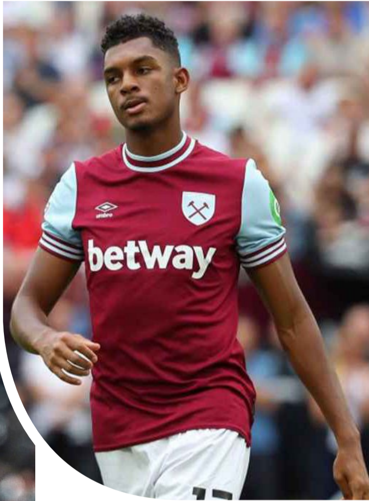
المنتخب الأولمبي لراقصي السامبا، ويلعب في خانة الجناح التي ينوي الهلال تدعيمها. ووفقاً للوائح الاتحاد السعودي لكرة القدم يحق لفرق دوري