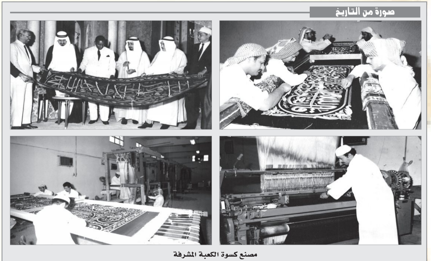
مصنع كسوة الكعبة المشرفة