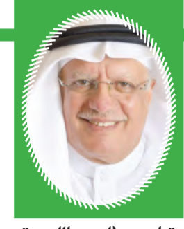
قراءة: صالح عبدالله بوقربي

أنفض عني أطراف الرداء أخشى السقوط في دوائر الغبار فلم يبق مني سوى الموت والحطام والدمار