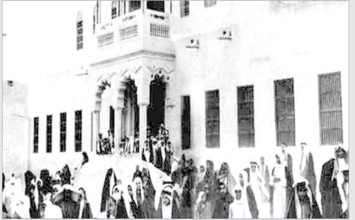
التعليم في المنطقة الشرقية