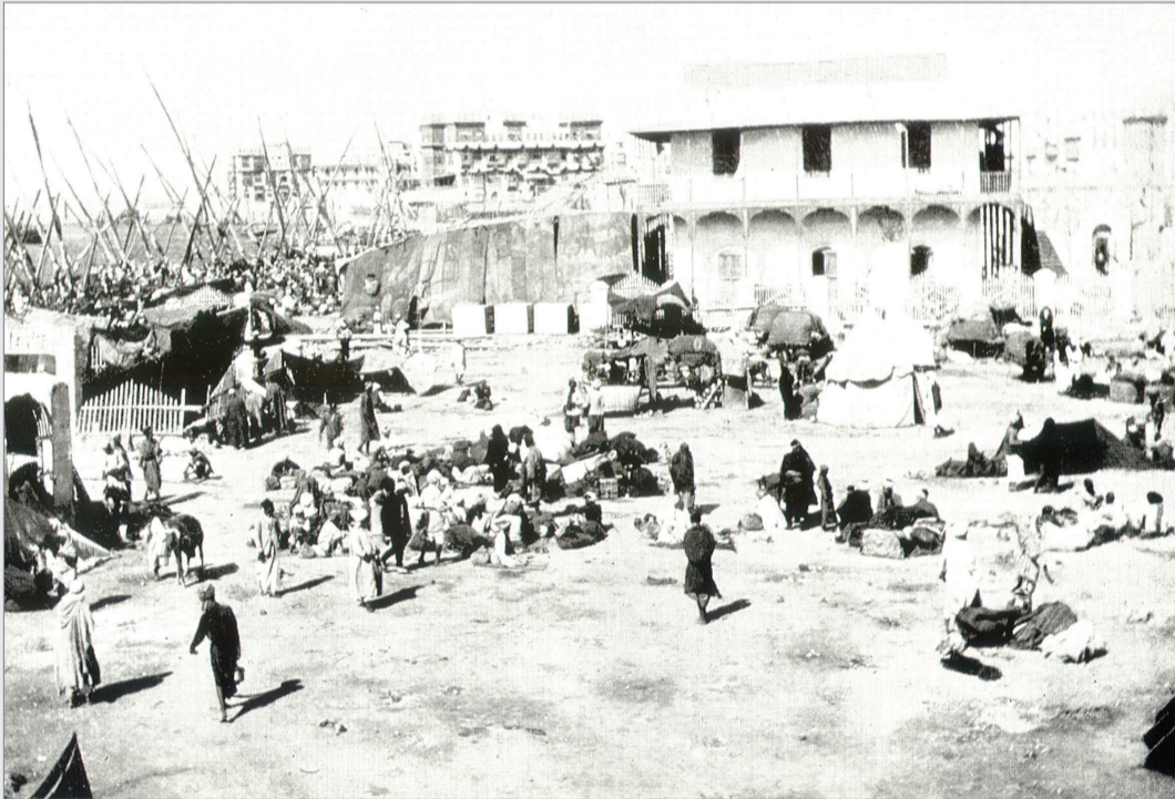
مرقا جدة ويبدو المبنى الرئيسي للمرفأ وفي اليسار سواري السناييك