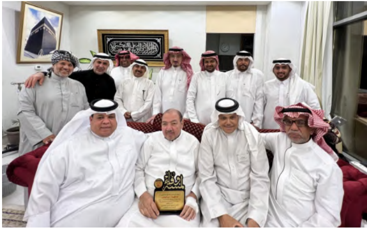
يمن الله عليه بالصحة والعافية وألبسه الله لباس الصحة والعافية الدائمة. وثمن العباسي زيارة المجموعة وقال إنها غير مستغربة وتتم عن المحبة والوفاء، ودعا لهم بخير الجزاء والثوبة من الله على زيارتهم الميمونة.