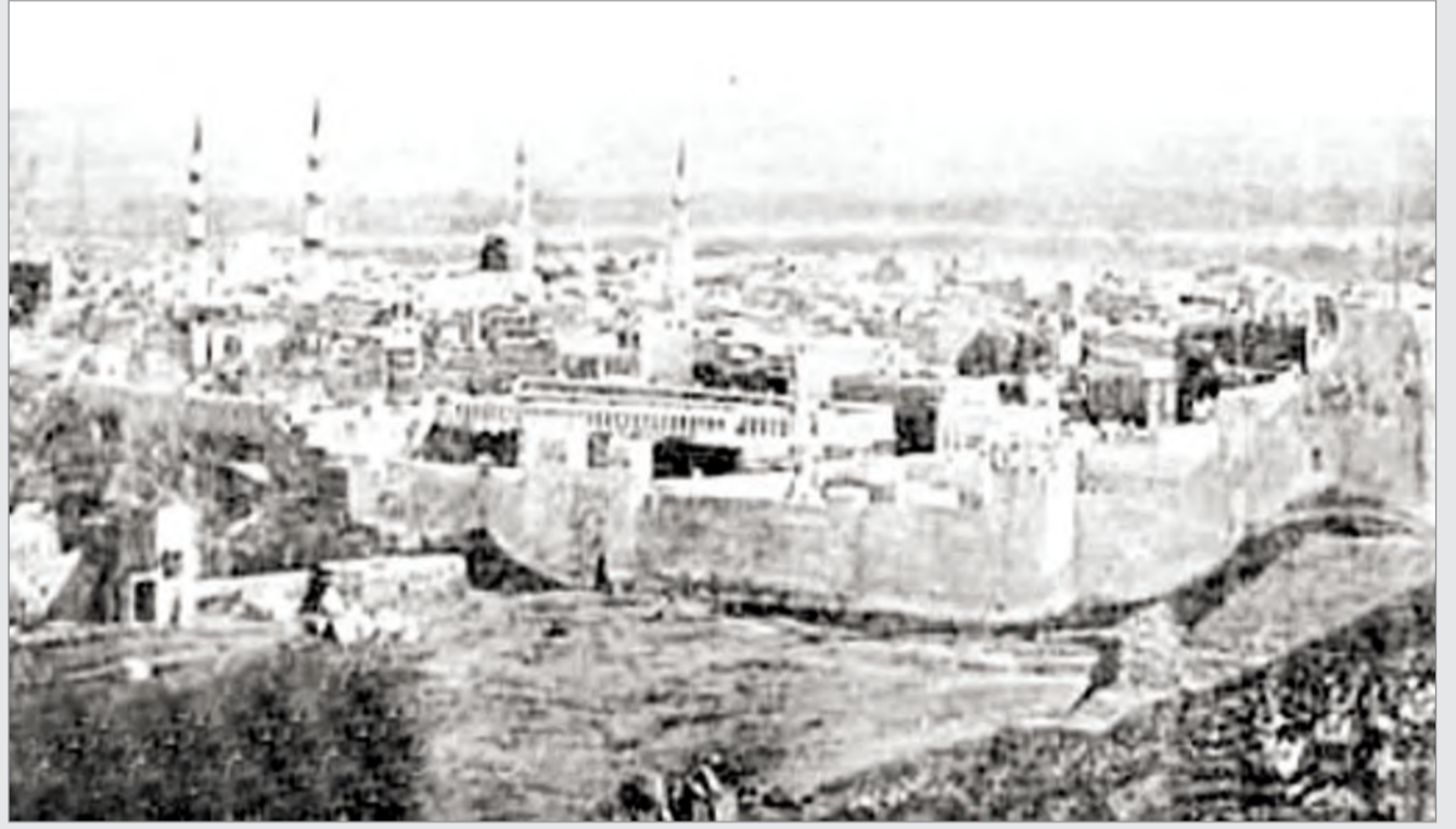
سور المدينة المنورة الخارجي