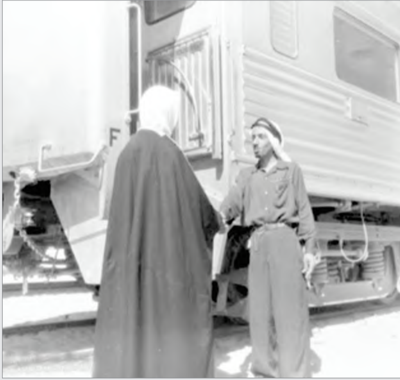
عامل في فحص تذاكر الركاب قبل الصعود للقطار