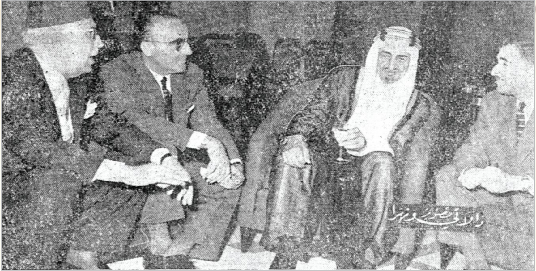
حضرة صاحب السمو الملكي الامير فيصل يتوسط رشيد كرامي والوزير نقلا