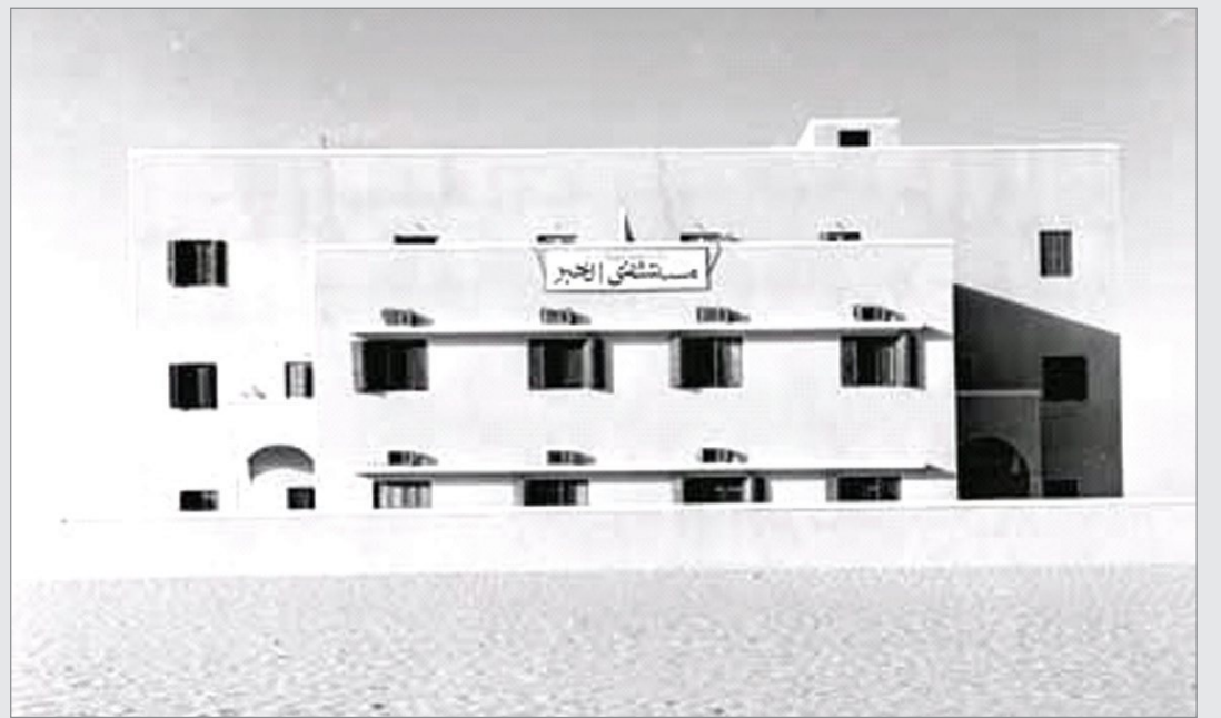
مستشفى الخير العام عام ١٣٧٦ هـ