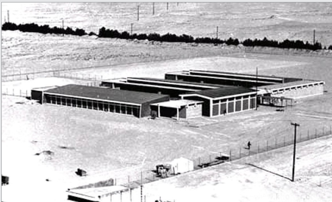
مدرسة البنات البنات عام ١٣٨٤ هـ