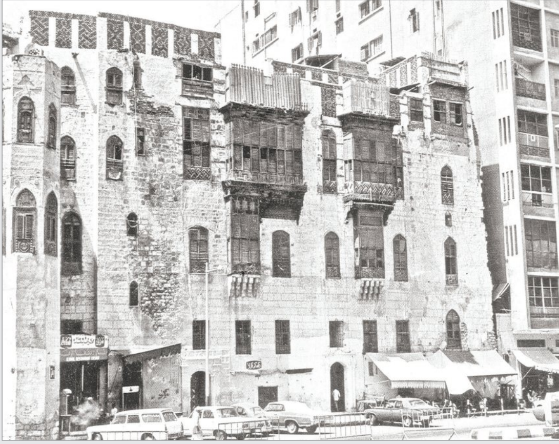
الطرز القديم لمباني مكة المكرمة ..