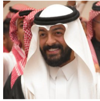
وإكمال نصف دينه. وشكرت أسرة بن طالب ومفرح كل من حضر وشرفهم حفل الزواج، داعين الله عز وجل أن يوفق العروسين في حياتهما الزوجية.