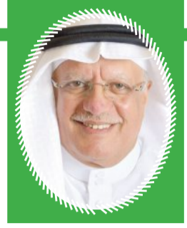
قراءة: صالح عبدالله بوقري