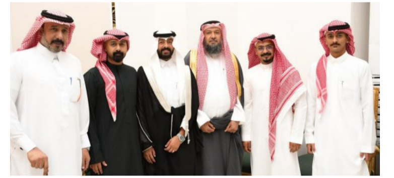
والأهل والأقارب والأحباب، الذين شرفوا حفل الزفاف، مقدمين التهاني والتبريكات للعرائس. وعبر العريس حمد عن فرحته الغامرة بدخول القصر الذهبي وتوديع حياة العزوبية