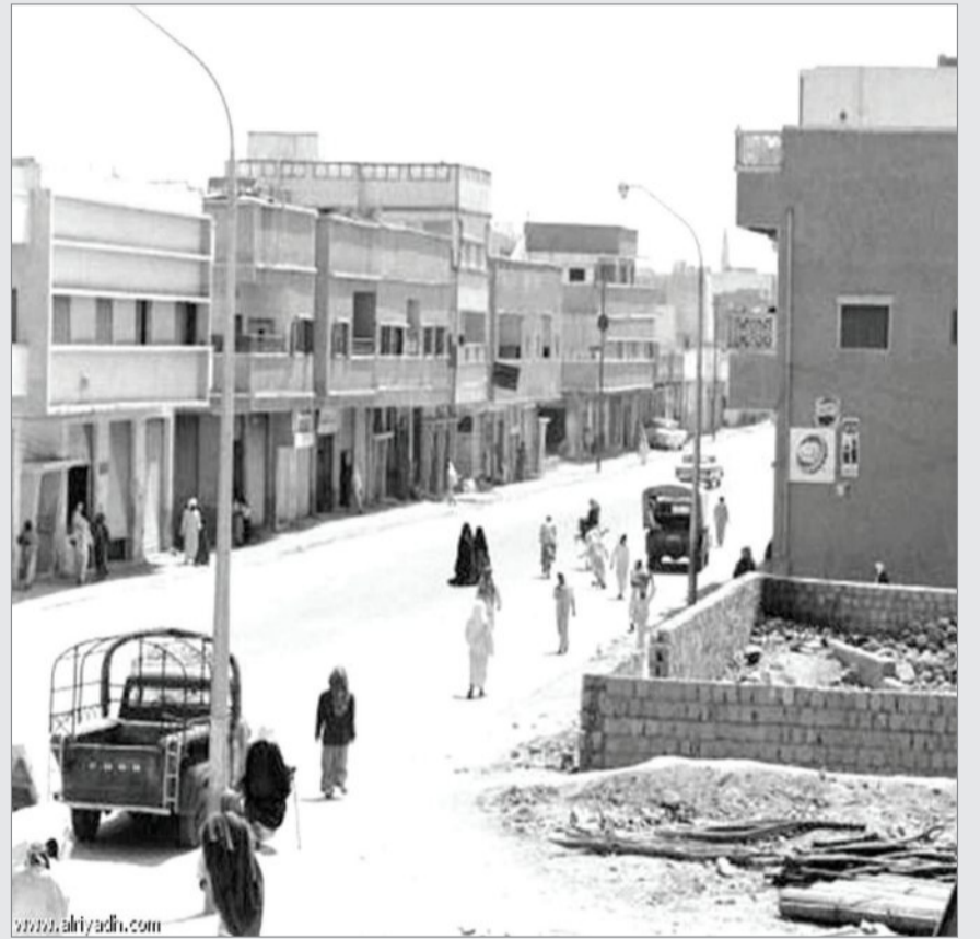
بداية النهضة المعمارية والبناء المسلح في مدينة الرياض وظهور البلكونات والنظم المعمارية الحديثة